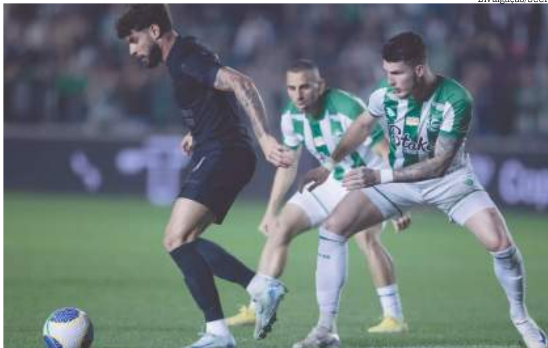
Juventude tem a vantagem por ter vencido o primeiro jogo por 2 a 1