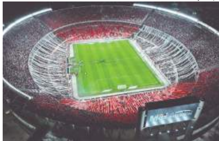
Estádio do River Plate-ARG é o principal candidato a receber a decisão

“Se faz necessário, portanto, implementar um comando unificado com o objetivo de garantir as condições de segurança adequadas para a final da Copa Libertadores, que acontecerá na cidade autônoma de Buenos Aires, na cidade de La Plata ou na cidade de Avellaneda, províncias de Buenos Aires em 30 de novembro de 2024”, diz o Boletim Oficial do governo.