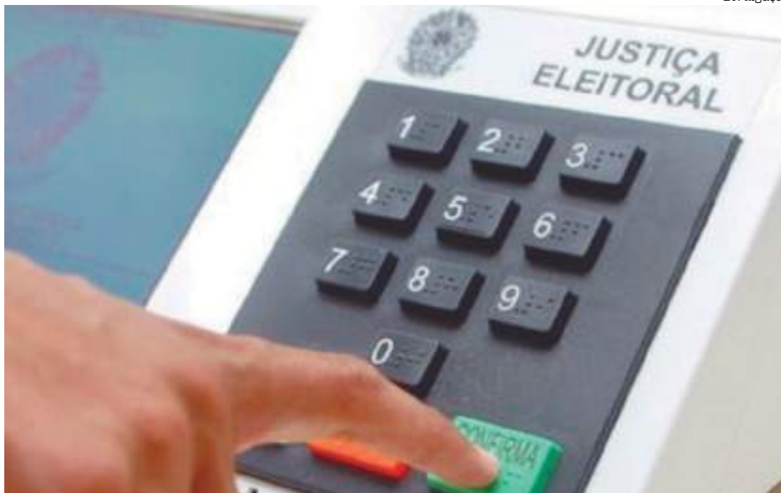
Homens também são os que mais recebem recursos dos fundos eleitoral e partidário

A título de comparação, o Censo de 2022 mostra que pardos são 45,3% da população brasileira; pretos são 10,2% e brancos, 43,5%. Em relação a gênero, enquanto as mulheres são minoria na