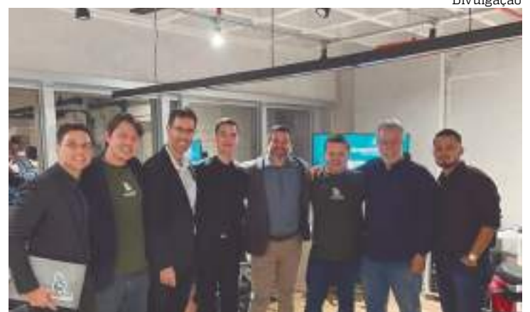
Programa conecta jovens com empresários experientes

“O Projem transformou minha vida pessoal e profissional. Os ensinamentos que recebo estão me preparando para criar e administrar minha empresa. Estou disposto a contribuir com minhas capacidades para alavancar o projeto”, disse.