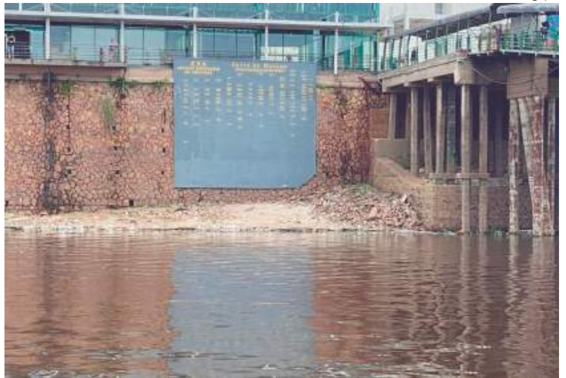
Diferença entre os dois anos agora é de 4,25 metros

O anúncio trata dos editais para quatro obras de dragagens de manutenção nos rios Amazonas e Solimões. No prazo de cinco anos, serão investidos R$ 500 milhões para garantir