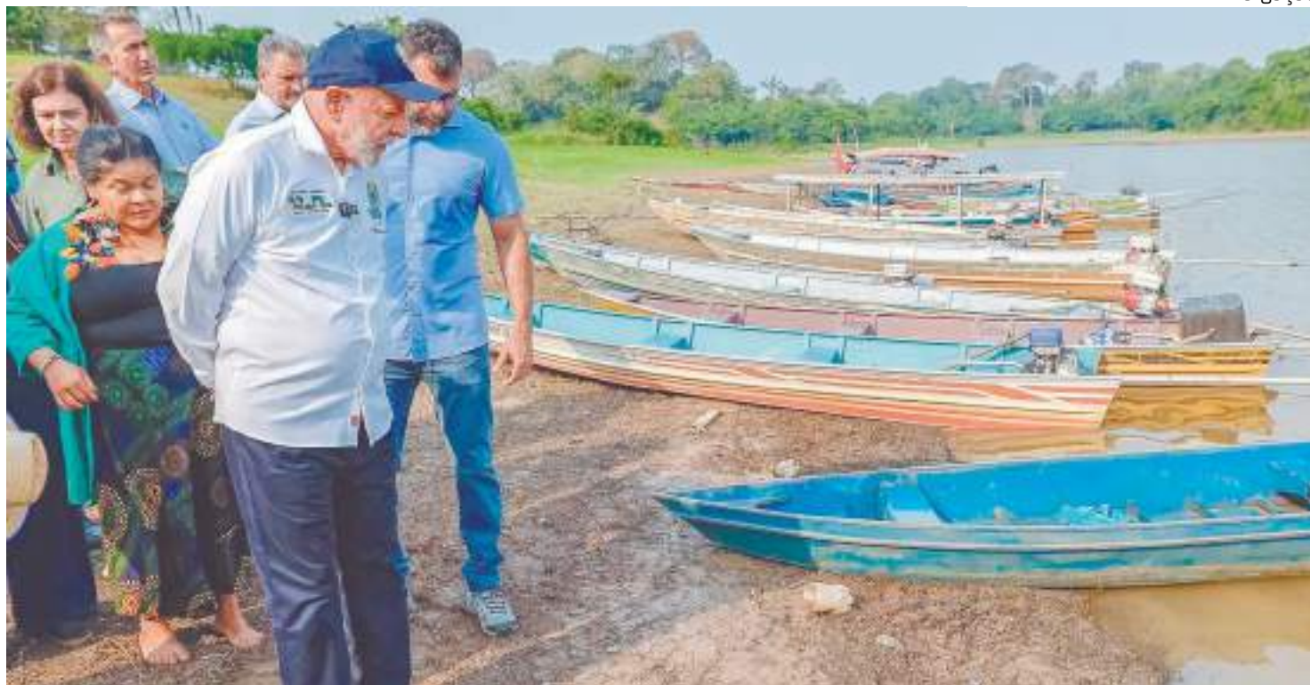
Presidente cumpre agenda em Manaus e outros municípios do Amazonas para tratar sobre a seca severa que assola a região

“É preciso parar com essa história de achar que a companheira Marina não quer construir a BR-319. Essa BR-319 foi construída nos anos 70. Ela foi abandonada por desleixo não sei de quem, ela ficou sem funcionar e hoje a rodovia tem uma parte para cá que funciona, uma parte para lá que funciona, e no meio são 400 quilômetros que foram inutilizados”, disse Lula durante