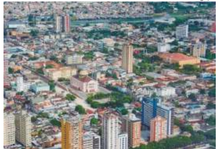
Cenário positivo abre espaço inovações imobiliárias no Estado

Em Manaus, recentemente aconteceu o lançamento do “Studio Lumi Veiralves by Housi” que marca uma nova era para o mercado imobiliário local. Apresentado na EXPOIMOB2024, o empreendimento é resultado da colaboração entre a Patter Incorporadora e a