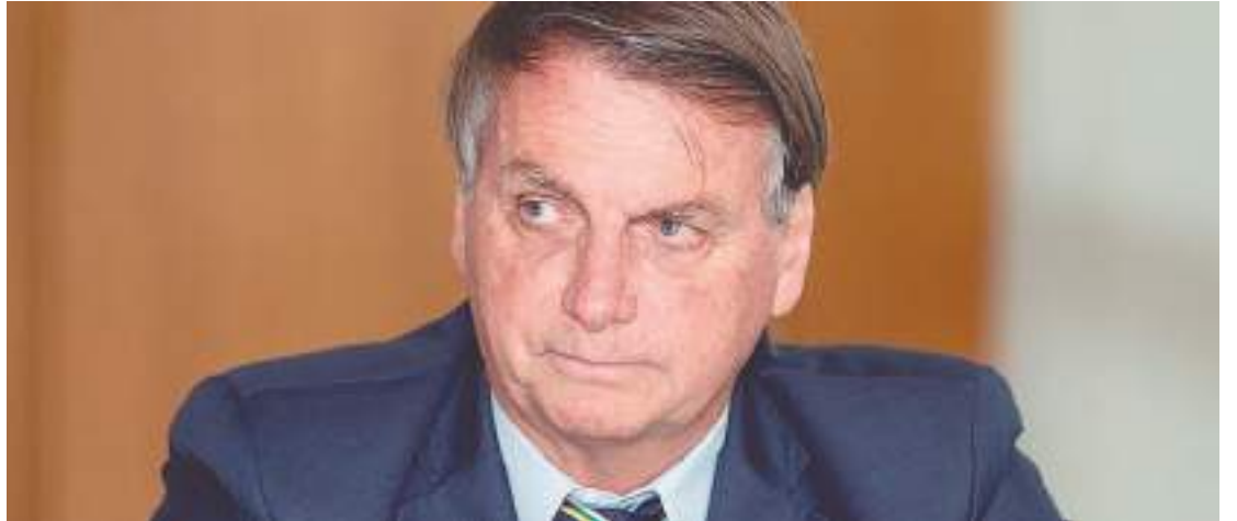
Bolsonaro lança site com candidatos que ele apoia nas eleições

“No Amazonas, tanto Lula quanto Bolsonaro possuem seus candidatos, nem por isso eles estão liberando o processo eleitoral. Estão muito mais dissolvendo os erros e os desgastes de seus líderes do que a sua força, suas forças e simpatias diante o eleitorado. Se nada mudar daqui para frente, tudo indica que a influência de Bolsonaro e de Lula nas eleições de Manaus não foram definidas para que seus aliados tenham ótimos desempenhos. Pode mudar,