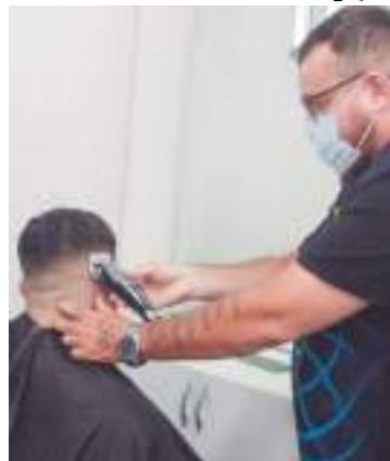
Essa é a terceira oferta de cursos para a capital em 2024

O Centro de Educação Tecnológica do Amazonas (Cetam) publicou edital com a oferta de 7.019 vagas em cursos de Qualificação Profissional, na modalidade presencial, para Manaus. O documento está disponível no endereço site do Cetam.