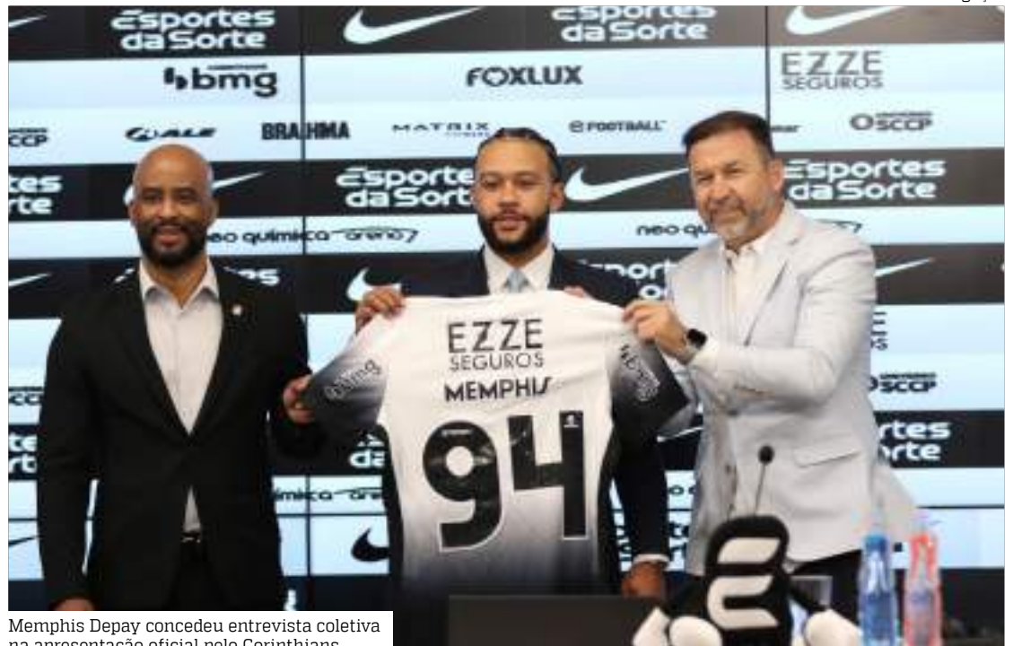
Memphis Depay concedeu entrevista coletiva na apresentação oficial pelo Corinthians

já joguei de 10 e de atacante. Sou um 9,5, posso jogar na esquerda, posso jogar por trás do atacante. Sou um jogador criativo, gosto de jogar entre-