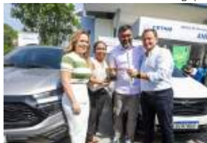
Novo edital prevê repasse de R$ 15 mi para projetos sociais