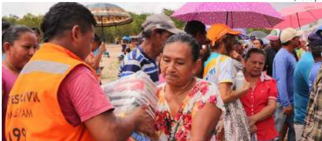
Famílias vão receber kits com água e alimentos em razão da estiagem

As escolas municipais dessas localidades também já estão abastecidas com merenda escolar e água, garantindo assim o pleno funcionamento até o