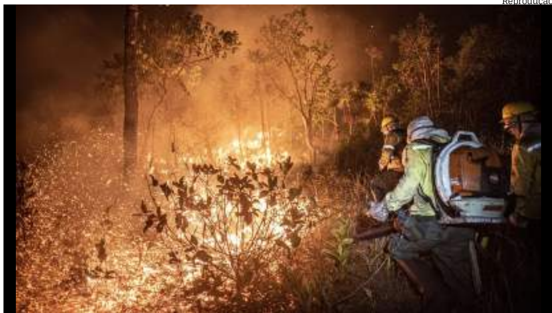
Em três estados da Amazônia o fogo consumiu 5,4 milhões de hectares

Os estados do Mato Grosso, Pará e Mato Grosso do Sul foram os mais atin-