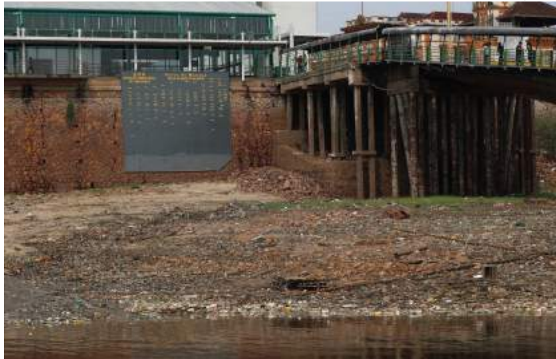
Nesta quinta-feira (12), o Rio Negro atingiu, na capital amazonense, a marca de 16,97 metros

Para a publicação do decreto de emergência, a Pre-