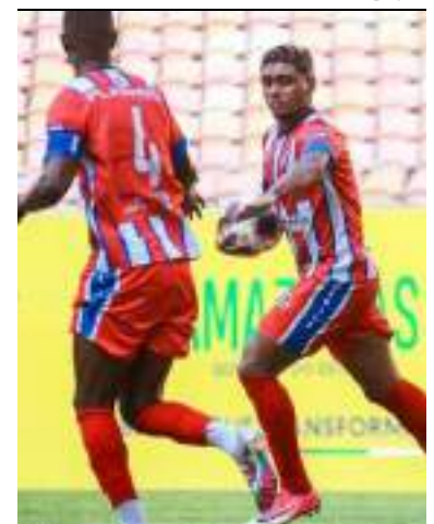
Sul América avançou com goleada