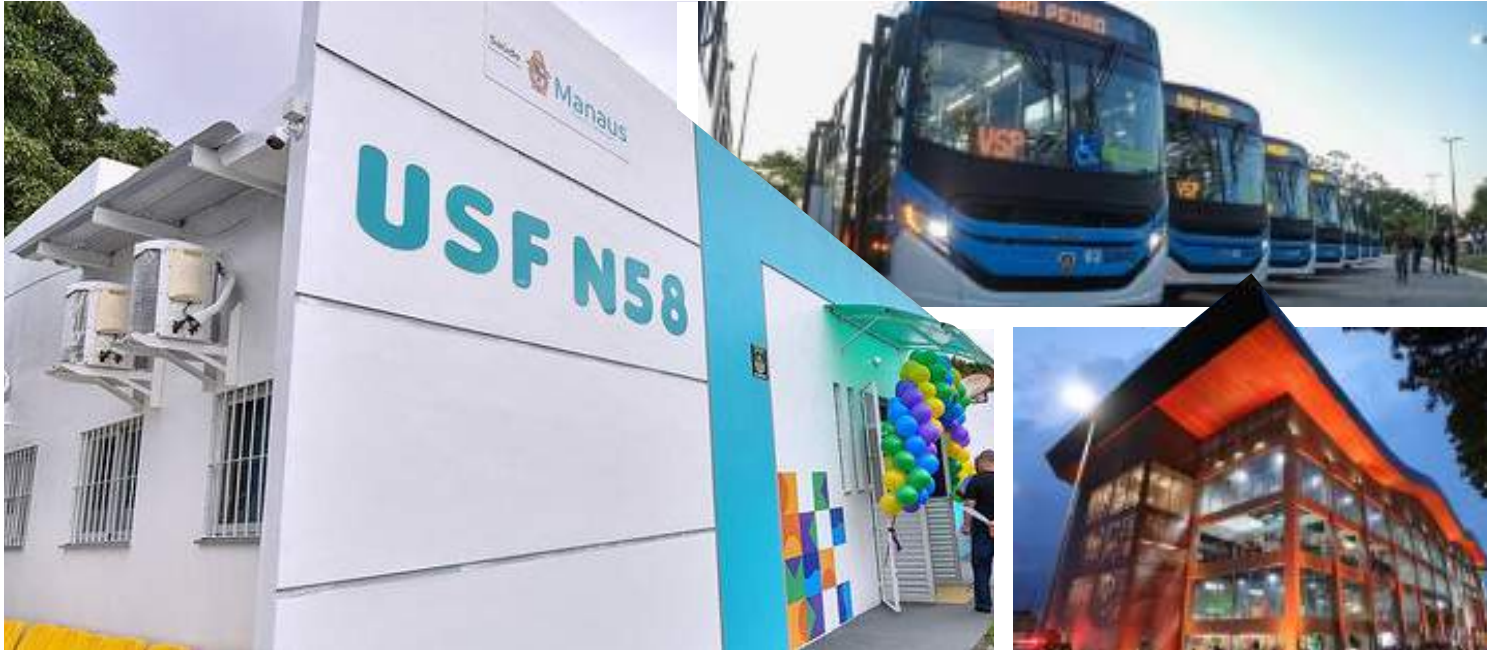
Investimentos foram feitos em unidades de saúde, mobilidade urbana e na infraestrutura do município

O prefeito de Manaus apresentou os resultados positivos, nessa semana, dos investimentos e ações realizadas pelo executivo municipal ao longo dos últimos anos. Em um encontro, ele destacou reformas de unidades de saúde, modernização da frota de ônibus, entre outras ações.