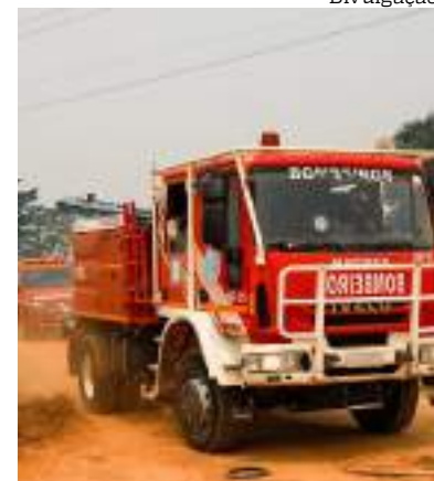
Maioria das ocorrências foi pela tarde

No período da tarde, por volta das 13h40, um incêndio de grande proporção em área de vegetação ocorreu no bairro Ponta Negra, Zona Oeste, quando as chamas atingiram uma área de aproximadamente 360 mil metros quadrados. Na ação, os bombeiros utilizaram 14 mangueiras de combate a incêndio com duas linhas de ataque e 27 mil litros de água.