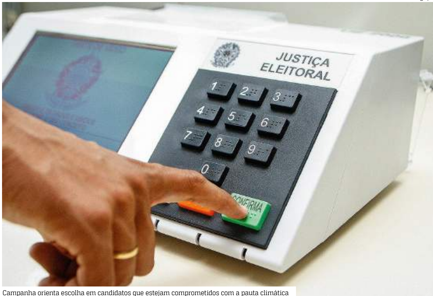
Campanha orienta escolha em candidatos que estejam comprometidos com a pauta climática

Por meio de redes sociais e ações em diferentes capitais brasileiras, a equipe do Greenpeace Brasil vai levar aos eleitores