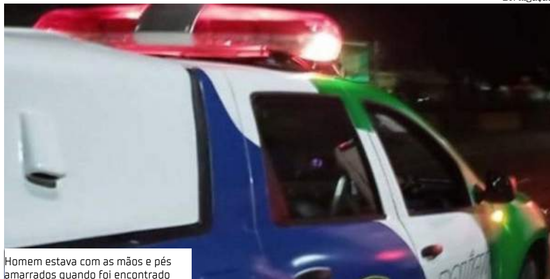
Homem estava com as mãos e pés amarrados quando foi encontrado