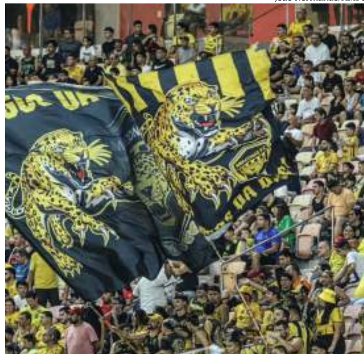
Time aurinegro volta a jogar em Manaus contra o Operário-PR

“Estou muito motivado com esse novo momento na minha carreira. Estou procurando agarrar essa oportunidade da melhor maneira possível e tenho convicção que podemos brigar por uma das quatro vagas na Série A de 2025. Nosso elenco quer fazer história com essa camisa e vamos lutar até o fim”, finalizou o atacante de 26 anos, que veio do São José-SP.