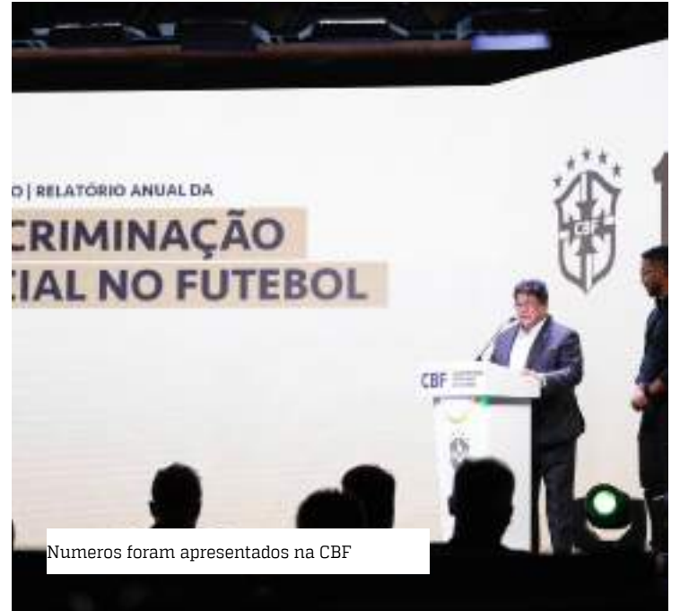
Numeros foram apresentados na CBF

Entre os 104 incidentes raciais em estádios no futebol brasileiro, 91 foram verificados durante partidas de futebol em 21 estados diferentes. O Rio Grande do