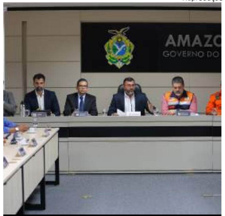
Medida visa auxiliar famílias atingidas pela seca

Durante o anúncio, o governador também assinou um Projeto de Lei enviado à Assembleia Legislativa do Amazonas (Aleam) que prevê a concessão de anistia de dívidas com a Agência de Fomento do Estado do Amazonas (Afeam) para afetados pela estiagem e a aprovação de recursos do Fundo Amazônia para intensificar as ações de combate à seca.