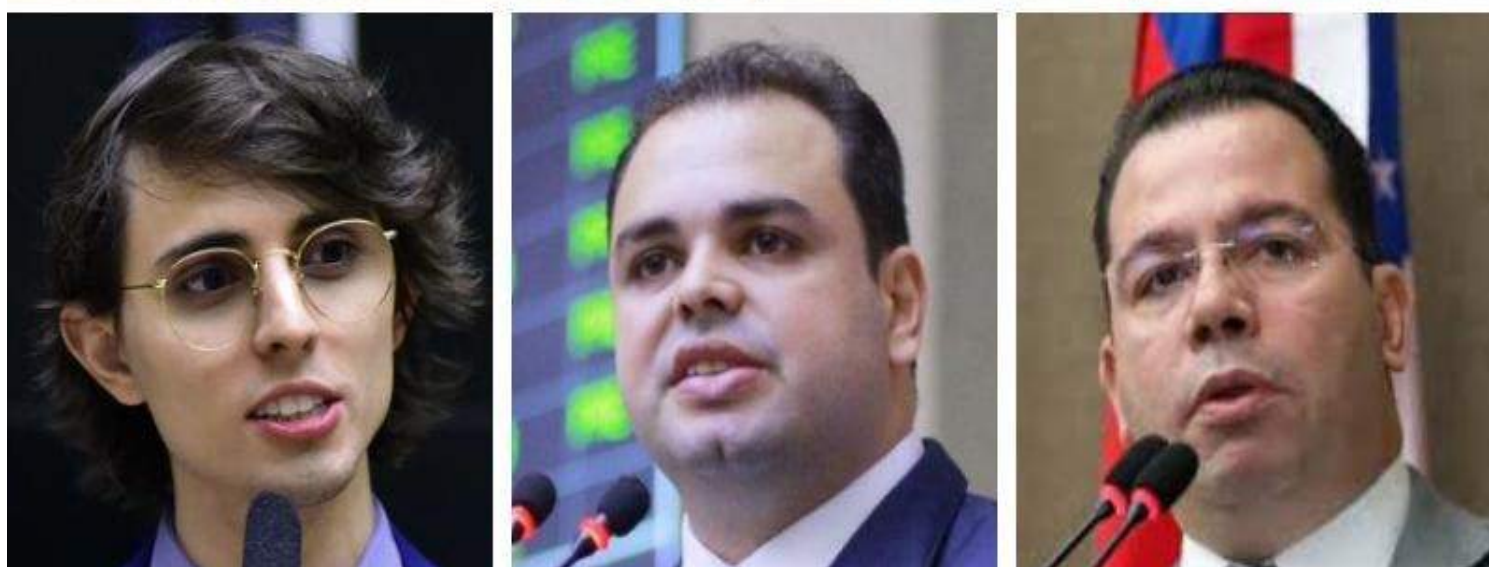
Sete candidatos à prefeitura usaram menos de 30%, dos R$ 24,6 milhões, em despesas de campanhas

Os sete candidatos à Prefeitura de Manaus declararam, até quinta-feira (26), terem utilizado menos de 30% dos R$ 24,6 milhões para gastos de campanha eleitoral.