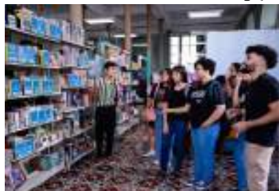
Ação oferece a oportunidade de renovar coleções literárias

A Biblioteca Pública do Amazonas, localizada na rua Barroso, nº 57, Centro, cede espaço para a realização de mais uma edição da troca de livros e gibis. A iniciativa acontece no domingo (29), das 9h às 13h, e busca incentivar o hábito da leitura de forma sustentável promovendo o intercâmbio literário