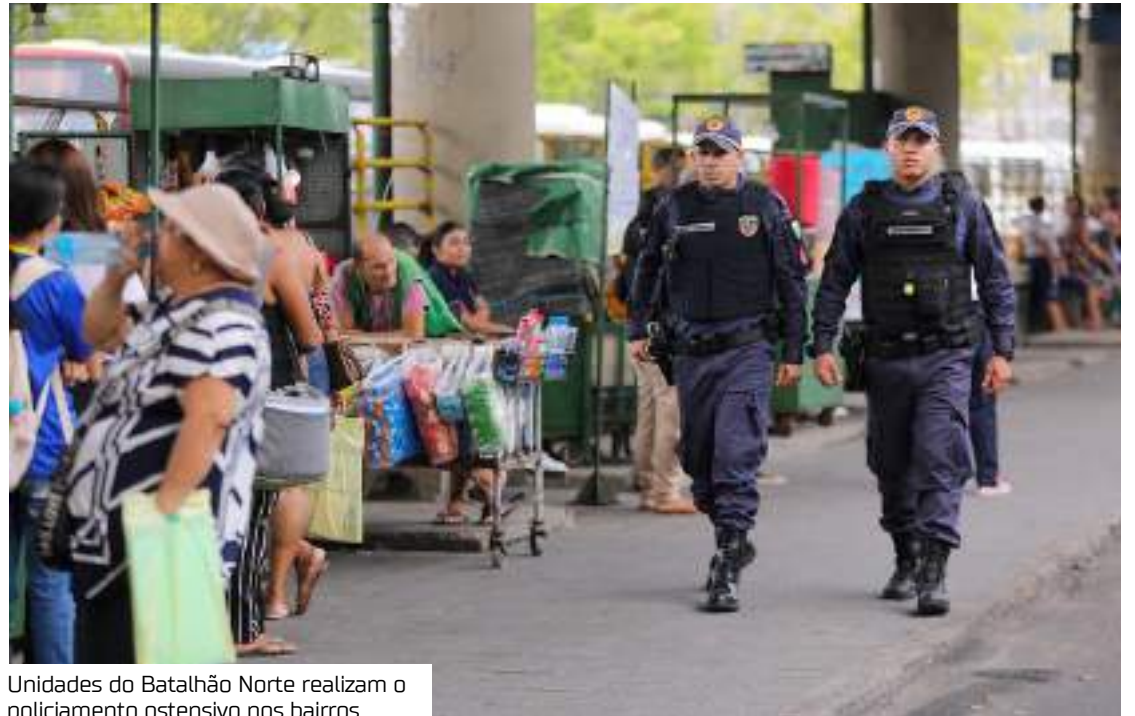
Unidades do Batalhão Norte realizam o policiamento ostensivo nos bairros