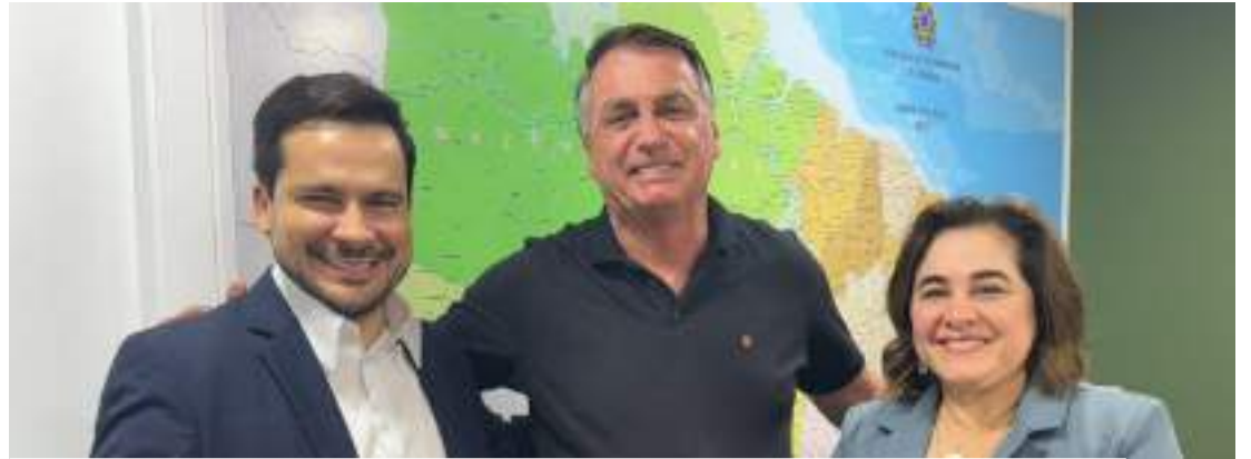
Ex-presidente estará na cidade em apoio a candidatura do candidato Capitão Alberto Neto

Na agenda do Bolsonaro, ele participará de uma "motocarreata" às 9h da manhã, que terá início na Loja Havan, localizada na avenida das Torres, e seguirá até a rua Jornalista Flaviano Limongi, atrás da Arena da Amazônia, onde, a partir das 10h,