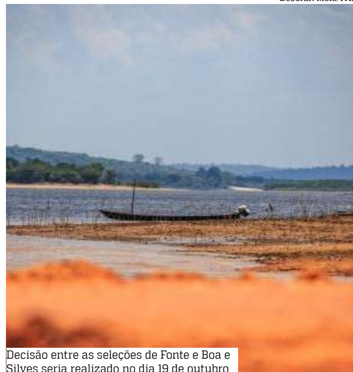
Decisão entre as seleções de Fonte e Boa e Silves seria realizado no dia 19 de outubro

O município de Fonte Boa, distante 680 quilômetros de Manaus, será a sede da final da Copa da Floresta, mas atualmente enfrenta dificuldades significativas devido à seca. Segundo as estimativas do Serviço Geológico do Brasil (SGB), há uma probabilidade de 65% de que o nível do Rio Solimões atinja sua menor marca, que é inferior a -86 cm. A paisagem local já mudou drasticamente, afetando a vida das comunidades que dependem desses rios para seu sustento.