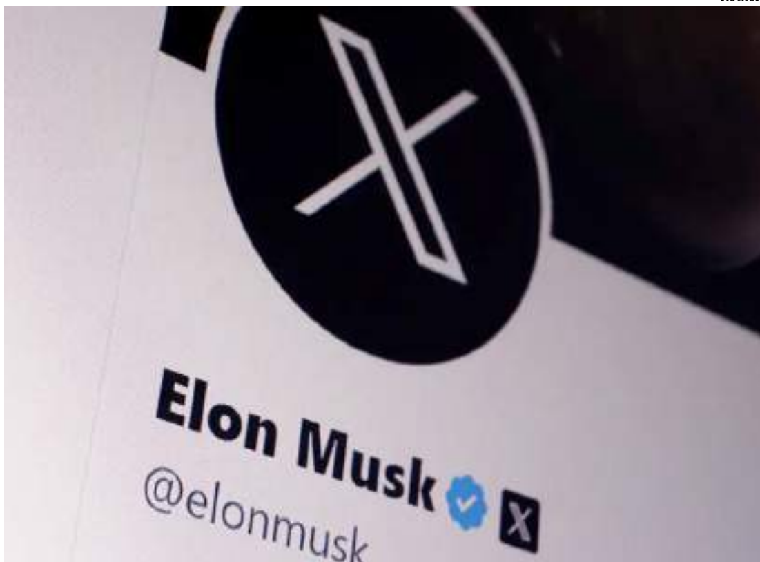
Empresa diz que cumpriu com todas as exigências da Corte

Moraes também deve decidir ainda a respeito da multa diária de R$ 5 milhões aplicada ao X em