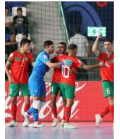
Marroquinos superaram o Irã

“Não é uma surpresa encontrar a seleção do Marrocos nessa etapa de competição. Quem acompanhou o ciclo de preparação deles pode ver o crescimento que tiveram, sobretudo os ótimos resultados que obtiveram. Será um grande jogo e tenho convicção que protagonizaremos uma disputa digna de umas quartas de final”, avaliou o treinador do Brasil.