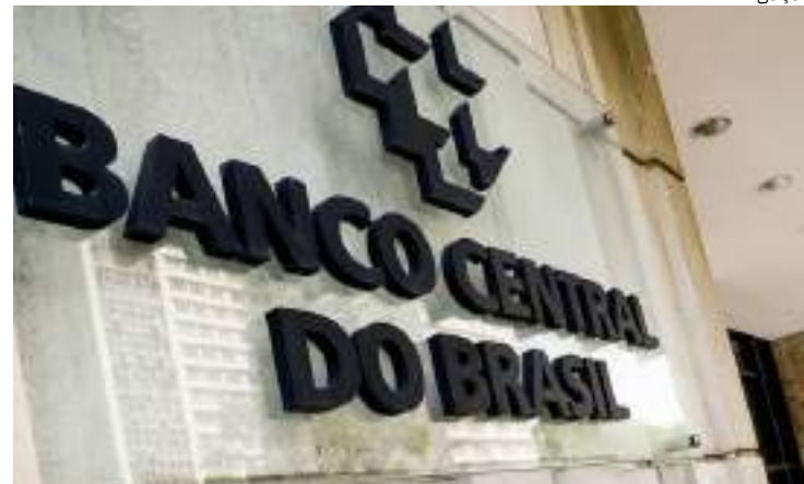
Estimativa para a inflação subiu para 4,3%, se aproximando do teto da meta

O presidente do Banco Central, Roberto Campos Neto, avalia que os dados não contrariam a tese de que a economia se encontra superaquecida. Embora o número tenha vindo melhor