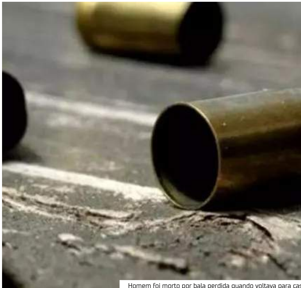
Homem foi morto por bala perdida quando voltava para casa

A Polícia Civil solicita que testemunhas entrem em contato com a Delegacia Especializada em Homicídios e Sequestros (DEHS) ou liguem para o Disque-Denúncia pelo número 181.