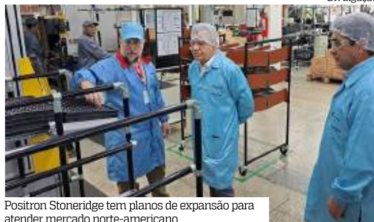
Positron Stoneridge tem planos de expansão para atender mercado norte-americano

fixação, alteração ou suspensão de etapas dos PPBs são conduzidas pelo Grupo Técnico Interministerial (GT-PPB), composto pelo Ministério da Ciência, Tecnologia e Inova-