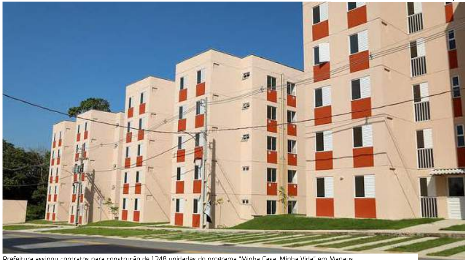
Prefeitura assinou contratos para construção de 1.248 unidades do programa "Minha Casa, Minha Vida" em Manaus

"São mais empregos na construção civil, mais casas próprias para pessoas que necessitam. Ninguém mora em área de risco, em fundo de vale ou dentro de igarapé porque quer ou porque gosta, mora porque precisa, porque não tem onde morar. Por-