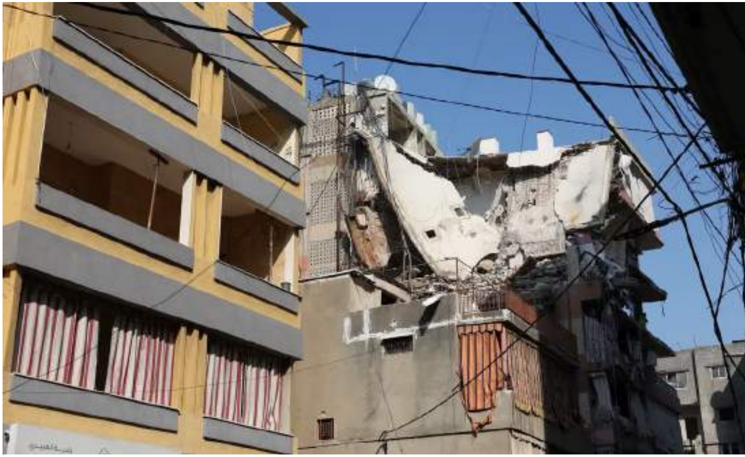
Ministério da Saúde do Líbano divulgou um número inicial de seis mortos e 15 feridos no ataque em Beirute

"A situação exige ação contínua e intensa em todas