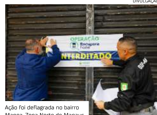
Ação foi deflagrada no bairro Manoa, Zona Norte de Manaus

"Quero ressaltar que, além da fiscalização, nós temos operações, como por exemplo, da semana passada, com determinação judicial, fizemos um recolhimento de mais de mil telefones que agora a Polícia Civil está catalogando, verificando qual tem procedência e qual não tem", explicou.