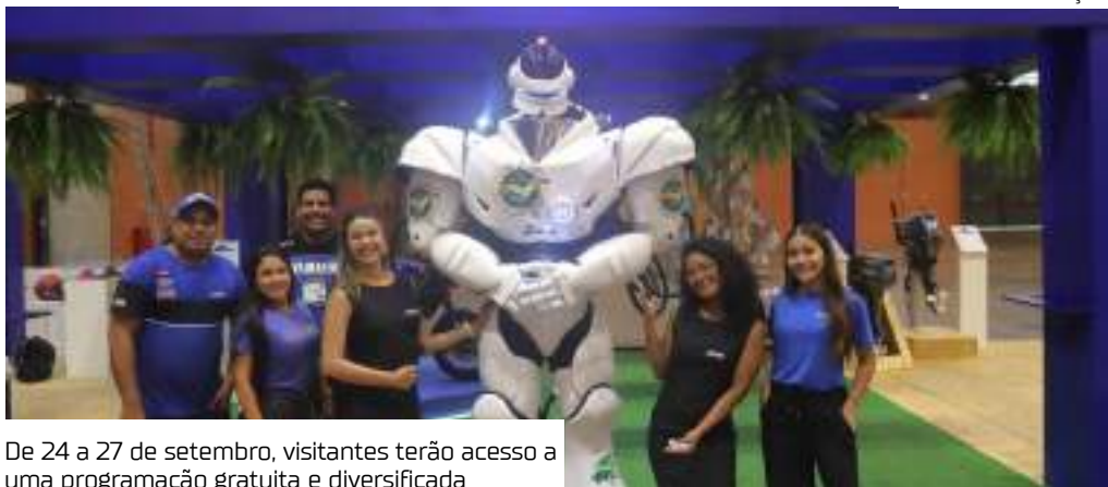
De 24 a 27 de setembro, visitantes terão acesso a uma programação gratuita e diversificada