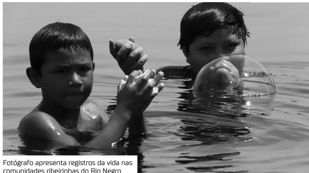
Fotógrafo apresenta registros da vida nas comunidades ribeirinhas do Rio Negro