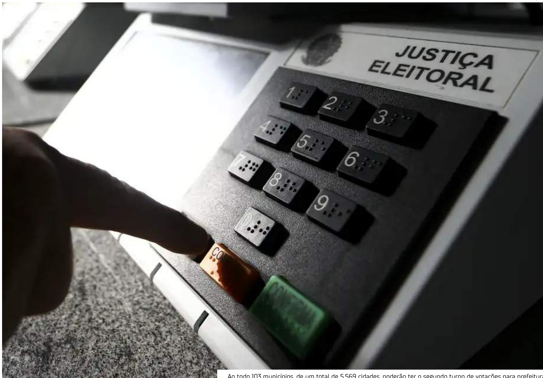
Ao todo 103 municípios, de um total de 5.569 cidades, poderão ter o segundo turno de votações para prefeitura

ter, em 2022, a população de mais de 2,81 milhões de habitantes, não há eleições municipais na capital federal. A Constituição Federal de 1988, no artigo 32 (capítulo V), que trata da organização política e administrativa do Distrito Federal, proibiu a divisão dele em municípios. Por isso, o DF tem uma estrutura política diferente das demais unidades federativas do país, com um governador e uma câmara legislativa, formada