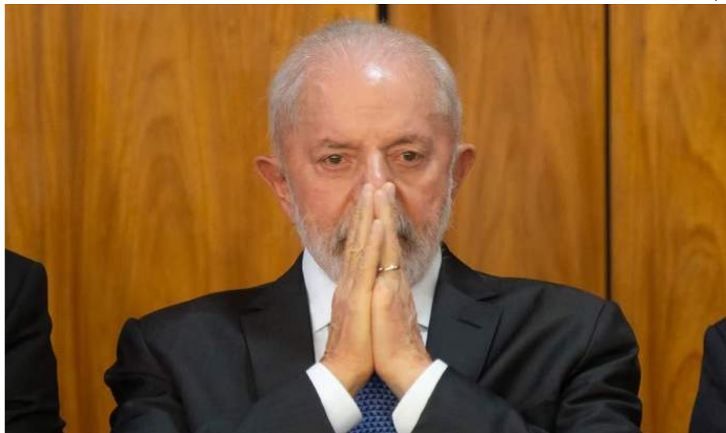
Presidente disse que vai entregar documento sobre redução de gases-estufa ainda neste ano

O presidente também teria sido pouco ambicioso ao dizer que a economia precisa ser "menos dependente" de combustíveis fósseis. Isso porque os relatórios da Agência Internacional de Energia, assim como os cientistas do Painel