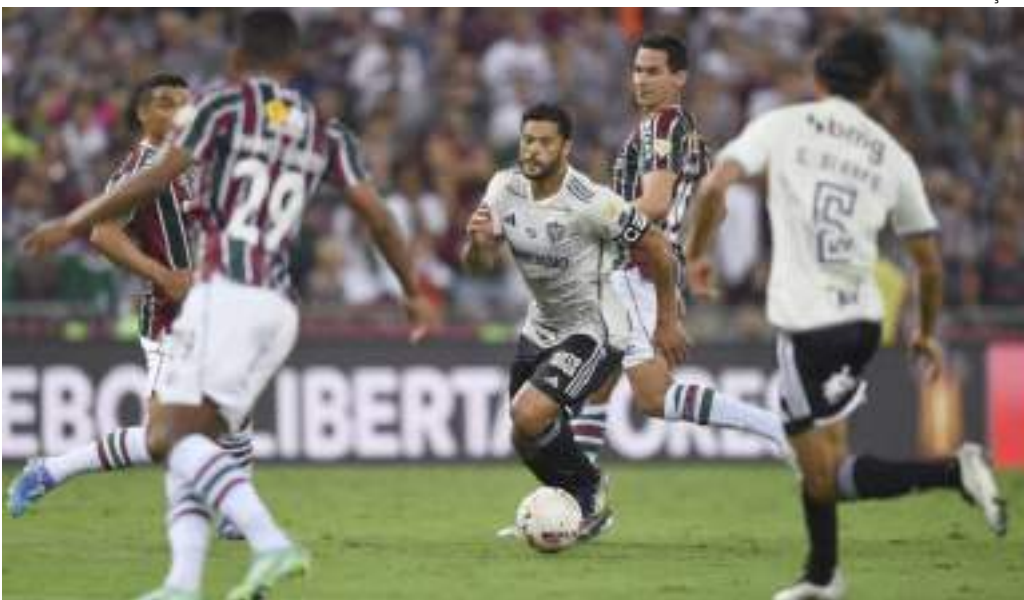
Na ida, Hulk viu o Fluminense fazer 1 a 0, no fim do jogo, e conquistar a vantagem para a volta