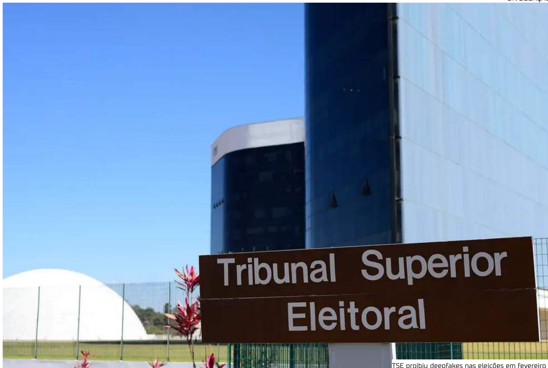
TSE proibiu deepfakes nas eleições em fevereiro

Há casos nos quais a Justiça Eleitoral nem mesmo analisa o mérito da publicação. Restringe-se a questões processuais. Mas,