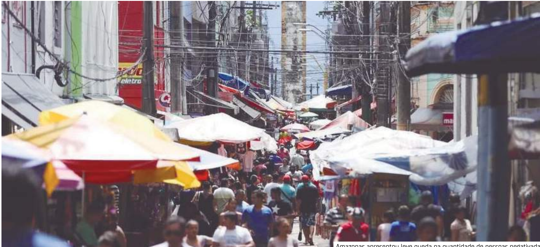
Amazonas apresentou leve queda na quantidade de pessoas negativadas

inadimplentes no Brasil, o mês de agosto registra a terceira menor marca do ano em número de endividados, retomando ao patamar de janeiro e fevereiro.