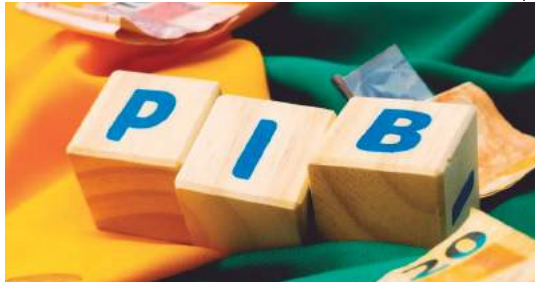
Estimativas apontam um aumento de 2,1% neste ano em relação a 2023

Segundo o IBGE, isso se deve a melhores condições de trabalho, juros mais bai-