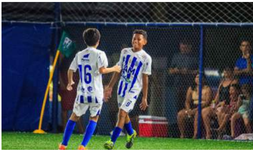
Redes da Arena PSG, local dos jogos, foram balançadas 24 vezes em seis confrontos