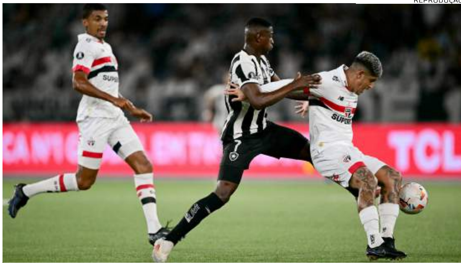
Na ida, Botafogo e São Paulo empataram em 0 a 0 e o Fogão acumulou chances perdidas dentro da área do time paulista

A ESPN, na TV fechada, a TV Globo, na TV aberta, e a plataforma de streaming Disney+ transmitem a partida.