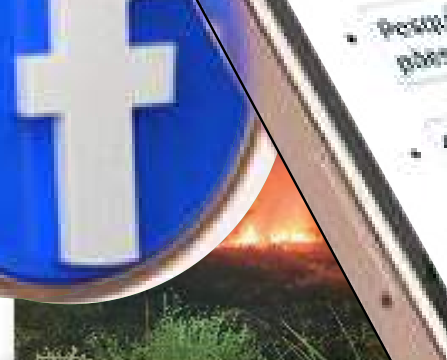
Bombeiros impedem propagação de incêndio em área de vegetação no interior do AM