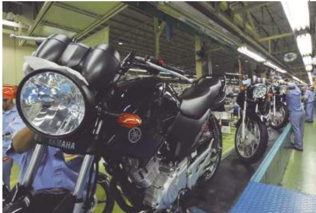
Produção de motos apresenta o melhor desempenho desde 2012

“As empresas estão tomando medidas preventivas para garantir o abastecimento das linhas de produção. Além disso, outras alternativas logísticas para o recebimento dos insumos e o transporte dos produtos estão sendo realizadas. A meta é minimizar eventuais impactos futuros por conta do baixo nível dos rios”, explicou.