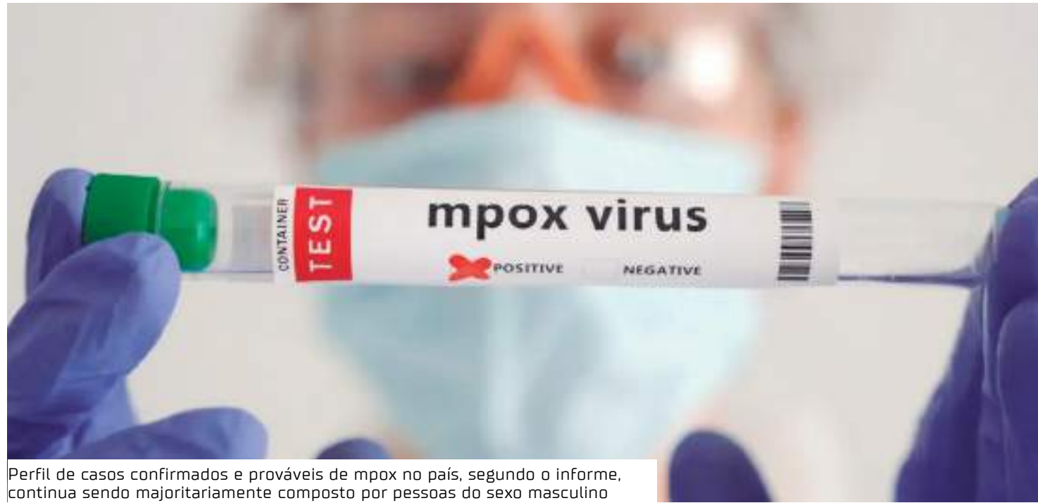
Perfil de casos confirmados e prováveis de mpox no país, segundo o informe, continua sendo majoritariamente composto por pessoas do sexo masculino