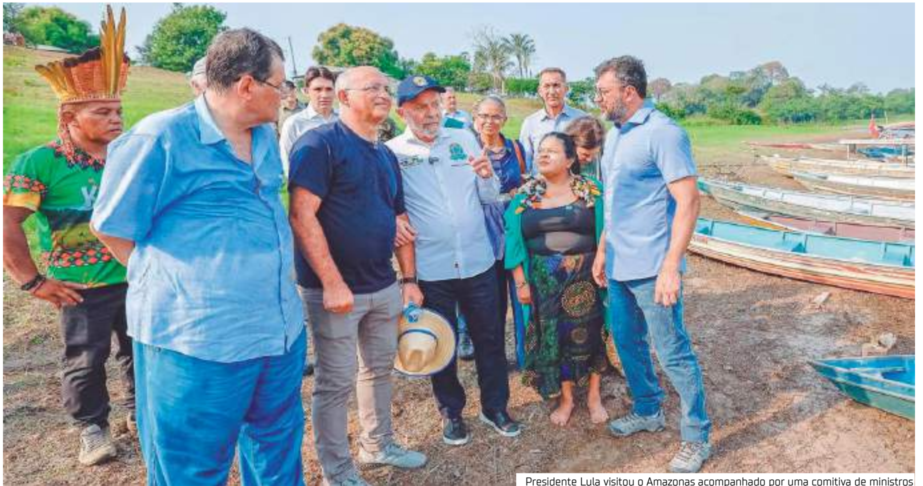
Presidente Lula visitou o Amazonas acompanhado por uma comitiva de ministros

"O governo federal vai assumir responsabilidade de, junto com Estado e os prefeitos, fazer mais coisas para atender às necessidades básicas daquele povo [do Amazonas]", disse.