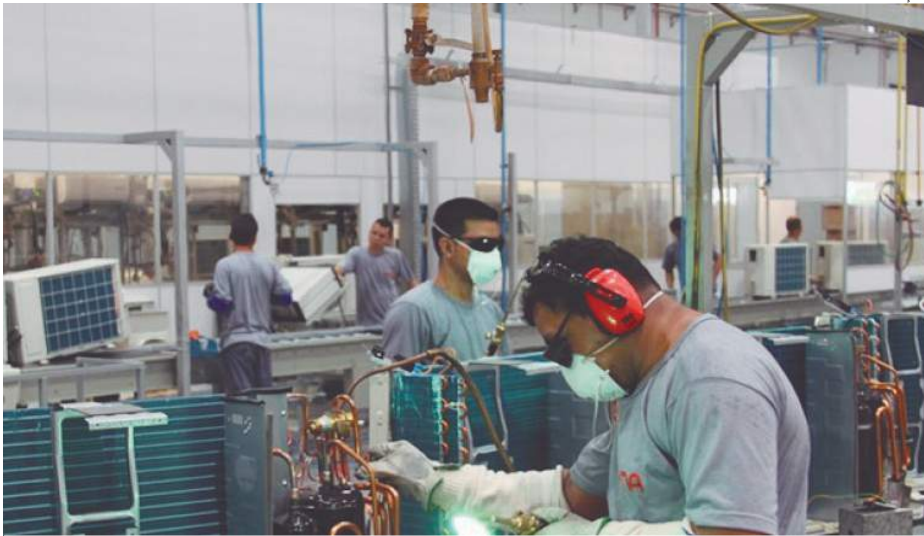
Onda de calor por todo o Brasil aumenta venda de aparelhos como ar-condicionado

“Não há risco de desabastecimento neste momento, porque já se antecipou muito a produção. O que talvez esteja acontecendo em casos pontuais é não encontrar o produto entre o pedido ao fornecedor e a chegada na loja, porque está sendo um momento realmente de muita procura de ar-condicionado”, disse Nascimento.