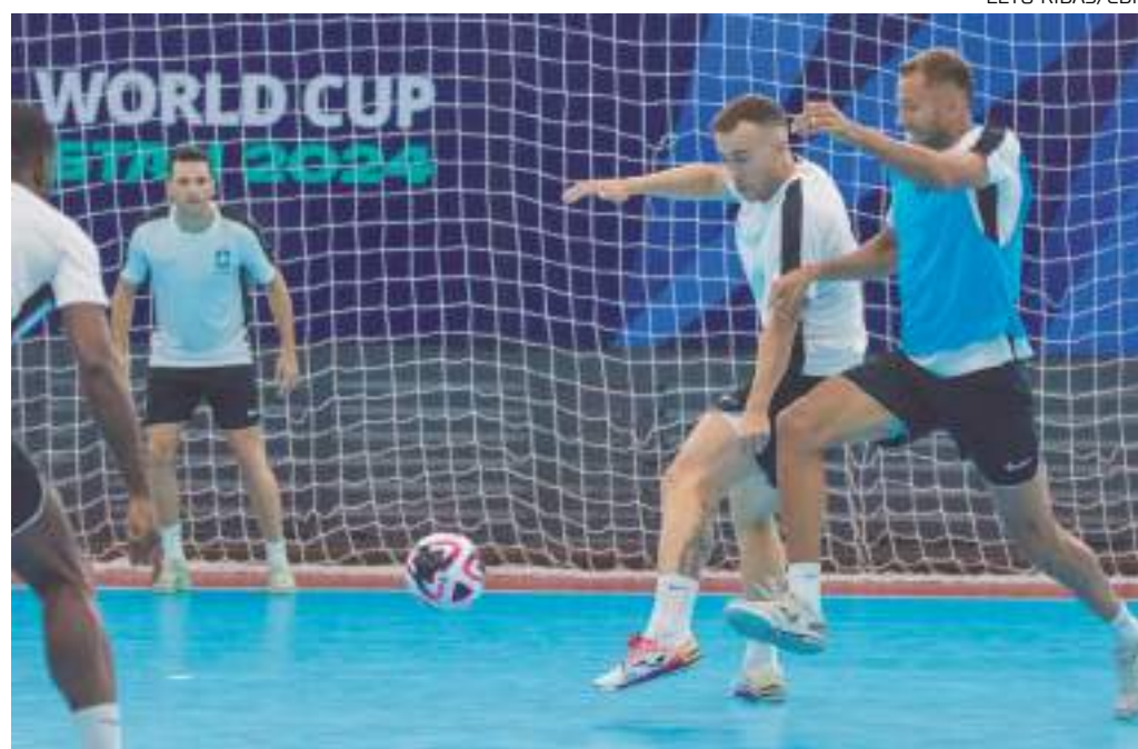
Time brasileiro estreia contra Cuba, no sábado (14)