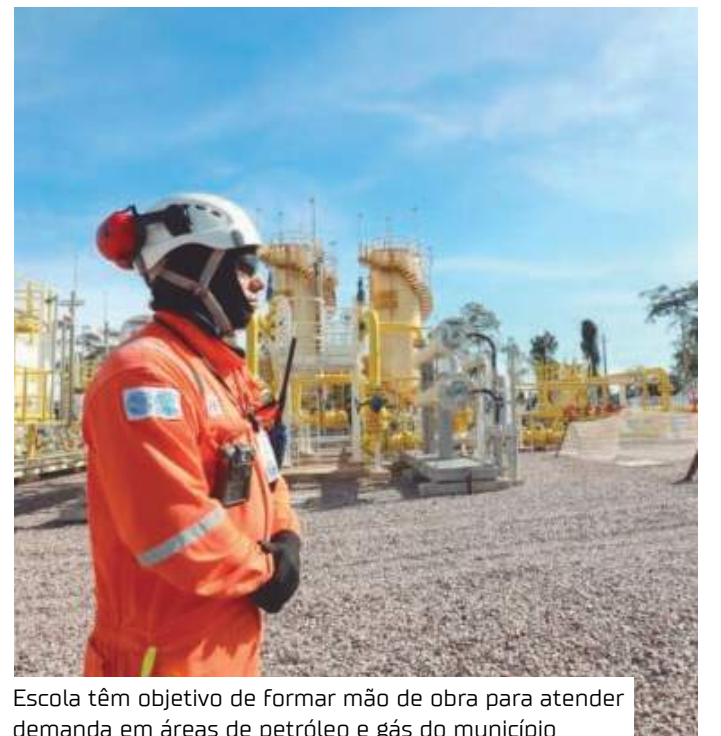
Escola tem objetivo de formar mão de obra para atender demanda em áreas de petróleo e gás do município

"É muito gratificante porque além desse incentivo, que é a bolsa, nós temos a oportunidade de crescer profissionalmente e quem sabe se aprofundar mais na área, fazer outros cursos. O Governo do Estado está dando esse pontapé inicial e Silves é uma porta de entrada para outras oportunidades", afirmou.