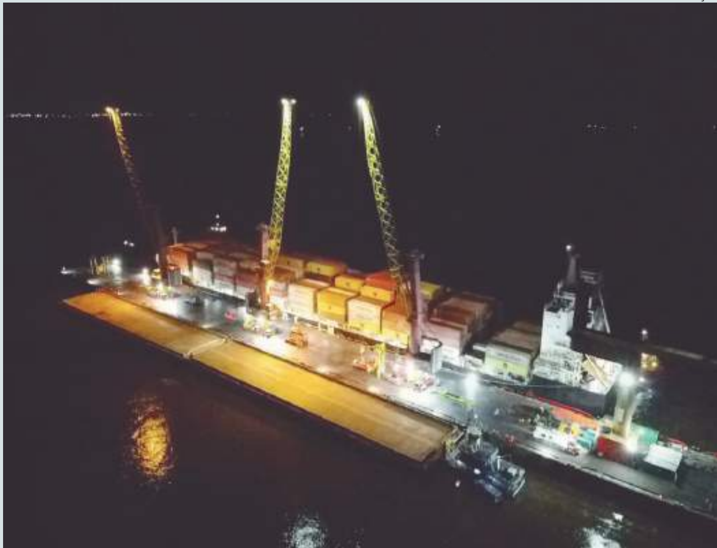
Píer foi projetado para operar em áreas de baixa profundidade, permitindo o transporte de mercadorias mesmo com a redução dos níveis dos rios