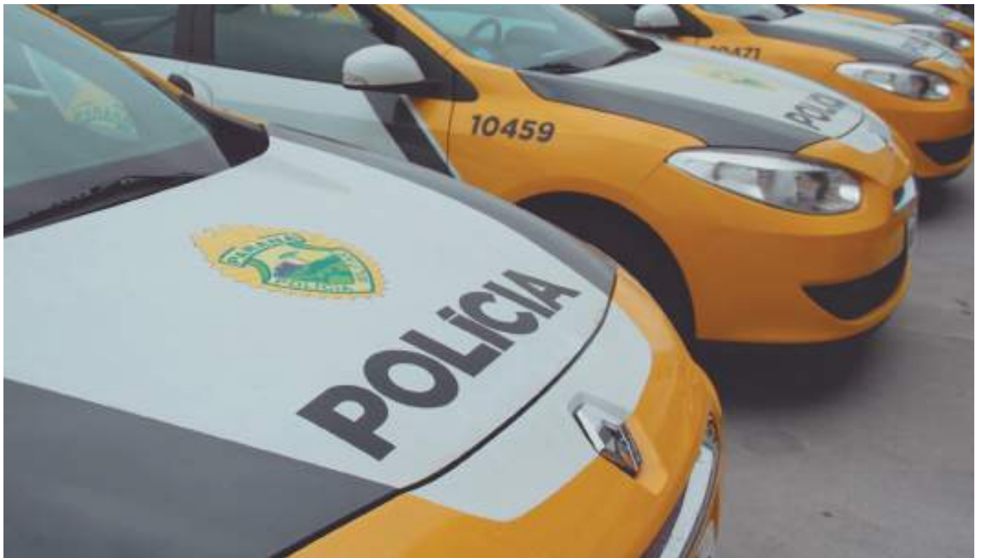
Paraná é um dos estados que quer usar polícias estaduais para resolver conflitos entre ruralistas e indígenas

A conciliação foi instalada pelo ministro Gilmar Mendes, que relata cinco ações na corte que questionam a constitucionalidade da lei aprovada pelo Congresso impondo um marco temporal à demarcação de terras indígenas.