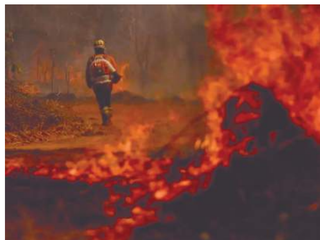
Queimadas em todo o Brasil afetam a qualidade do ar

No caso de Guimarães, foram empenhados R$ 45 mil