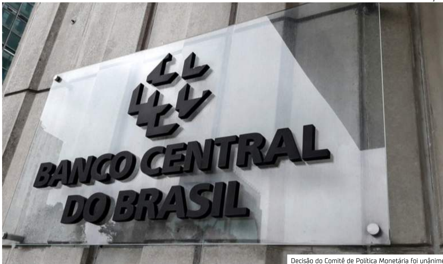
Decisão do Comitê de Política Monetária foi unânime

“Pela composição do quadro das políticas fiscal e monetária, a agressividade da