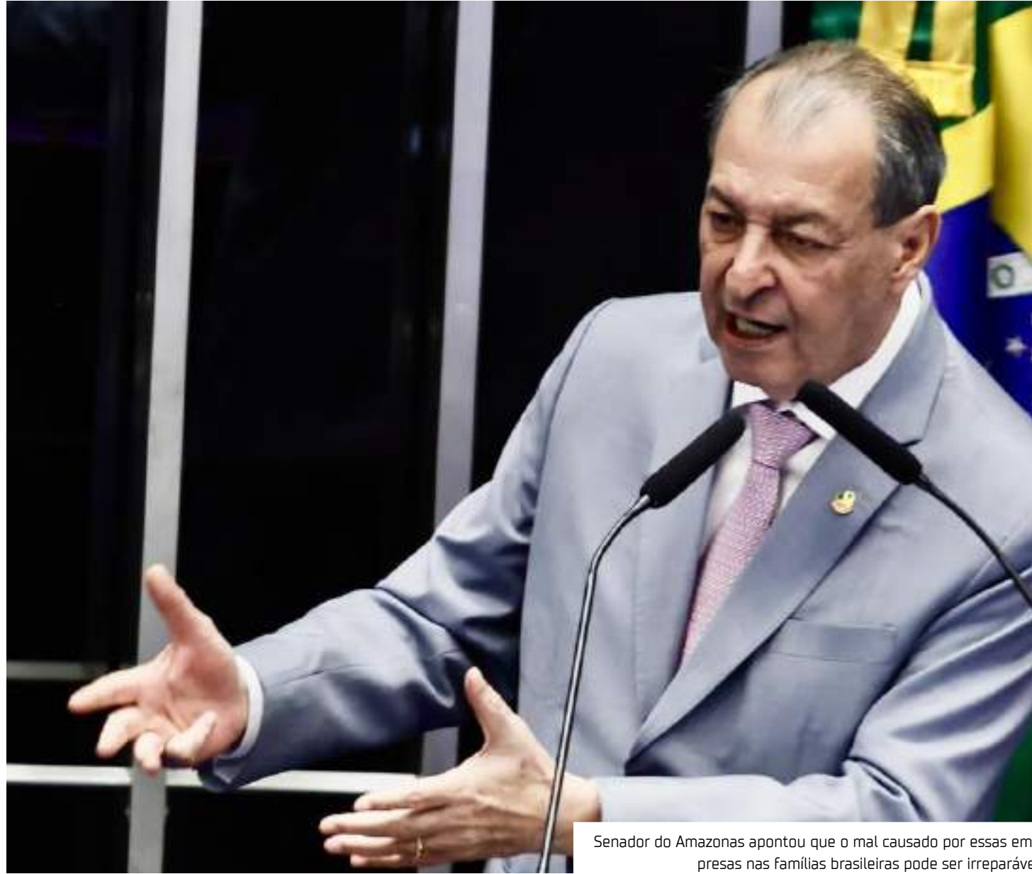
Senador do Amazonas apontou que o mal causado por essas empresas nas famílias brasileiras pode ser irreparável

"O mal que elas têm feito às famílias é irreparável. Não tem dinheiro que valha a pena o que está