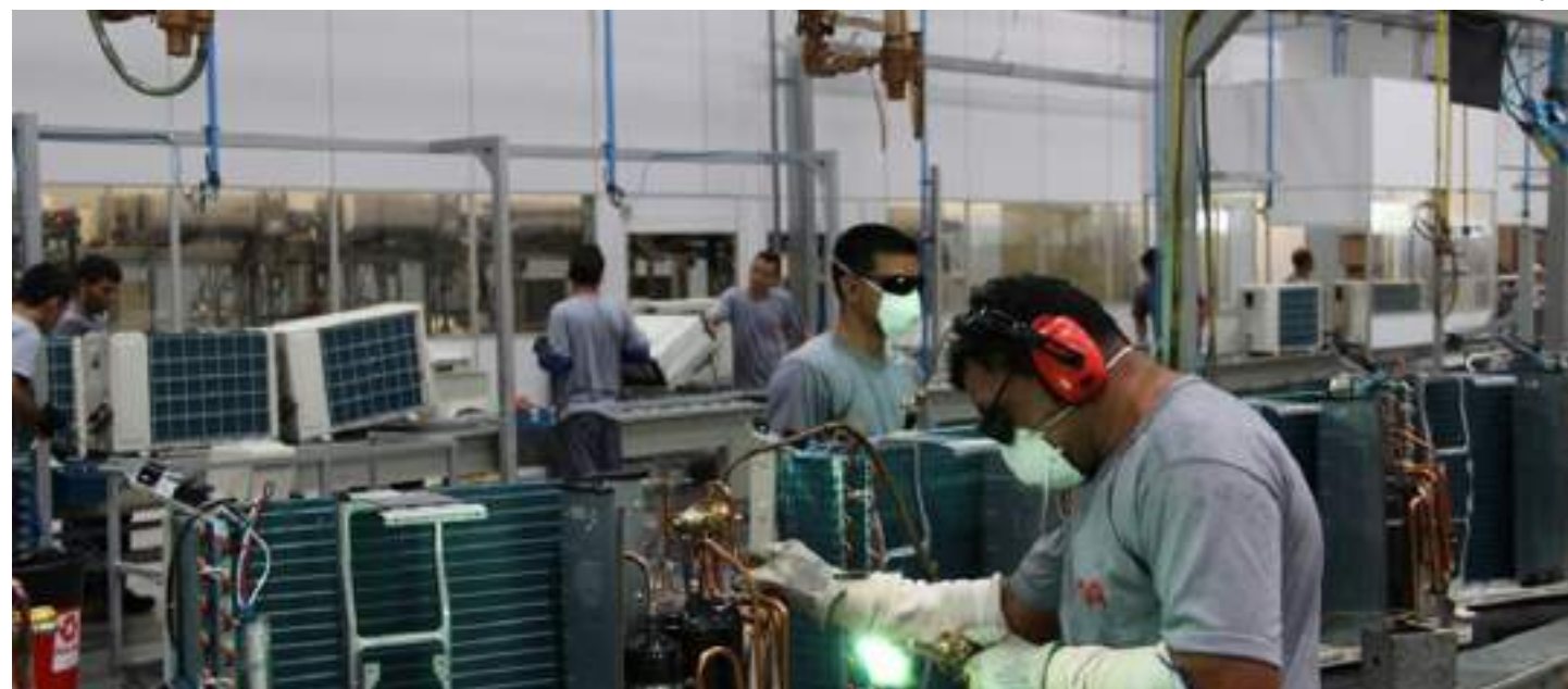
Demanda por soluções de climatização ocorreu no primeiro semestre na ZFM

“Esses números trazem otimismo, pois o histórico mostra que quando as empresas do PIM aumentam os empregos estão preparando forte acréscimo