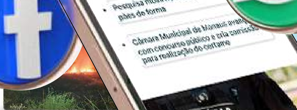
Bombeiros impedem propagação de incêndio em área de vegetação no interior do AM