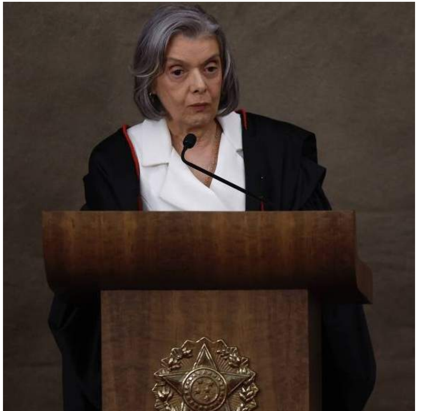
Cármen Lúcia, presidente do TSE (Tribunal Superior Eleitoral)

A legislação autoriza dois tipos de apostas no país: aquelas que tenham por objeto disputas esportivas, como partidas de futebol, ou eventos virtuais de jogos online, como o chamado "jogo do tigrinho". As eleitorais não estão contempladas.