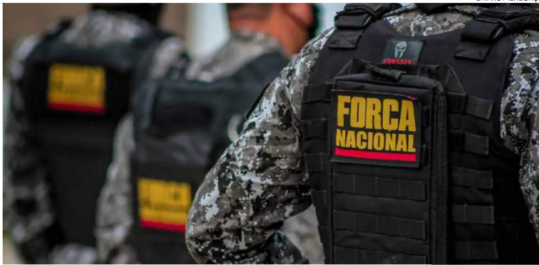
Quantidade de agentes ainda será definida pela Secretaria Nacional de Segurança Pública

Especificamente, os efetivos de polícia judiciária e de polícia técnico-científica da Força Nacional de Segurança Pública atuarão em apoio às polícias civis dos estados e à Polícia Federal na investi-