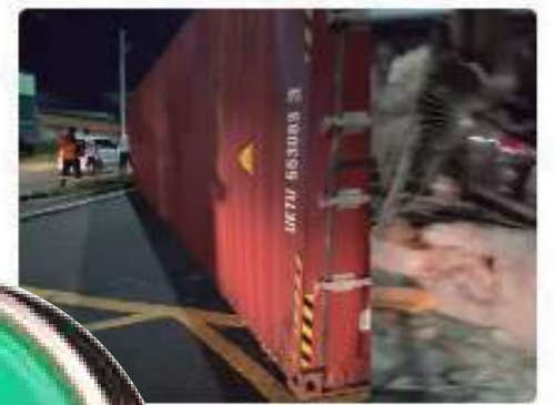
Truck at night and hits house and cars in Manaus; VÍDEO