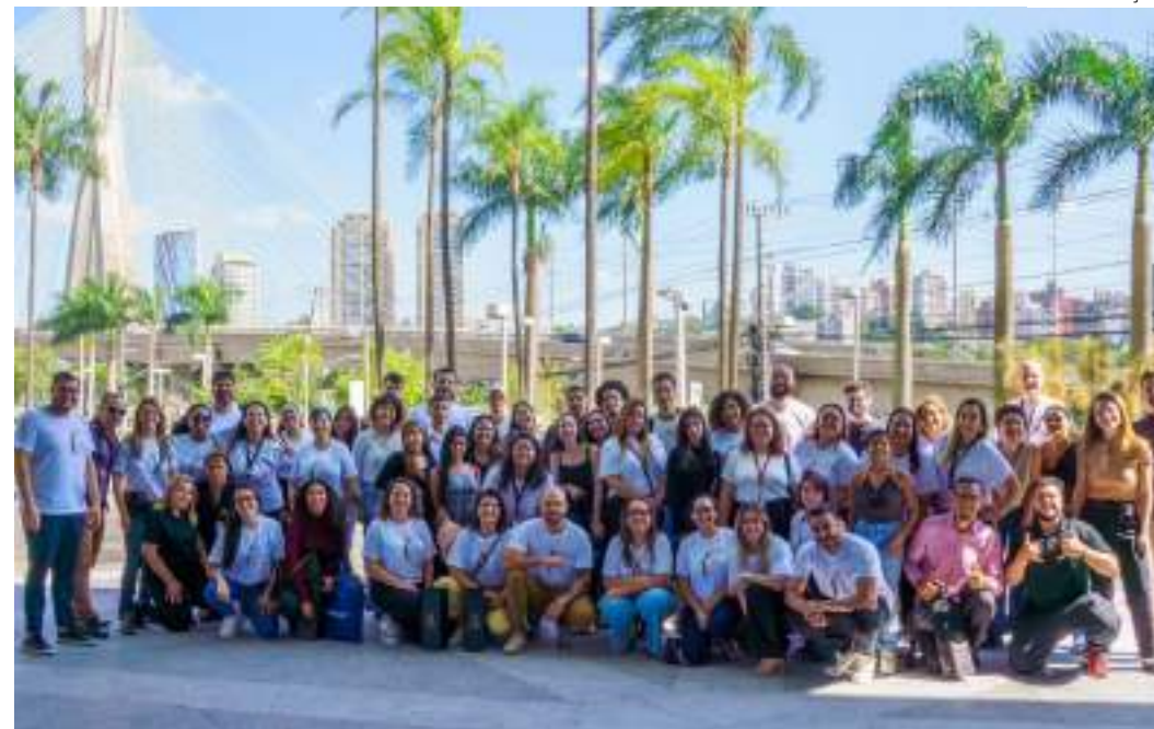
Nova edição contará com a participação de dez profissionais do Nelson Wilians Advogados (NWADV)

Segundo ele, durante os encontros, os voluntários – escolhidos com base em competências essenciais, como empatia, liderança e autodesenvolvimento – desenvolverão um "Plano de Voo" junto com os jovens participantes. "Este plano definirá estratégias e ações a serem realizadas nos próximos seis meses, com o objetivo de aproximar a juventude de seus sonhos e metas profissionais e educacionais. A mentoria é personalizada para atender às necessidades e aspirações individuais de cada jovem", destaca.