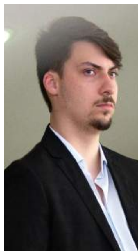
Três membros da família Bolsonaro estão concorrendo nas eleições deste ano

Jair Renan Bolsonaro, que concorre com o mesmo nome de urna do pai, "Jair Bolsonaro", recebeu dinheiro do Partido Liberal de duas formas: pela direção nacional e pela direção municipal. Foram doações de, respectivamente, R$ 135,1 mil e R$ 2,3 mil. O valor