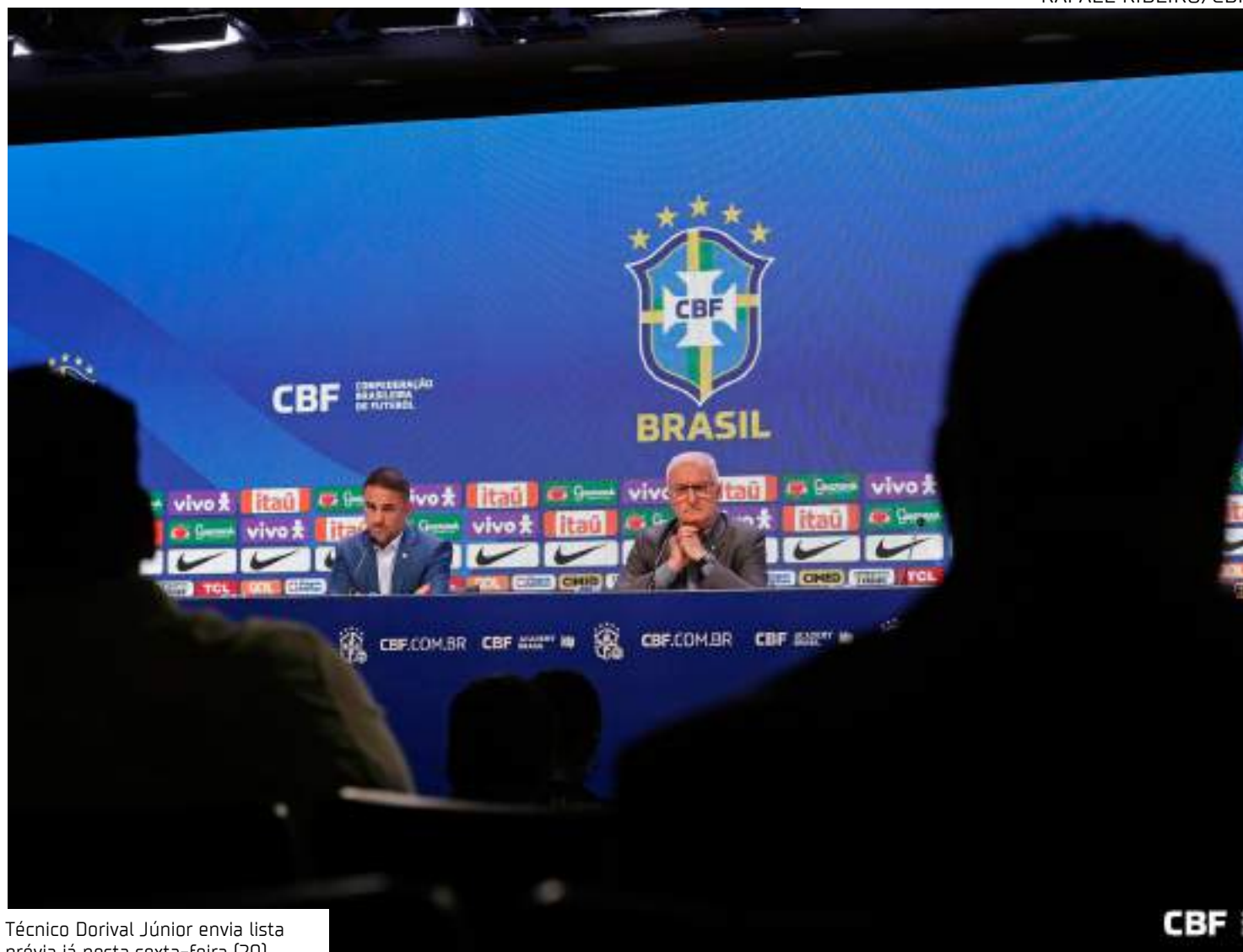
Técnico Dorival Júnior envia lista prévia já nesta sexta-feira (20)

passou por nivelamento a laser com tecnologia topográfica, assim como a utilizada em gramados europeus. Depois que o novo gramado foi replantado, a atenção foi redobrada para assegurar a qualidade do espetáculo.