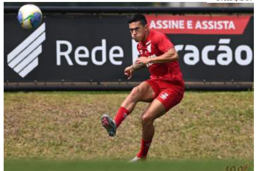
Time rubro-negro teve três derrotas, um empate e uma vitória nos últimos cinco jogos