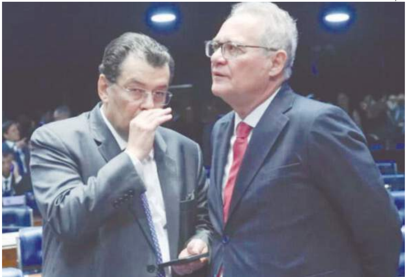
Senadores foram indiciados em investigação que é desdobramento da operação Lava Jato

A assessoria de Renan Calheiros informou que o senador não vai se manifestar.