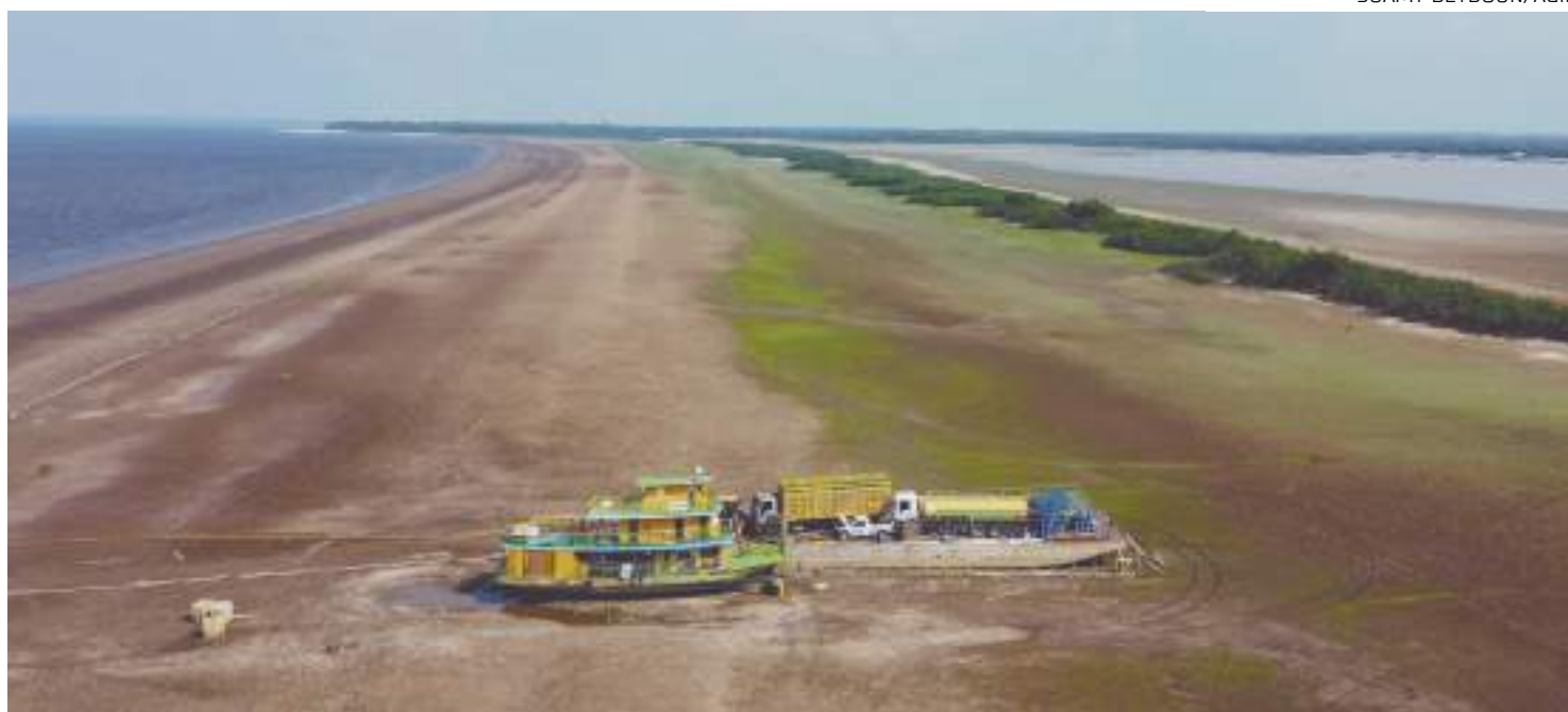
Redução do nível das águas prejudica navegação das embarcações que fazem o transporte de combustível

A Aneel destaca que a principal região produtora de óleo e gás na região, o chamado "Polo Urucu", no município de Coari (AM), controlado pela Petrobras, depende, em parte do percurso, do transporte fluvial até chegar ao terminal portuário de Solimões, o qual está localizado em uma região que tem sofrido severamente com a seca.