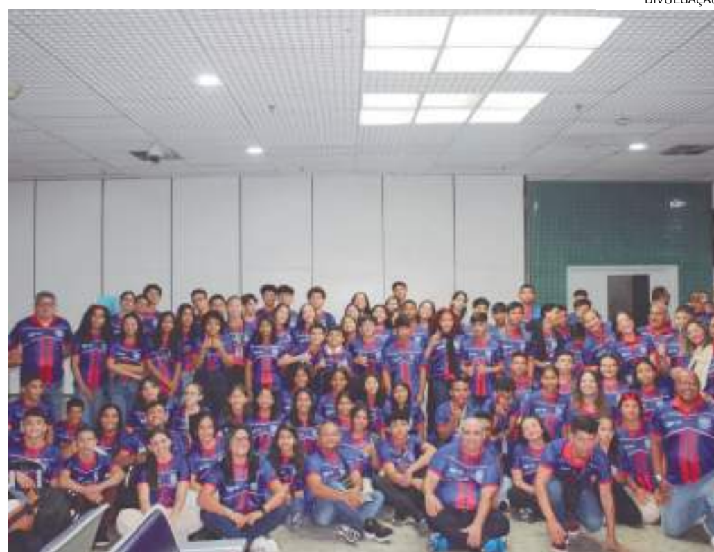
Delegação amazonense viajou para o evento esportivo nesta sexta-feira (20)