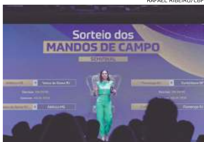
Sorteio dos confrontos dos semifinalistas da Copa do Brasil foi no RJ