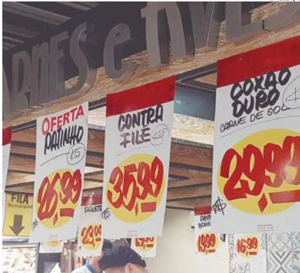
Pressão por aumentos deve levar a inflação da carnes em 2024 a 5,8%

“Nosso cenário contempla bandeira vermelha 2 no próximo mês, voltando para amarela no final do ano. Os impactos estimados no IPCA são de +0,13 p.p. no caso de vermelha 1 e +0,29 p.p. para vermelha 2”, diz o documento.