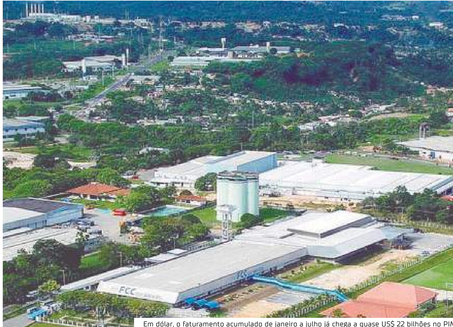
Em dólar, o faturamento acumulado de janeiro a julho já chega a quase US$ 22 bilhões no PIM

Já o cenário nos próximos meses de 2024 não são animadores. Por conta da estiagem, as empresas do PIM terão gasto adicional de R$ 500 milhões. É o que aponta