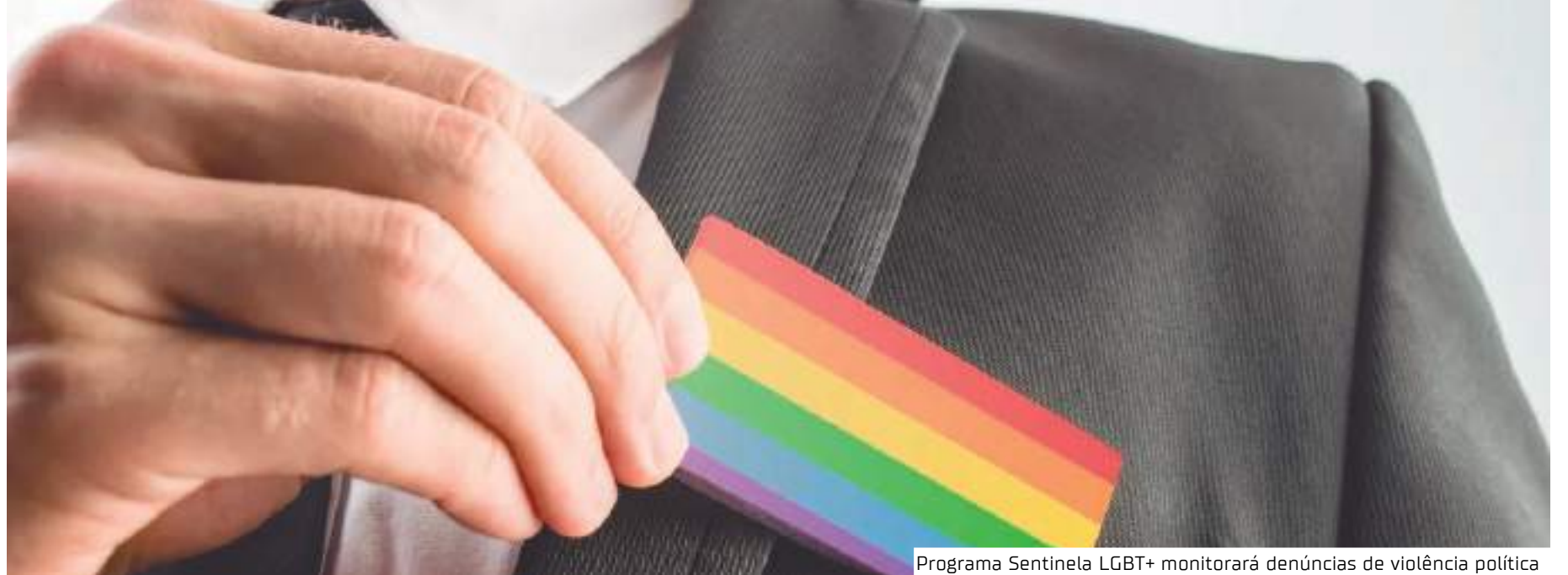
Programa Sentinela LGBTQ+ monitorará denúncias de violência política

sofridos durante estas eleições vão alimentar um relatório sobre violência política LGBTQ+fóbica, que analisará tanto o perfil das vítimas quanto das agressões. O programa também conta com profissionais de saúde mental que fornecerão atendimento gratuito às vítimas de violência política. Com uma equipe composta por profissionais da Clínica LGBTQ+ com Local, estão previstos 600 atendimentos gratuitos e sigilosos.