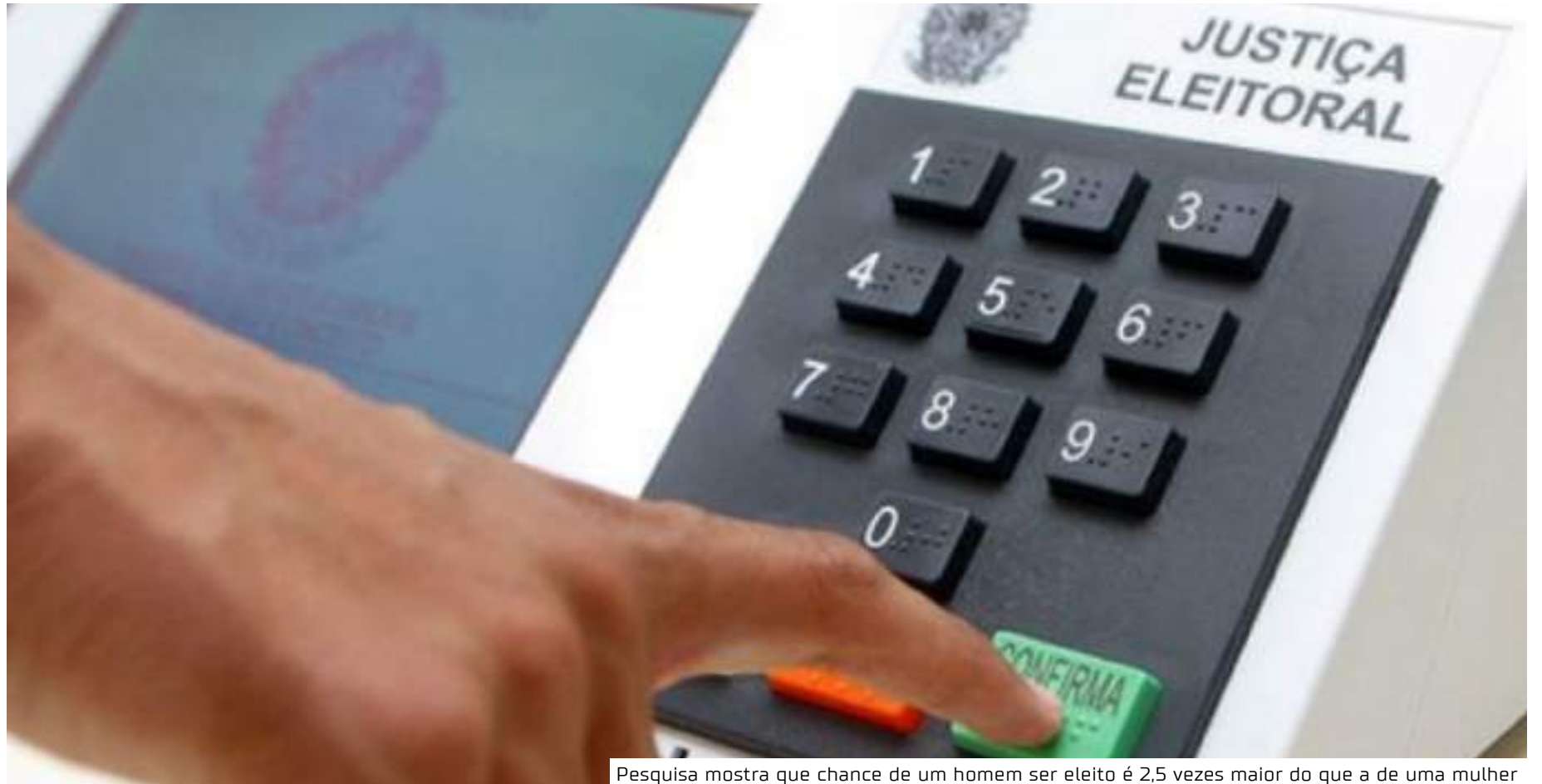
Pesquisa mostra que chance de um homem ser eleito é 2,5 vezes maior do que a de uma mulher

O desequilíbrio também é visto no recorte racial. Embora tenha havido um aumento da representação de pretos e pardos na Câmara de 2018 para 2022, a proporção ainda