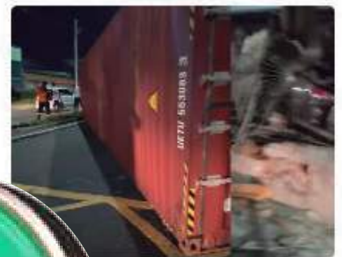
Trator tomba e atinge casa e carros na Manaus; VÍDEO