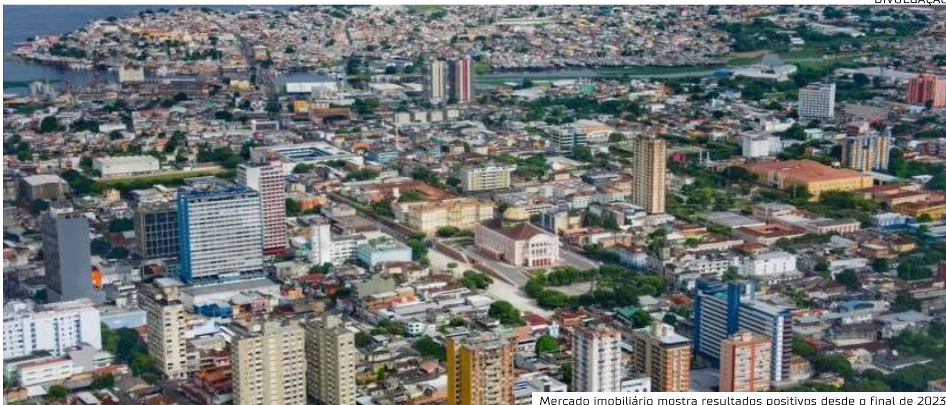
Mercado imobiliário mostra resultados positivos desde o final de 2023

tacou como um dos motores desse crescimento, com 1,2 milhão de visitantes em 2023, o que impulsionou a receita gerada pelo setor e contribuiu para a valorização do mercado imobiliário local.