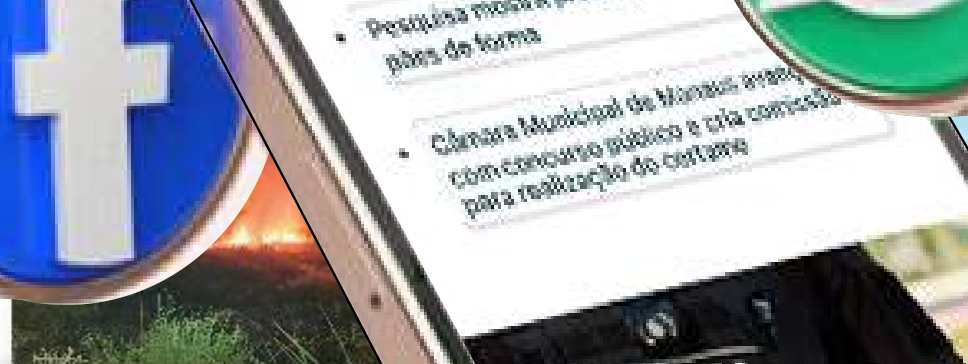
Bombeiros impedem propagação de incêndio em área de vegetação no interior do AM