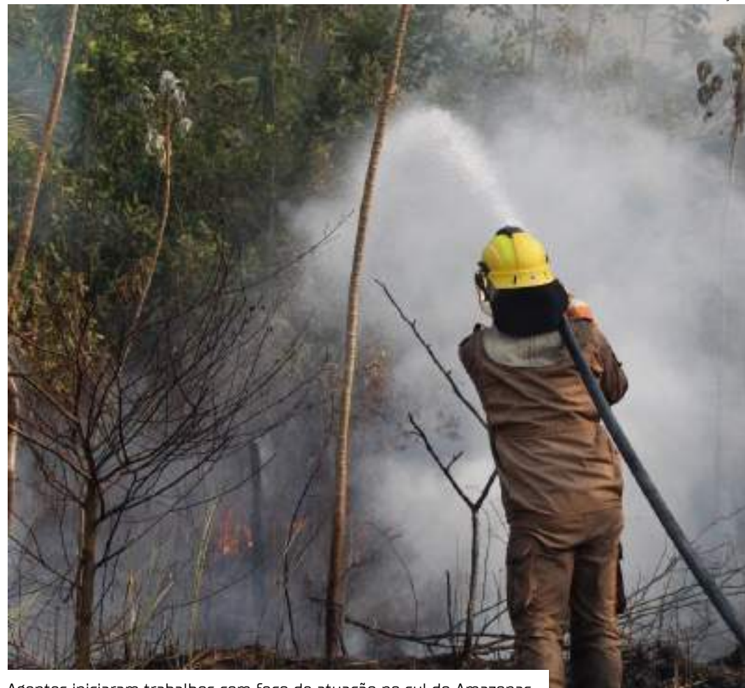
Agentes iniciaram trabalhos com foco de atuação no sul do Amazonas

"Esses brigadistas contratados já estão em campo atuando de forma conjunta e coordenada com nossas tropas de bombeiros nos municípios do sul do Amazonas. Esse reforço amplia a nossa capacidade operacional, combatendo mais rápido os sinistros em áreas de vegetação, evitando a propagação das chamas em larga escala", pontuou coronel Alexandre Freitas.