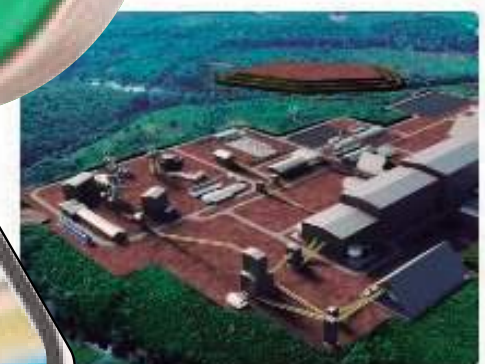
Lei proíbe presidente da Potássio de entrar em terra indígena no Amazonas