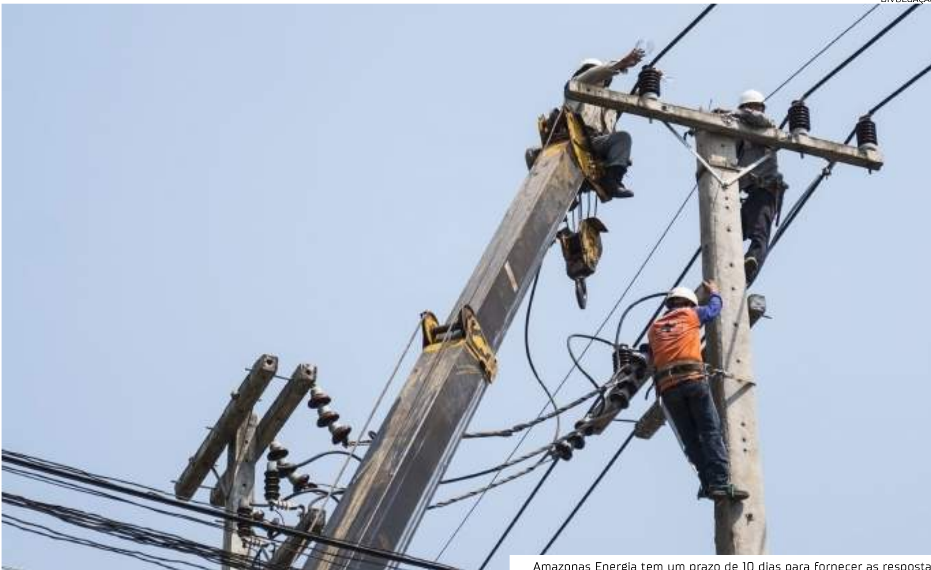
Amazonas Energia tem um prazo de 10 dias para fornecer as respostas