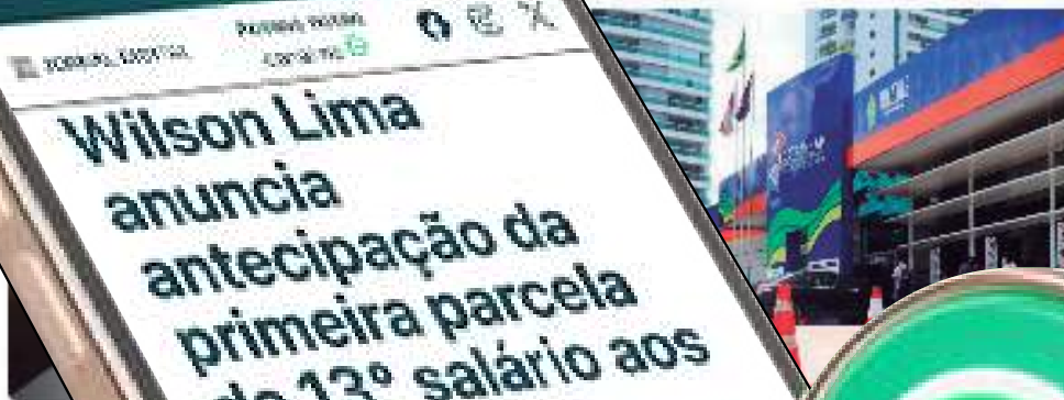
Wilson Lima anuncia antecipação da primeira parcela do 13º salário aos servidores estaduais