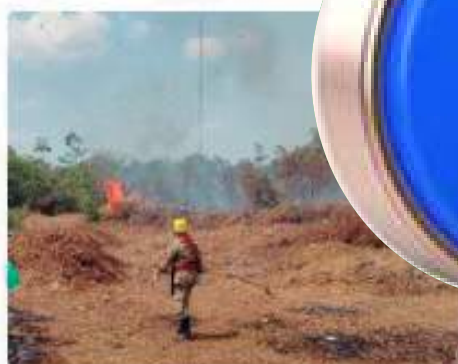
Bombeiros combatem 70 focos de incêndio em 24 horas no interior do AM