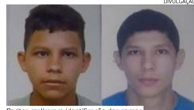
Peritos realizaram identificação dos corpos

A sede do Instituto Médico Legal fica localizada na avenida Noel Nutels, nº 300, no bairro Cidade Nova 2, na zona norte de Manaus.