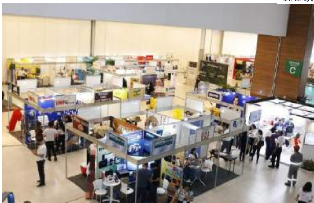
Expectativa é que cerca de 5 mil pessoas compareçam ao Centro de Convenções Vasco Vasques