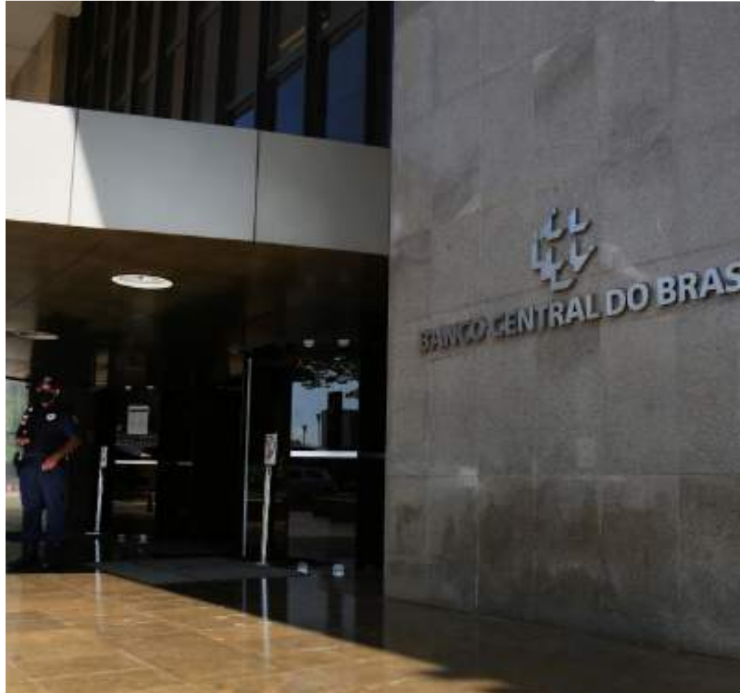
Boletim divulgado pelo BC mostra cenário positivo em 2024

Em julho, puxado principalmente pelos preços da gasolina, passagens de avião e energia elétrica, a inflação do país foi 0,38%, após ter registrado 0,21% em junho. De acordo com o IBGE, em 12 meses, o IPCA acumula 4,5%, no limite superior da meta de inflação.