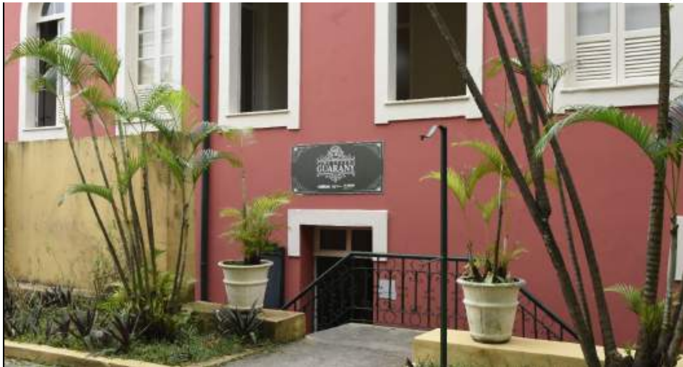
Filmes serão exibidos em versões originais com legendas em português