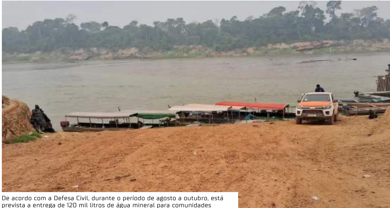
De acordo com a Defesa Civil, durante o período de agosto a outubro, está prevista a entrega de 120 mil litros de água mineral para comunidades

A região também permanece encoberta pela fumaça dos incêndios que atingem todo o