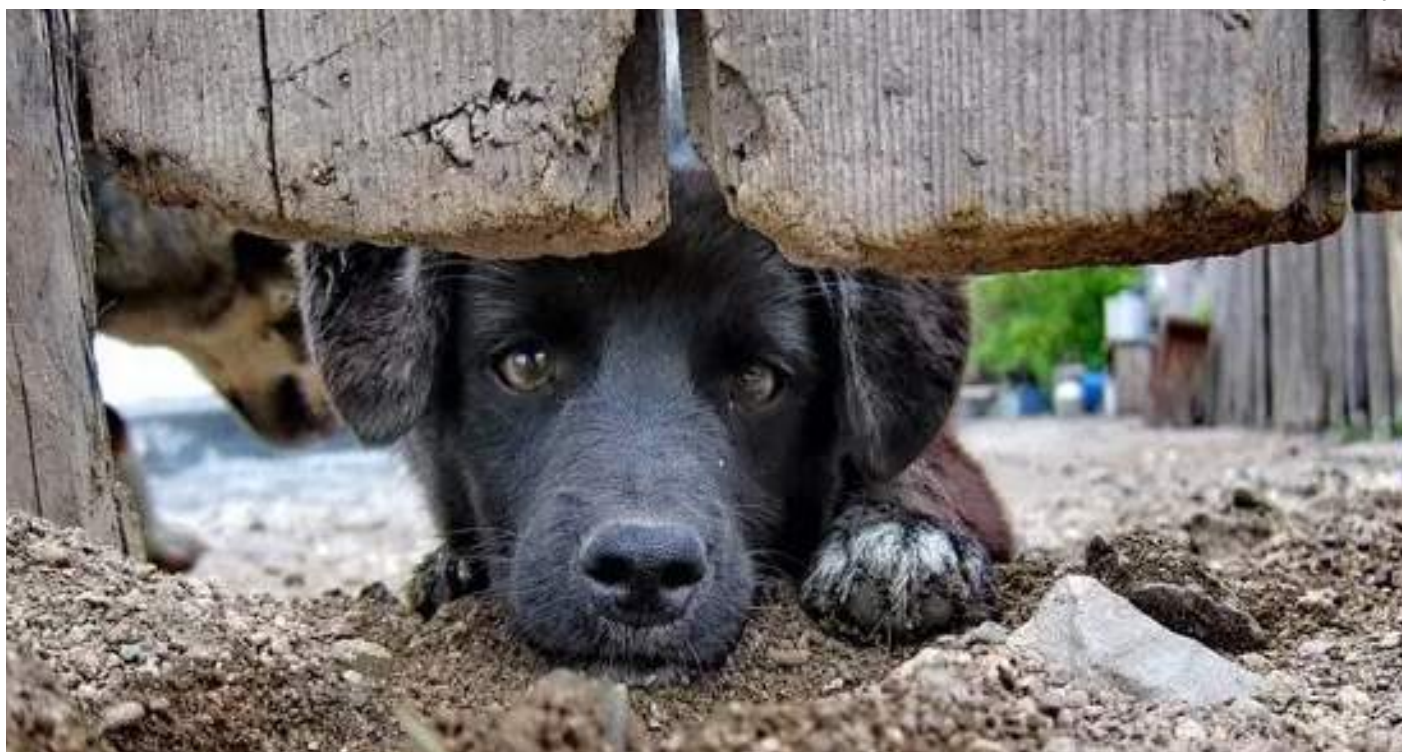
Multa aplicada pode chegar até R$ 1,8 mil e dobra caso haja reincidência

O texto ainda defende que o agressor só poderá ter a guarda de um animal doméstico após o decurso de cinco anos contados da agressão cometida, reiniciando-se a contagem do prazo se outra constatação de maus-tratos for apurada.