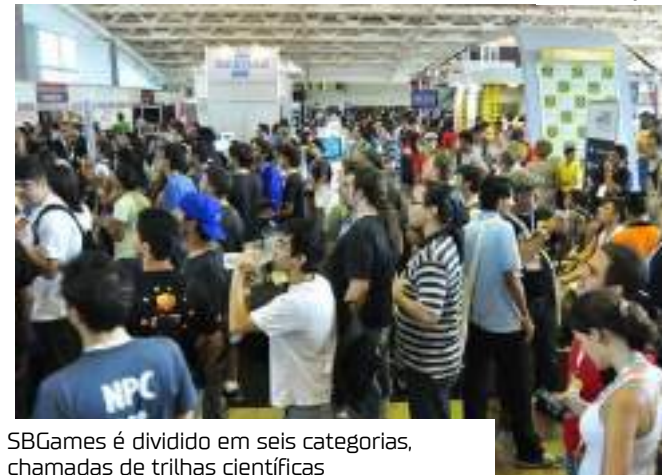
SBGames é dividido em seis categorias, chamadas de trilhas científicas