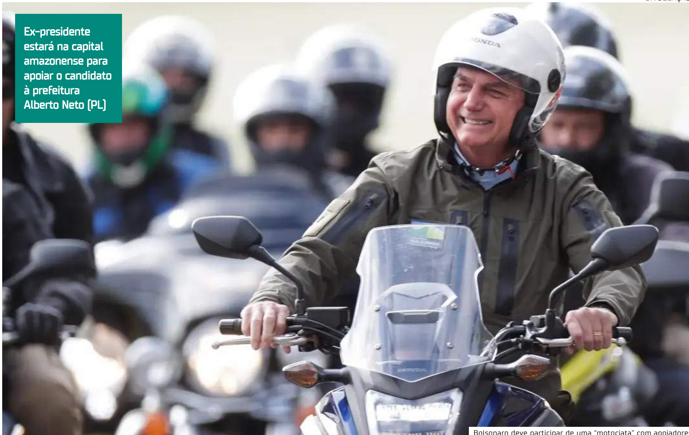
Bolsonaro deve participar de uma "motociata" com apoiadores

Ex-presidente estará na capital amazonense para apoiar o candidato à prefeitura Alberto Neto (PL)