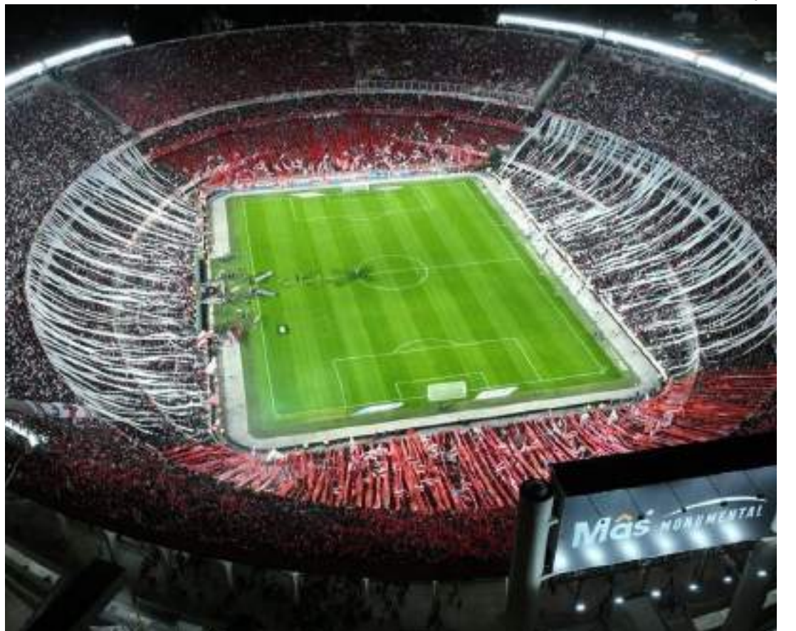
Estádio com mais preferência da Conmebol para receber a final é o Más Monumental, do River Plate