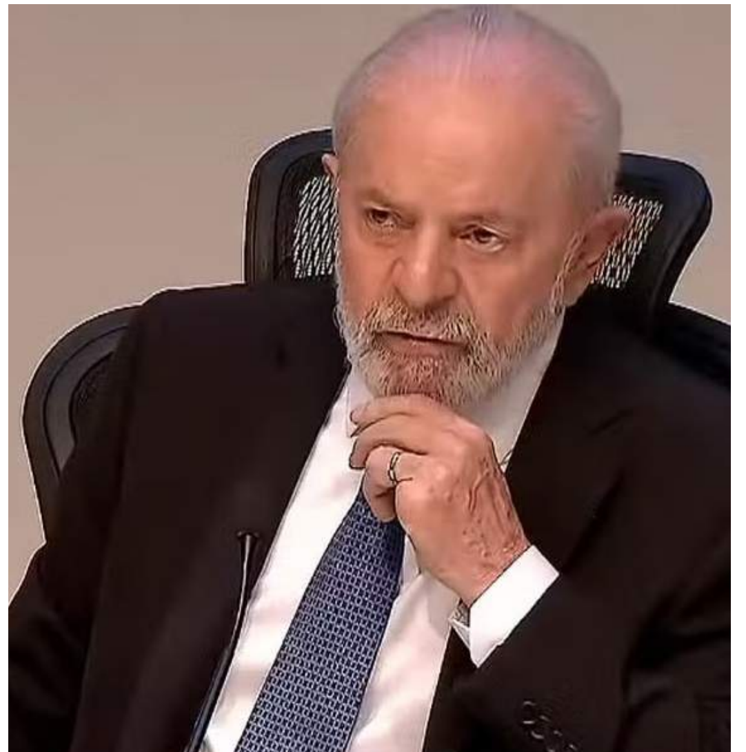
Lula visita o Amazonas para anunciar novas medidas de combate à seca

Além disso, a diminuição dos níveis dos rios compromete o transporte fluvial, dificultando o acesso a mercados e serviços essenciais, o que intensifica o isolamento das comunidades.