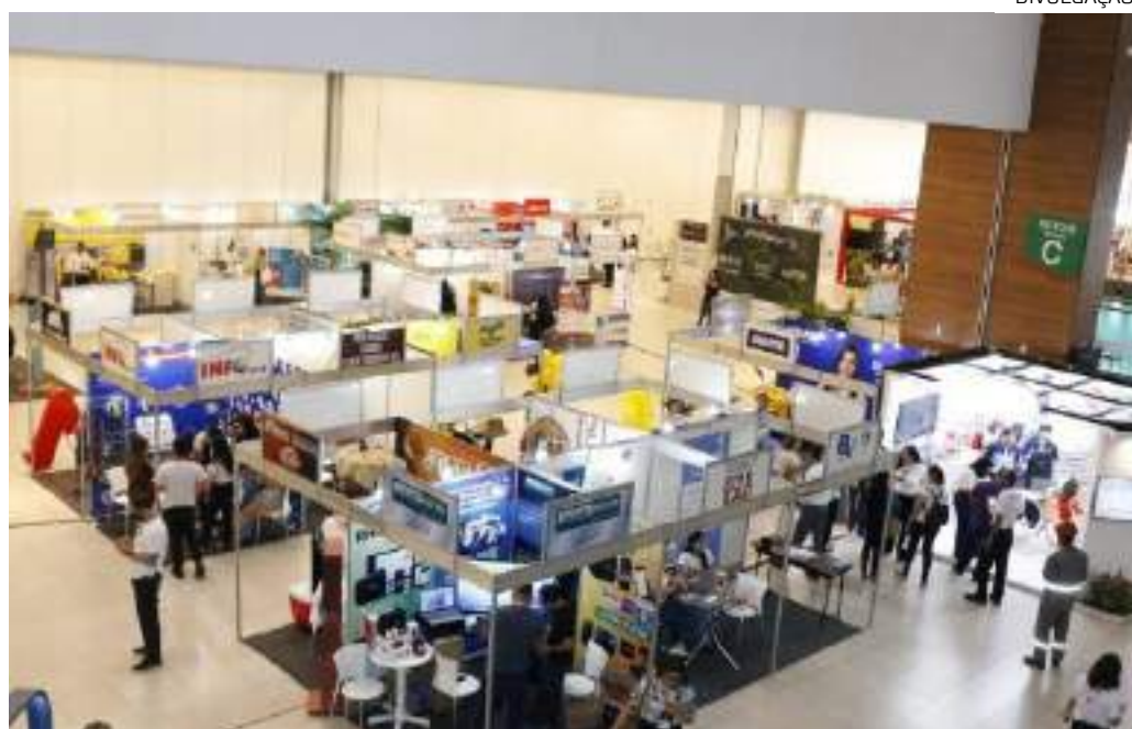
Expectativa é que cerca de 5 mil pessoas compareçam ao Centro de Convenções Vasco Vasques