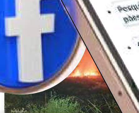
Bombeiros impedem propagação de incêndio em área de vegetação no interior do AM