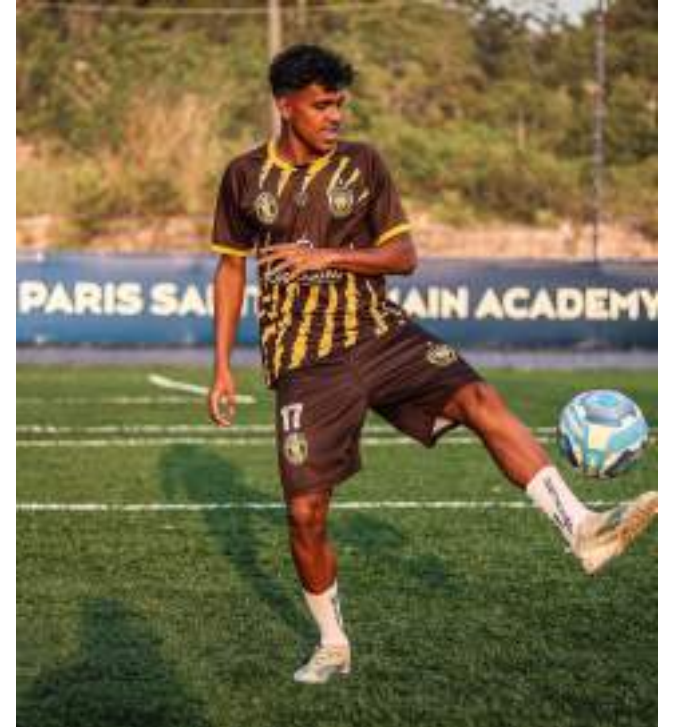
Jogadores vão ajudar o Sul América na disputa da Série B do Estadual