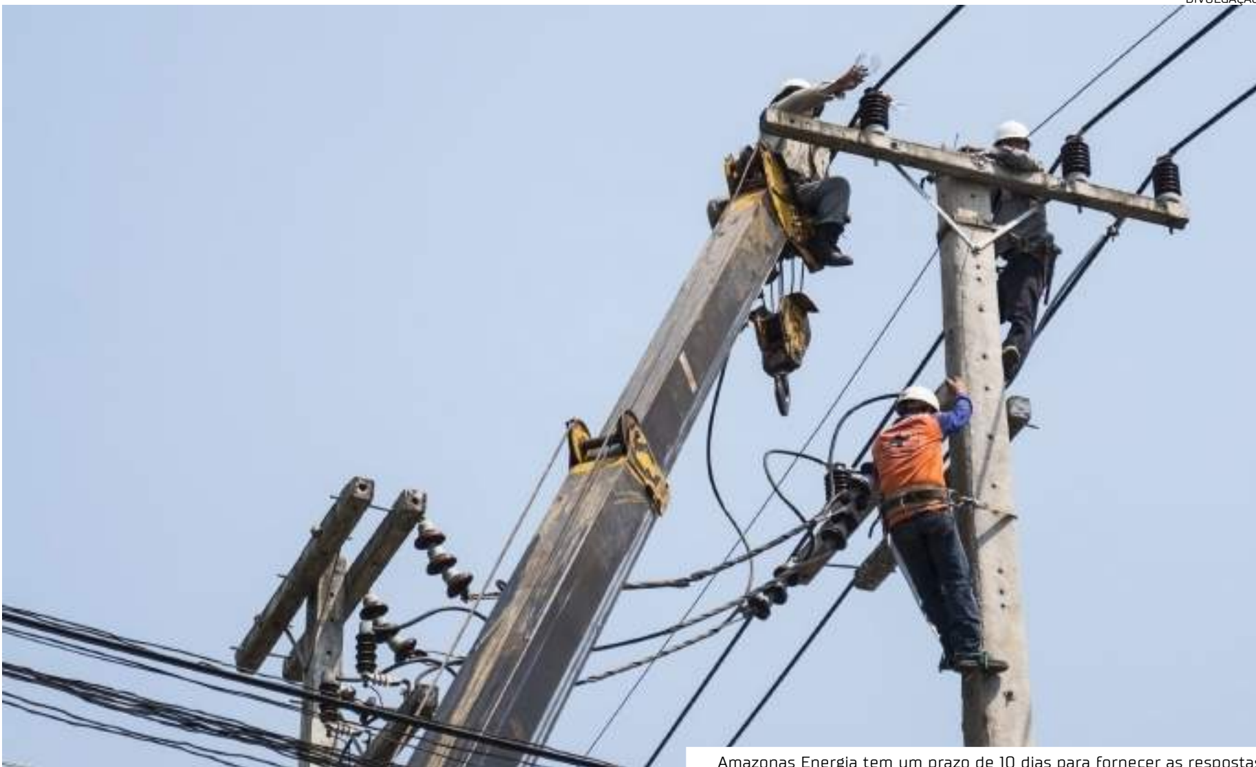
Amazonas Energia tem um prazo de 10 dias para fornecer as respostas