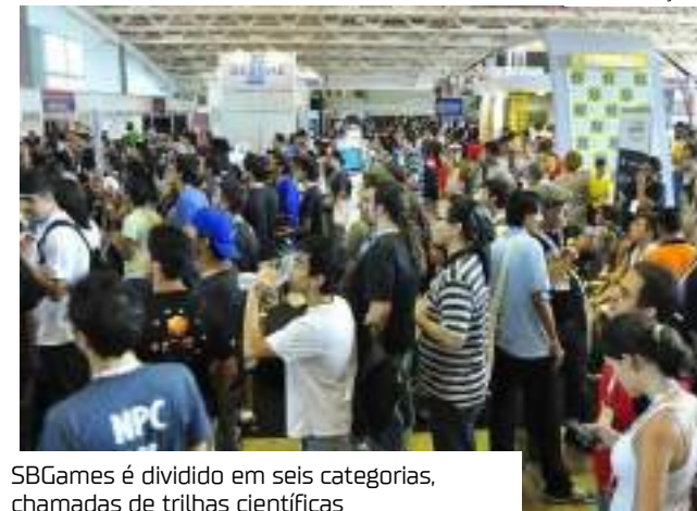
SBGames é dividido em seis categorias, chamadas de trilhas científicas