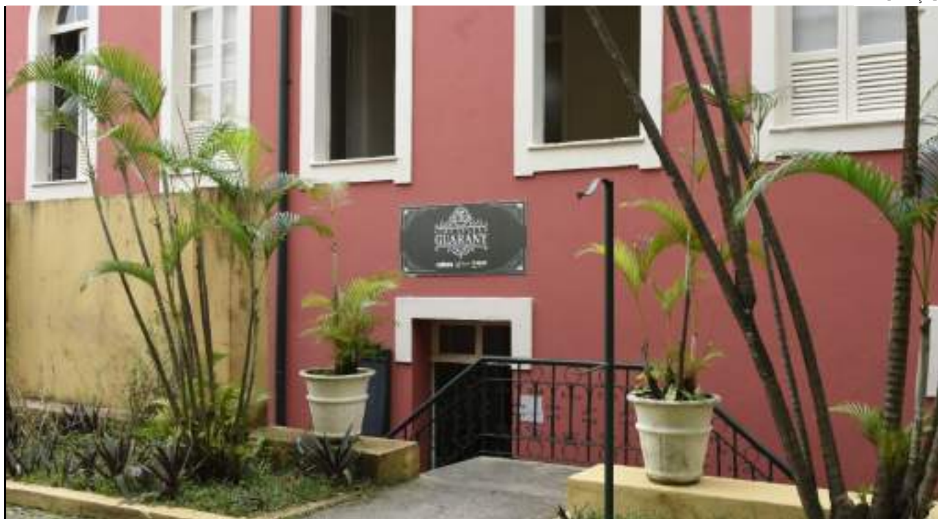
Filmes serão exibidos em versões originais com legendas em português