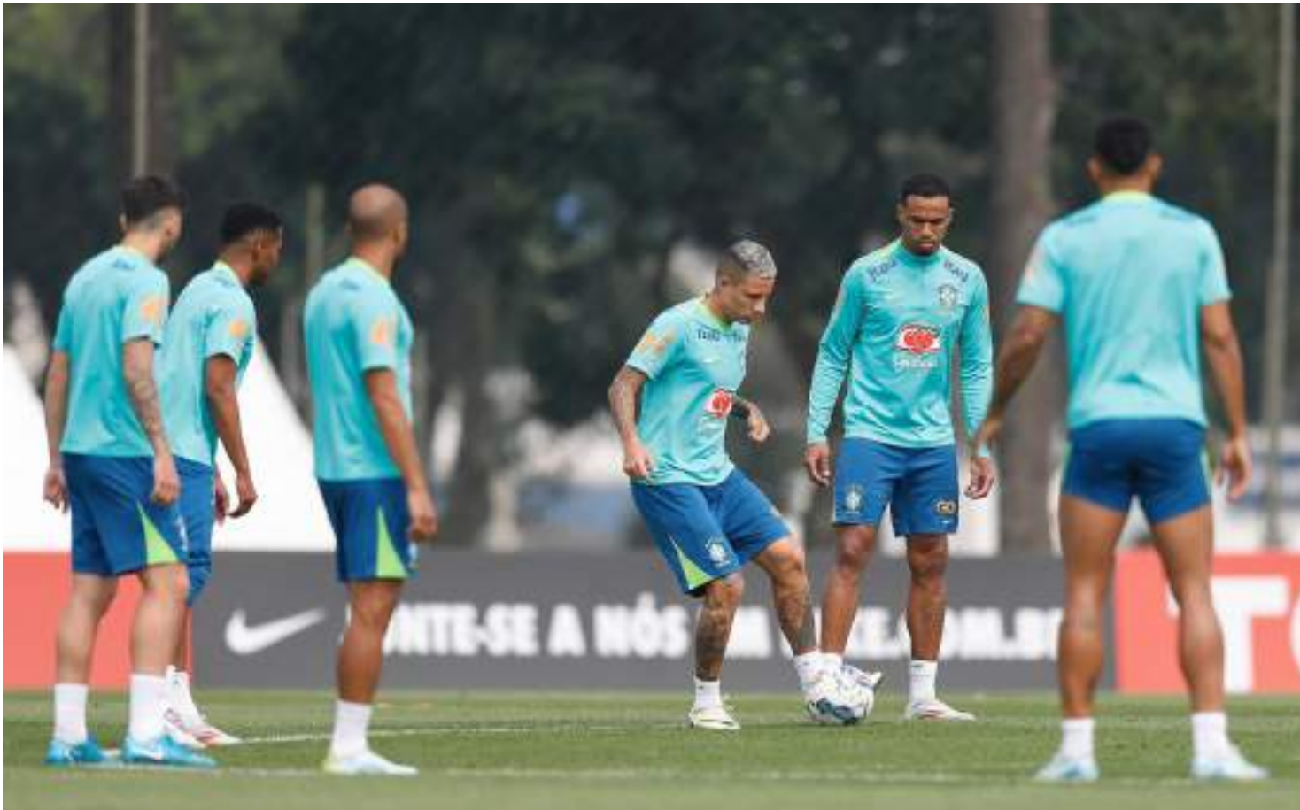
Com a vitória em Curitiba contra a Seleção do Equador, a Seleção Brasileira pulou para quarto lugar com dez pontos nas Eliminatórias