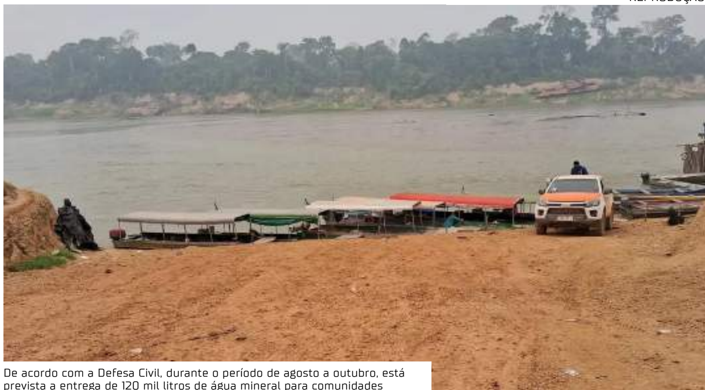
De acordo com a Defesa Civil, durante o período de agosto a outubro, está prevista a entrega de 120 mil litros de água mineral para comunidades

A região também permanece encoberta pela fumaça dos incêndios que atingem todo o