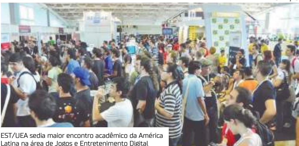
EST/UEA sedia maior encontro acadêmico da América Latina na área de Jogos e Entretenimento Digital