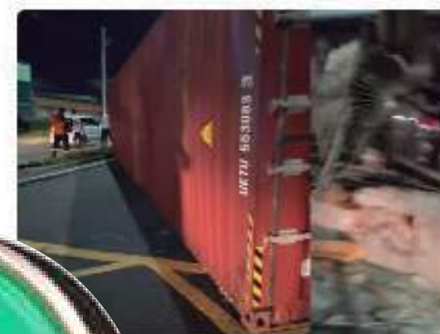
Trator tomba e atinge casa e carros na Manaus; VÍDEO