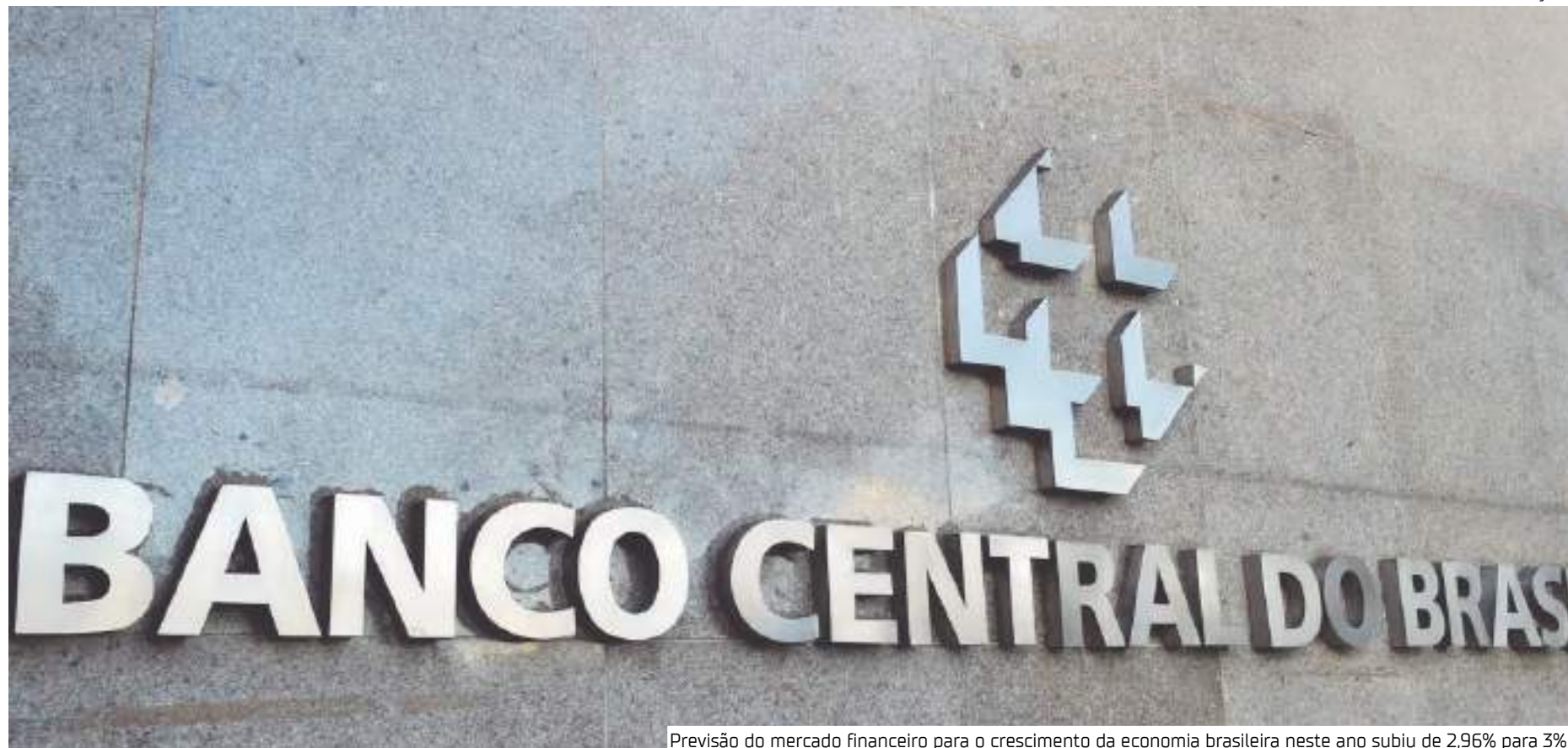
Previsão do mercado financeiro para o crescimento da economia brasileira neste ano subiu de 2,96% para 3%

A previsão de cotação do dólar está em R$ 5,40 para o fim deste ano. No fim de