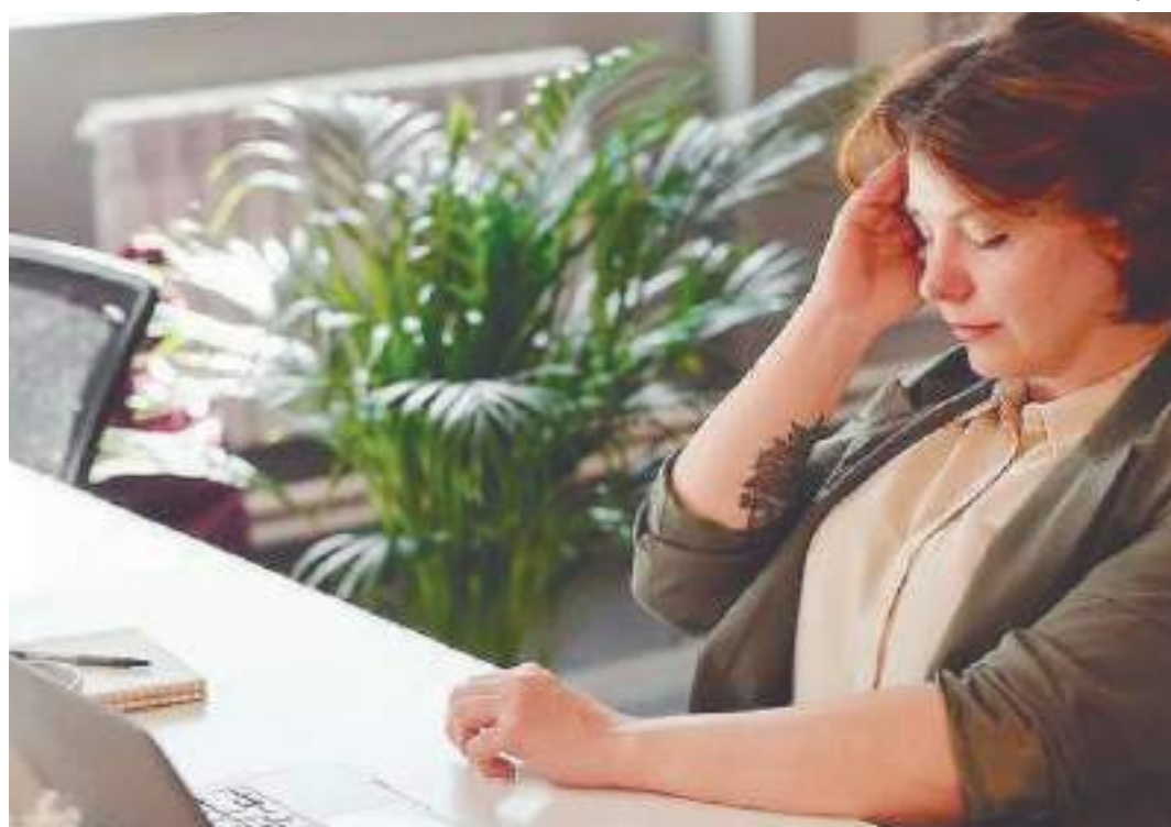
Brasil ficou entre os quatro países da América Latina com mais raiva e tristeza

mento da precarização é um fator relacionado por especialistas a vulnerabilidades, pois interrompe a continuidade da proteção ao trabalhador.