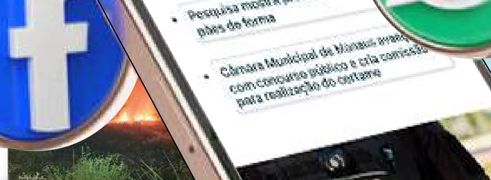
Bombeiros impedem propagação de incêndio em área de vegetação no interior do AM