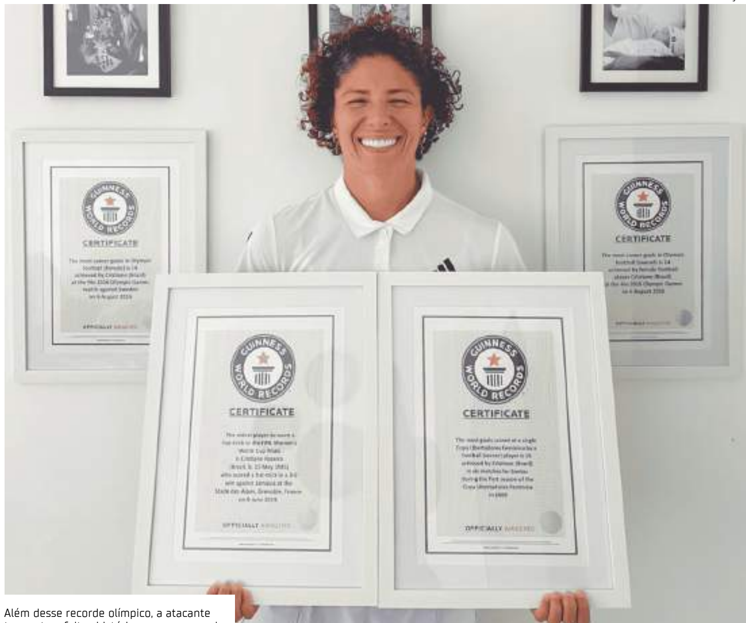
Além desse recorde olímpico, a atacante tem outros feitos históricos em sua carreira

Além desse recorde olímpico, a atacante tem outros feitos históricos em sua carreira. Cristiane também detém o título de maior artilheira do futebol feminino em Jo-