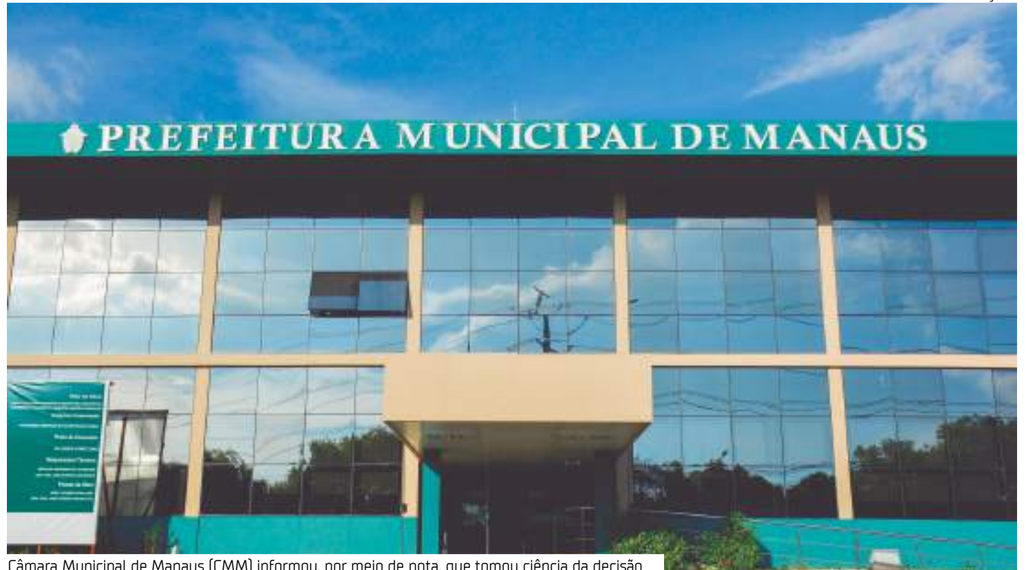
Câmara Municipal de Manaus (CMM) informou, por meio de nota, que tomou ciência da decisão

O desembargador disse que é razoável a alegação de que as CPIs foram "constituídas ao arrepio do que disciplina o ordenamento jurídico. Tem-se por evidenciado a suscitada ofensa ao devido processo legal que macula de nulidade todos os atos porventura praticados,