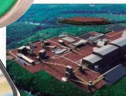
Justiça proíbe presidente da Potássio de entrar em terra indígena no Amazonas