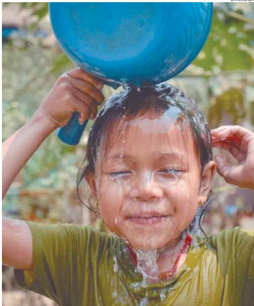
Crianças e adolescentes sofrem com mudanças climáticas