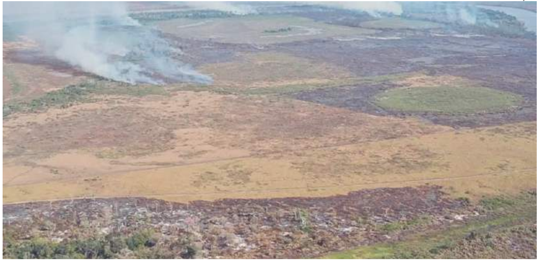
No Amazonas e no Mato Grosso do Sul, as emissões por incêndios, neste ano, atingiram 28 milhões e 15 milhões de toneladas, respectivamente

No Amazonas e no Mato Grosso do Sul, as emissões