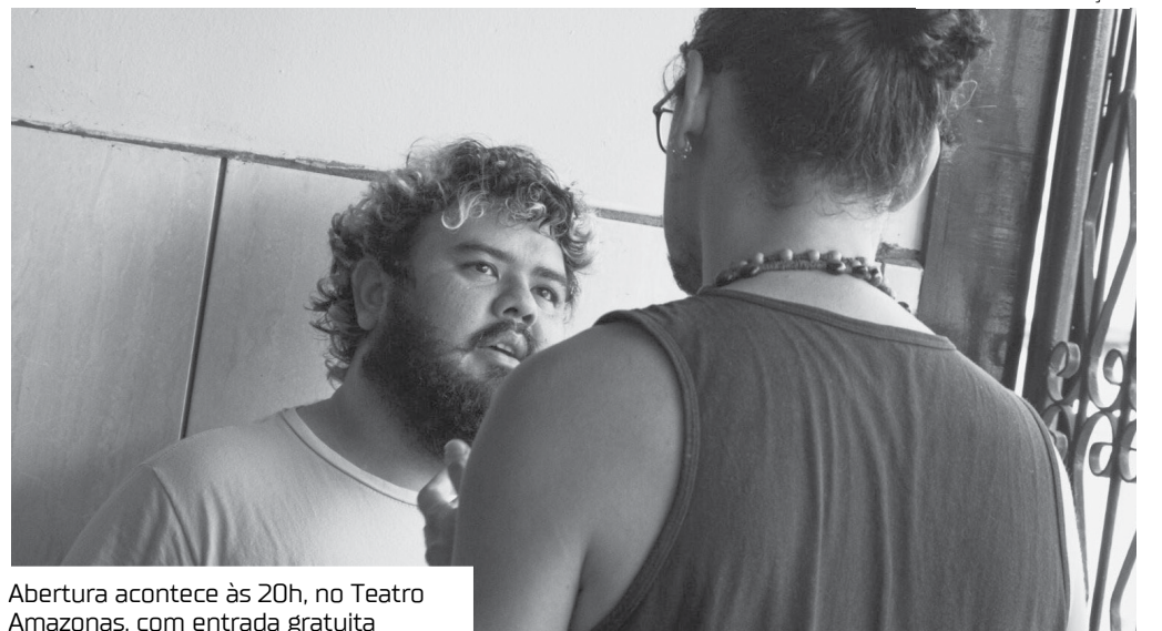
Abertura acontece às 20h, no Teatro Amazonas, com entrada gratuita