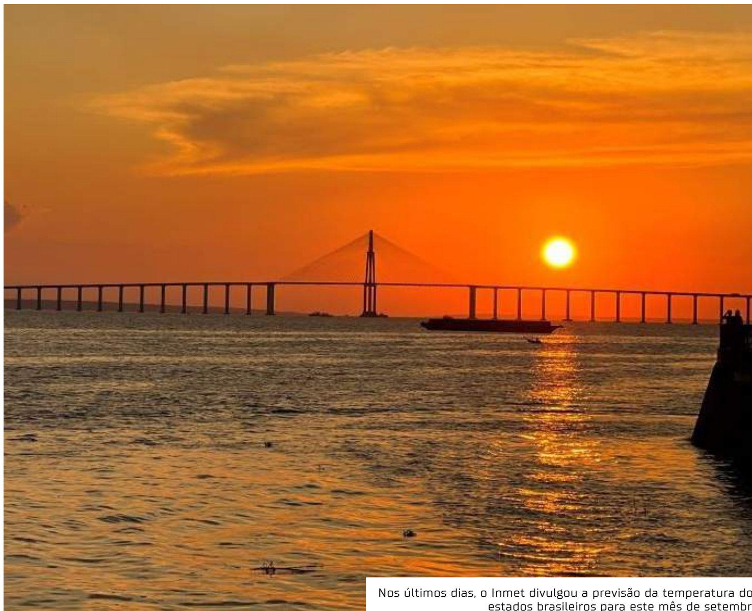
Nos últimos dias, o Inmet divulgou a previsão da temperatura dos estados brasileiros para este mês de setembro

Já em algumas localidades da Paraíba, Pernambuco, Alagoas, Sergipe e Bahia, as temperaturas