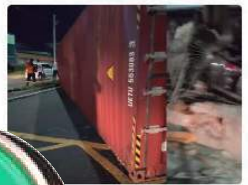
Truck tomba e atinge casa e carros na Manaus; VÍDEO