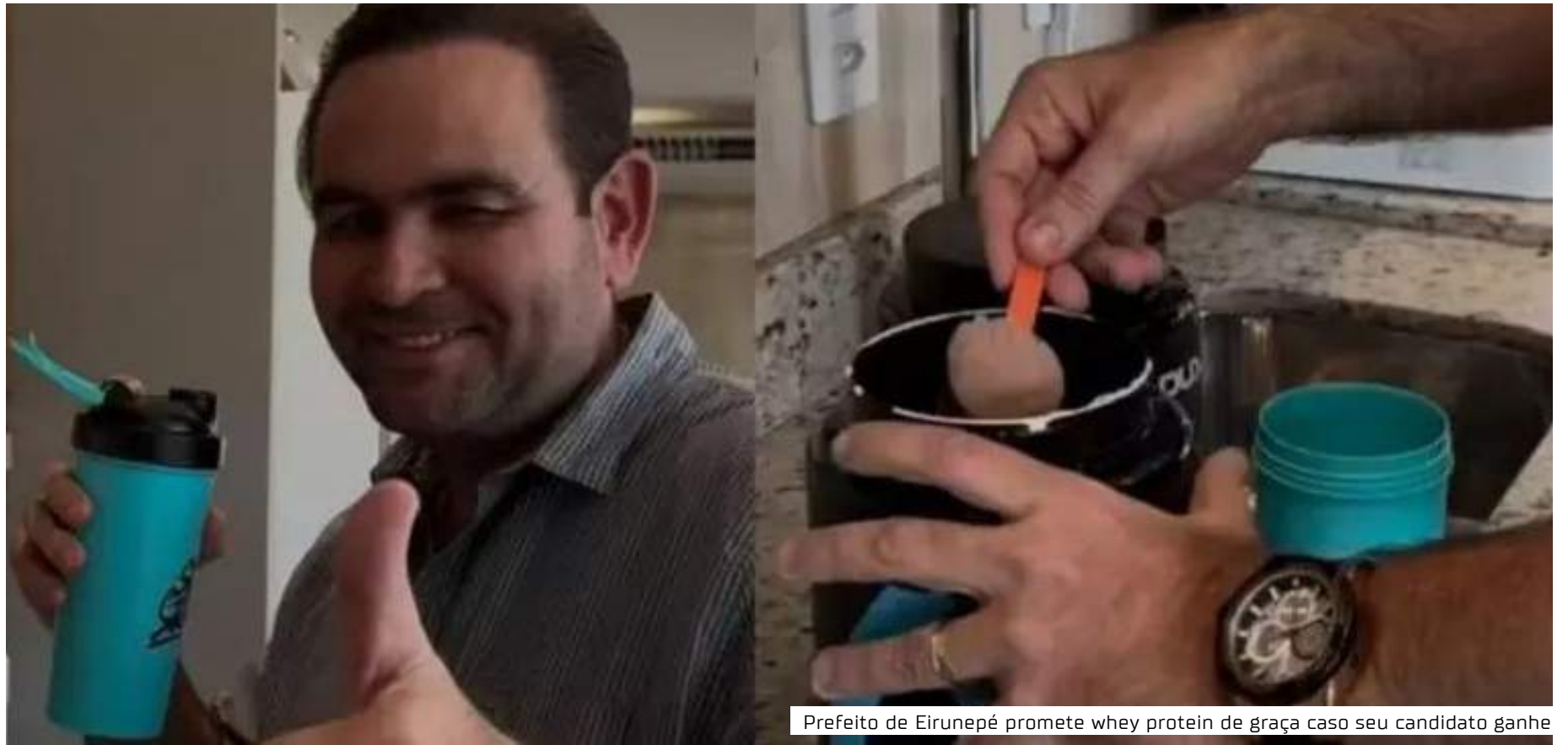
Prefeito de Eirunepé promete whey protein de graça caso seu candidato ganhe

Além de academia isenta de cobrança para os moradores, o político afirmou que o projeto também prevê Whey Protein sem custos. "É mais, além dos