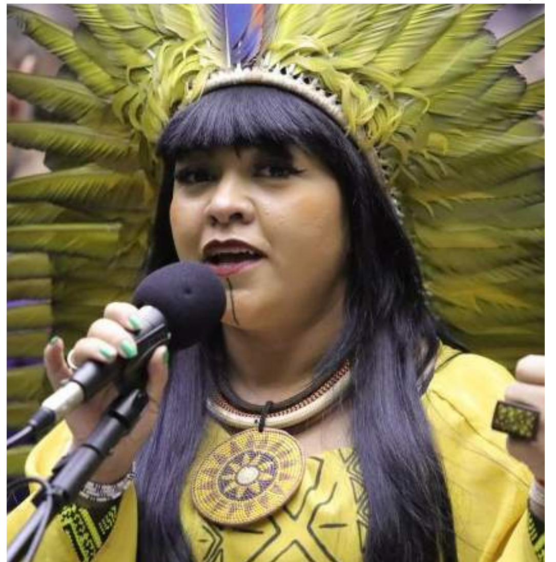
Deputada Célia Xakriabá recomendou a aprovação da proposta

O projeto tramita em caráter conclusivo e ainda será analisado pelas comissões da Amazônia e dos Povos Originários e Tradicionais; e de Constituição e Justiça e de Cidadania. Para virar lei, também terá de ser aprovado pelo Senado.