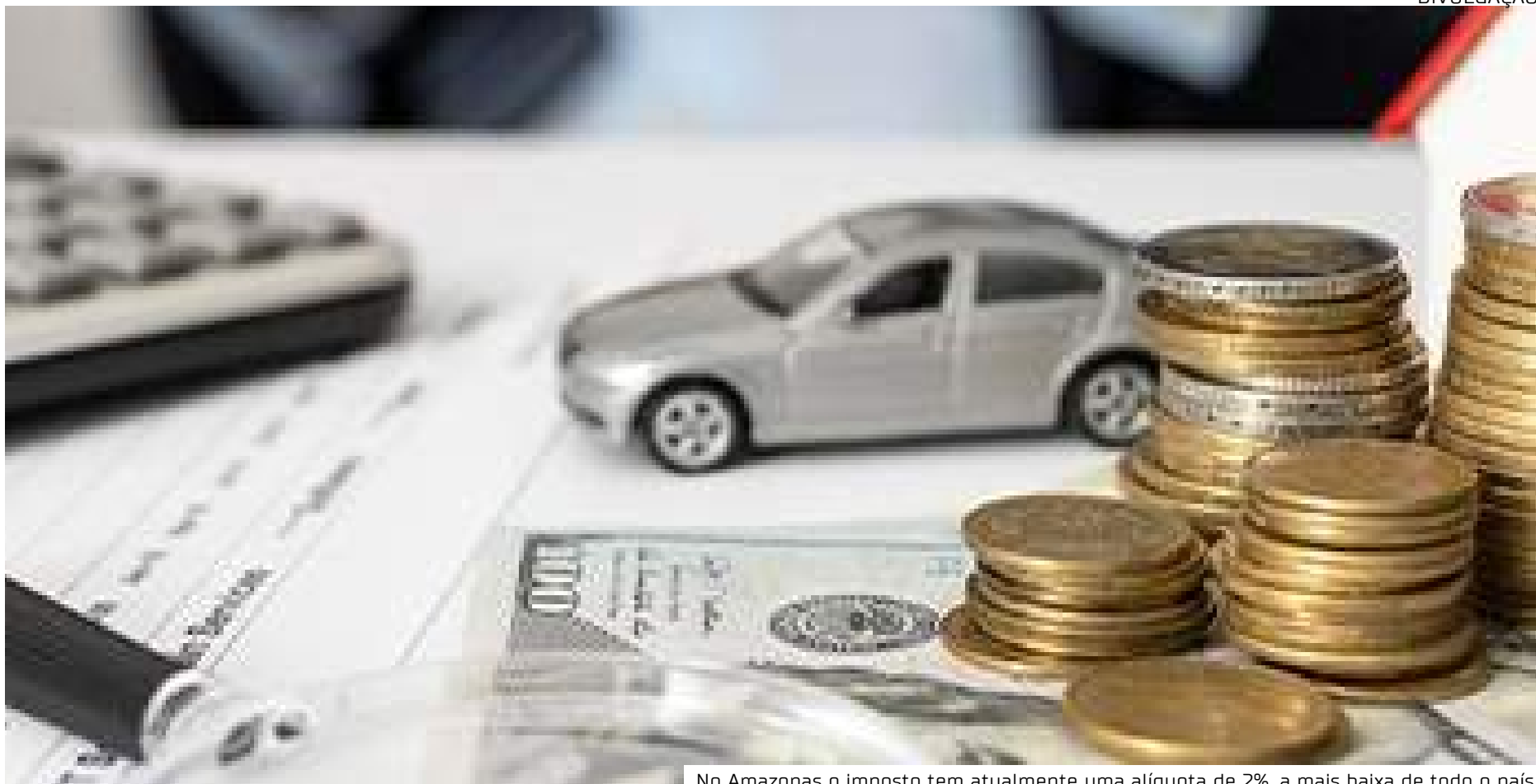
No Amazonas o imposto tem atualmente uma alíquota de 2%, a mais baixa de todo o país

“Com a reforma, o Amazonas, que ainda não prevê progressividade nas suas alíquotas, será obrigado a fazê-lo. Além disso, o estado também passará a ter a possibilidade de tributar heranças e doações recebidas no exterior. Hoje cada unidade da Federação é livre para estabelecer quaisquer alíquotas até o limite de 8% estabelecido pelo Senado, mas o Projeto de Lei Complementar 108/2024, prevê que os estados regulamentem o que