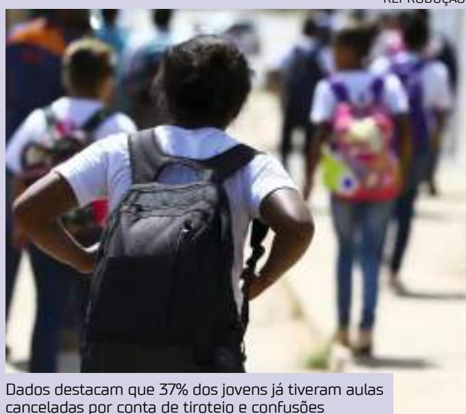
Dados destacam que 37% dos jovens já tiveram aulas canceladas por conta de tiroteio e confusões

Nesta edição, o levantamento, que aconteceu entre julho e setembro de 2023, entrevistou 420 crianças de 8 a 17 anos matriculadas em escolas públicas de 12 municípios e 7 cidades do Brasil, entre eles, São Paulo (SP), Salvador (BA), Fortaleza