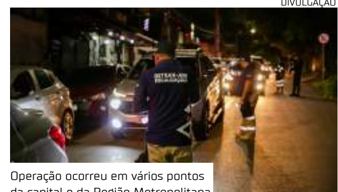
Operação ocorreu em vários pontos da capital e da Região Metropolitana

Ainda de acordo com ele, 17 condutores se recusaram a passar pelo Teste do Etilômetro, que mede a concentração de álcool etílico no organismo, popularmente conhecido como “Bafômetro”.