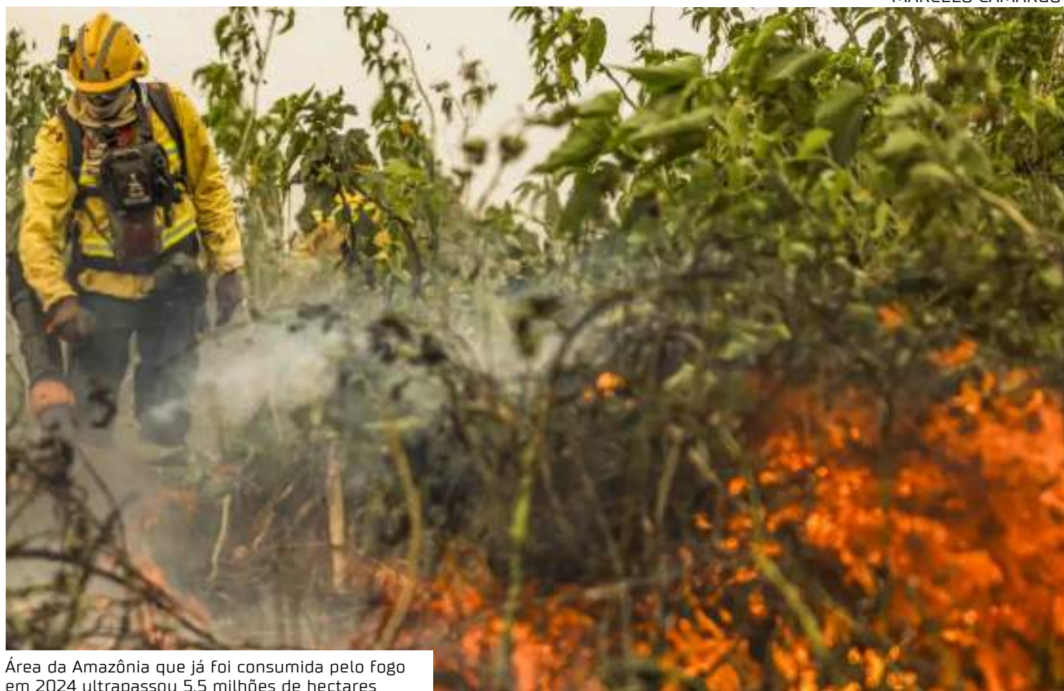
Área da Amazônia que já foi consumida pelo fogo em 2024 ultrapassou 5,5 milhões de hectares

O MMA informou que atualmente atuam na Amazônia 1.468 brigadistas do Instituto Brasileiro do Meio Ambiente e dos Recursos Naturais Renováveis (Ibama) e do Instituto Chico Mendes de Con-