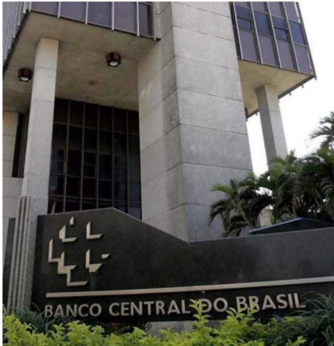
Pesquisa divulgada pelo Banco Central aponta para um cenário de crescimento

Para alcançar a meta de inflação, o Banco Central usa como principal instrumento a taxa básica de juros, a Selic, definida em 10,5% ao ano pelo Comitê de Política Monetária (Copom). Diante de um ambiente externo adverso e do aumento das incertezas econômicas, na última reunião no fim de julho, o BC decidiu pela manutenção da Selic, pela segunda vez seguida, após um ciclo de sete reduções que foi de agosto de 2023 a maio de 2024.