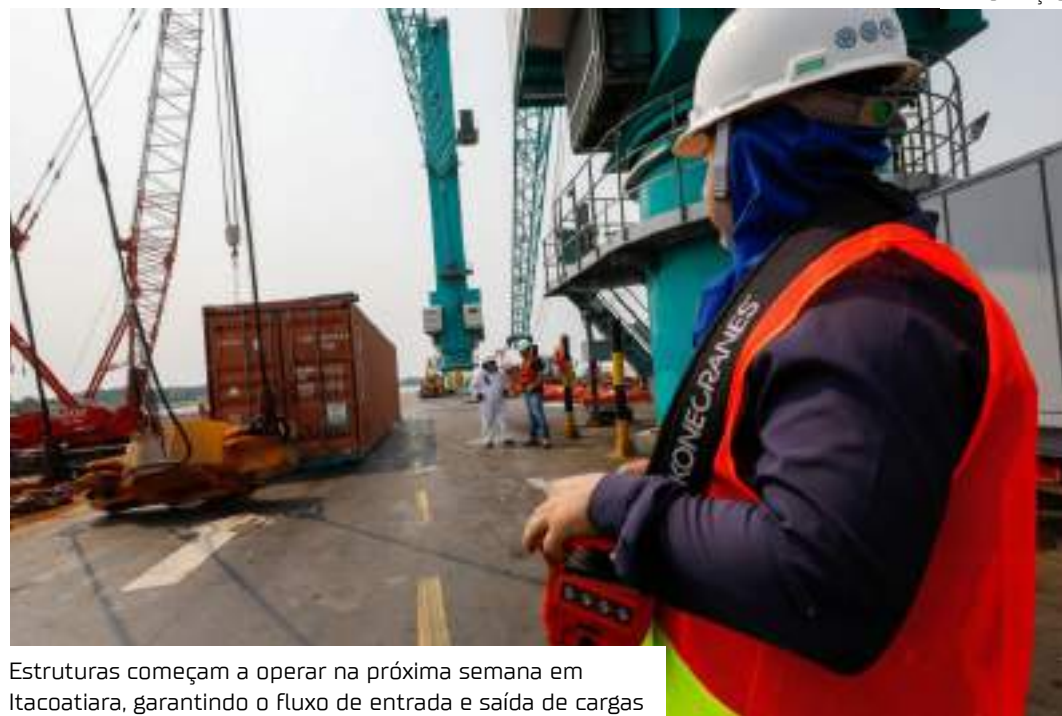
Estruturas começam a operar na próxima semana em Itacoatiara, garantindo o fluxo de entrada e saída de cargas

“Esse trabalho iniciou com a Sedecti em janeiro, quando a gente começou a mitigar os riscos, caso não houvesse as dragagens em tempo hábil. Em investimentos realizados, adquirimos novos guindastes para Manaus