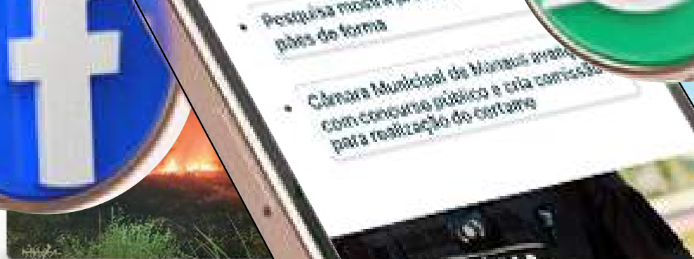
Bombeiros impedem propagação de incêndio em área de vegetação no interior do AM