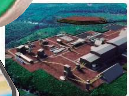
Lei proíbe presidente da Potássio de entrar em terra indígena no Amazonas