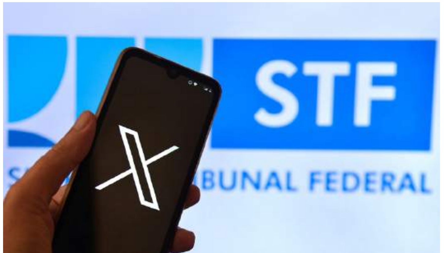
Primeira Turma do STF é unânime e X continuará bloqueado no Brasil

Para o ministro, encontram amparo legal tanto a suspensão temporária da plataforma, quanto a proibição – também temporária – da utilização de outros meios tecnológicos para