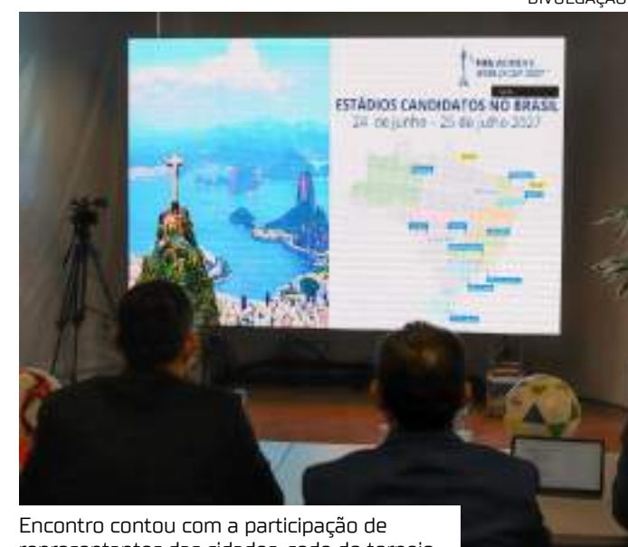
Encontro contou com a participação de representantes das cidades-sede do torneio

“Você analisa a Copa que foi realizada na Austrália e Nova Zelândia, um sucesso absurdo. Imagina no Bra-