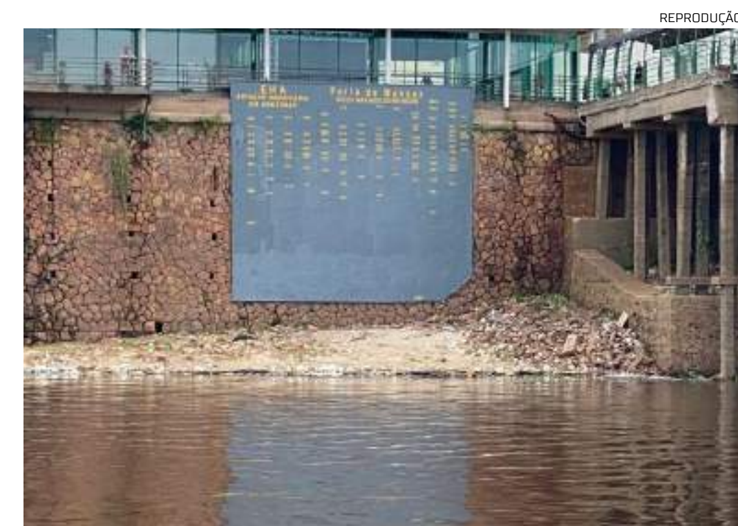
Estiagem do Rio Negro ganhou mais força neste mês de setembro