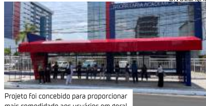
Projeto foi concebido para proporcionar mais comodidade aos usuários em geral