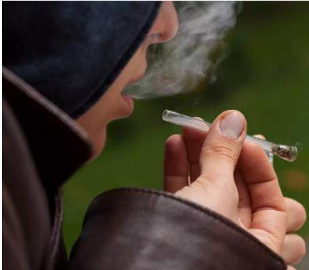
Proposta que pune usuários de drogas está em discussão na Câmara dos Deputados

A proposta será analisada, em caráter conclusivo, pelas comissões de Segurança Pública e Combate ao Crime Organizado; de Finanças e Tributação; e de Constituição e Justiça e de Cidadania. Para virar lei, o texto precisa ser aprovado pela Câmara e pelo Senado