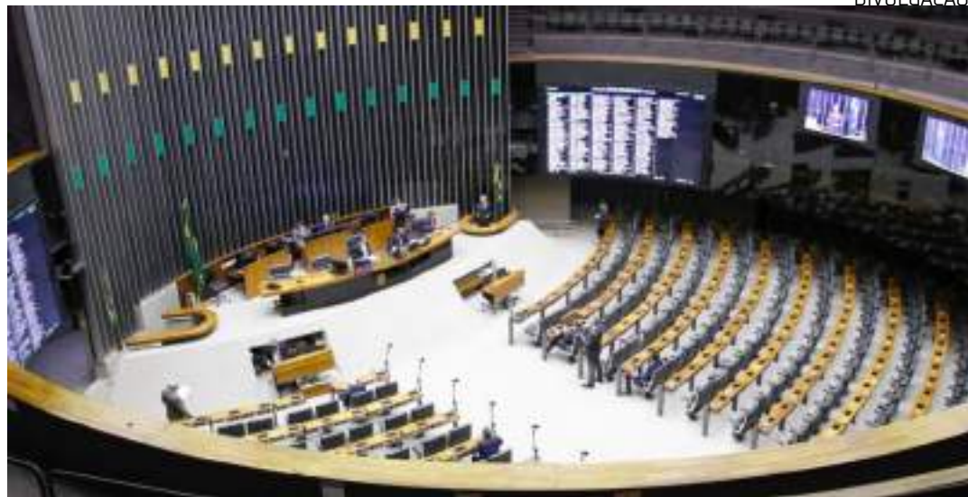
Partidos não fizeram indicações e não houve sequer instalação na Câmara

Integrantes da oposição afirmam que a proposta abre brecha para censura por limitar a liberdade de expressão. O mesmo argumento é usado contra o PL das Fake News na Câmara. Além disso, o setor industrial pressiona por regras menos rígidas e