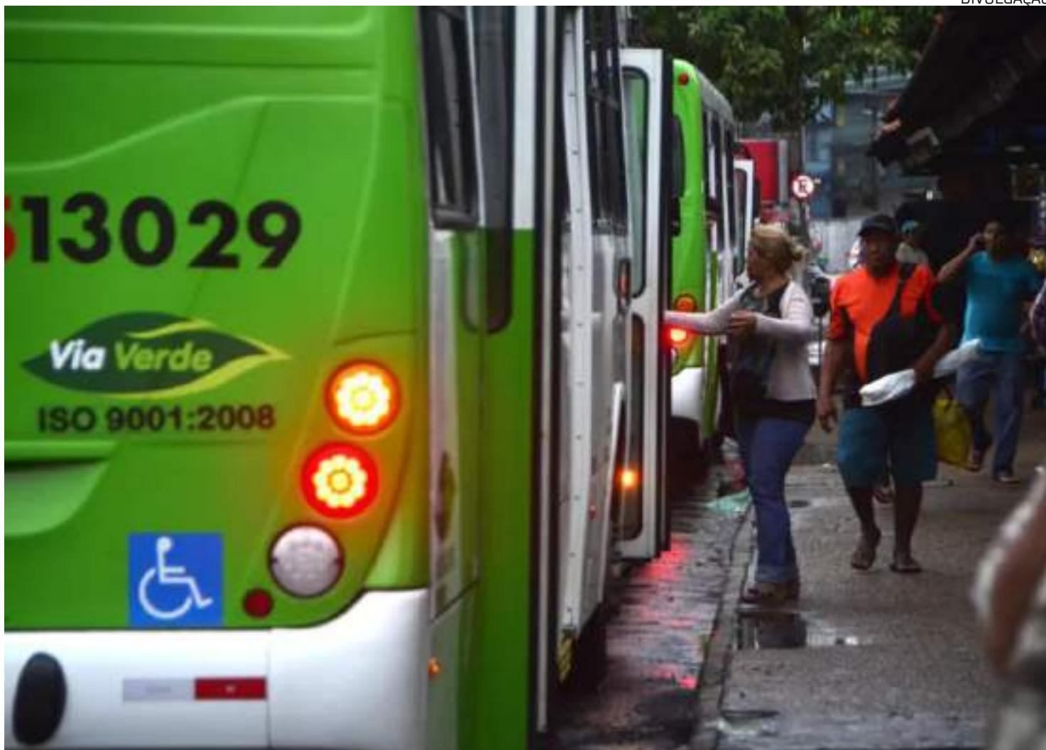
Gratuidade do transporte durante a votação foi pauta do Executivo municipal aprovada na última quarta-feira (25)

Não está prevista a interdição de ruas ou avenidas situadas nas zonas eleitorais, nem alteração