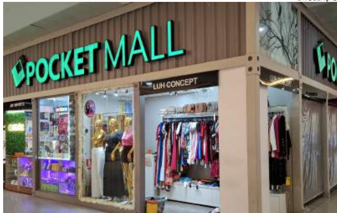
Iniciativa visa criar oportunidade de crescimento e apoio aos negócios locais

"Participar do 'Pocket Mall' foi um ponto de virada para nós. A visibilidade e o suporte oferecido pelo Shopping Grande Circular foram fundamentais para crescer e alcançar novos públicos. Estamos empolgados com as