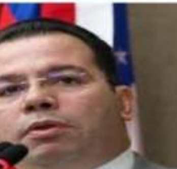
Pesquisas eleitorais podem acabar influenciando o eleitor