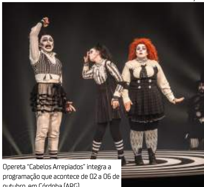
Opereta "Cabelos Arrepiados" integra a programação que acontece de 02 a 06 de outubro, em Córdoba (ARG)

"Depois de conhecer nosso trabalho, a curadoria do Festival nos procurou para fazer o convite. Fica-