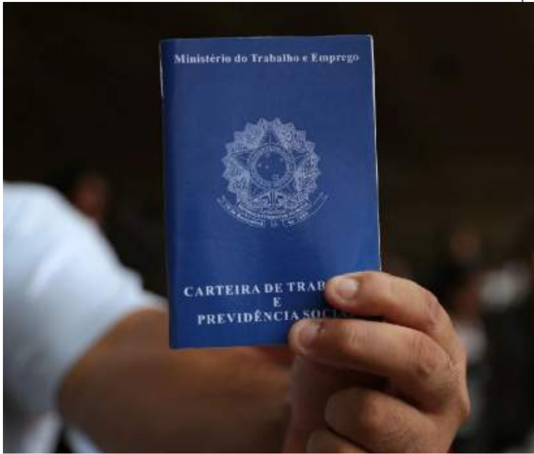
Desocupação recua a 6,6%, e população ocupada renova recorde (102,5 milhões)

O percentual não bateu recorde, mas se aproximou dos maiores patamares da série. Considerando somente os tri-