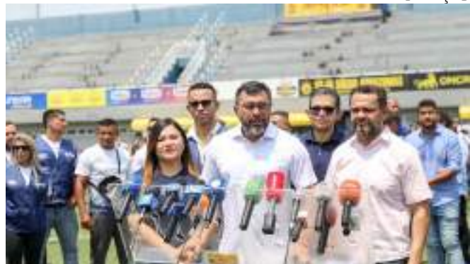
Espaço recebeu jogos do Amazonas FC na atual Série B do Brasileiro