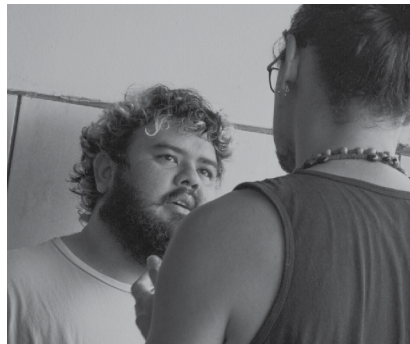
Abertura acontece às 20h, no Teatro Amazonas, com entrada gratuita

O Festival de Cinema da Amazônia – Olhar do Norte chega a sexta edição nesta terça-feira (24). A abertura acontece às 20h, no Teatro Amazonas (Largo de São Sebastião, no Centro), com exibição dos filmes “Ri, Bola”, do diretor Diego Bauer, do Amazonas; e “O Dia Que Te Conheci”, de André Novais Oliveira, de Minas Gerais. A entrada é gratuita.