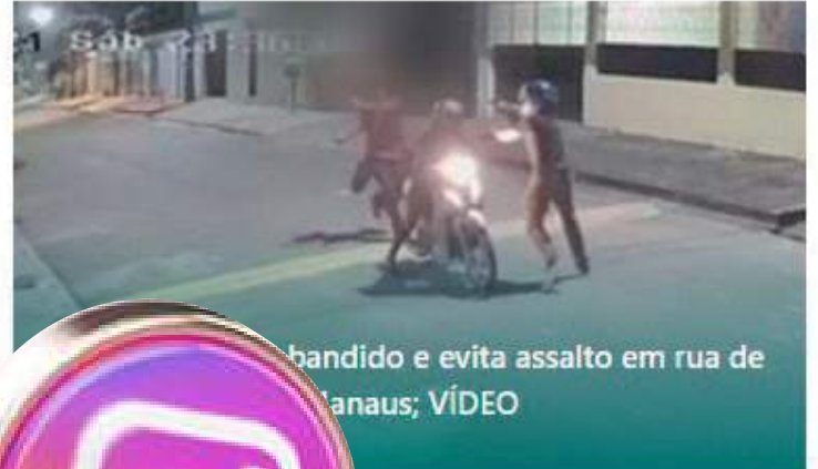
bandido e evita assalto em rua de Manaus; VÍDEO