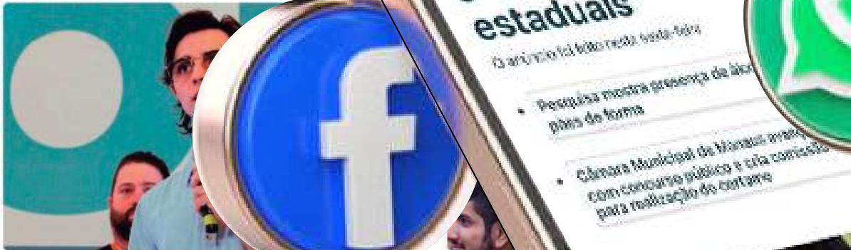
Federação PSDB-Cidadania anuncia convenção para o Clube do Trabalhador, em Manaus