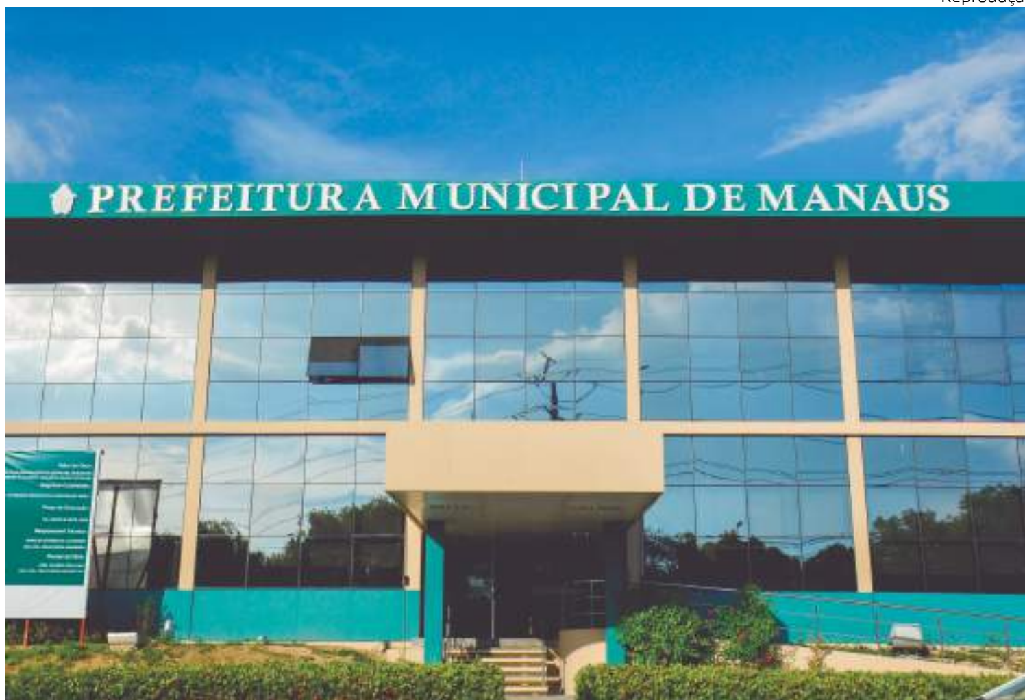
Câmara Municipal de Manaus (CMM) informou, por meio de nota, que tomou ciência da decisão