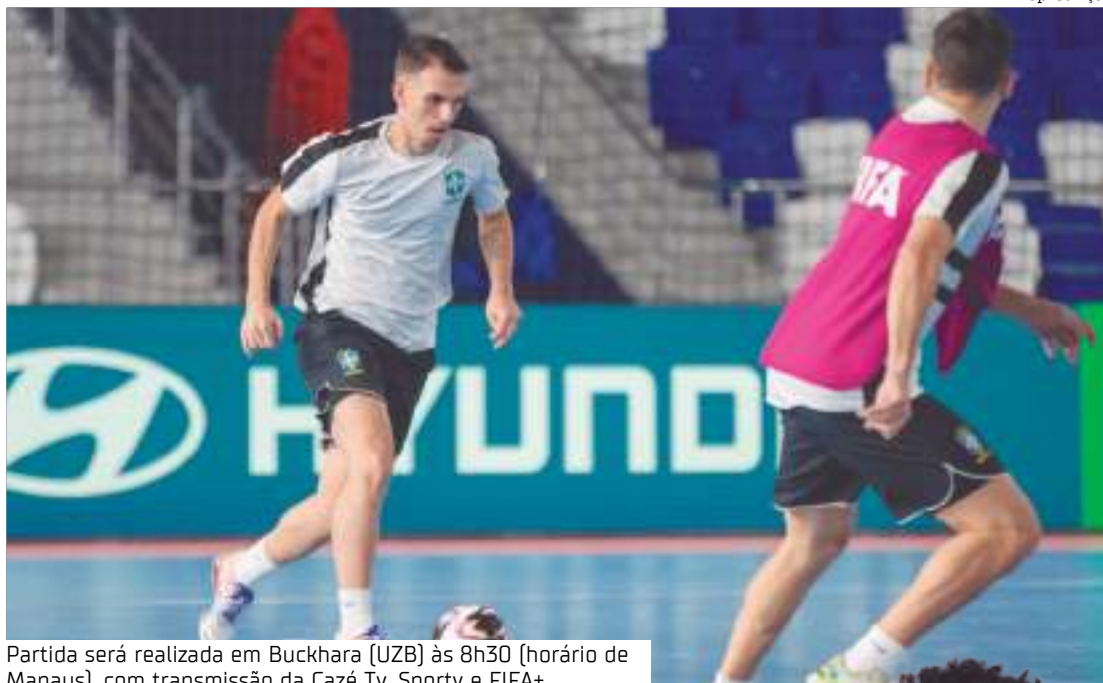
Partida será realizada em Bukhara (UZB) às 8h30 (horário de Manaus), com transmissão da Cazé Tv, Sportv e FIFA+

Recentemente, as duas seleções se enfrentaram em amistosos em dezembro do ano passado, com o Brasil saindo vitorioso em ambos: 7 a 1 e 7 a 2. Guitta também comentou sobre o estilo de jogo da