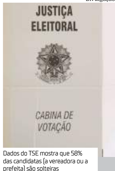
Dados do TSE mostra que 58% das candidatas (a vereadora ou a prefeita) são solteiras

Mais da metade das mulheres candidatas nas eleições municipais deste ano não é casada. Segundo dados disponibilizados pelo Tribunal Superior Eleitoral (TSE), 58% das candidatas (a vereadora ou a prefeita) são solteiras, divorciadas ou viúvas. Entre os homens o número praticamente se inverte, 55% se declaram casados.