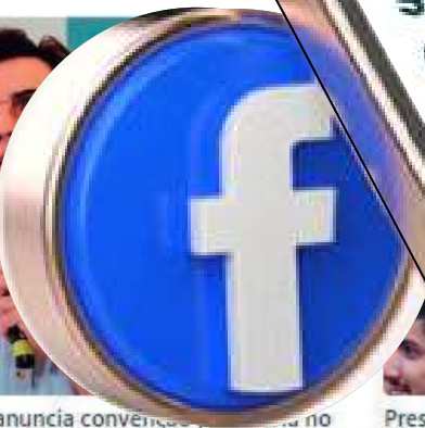
Presidente de prefeitura do