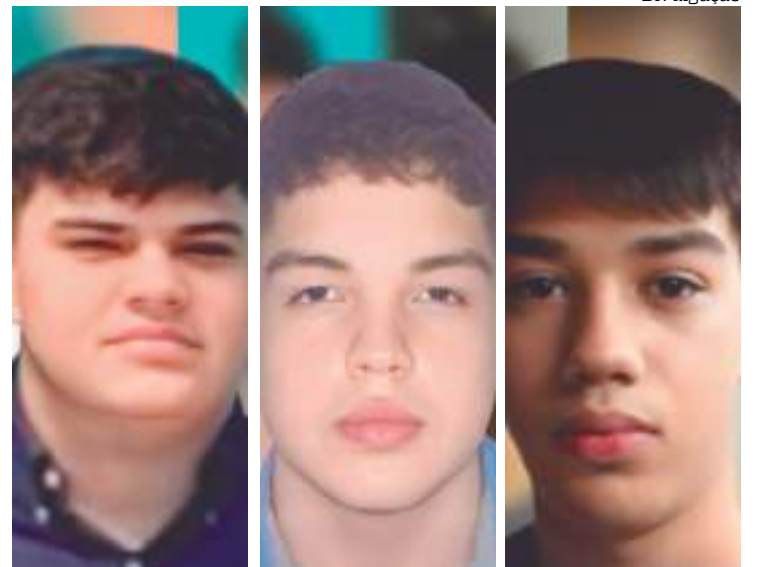
‘Bonde dos Mauricinhos’ deve responder por mais de cinco crimes

O processo segue sob sigilo de justiça e os suspeitos continuam foragidos. Na última semana, os advogados informaram que os investigados iriam se apresentar à polícia para serem ouvidos, mas devido à incompatibilidade de agenda dos policiais, a oitiva foi marcada para esta quarta-feira (30).