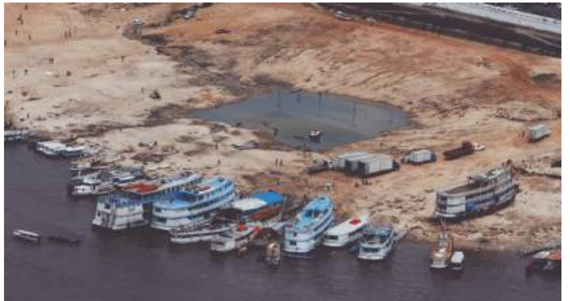
Há um ano, neste mesmo período, o nível do rio era de 12,75 metros

“O Presidente Lula sempre se mostra muito atento e preocupado com as questões do Amazonas, e neste momento de estiagem severa não é diferente. Nossa po-