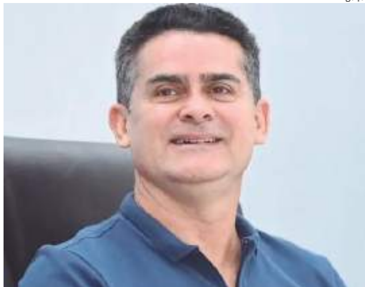
Prefeito possui promessas para cumprir nesses próximos quatro anos

“O prefeito agora, com a sua reeleição assegurada, terá que fazer um movimento forte de aproximação com o governador Wilson Lima, com o governo federal e com organismos internacionais para buscar recursos para investir, para promoção de investimento na cidade de Manaus. A cidade de Manaus é a quinta