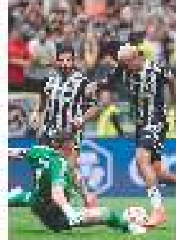
Flamengo e River Plate disputam por uma vaga na final da Libertadores.

O Flamengo e o River Plate disputam por uma vaga na final da Libertadores. O jogo será realizado em Bogotá, na Colômbia.