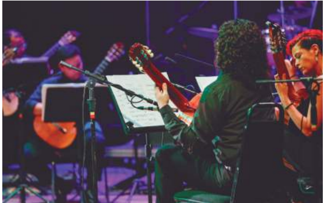
Jovens irão conhecer de perto como funciona a profissionalização artística