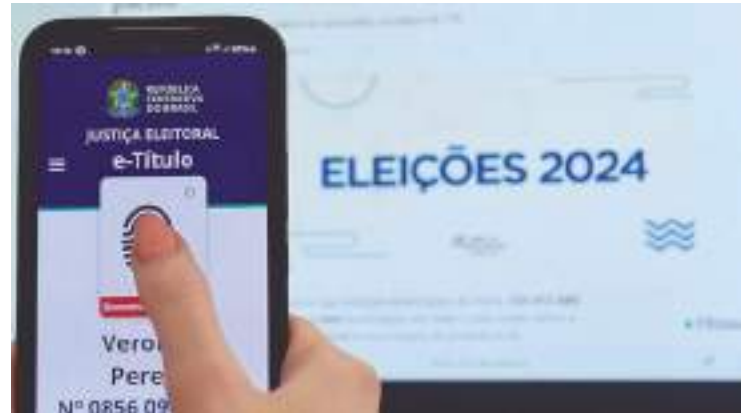
Justificativa pode ser feita por meio do aplicativo e-Título

A ausência às urnas é registrada logo após o pleito. Os prazos de justificativa fi-