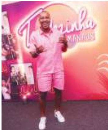
Cantor Thiaguinho fará uma turnê especial de 10 anos

A turnê Tardezinha é conhecida como "a maior roda de pagode do Brasil" e, em 2025, o cantor Thiaguinho fará uma turnê especial para comemorar os 10 anos do evento que conquistou o coração dos pagodeiros em todo o país. A pré-venda de ingressos inicia no dia 4 de novembro, mas em Manaus, a compra poderá ser feita a partir do dia 6 de novembro.