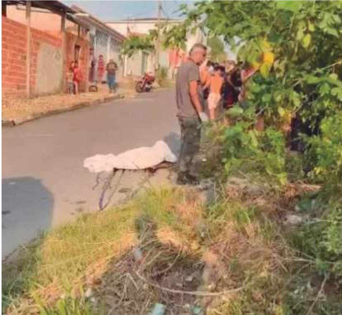
Vítima foi encontrada com as mãos e pés amarrados, marcas de espancamento e tiros

A equipe de perícia e o Instituto Médico Legal (IML) foram acionados para atender a ocorrência. O caso é acompanhado pela Delegacia Especializada em Homicídios e Sequestros (DEHS).