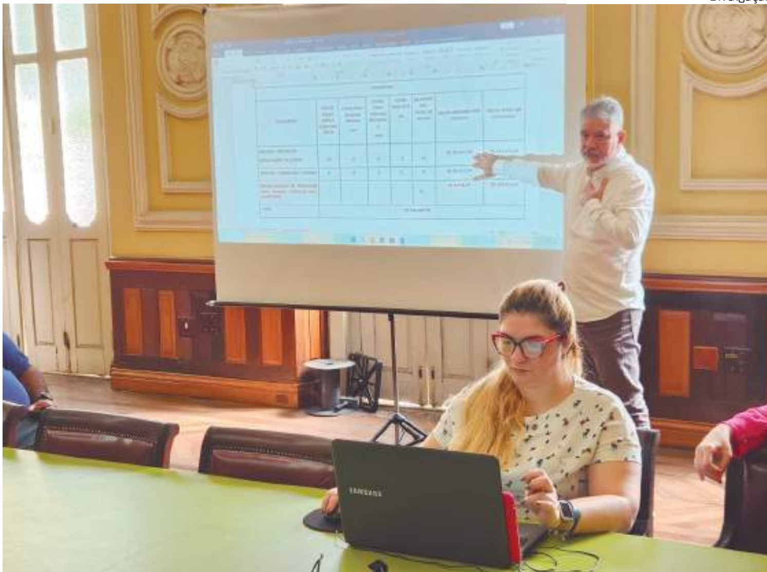
Inscrições devem ser feitas por meio do site do Concultura

“Estamos vivendo dias difíceis com condições climáticas imprevisíveis que tem dificultado a mobilidade das populações ribeirinhas no entorno de Manaus,