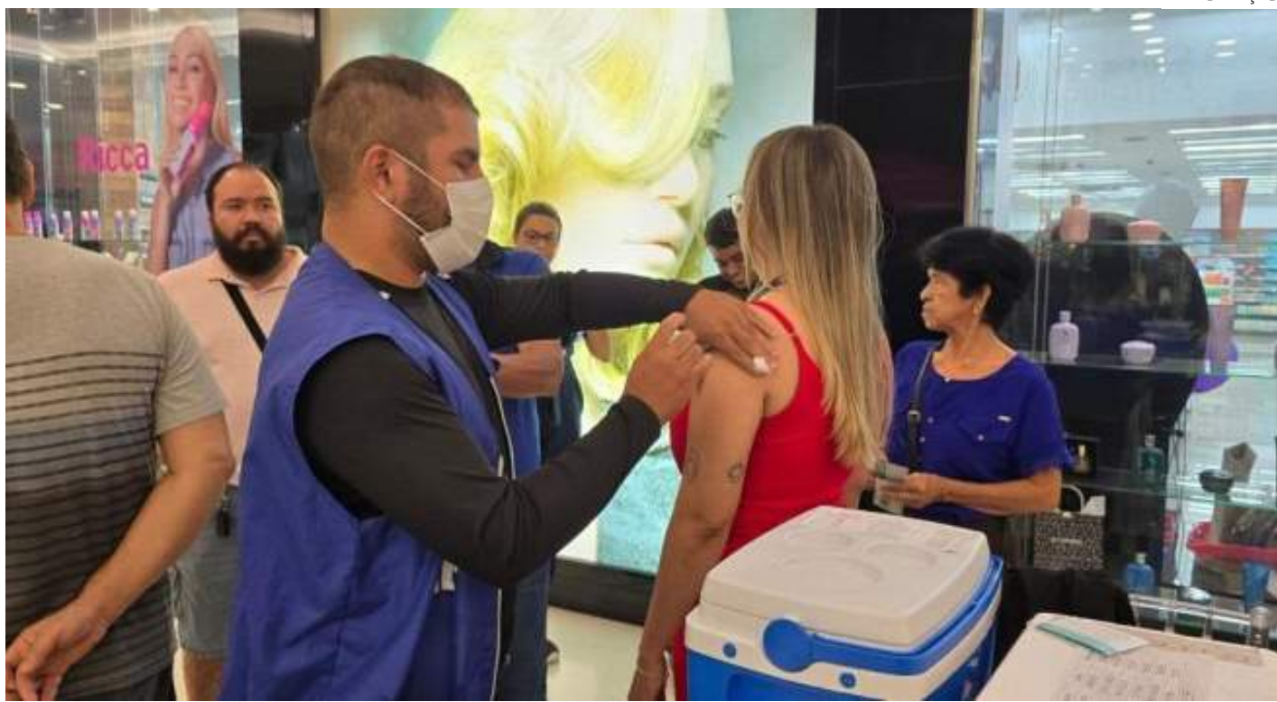
Posto de imunização temporário será disponibilizado no piso L1 do centro de compras

Como estratégia para ampliar o alcance da Campanha de Vacinação contra Influenza, o Shopping Ponta Negra, em parceria com a Secretaria Municipal de Saúde (Semsu), vai disponibilizar um posto temporário de imunização, que funcionará a partir desta quarta-feira (16) até sexta (18), das 14h às 18h, no piso L1, próximo à Comepi.