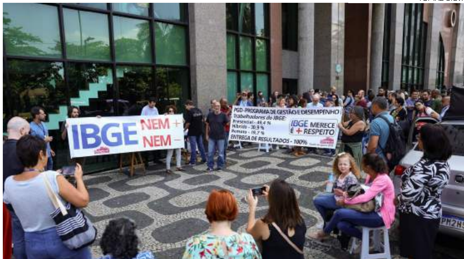
Categoria organizou um ato pela manhã na região central do Rio de Janeiro

"Fomos avisados que essa fundação foi criada 2 meses depois de ter sido registrada em cartório, de forma totalmente sigilosa,