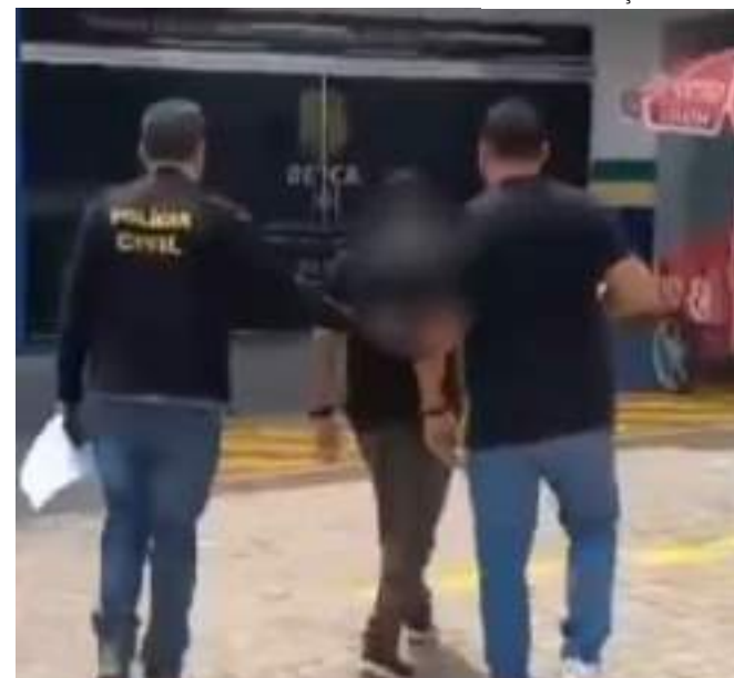
Homem teria aliciado a vítima, que frequentava a mesma igreja