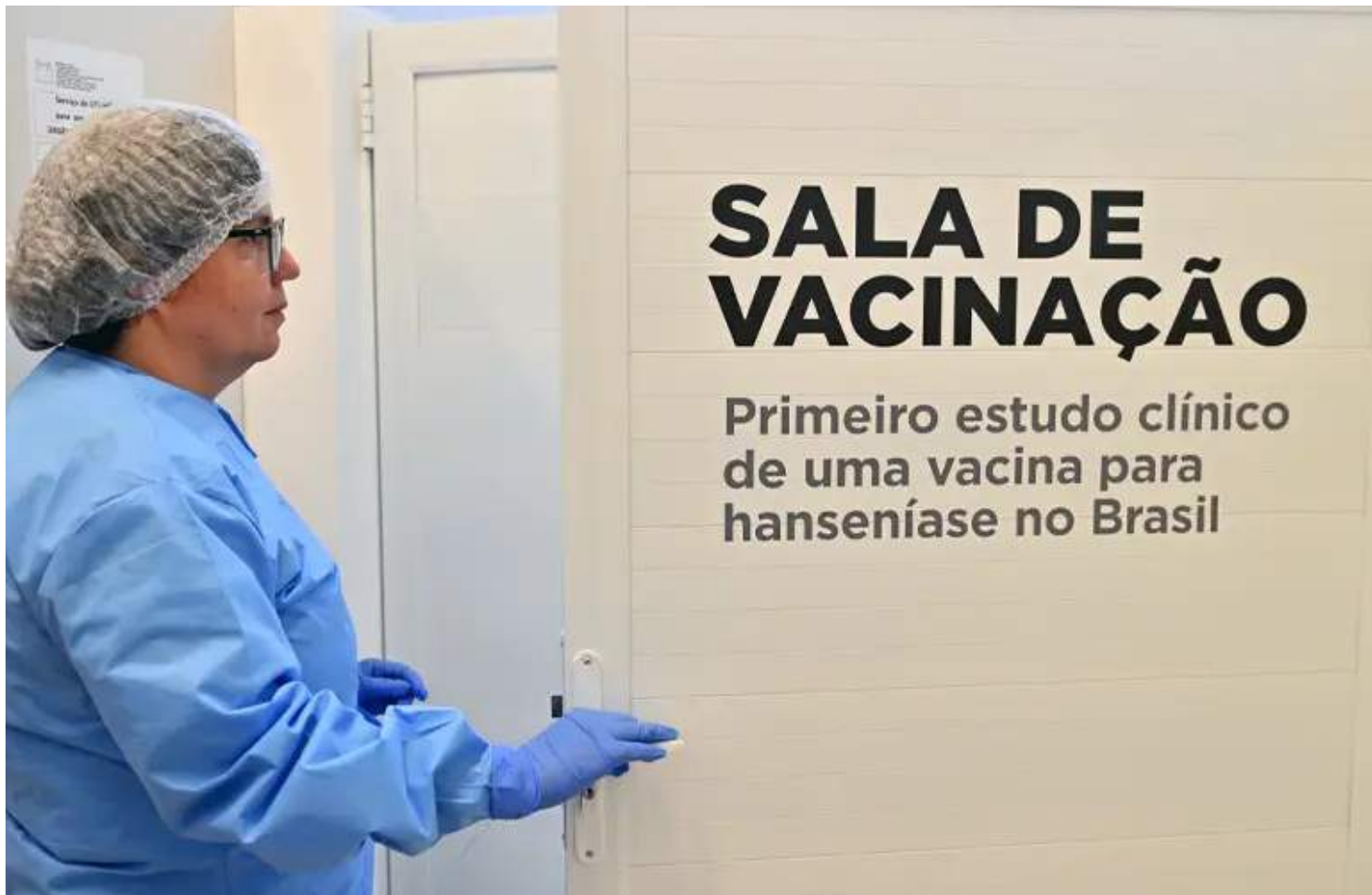
Instituto Oswaldo Cruz foi escolhido como centro clínico responsável pelos testes e o Instituto de Tecnologia em Imunobiológicos é o patrocinador do ensaio

Antes de chegar a etapa de estudos em humanos no Brasil, que contará com 54 voluntários, a vacina já teve sua segurança demonstrada em testes em 24 pessoas sadias nos Estados Unidos. O estudo mostrou a segurança da vacina, sem nenhum registro de evento adverso grave. Também apontou imunogenicidade, ou seja, capacidade de estimular a resposta imunológica.