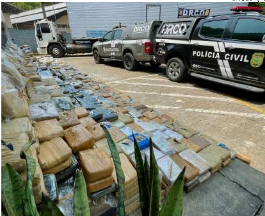
Amazonas lidera o ranking de apreensões de entorpecente na Região Norte

Os dados apresentados pelo MJ correspondem aos números já consolidados entre os meses de janeiro a agosto. A esse montante serão somadas as mais de 5.787 toneladas apreendidas ao longo do mês de setembro. Esse quantitativo, quando somado às demais