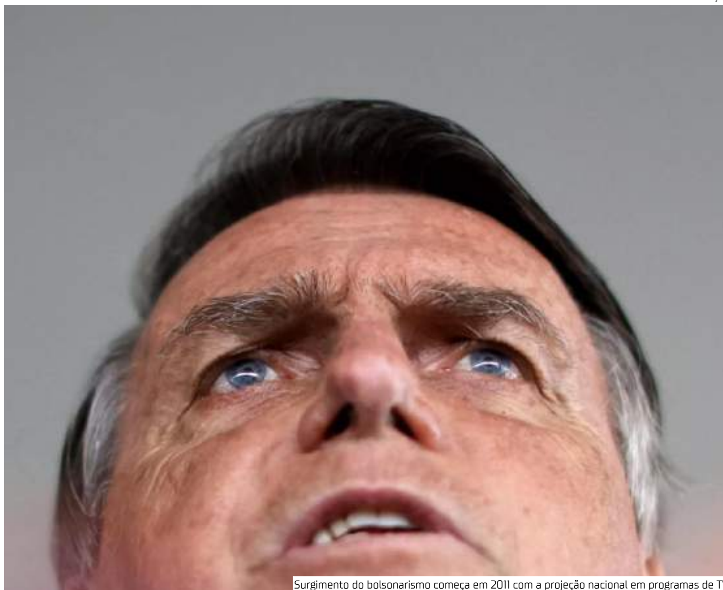
Surgimento do bolsonarismo começa em 2011 com a projeção nacional em programas de TV

Ele diz ver uma expansão, para além do bolsonarismo, do que ele chama de ultradireita, definida pela junção de uma direita tradicional radicalizada ao longo dos anos com a extrema direita, cuja principal característica é ten-