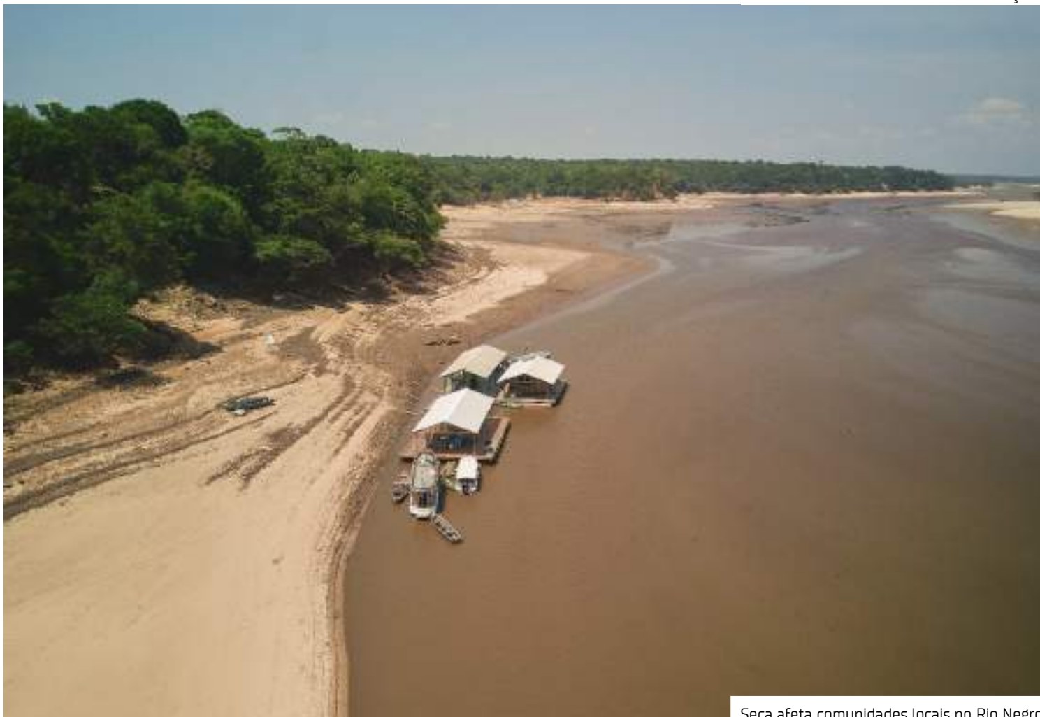
Seca afeta comunidades locais no Rio Negro

“O projeto veio em uma boa hora para nós, artesãs, para conhecer pessoas novas e desenvolver ainda mais o nosso trabalho. Hoje, a venda online é importante. Então, com o curso estamos aprendendo a vender nosso artesanato pelas redes sociais. No primeiro módulo, conhecemos várias artesãs de outras comunidades onde a Fundação [FAS] atua. [Foi muito bom] conhecer novas mulheres que trabalham no mesmo ramo, mas com sementes diferentes, fibras