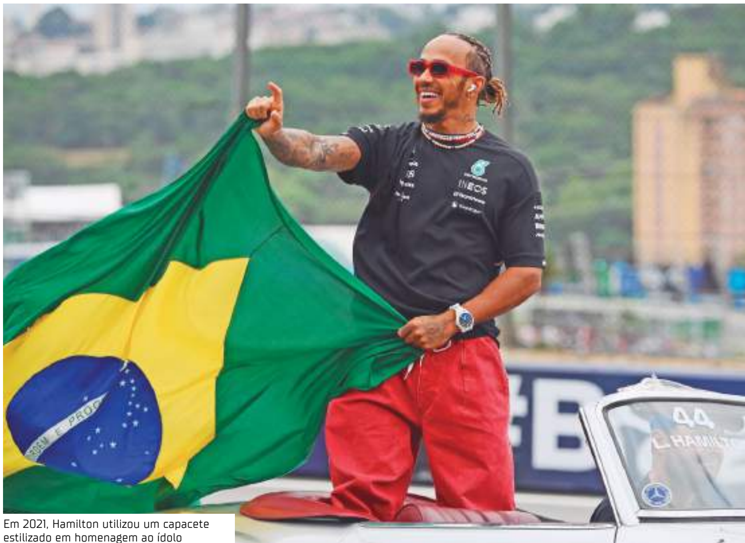
Em 2021, Hamilton utilizou um capacete estilizado em homenagem ao ídolo

Hamilton sempre deixou clara a idolatria e a identi-