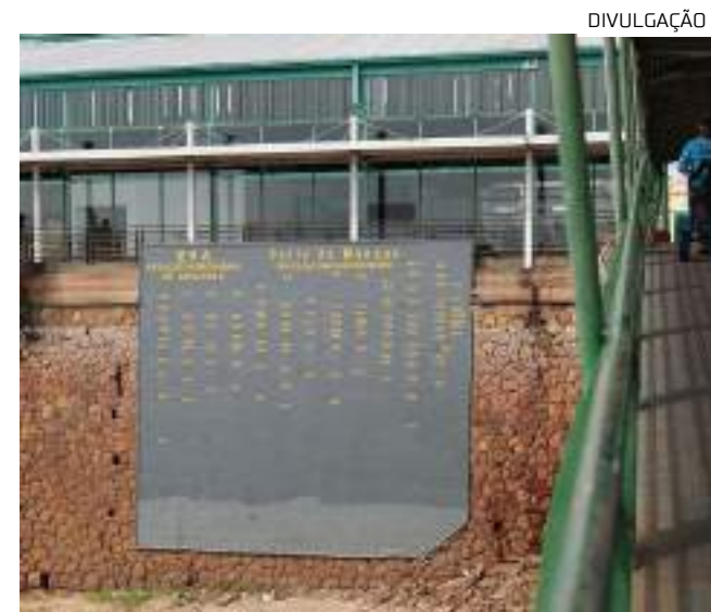
Nesta quarta, o Rio Negro alcançou a medida de 12,21 metros

O governador Wilson Lima declarou situação de emergência para os 62 municípios amazônicos por conta dos efeitos da estiagem. No dia 5 de julho, ele já havia assinado o decreto de situação de emergência para 20 cidades e ampliou para mais 42, no dia 28 de agosto.