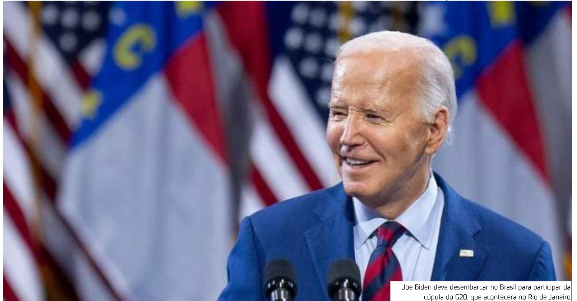
Joe Biden deve desembarcar no Brasil para participar da cúpula do G20, que acontecerá no Rio de Janeiro

A conversa que pode ter desencadeado essa visita ocorreu em setembro, durante a 79ª Assembleia Geral da Organização das Nações Unidas (ONU) em Nova York. O presidente brasileiro Luiz Inácio Lula da Silva, logo após seu discurso na assembleia, revelou ter feito um convite a Biden para conhecer a Amazônia. "Vamos ver se o Biden vai para a Amazônia", disse Lula a jornalistas, indicando que a visita poderia ter um forte