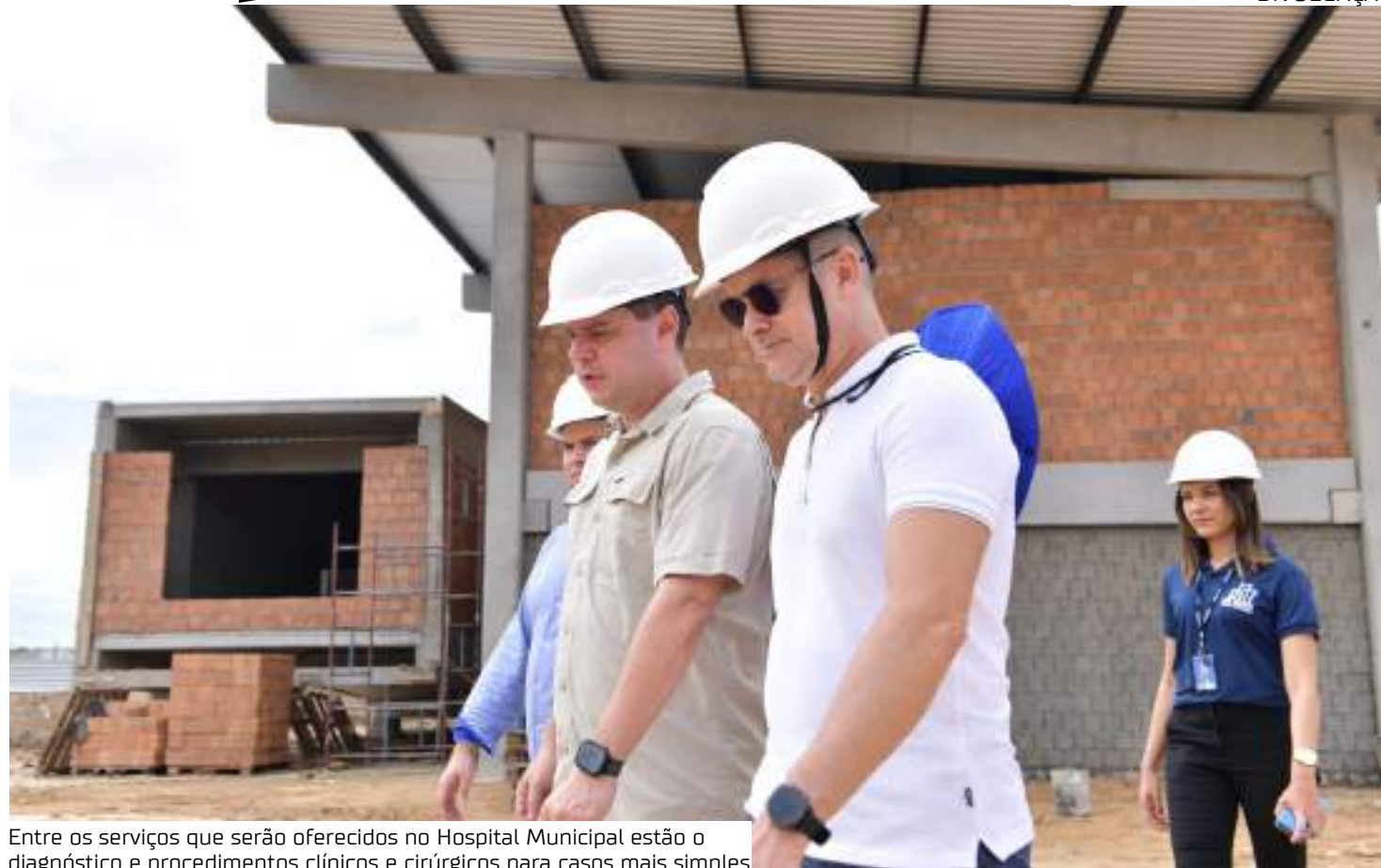
Entre os serviços que serão oferecidos no Hospital Municipal estão o diagnóstico e procedimentos clínicos e cirúrgicos para casos mais simples

cos e cirúrgicos para casos mais simples, que não necessitam de internação.