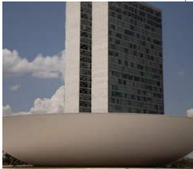
Projeto que regulamenta reforma tributária vai ao Senado