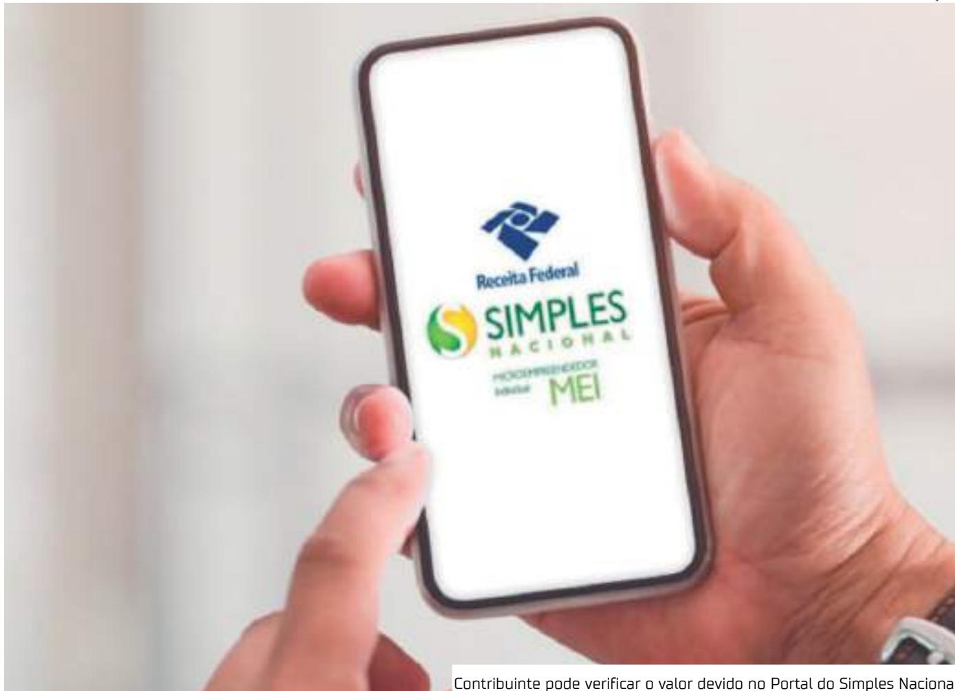
Contribuinte pode verificar o valor devido no Portal do Simples Nacional

Para ela, o primeiro impacto para o microempreendedor é a exclusão automática do regime do Simples Nacional, o que significa que uma empresa passará a ser tributada por outros regimes, como o Lucro Presumido ou o Lucro Real, que são mais