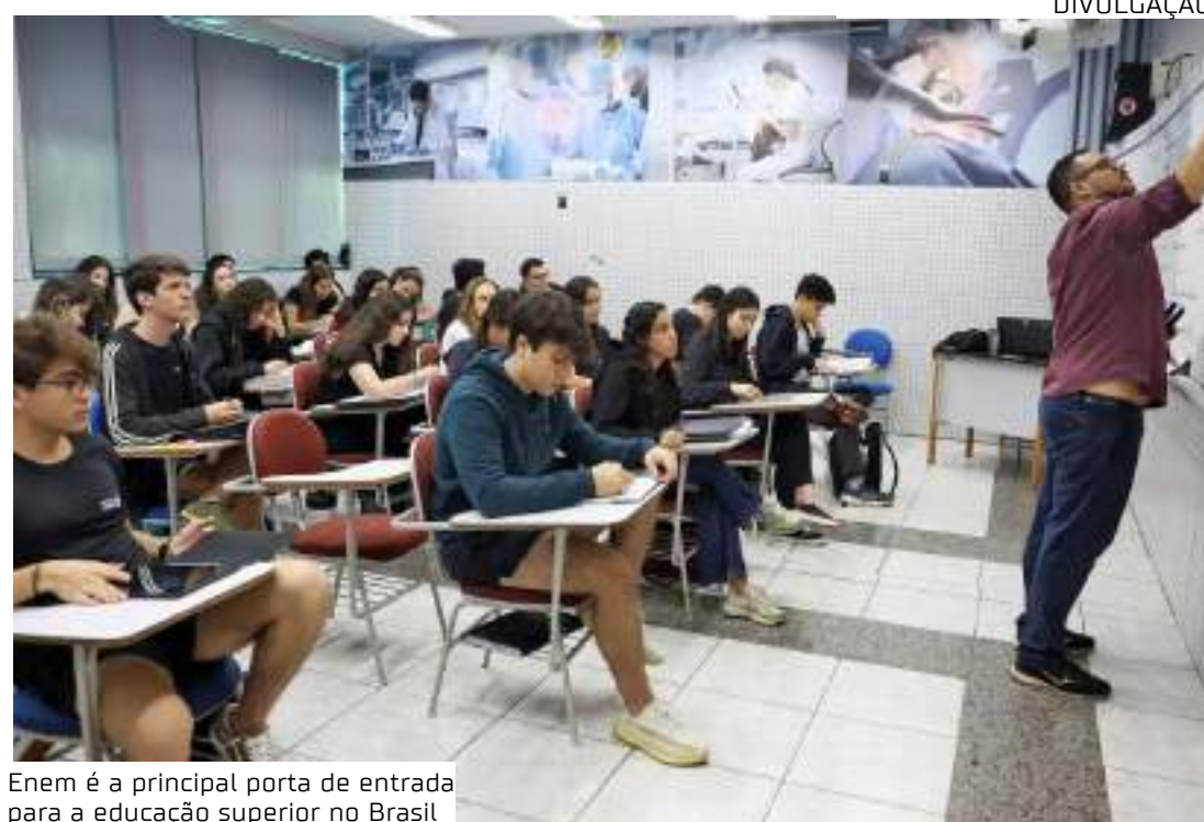
Enem é a principal porta de entrada para a educação superior no Brasil

O programa Pé-de-Meia funciona como uma pou-