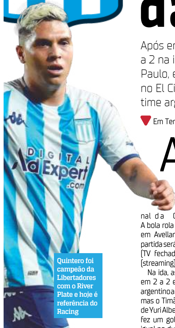
Quintero foi campeão da Libertadores com o River Plate e hoje é referência do Racing