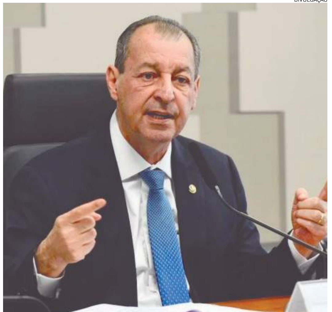
Senador é favorito para presidir a CPI que investigará jogos e apostas esportivas