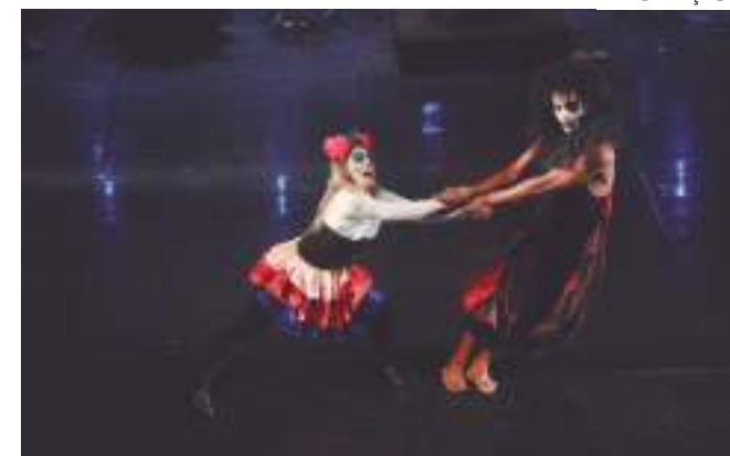
Ensaio do espetáculo iniciaram há duas semanas