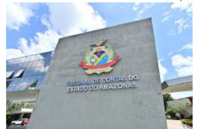
TCE-AM analisará o pedido de medida cautelar em Borba