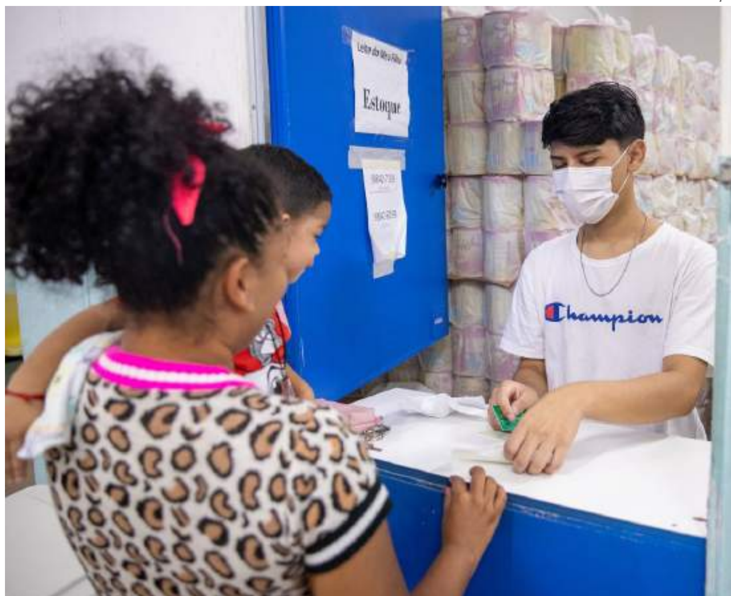
Programa de Nutrição Infantil Leite do Meu Filho contempla, atualmente, 12.095 crianças menores de cinco anos