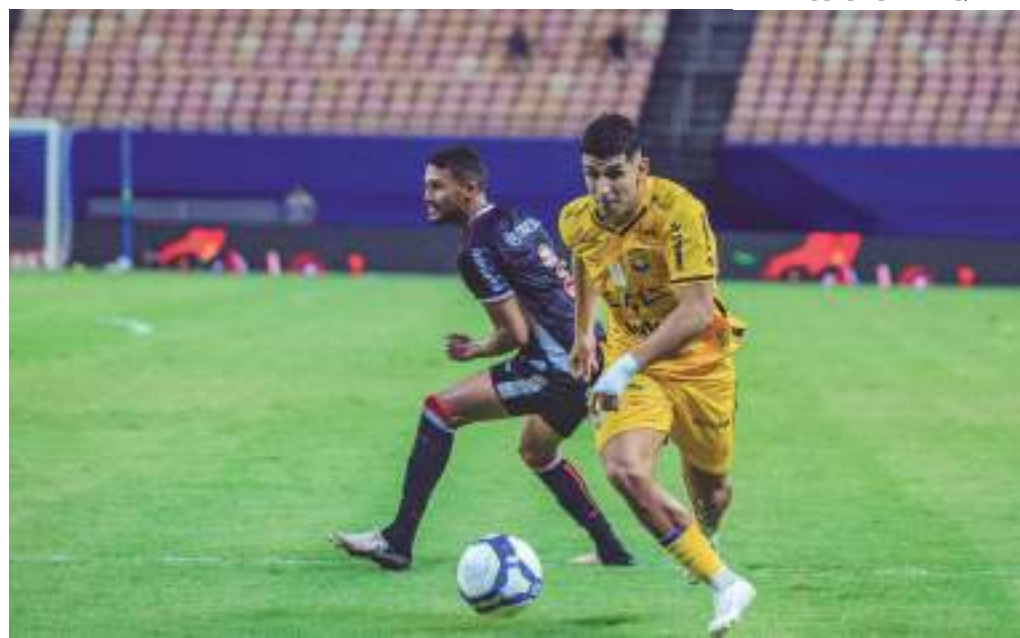
Amazonas FC chegou a três derrotas consecutivas na Série B do Campeonato Brasileiro