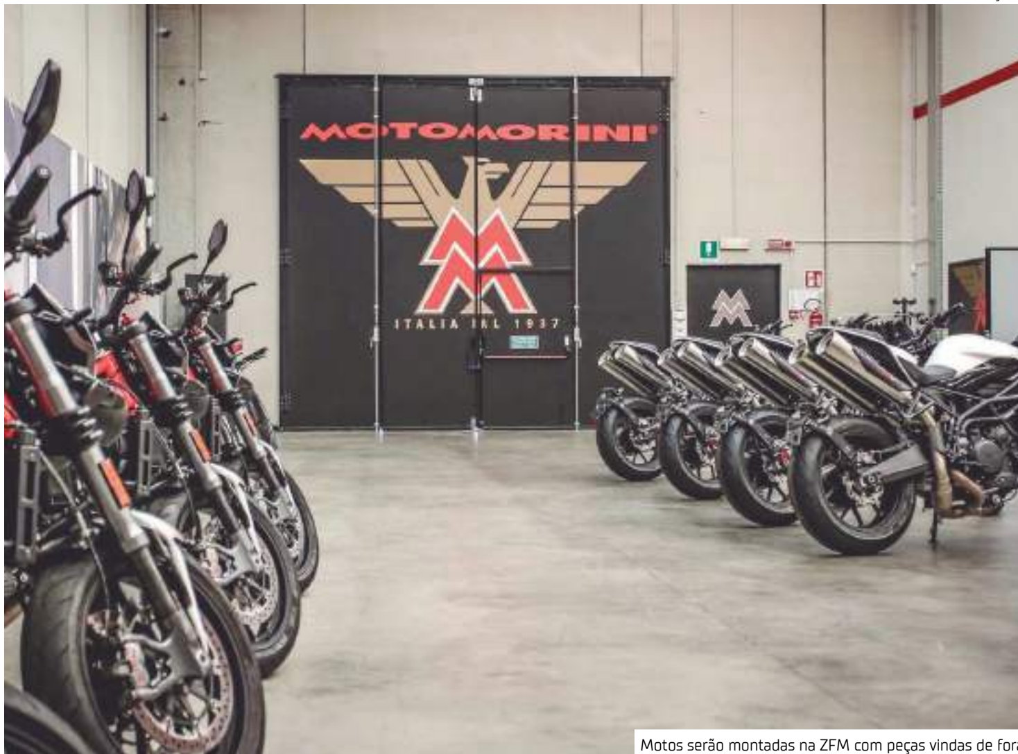
Motos serão montadas na ZFM com peças vindas de fora

Em 2026, novas lojas surgirão em mais estados do Sudeste e no Distrito Fe-