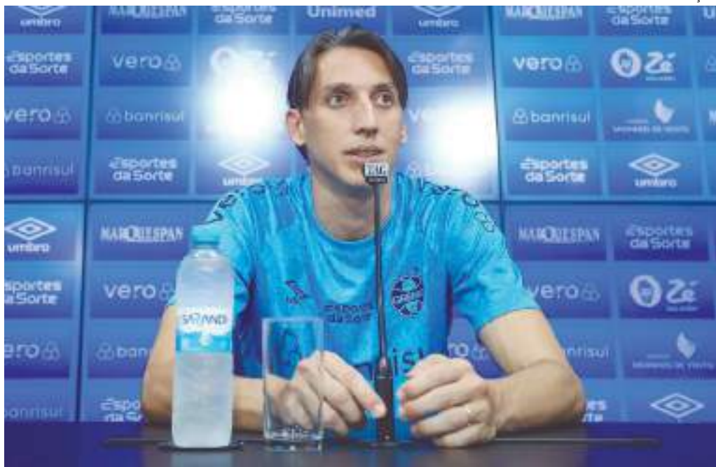
Anúncio foi feito em coletiva de imprensa nesta terça-feira (1º)