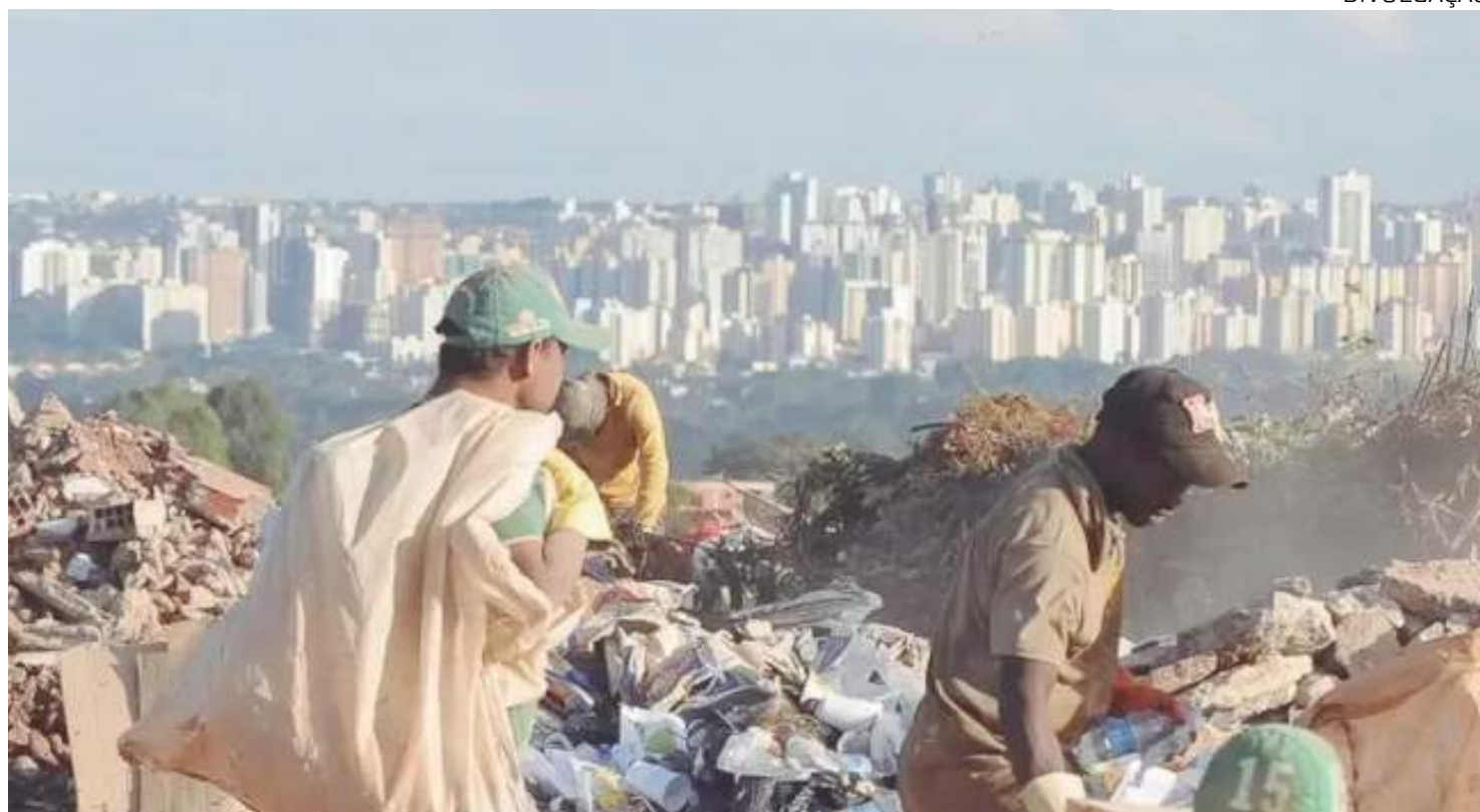
Destino final do resíduo sólido ainda é um desafio a ser superado por gestores municipais

A falta de controle sobre esse material faz com que ele seja depositado em ecossistemas terrestres, aquáticos e na atmosfera na forma de poluentes, que impactam a saúde humana e o planeta por gerações, contribuindo para três crises globais: