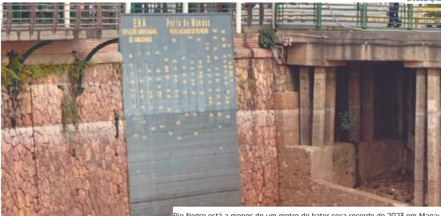
Rio Negro está a menos de um metro de bater seca recorde de 2023 em Manaus

Após a análise dos planos de trabalho enviados, a equipe técnica da Defesa Civil Nacional avalia as metas e valores propostos. Uma vez aprovados, os repasses são formalizados através de portaria no DOU, liberando os valores correspondentes.