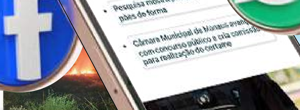
Bombeiros impedem propagação de incêndio em área de vegetação no interior do AM