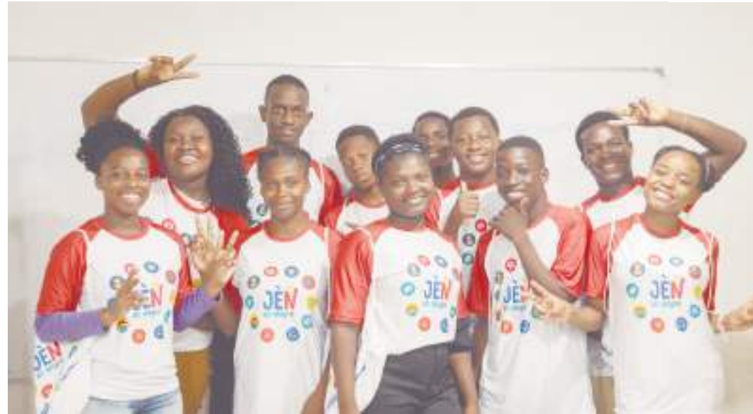
Projeto oferece jornada formativa voltada para a conquista do primeiro emprego

"O ACNUR continuará apoiando iniciativas que, como o Jên an Aksyon, proporcionam aos jovens refugiados e outros forçados a se deslocar as condições necessárias para reconstruir suas vidas de forma digna, contribuindo ativamente para o desenvolvimento do seu potencial e das comunidades que os acolhem", conclui.