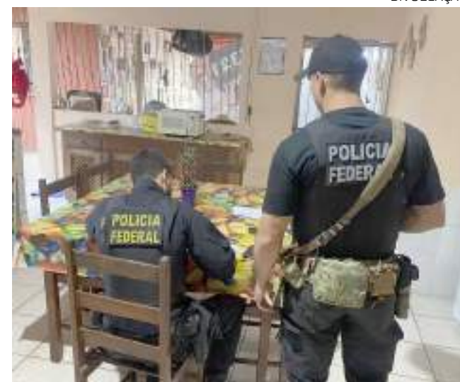
Ação faz parte de um monitoramento