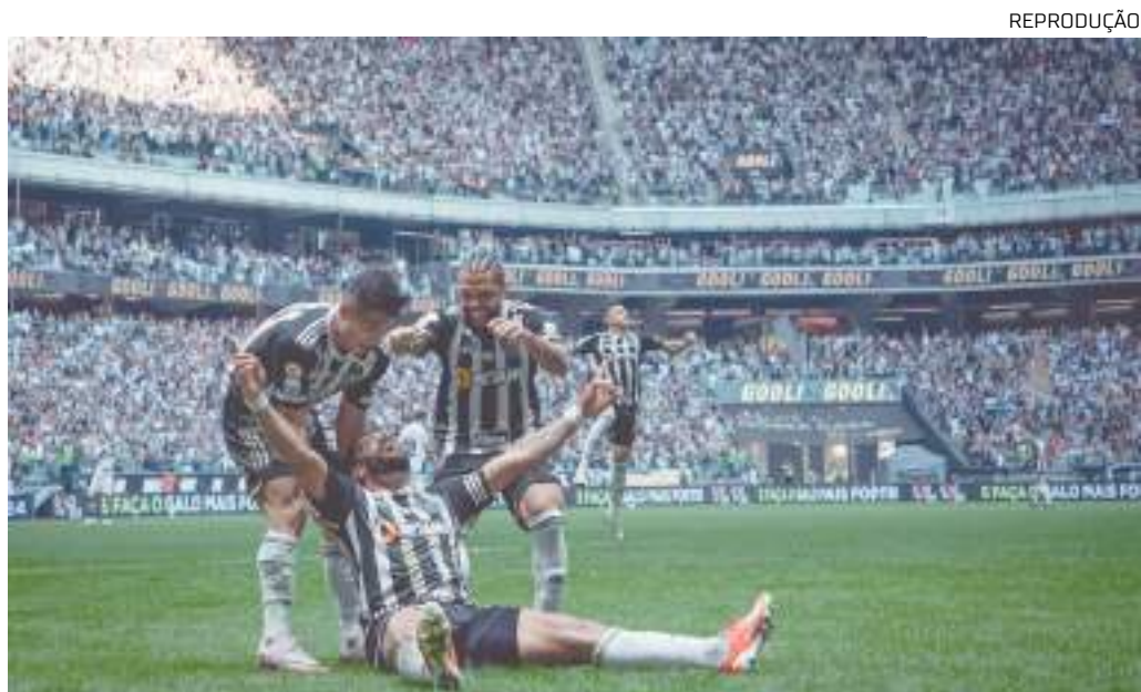
Hulk marcou dois gols na vitória do Galo sobre o Vasco, na Arena MRV, em jogo válido pelo Brasileiro

O Gigante da Colina deve ir a campo com: Léo Jardim; Paulo Henrique, Maicon, Léo (João Victor), Lucas Piton; Hugo Moura, Sforza, Payet (Philippe Coutinho), Jean David, Emerson Rodríguez e Vegetti.