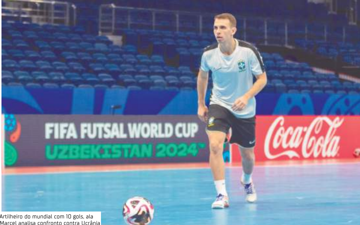
Artilheiro do mundial com 10 gols, ala Marcel analisa confronto contra Ucrânia

"Na verdade, nosso foco está sendo muito na defesa,