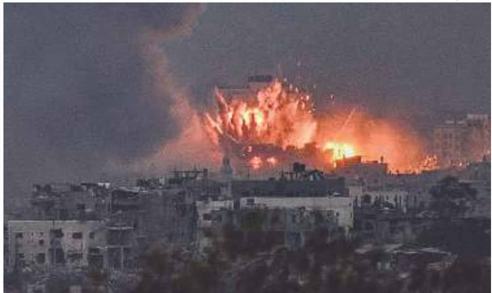
Ação seria retaliação contra bombardeios no Líbano feitos por militares israelenses