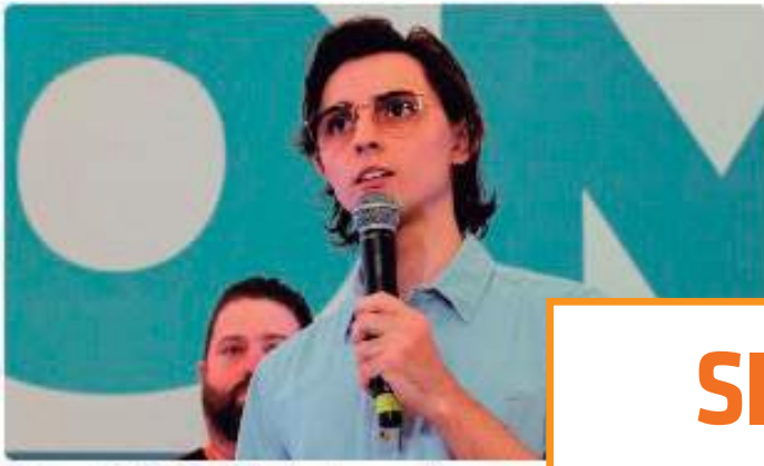
Federação PSDB-Cidadania anuncia convenção do Clube do Trabalhador, em Manaus