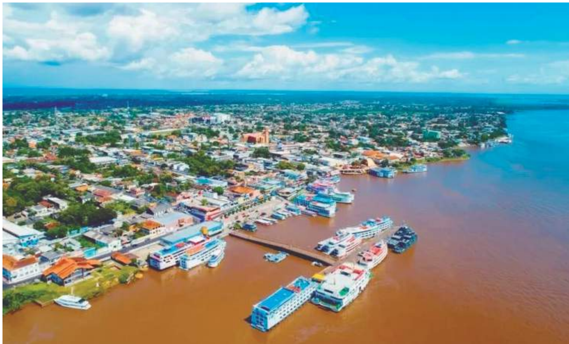
Juíza determinou o imediato afastamento, com retorno a Manaus, dos policiais militares da Rocam