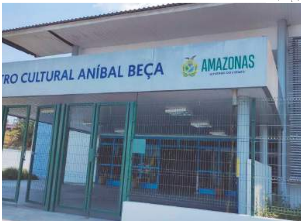
Centro Municipal de Arte Educação (Cmae) Aníbal Beça será um dos colégios eleitorais no domingo (6)