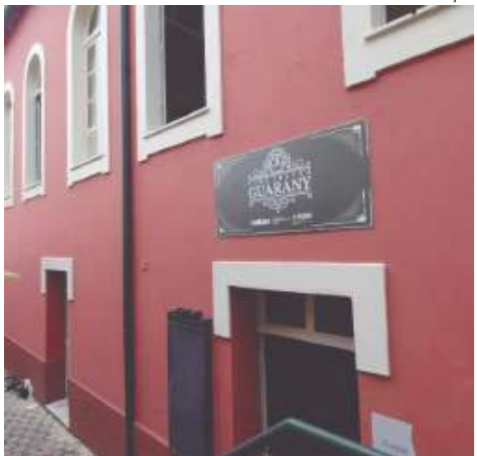
Exibição gratuita acontece no Cineteatro Guarany