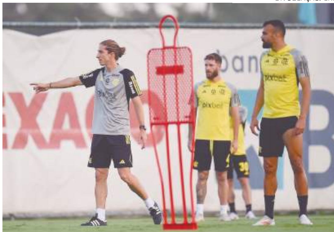
Técnico Filipe Luís teve dois dias de treinos com o elenco antes da decisão pela Copa do Brasil

O novo treinador, inclusive, foi apresentado, nesta terça-feira (1º), de forma oficial no Centro de Treinamento do Ninho do Urubu. Filipe Luís respondeu perguntas sobre mudanças no modelo de jogo da equipe.