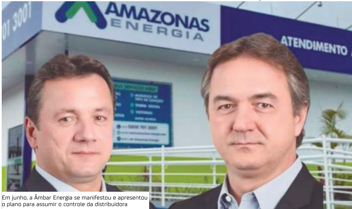
Em junho, a Ámbar Energia se manifestou e apresentou o plano para assumir o controle da distribuidora

Agora, a Ámbar possui 24 horas para decidir se assina ou não o contrato de acordo com as adequações estabelecidas. Caso concorde, ela deverá abdicar de qualquer questionamento judicial ou administrativo no âmbito da Aneel.