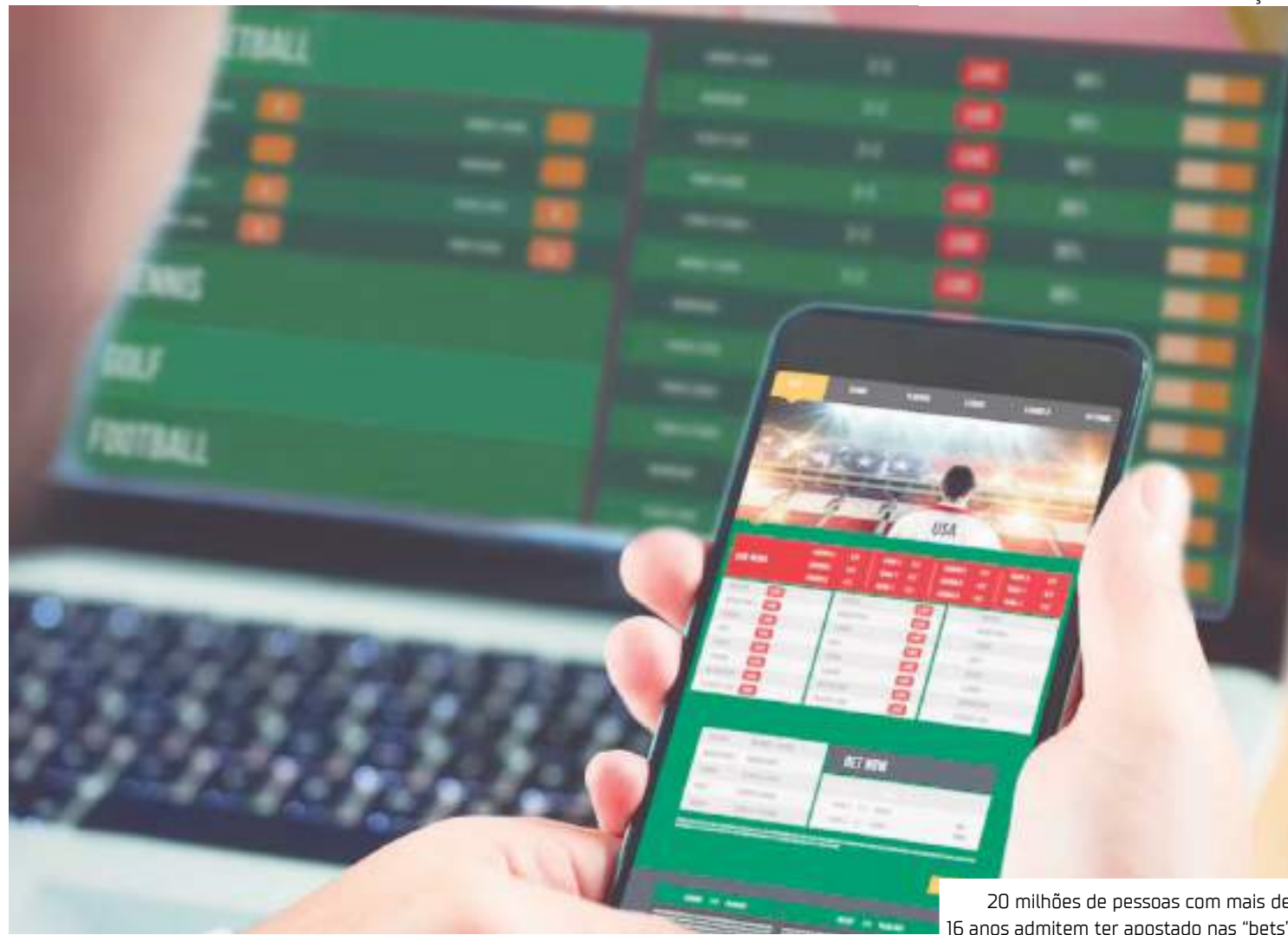
20 milhões de pessoas com mais de 16 anos admitem ter apostado nas "bets"

Com menos dinheiro no bolso das famílias e com mais dinheiro destinado a apostas, faltam re-