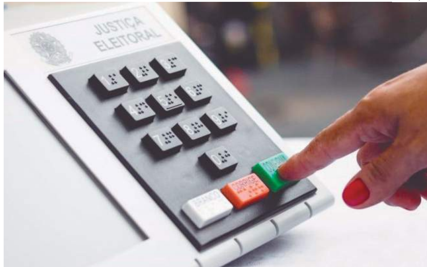
Eleições municipais serão feitas em um horário único em todo o país

De acordo com a estimativa do TSE, em Manaus, o re-