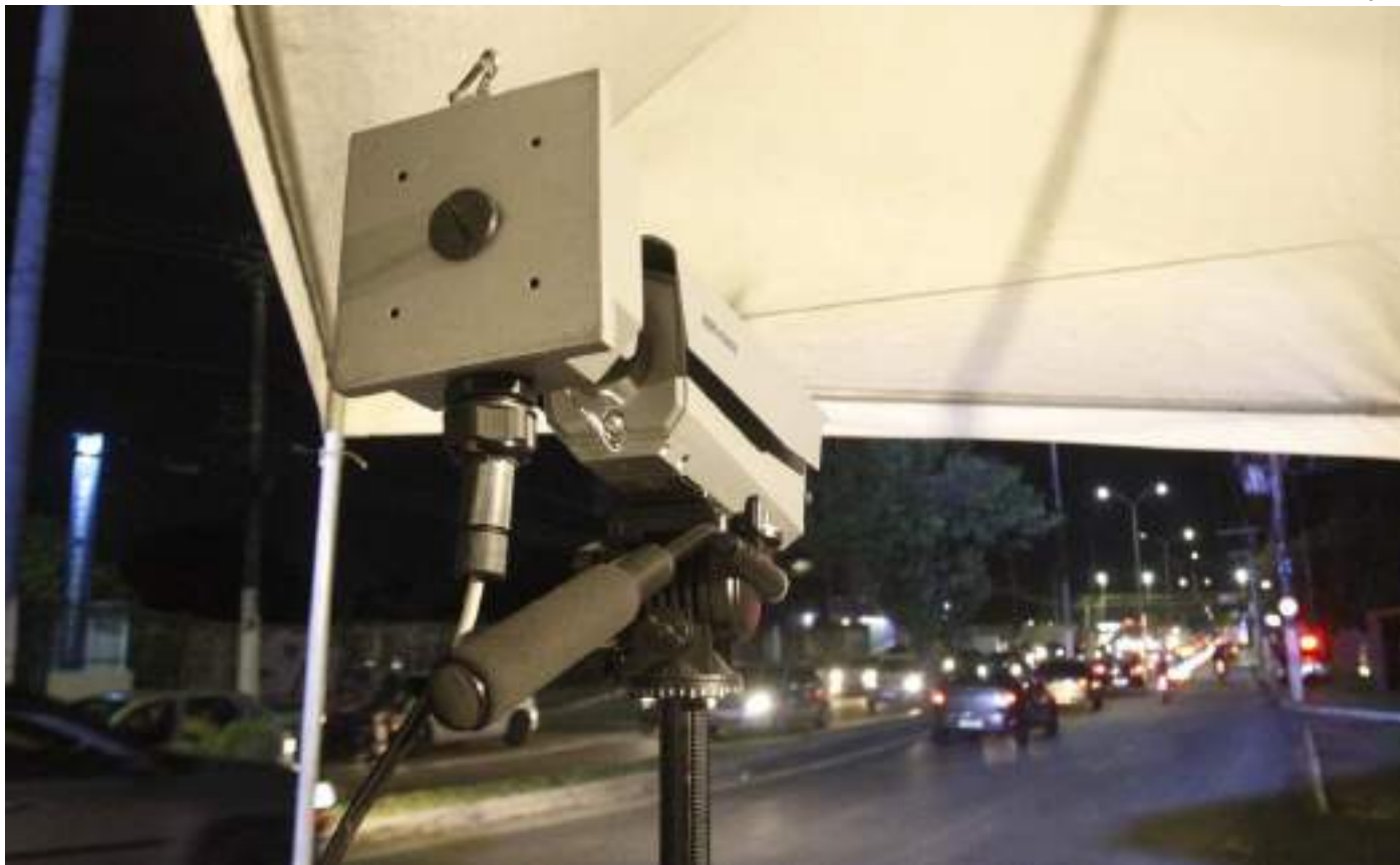
Cerca Inteligente de Videomonitoramento, o Paredão, começou a operar com mais de 500 câmeras em toda a capital