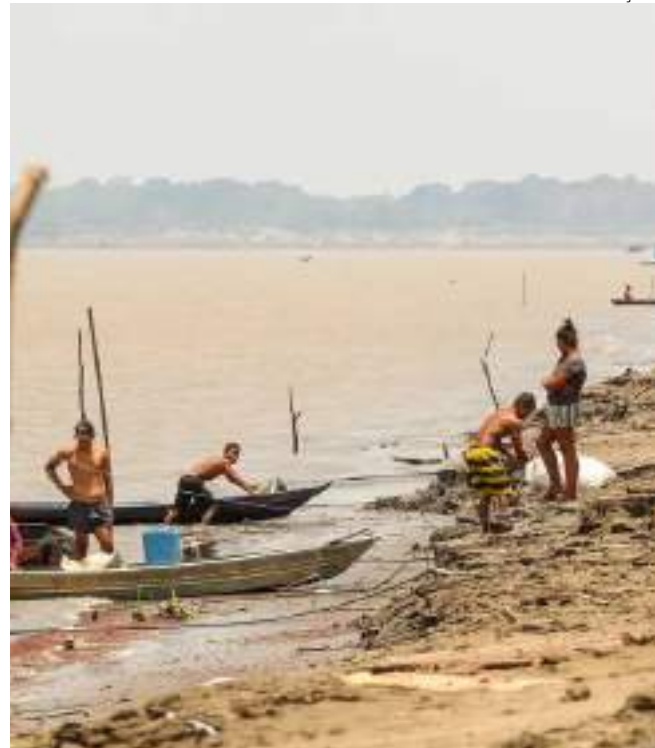
Auxílio será de R$ 2.824 e deverá beneficiar 100 mil profissionais