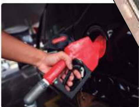
MPAM investiga reajuste injustificado no preço da gasolina em Manaus