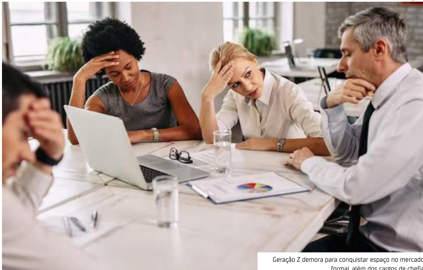
Geração Z demora para conquistar espaço no mercado formal, além dos cargos de chefia

O envelhecimento da força de trabalho ajuda a ex-