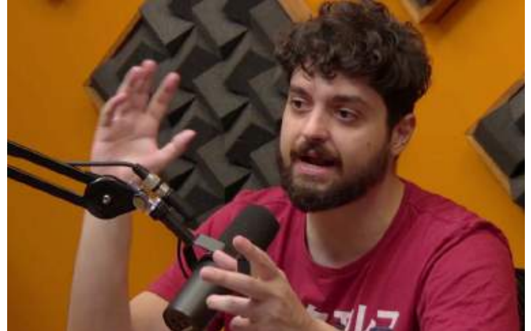
Dino foi ofendido pelo youtuber durante um podcast realizado em 2023