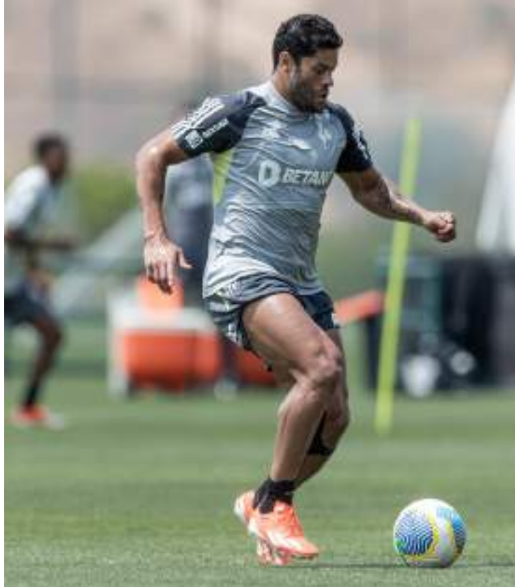
Atlético-MG e Grêmio já se enfrentaram em 78 oportunidades ao longo da história

Atlético-MG e Grêmio já se enfrentaram em 78 oportunidades ao longo da história, conforme dados do portal Ogol. A vantagem é do Imortal, que acumula 31 vitórias, 21 empates e 26 derrotas diante do rival. O retrospecto recente (últimos cinco