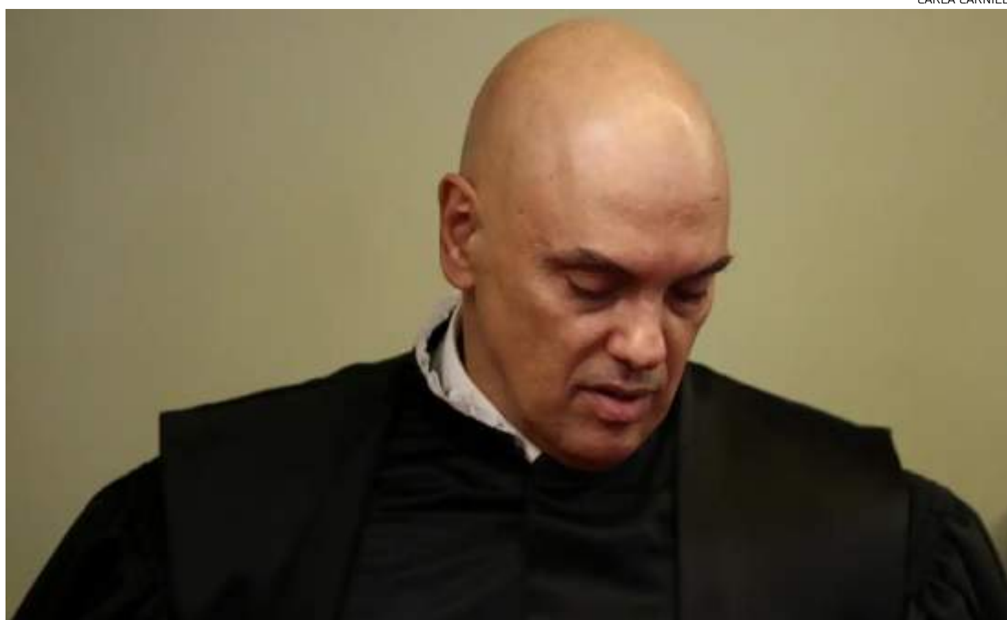
Ordem de suspender o X no Brasil foi dada por Moraes em 30 de agosto