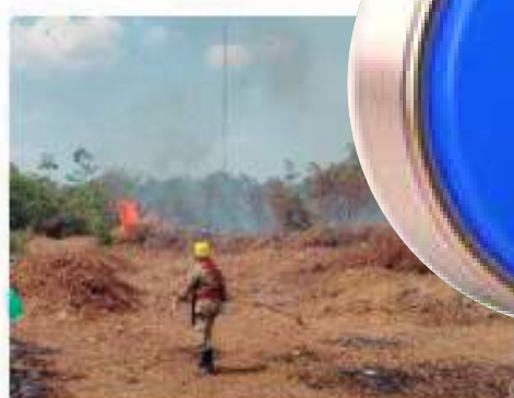
Bombeiros combatem 70 focos de incêndio em 24 horas no interior do AM