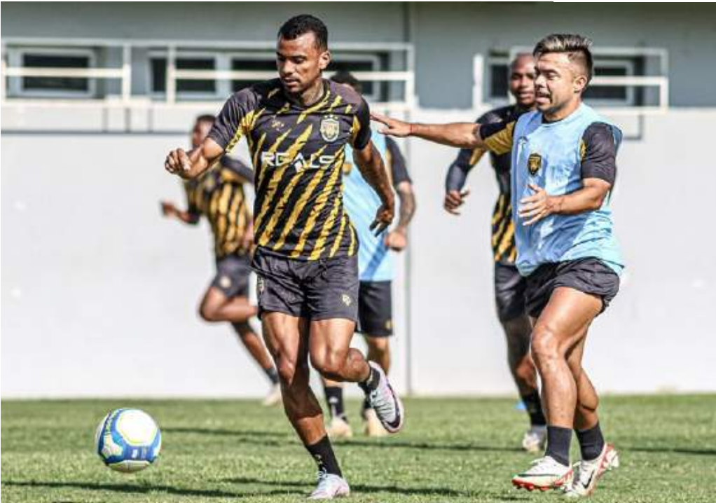
Atacante se isolou como líder em participações para gols do Amazonas FC nesta Série B