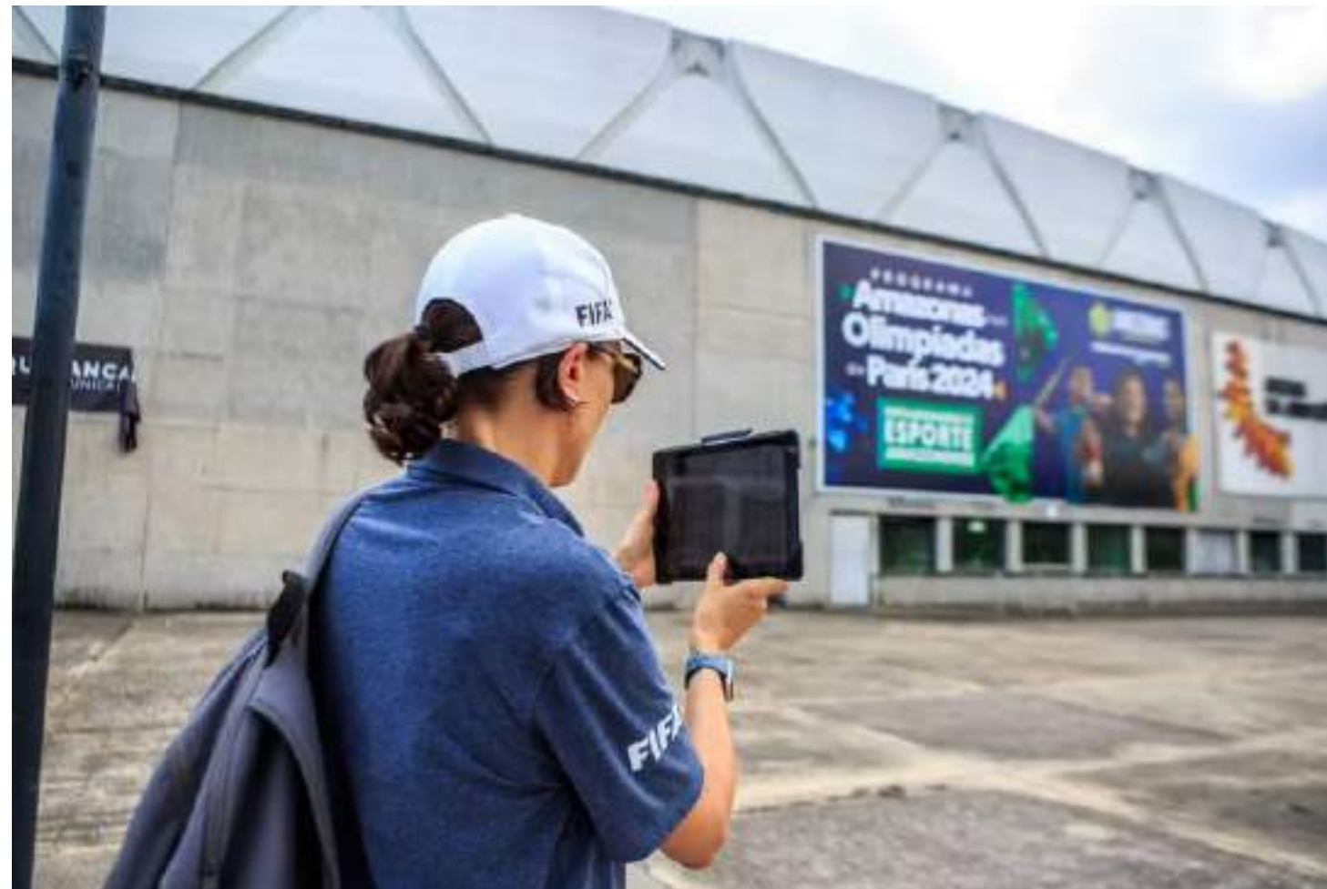
Copa do Mundo Feminina da FIFA 2027 será disputada no Brasil, entre 24 de junho e 25 de julho

Ao lado de autoridades estaduais e municipais par-