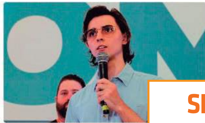
Federação PSDB-Cidadania anuncia convenção do Clube do Trabalhador, em Manaus