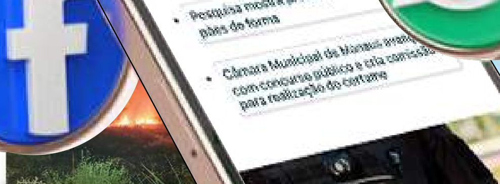
Bombeiros impedem propagação de incêndio em área de vegetação no interior do AM