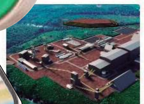
Lei proíbe presidente da Potássio de entrar em terra indígena no Amazonas