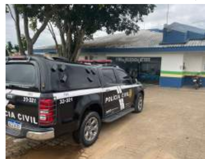
Suspeito foi preso no aeroporto do do município de Tefé