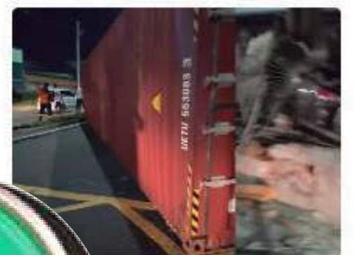
Trator tomba e atinge casa e carros na Manaus; VÍDEO