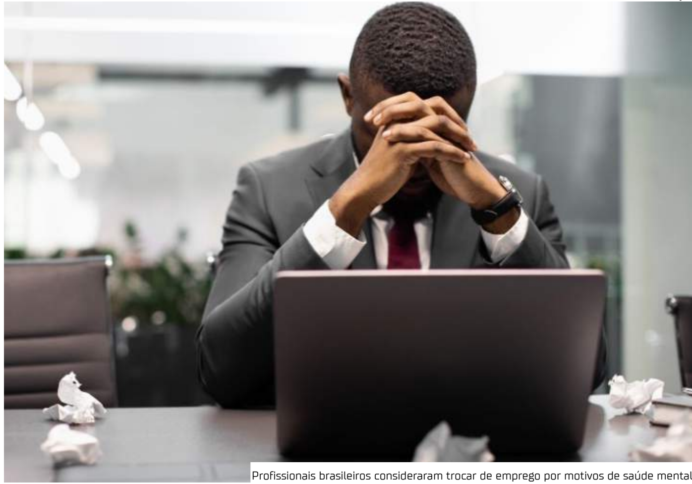
Profissionais brasileiros consideraram trocar de emprego por motivos de saúde mental

Desse modo, problemas de saúde mental se tornaram a segunda maior causa de afastamentos do trabalho, atrás apenas de lesões corporais,