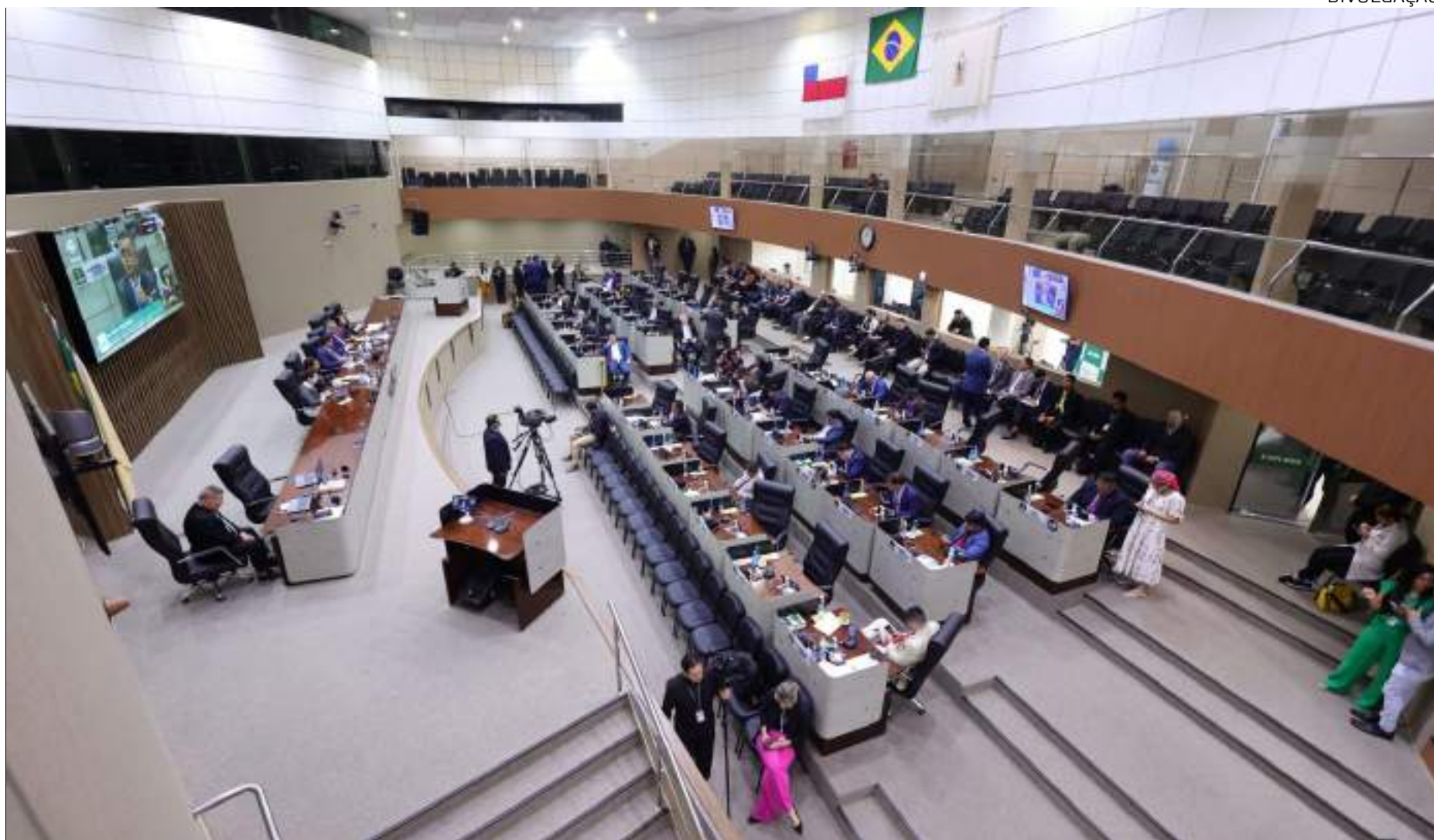
Após a renovação de apenas 13 vagas na Casa, cerca de 32%, Câmara caminha para o aumento do conservadorismo em 2025

“Não é saudável para a democracia que um parlamento