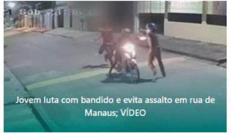
Jovem luta com bandido e evita assalto em rua de Manaus; VÍDEO