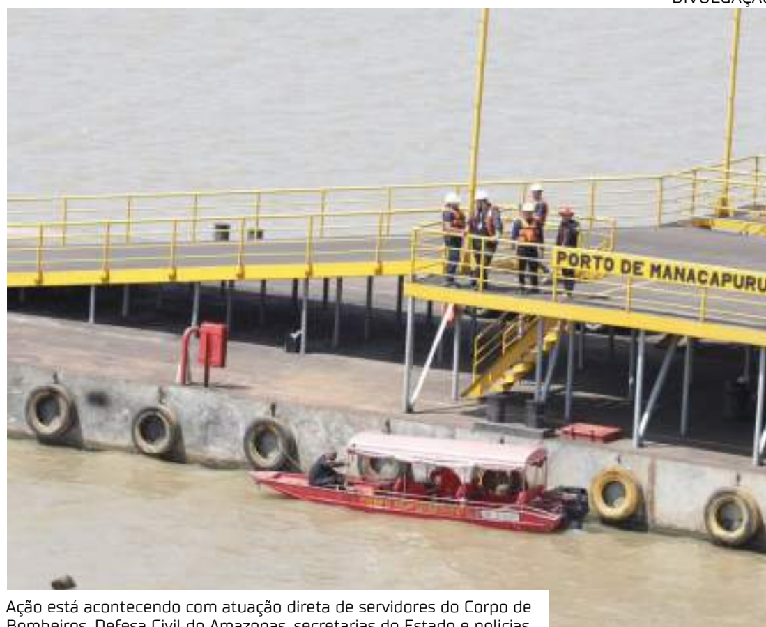
Ação está acontecendo com atuação direta de servidores do Corpo de Bombeiros, Defesa Civil do Amazonas, secretarias do Estado e policiais

A força-tarefa montada pelo Governo do Amazonas segue com o trabalho de assistência às vítimas e buscas. Além dos dois desaparecidos, dez pessoas tiveram ferimentos leves, oito receberam alta e duas seguem internadas no Hospital Regional Lázaro