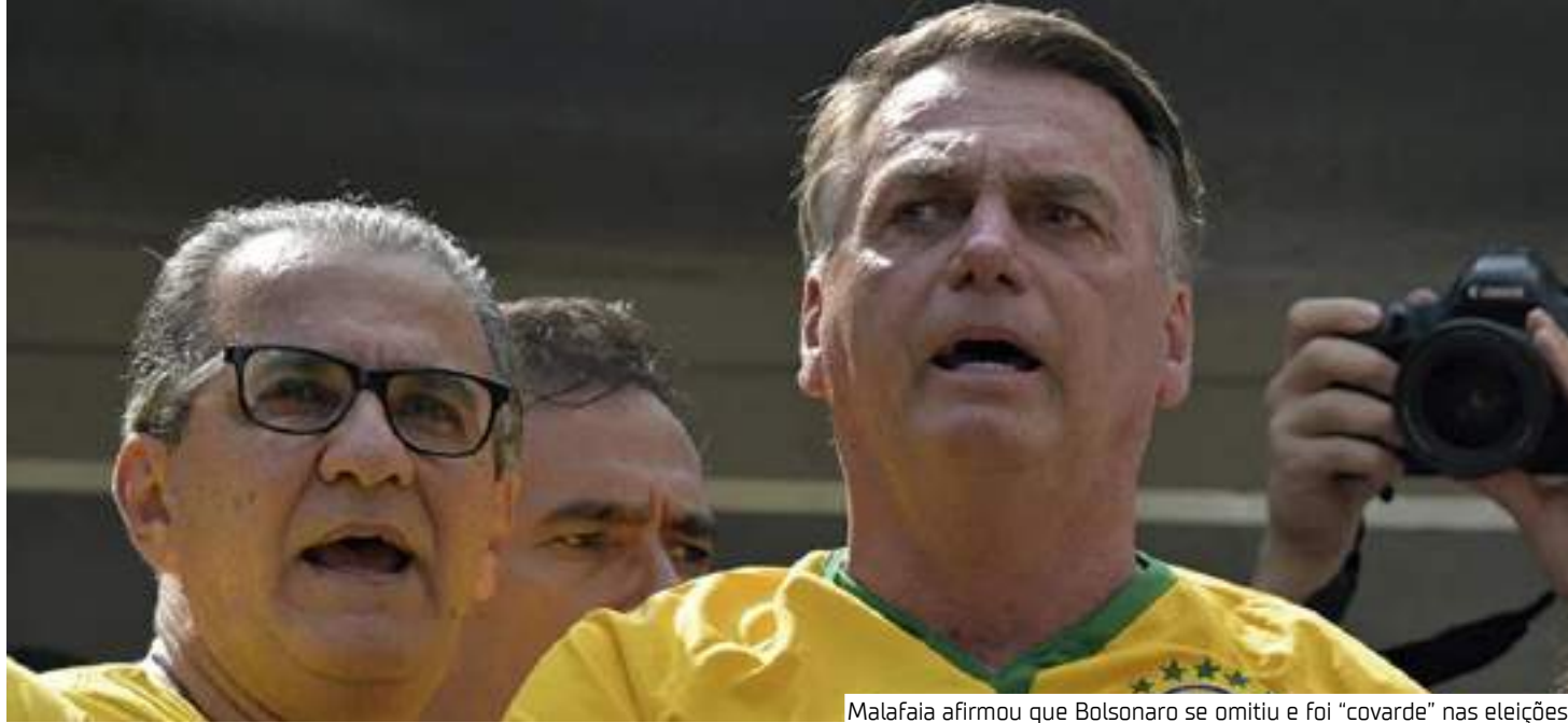
Malafaia afirmou que Bolsonaro se omitiu e foi "covarde" nas eleições

Ele disse ainda que enviou "mais de 30 mensagens duríssimas" para Bolsonaro, que não o respondeu em consideração ao apoio que o ex-presidente recebeu de Malafaia nos momentos cruciais da vida, como quando "perto de ser preso", "chorou por cinco minutos ao telefone sem pa-