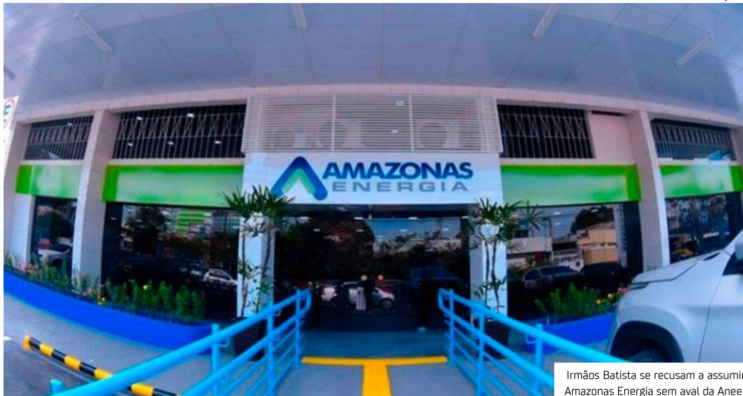
Irmãos Batista se recusam a assumir Amazonas Energia sem aval da Aneel

O governo Lula beneficiou os irmãos Batista com uma medida provisória 72 horas após a mbar comprar usinas termelétricas que