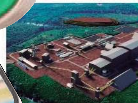
Proibição proíbe presidente da Potássio de entrar em terra indígena no Amazonas