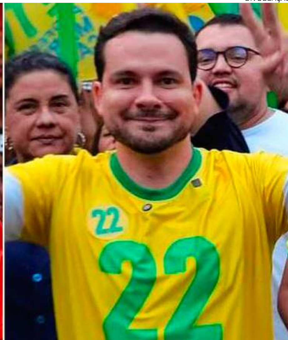
David Almeida (Avante) e Alberto Neto (PL) tentam conquistar o eleitorado manauara

putado federal Mandel anunciou seu apoio ao candidato Capitão Alberto Neto (PL) para o segundo turno das eleições municipais, marcado para o dia 27 de outubro.