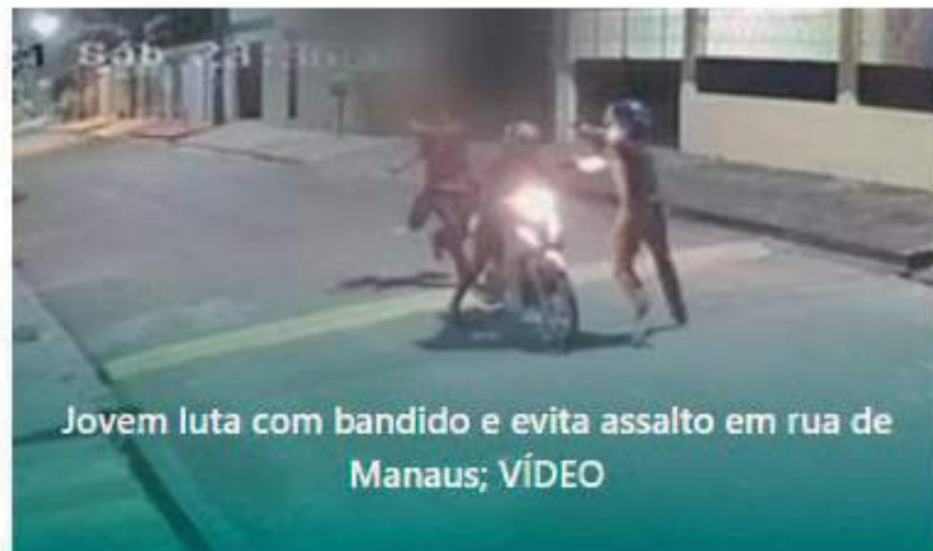
Jovem luta com bandido e evita assalto em rua de Manaus; VÍDEO

• Homem é preso após esfaquear amigo após confusão por R$ 40 no AM