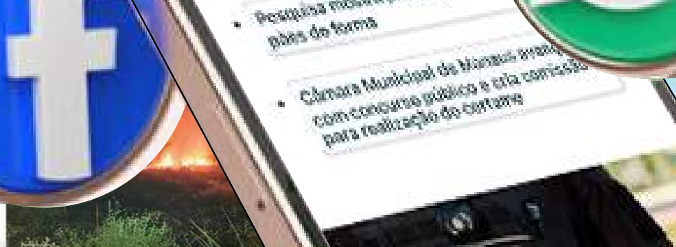
Bombeiros impedem propagação de incêndio em área de vegetação no interior do AM