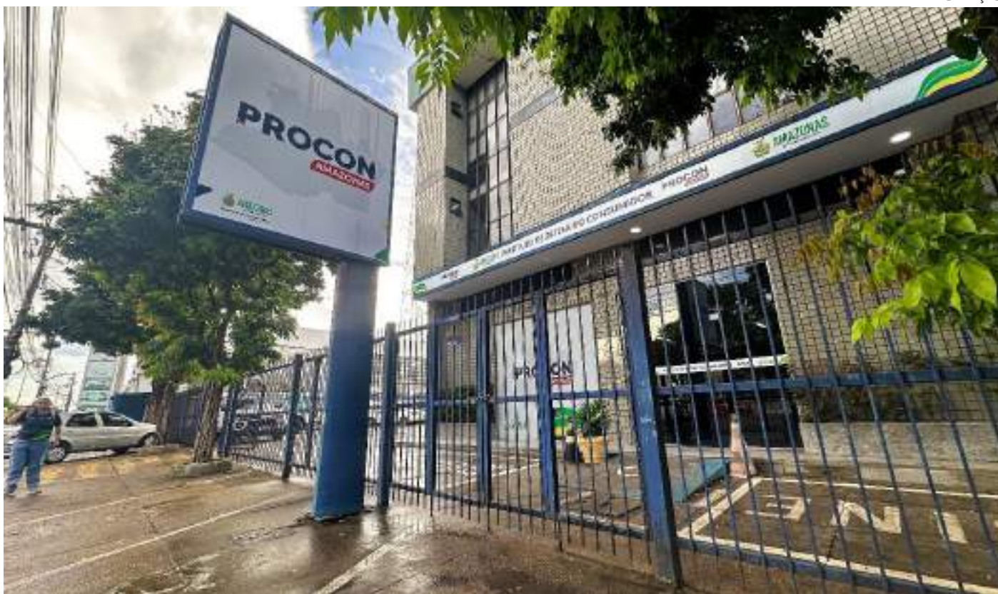
Procon-AM divulga ranking de empresas que lideram o número de reclamações