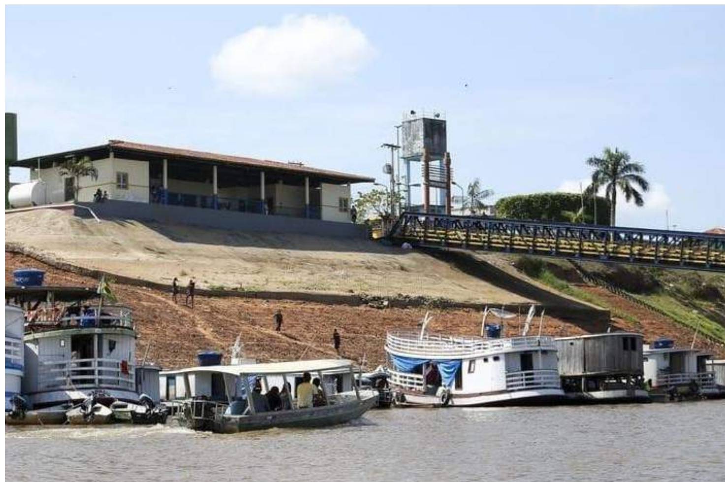
Equipe técnica será enviada para realizar uma avaliação mais detalhada das condições geológicas do Porto de Autazes