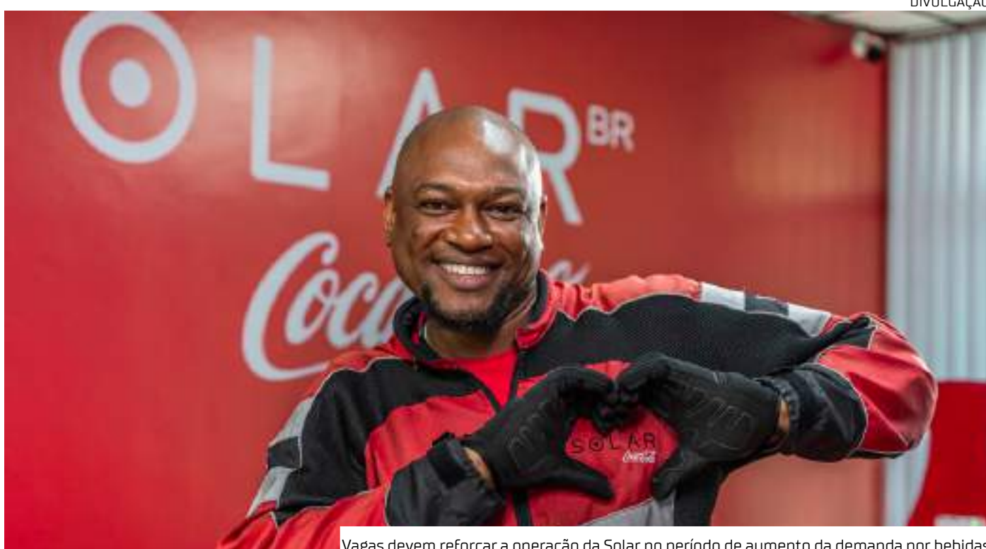
Vagas devem reforçar a operação da Solar no período de aumento da demanda por bebidas

Um exemplo disso é o projeto Coletivo Online, destinado a