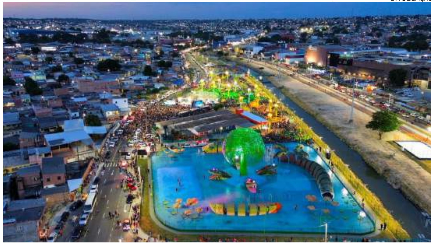
Projeto arquitetônico leva assinatura do Instituto Municipal de Planejamento Urbano (Implurb)

"A segunda etapa já está praticamente pronta. Estamos na fase final, só de ajustes finos, acabamentos,