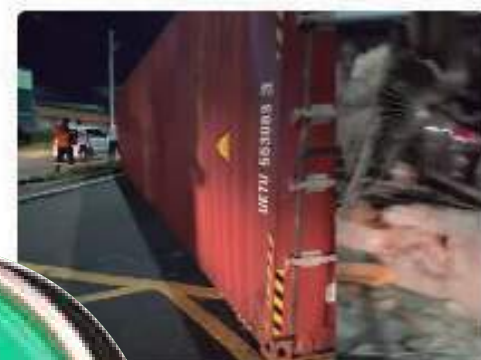
Trator tomba e atinge casa e carros na Manaus; VÍDEO