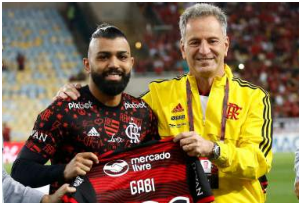
Atacante vive mau momento desde 2023 e chegou a perder camisa 10 por polêmicas extracampo