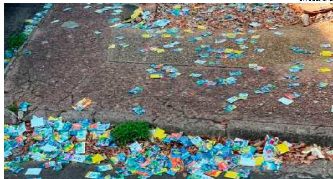
Candidatos foram flagrados fazendo o "derrame de santinhos" durante primeiro turno

"A legislação eleitoral, em especial a Lei n. 9.504/97, veda a propaganda irregular e, consequentemente, práticas que comprometam a igualdade de oportunidades entre os candidatos, tais como o