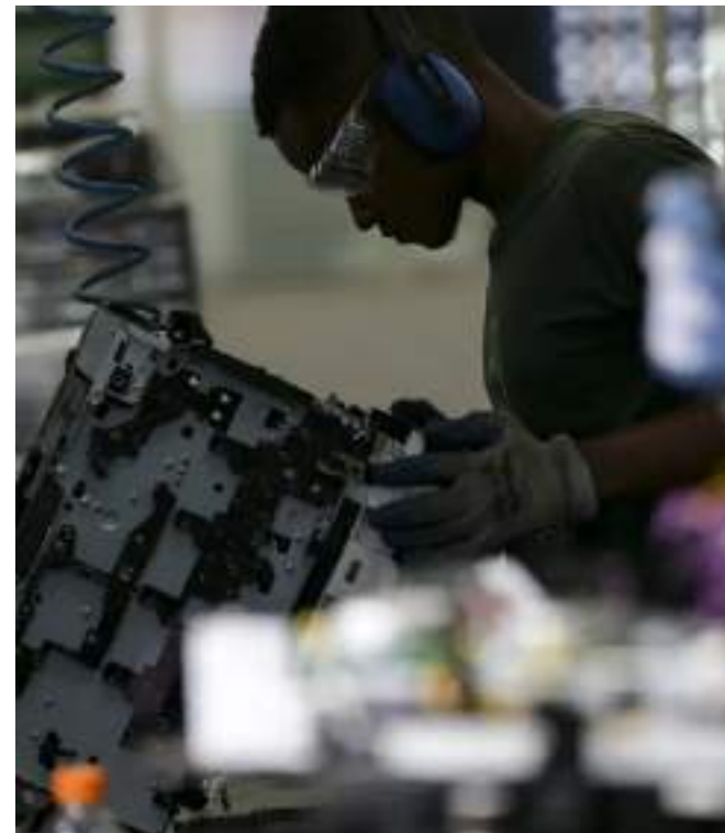
Pesquisa também aborda políticas públicas de emprego