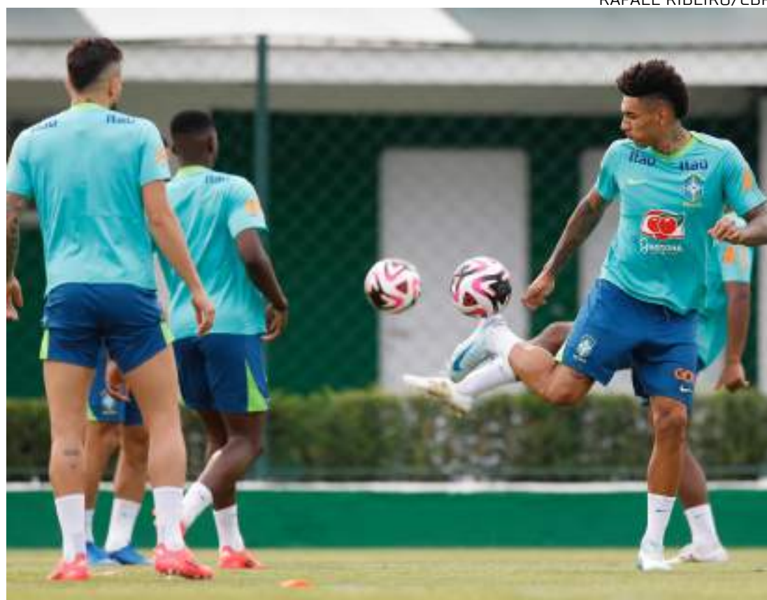
Igor Jesus, em sua primeira convocação à Seleção Brasileira, vive a expectativa pelo duelo

Na Academia de Futebol do Palmeiras, onde a Seleção se preparou para o primeiro compromisso desta Data FIFA – o Brasil ainda enfrenta o Peru, na terça-feira (15), em Brasília – o treinador confirmou o atacante Igor Jesus e o lateral-esquerdo