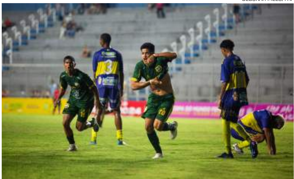
Clube novato venceu o CDC Manicoré por 1 a 0 na final, no Estádio Carlos Zamith