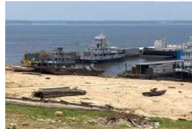
Previsão é que o Rio Negro fique abaixo dos 12m