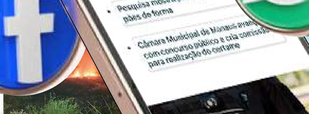
Bombeiros impedem propagação de incêndio em área de vegetação no interior do AM