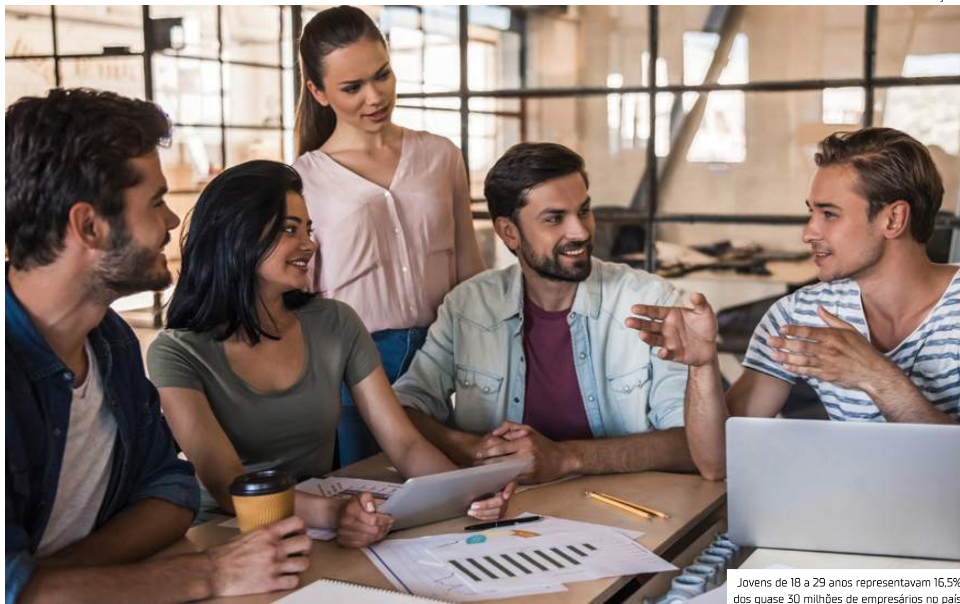
Jovens de 18 a 29 anos representavam 16,5% dos quase 30 milhões de empresários no país

dez anos, indicando uma evolução educacional.