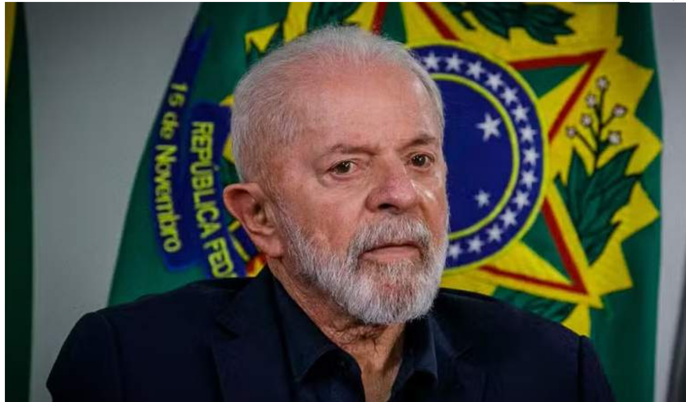
Avaliação positiva do governo Lula não aparece numericamente a frente na pesquisa Genial/Quaest

Para os próximos 12 meses, a expectativa de 45% da população é que a economia melhore (52% em julho). Já 36% esperam piora (27% em julho) e 18% não acreditam em mudança no panorama econômico (mesmo índice da pesquisa anterior).