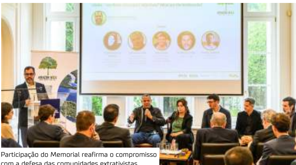
Participação do Memorial reafirma o compromisso com a defesa das comunidades extrativistas