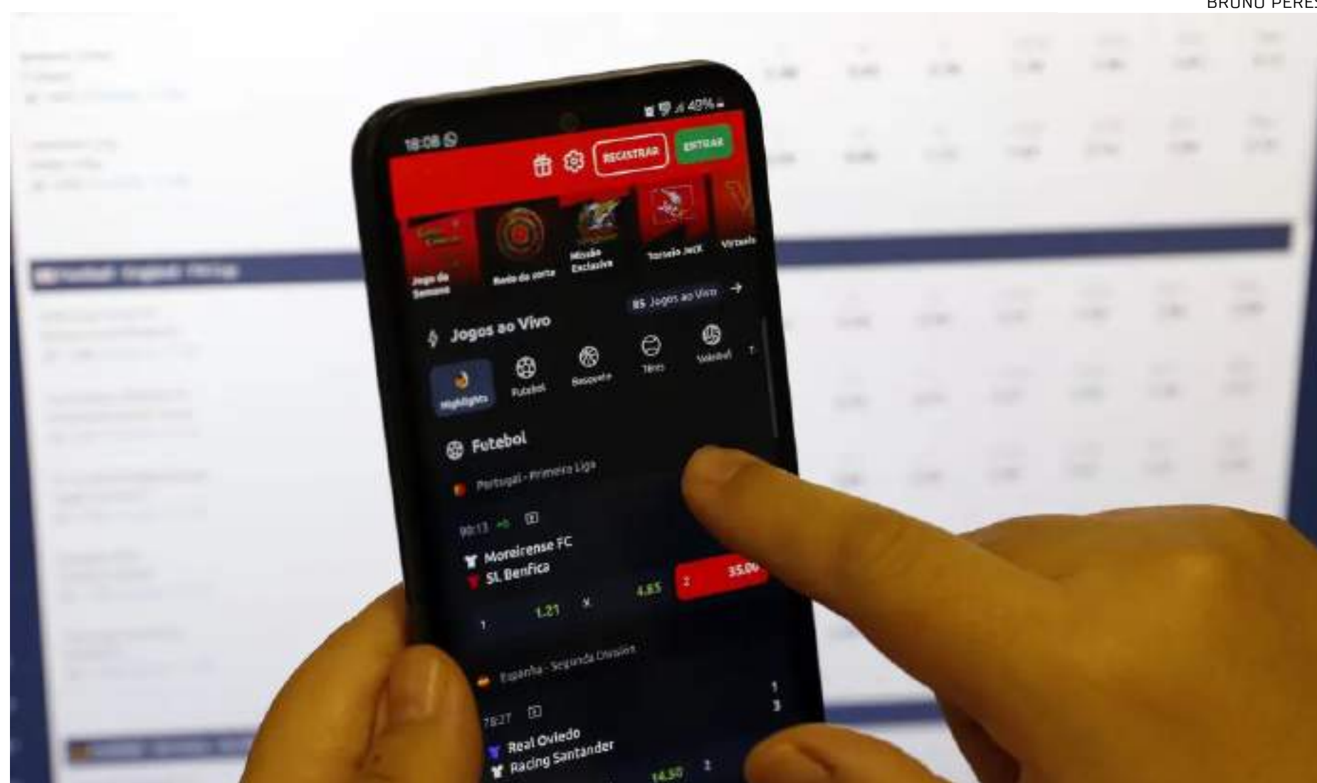
A partir do dia 11 deste mês, a Agência Nacional de Telecomunicações (Anatel) bloqueará as páginas ilegais

A proposta de acompanhamento foi feita pelo presidente do TCU, ministro Bruno Dantas, e aprovada por unanimidade. O ministro citou dados da XP Investimentos que mostram que o setor de bets deve movimentar entre R$ 90 bilhões e R$ 130 bilhões neste ano. Também foram citados dados do Itaú para demonstrar que os apostadores gastaram R$ 68,2 bilhões nos últimos 12 anos. "Estima-se que o mercado de apostas também pode repercutir no orçamento da saúde, uma vez que, com a inclusão de ações voltadas à população com vício nas bets,