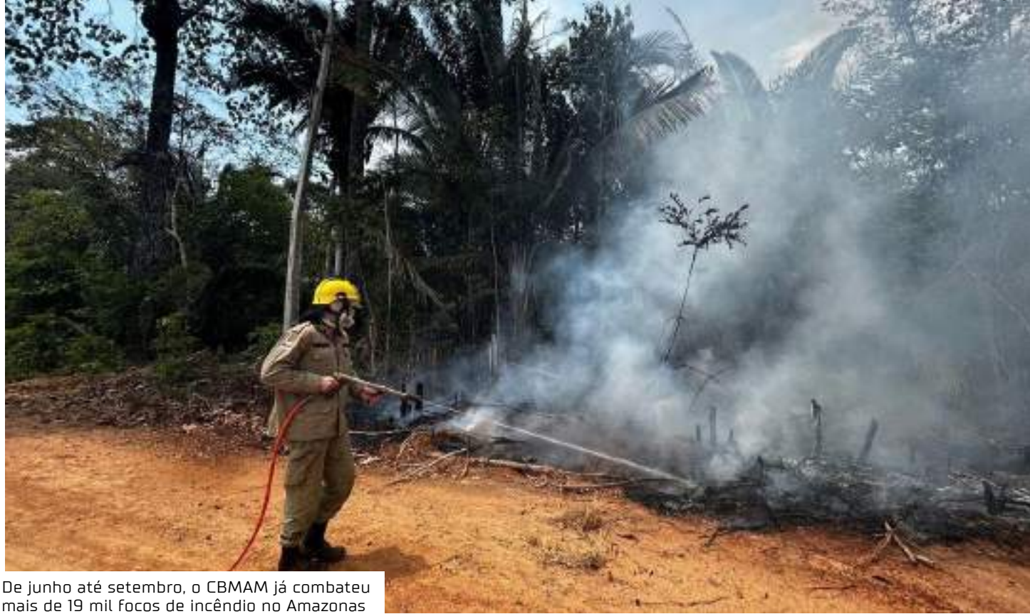
De junho até setembro, o CBMAM já combateu mais de 19 mil focos de incêndio no Amazonas

De acordo com o subcomandante-geral do CBMAM, coronel Reinaldo Menezes, já é possível