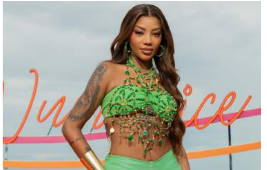
Show da cantora será realizado dia 20 de outubro, no Podium da Arena da Amazônia