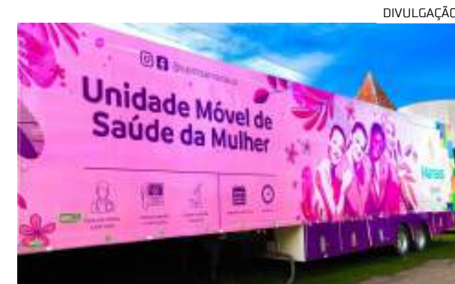
Unidades mpliam o acesso aos serviços por mulheres

Avenida Marginal, nº 64, Petrópolis (praça do Jardim Petrópolis) 23/9 a 5/10