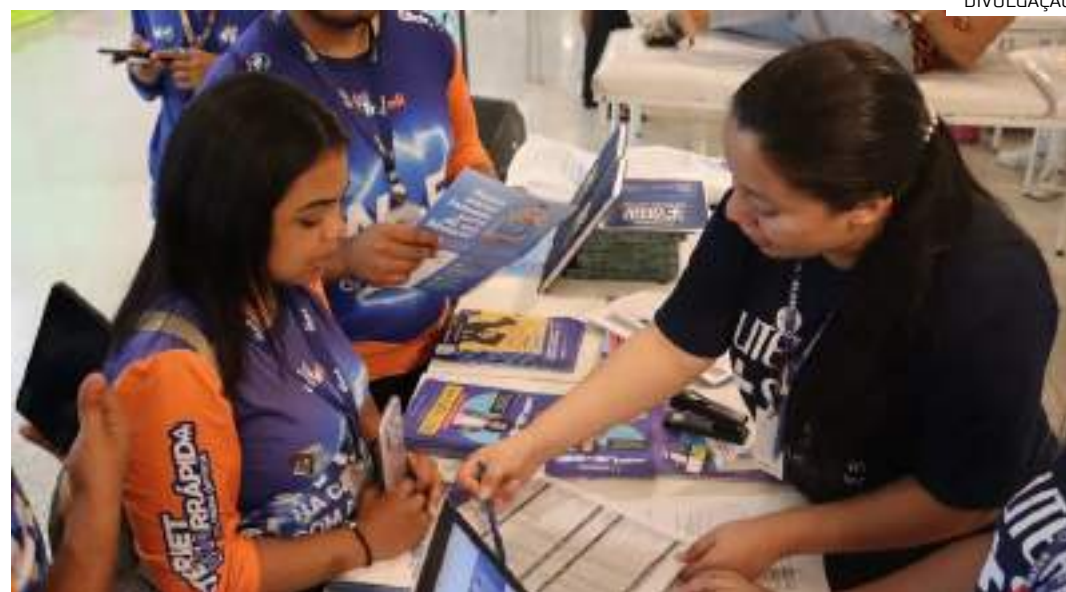
Público contará com serviços e orientações de saúde e para o ingresso ao mercado de trabalho

Durante a Feira EmpregueHabilidades, os visitantes poderão conferir o portfólio de cursos do Literatus, que estarão com matrículas a preços promocionais.