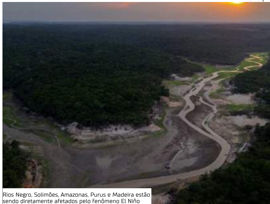
Rios Negro, Solimões, Amazonas, Purus e Madeira estão sendo diretamente afetados pelo fenômeno El Niño

da calha no município era de 2,53 metros.