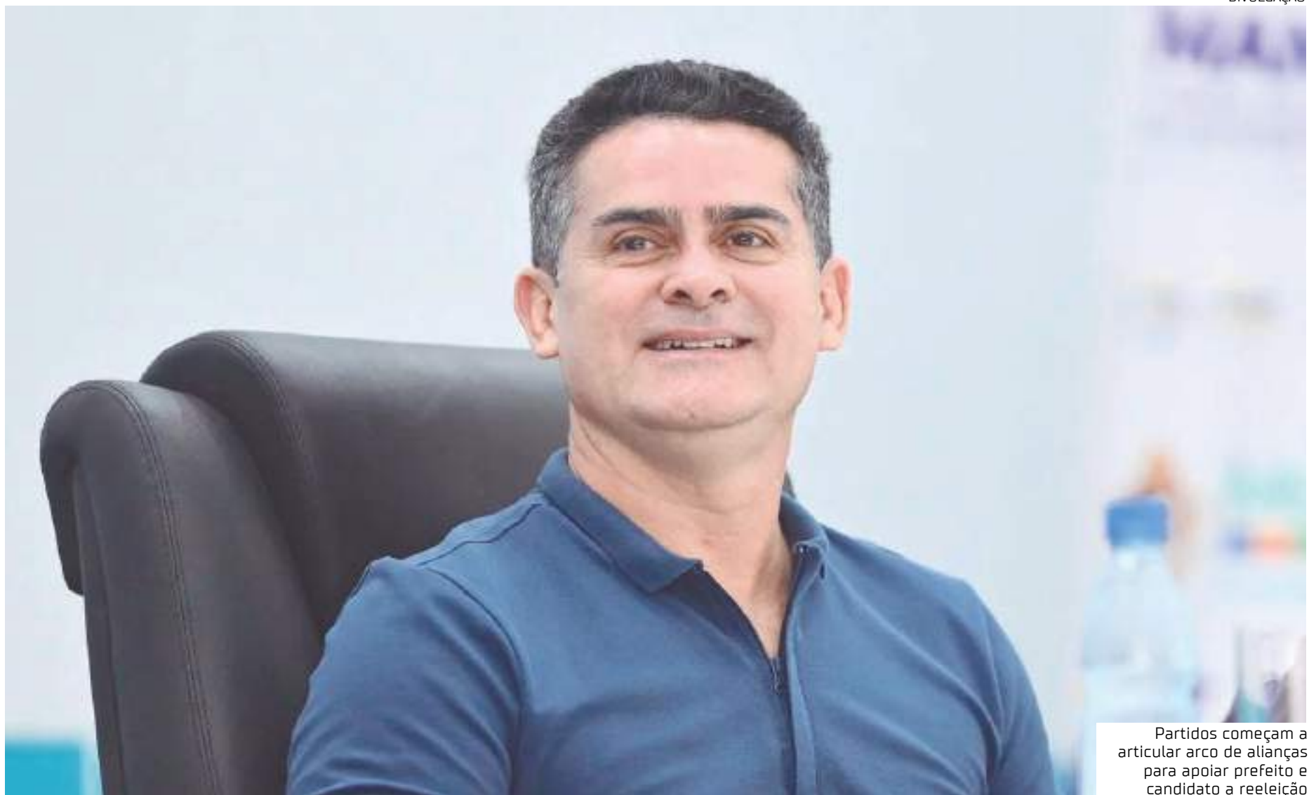
Partidos começam a articular arco de alianças para apoiar prefeito e candidato a reeleição

Santana segue a tendência de eleições anteriores, quando apoiou figuras como