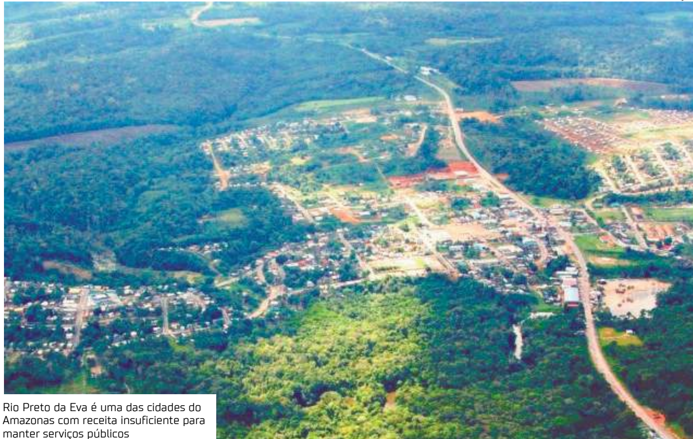
Rio Preto da Eva é uma das cidades do Amazonas com receita insuficiente para manter serviços públicos

beu R$ 2,1 bilhões do FPM, distribuídos de acordo com a densidade populacional. Manaus, por exemplo, recebeu R$ 68 milhões.