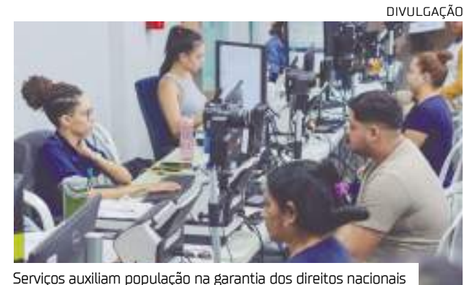
Serviços auxiliam população na garantia dos direitos nacionais

“A partir de segunda-feira, dia 14 de outubro, a entrega das carteiras será feita apenas por agendamento no site da PF, serão 275 vagas por dia. Pode acontecer de a pessoa tentar o agendamento e a cédula não ter chegado, e se ela estiver com o protocolo vencido, ela terá que se dirigir ao PAC para ser orientada e realizar a renovação”, explica o agente.