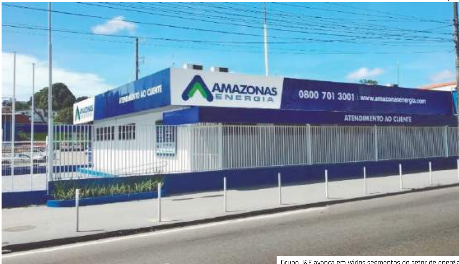
Grupo J&amp;F avança em vários segmentos do setor de energia