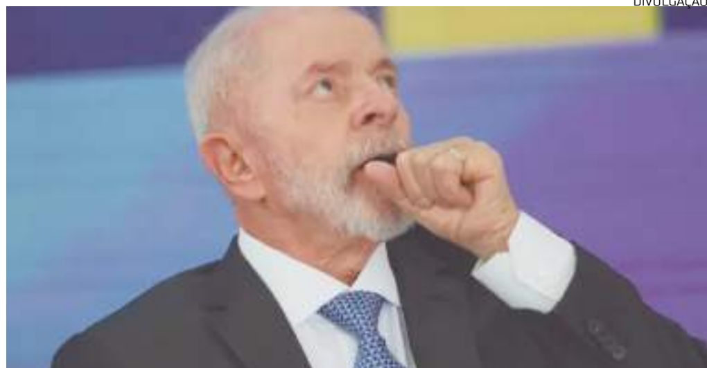
De acordo com o presidente Lula, novo valor é compromisso de Justiça