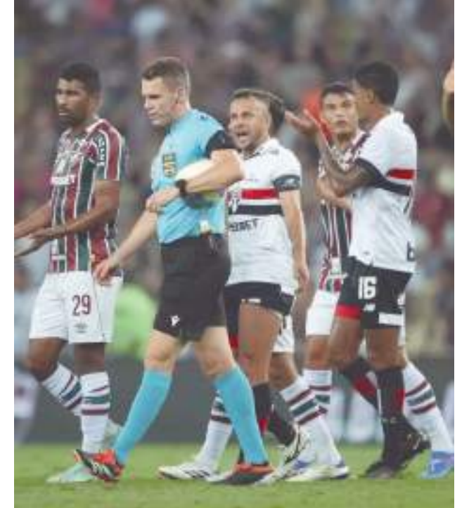
Tribunal considerou que erro do árbitro não interferiu no resultado