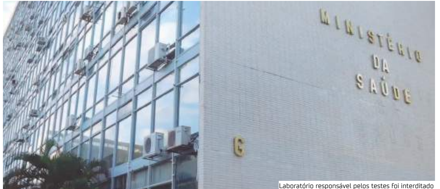
Laboratório responsável pelos testes foi interdito

Além disso, a pasta ordenou a retestagem do material de to-