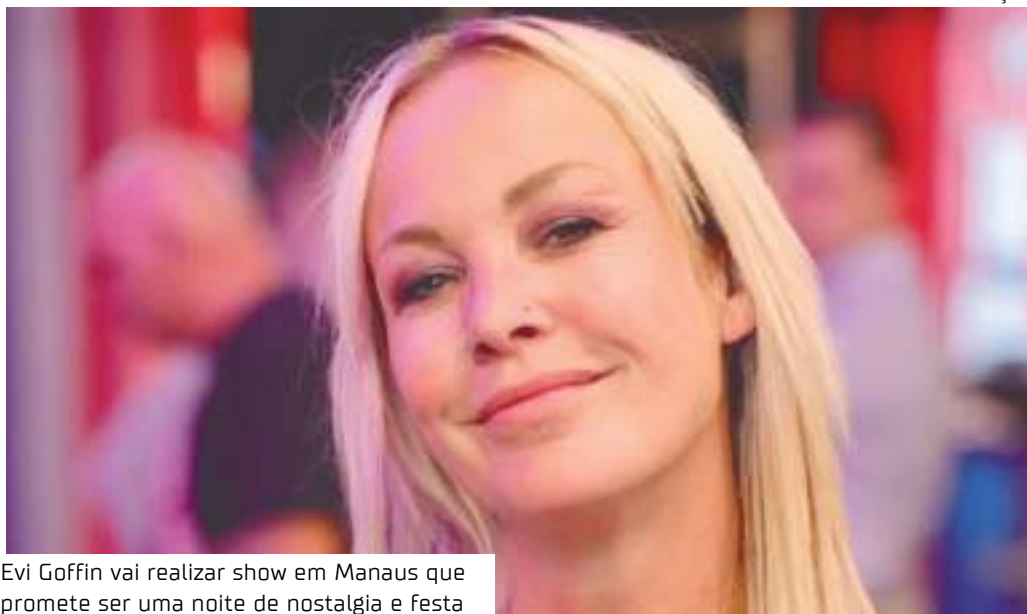
Evi Goffin vai realizar show em Manaus que promete ser uma noite de nostalgia e festa

“Dou aula de step, de aeróbica, e uso muito as músicas dela para meu trabalho. São bem legais e sincronizadas para os movimentos, ela é bem rítmica. Adoro, curto muito. Os anos 2000, 2001, por aí, foram o auge. Então, estou ansiosa para o show. Comprei o ingresso e as amigas estão doidinhas para ir, querem conhecer. Vai ser muito bom”, enfatizou.