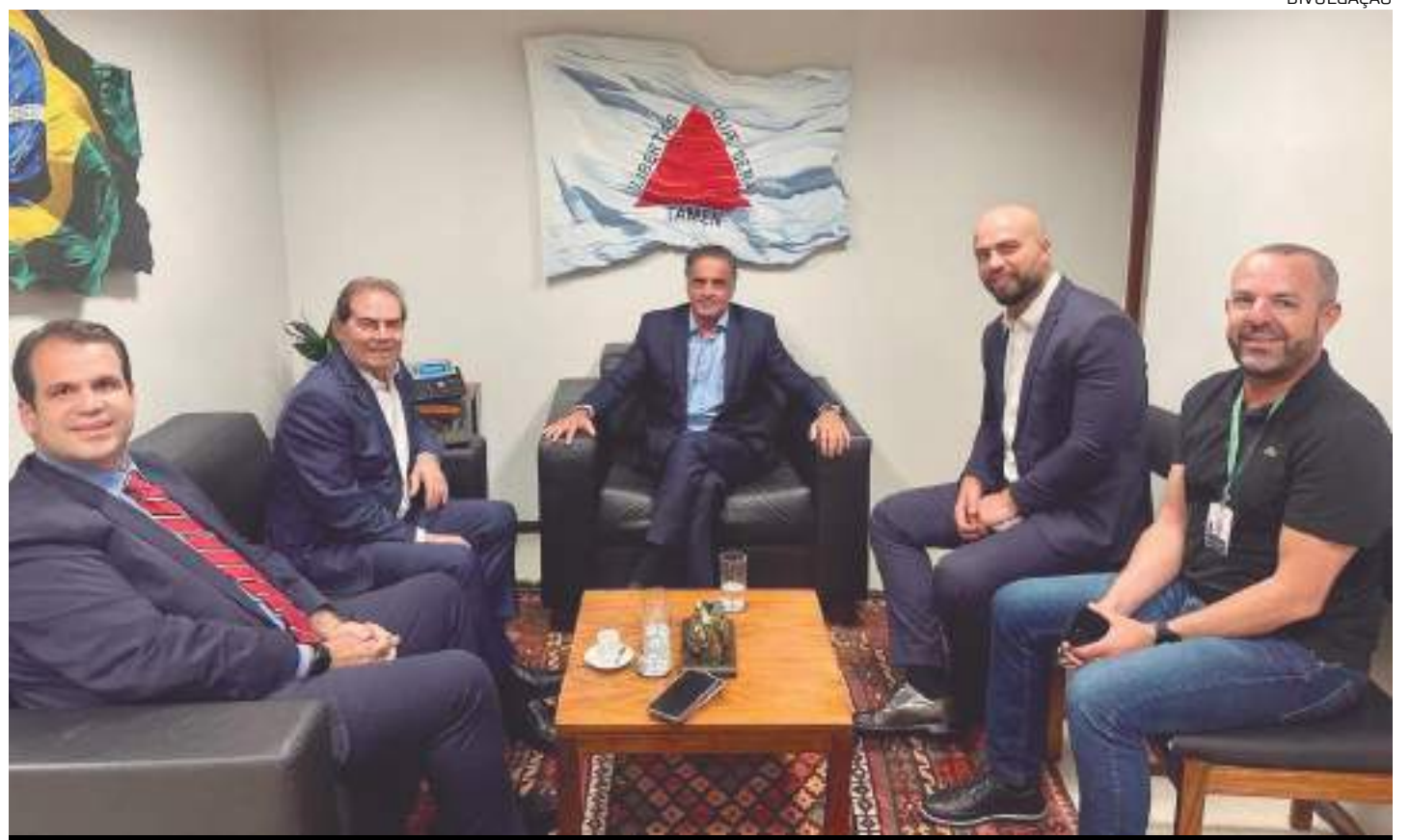
Projeto de 'centro democrático' visa ser alternativo ao lulopetismo e ao bolsonarismo

Ministro da Previdência Social do governo Lula, Lupi avalia ser impossível conseguir fechar as nego-