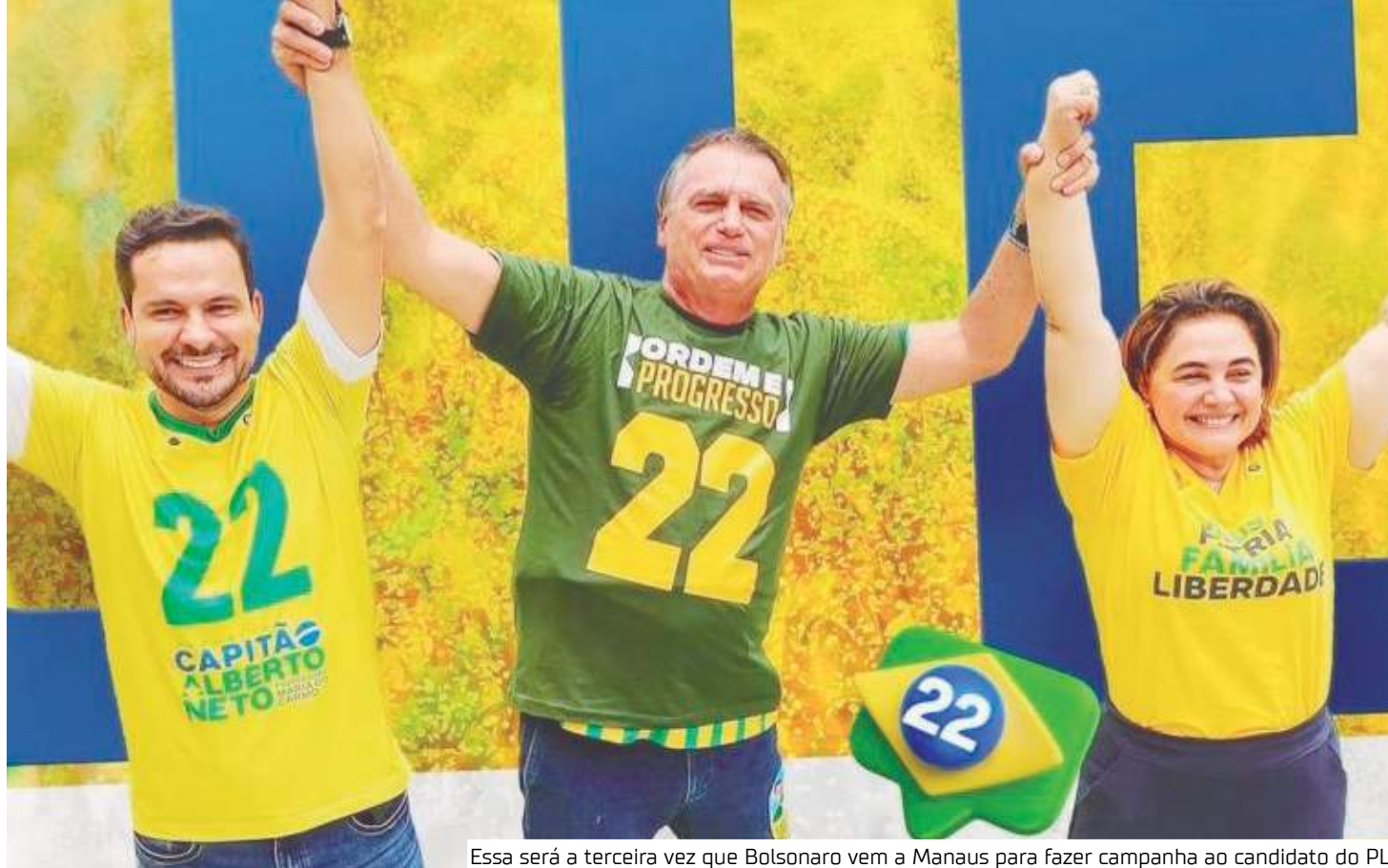
Essa será a terceira vez que Bolsonaro vem a Manaus para fazer campanha ao candidato do PL

"O ex-presidente ele teve 60% dos votos aqui em Manaus, eu acredito que os elei-