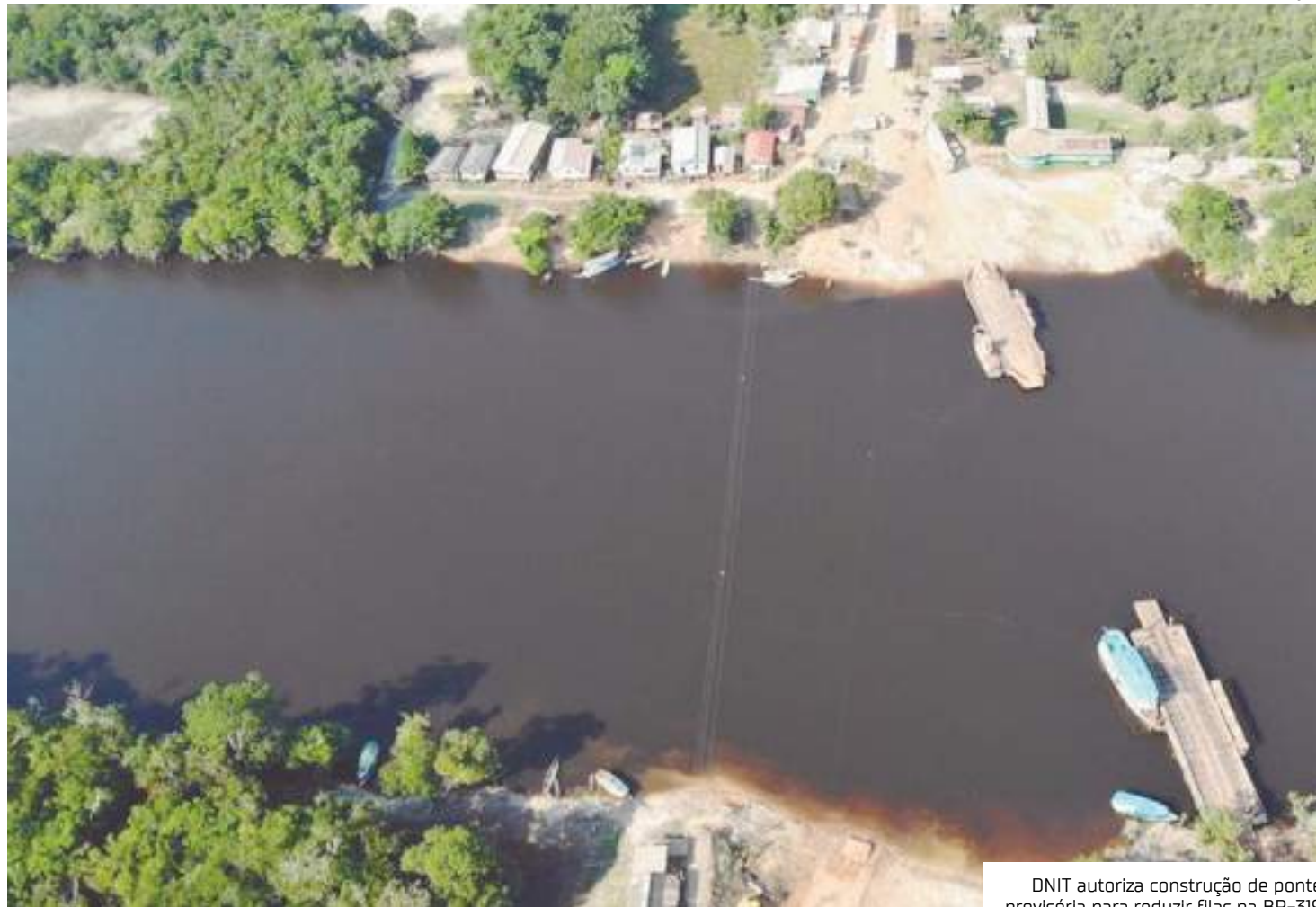
DNIT autoriza construção de ponte provisória para reduzir filas na BR-319

Outra medida anunciada pelo DNIT é que agora, os caminhões que transportam frutas e verduras para o porto da Ceasa estão liberados para atravessar 24 horas, atendendo o pedido de feirantes que