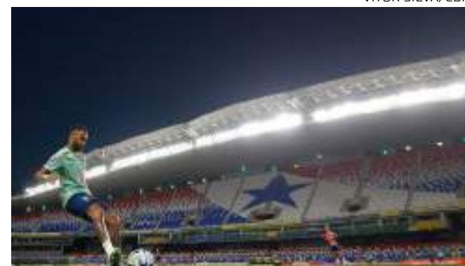
Venezuela e Uruguai serão últimos adversários do Brasil este ano