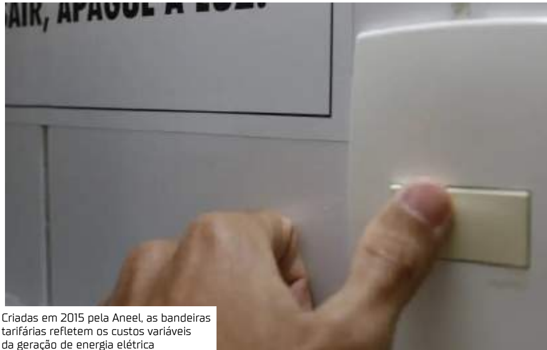
Criadas em 2015 pela Aneel, as bandeiras tarifárias refletem os custos variáveis da geração de energia elétrica

Segundo a Aneel, um dos fatores que determinaram a redução da bandeira tarifária para amarela foi a melhoria nas condições de geração de energia no país. A agência reguladora, no entanto, informou que a previsão de chuvas e de vazões nas regiões das hidrelétricas continua abaixo da média, o que justifica o acionamento da bandeira tarifária para cobrir os custos da geração