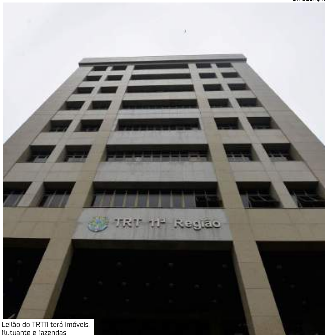
Leilão do TRT11 terá imóveis, flutuante e fazendas

O arrematante deve pagar sinal de 25% no ato da arrematação, além da comissão de 5% do leiloeiro, com acréscimo de 1% se tiver havido remoção do bem para depósito. O valor restante deverá ser pago em até 24h, diretamente na agência bancária autorizada, via guia emitida na ocasião. Quem desistir da arrematação, não efetuar o depósito do saldo reman-