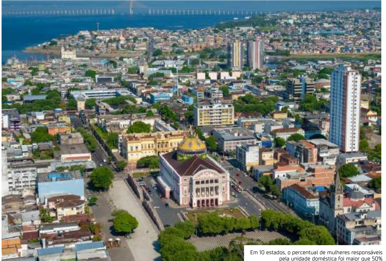
Em 10 estados, o percentual de mulheres responsáveis pela unidade doméstica foi maior que 50%

As espécies de unidades domésticas têm as suas particularidades e representam, de certa forma,