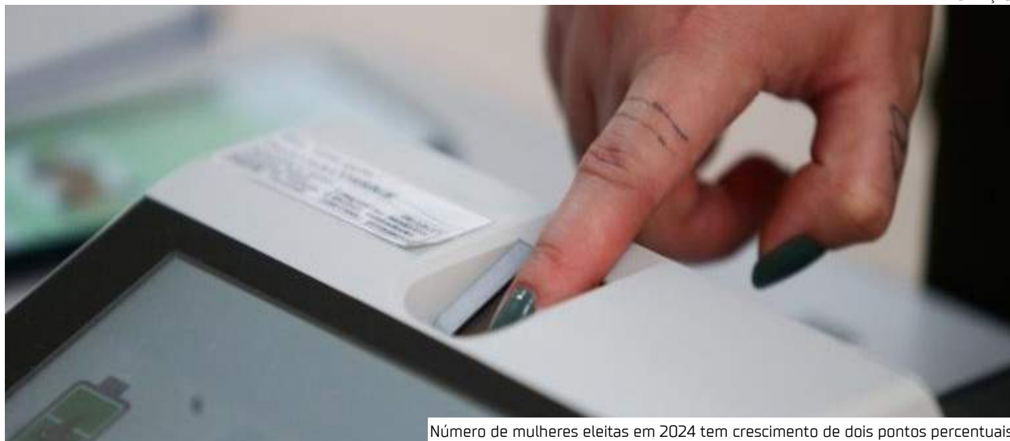
Número de mulheres eleitas em 2024 tem crescimento de dois pontos percentuais

"Proporcionalmente, mais mulheres foram eleitas este ano quando comparado com 2020, mas a variação foi bastante tímida, com uma predominância ainda alta de homens nos legislativos locais a partir de 2025", afirma o estudo, que é assinado pelo cientista político Fábio Vasconcellos.