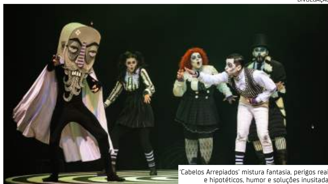
'Cabelos Arrepiados' mistura fantasia, perigos reais e hipotéticos, humor e soluções inusitadas

Diretor do espetáculo e fundador da Cia Buia Teatro