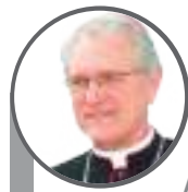
Cardinal Leonardo Steiner