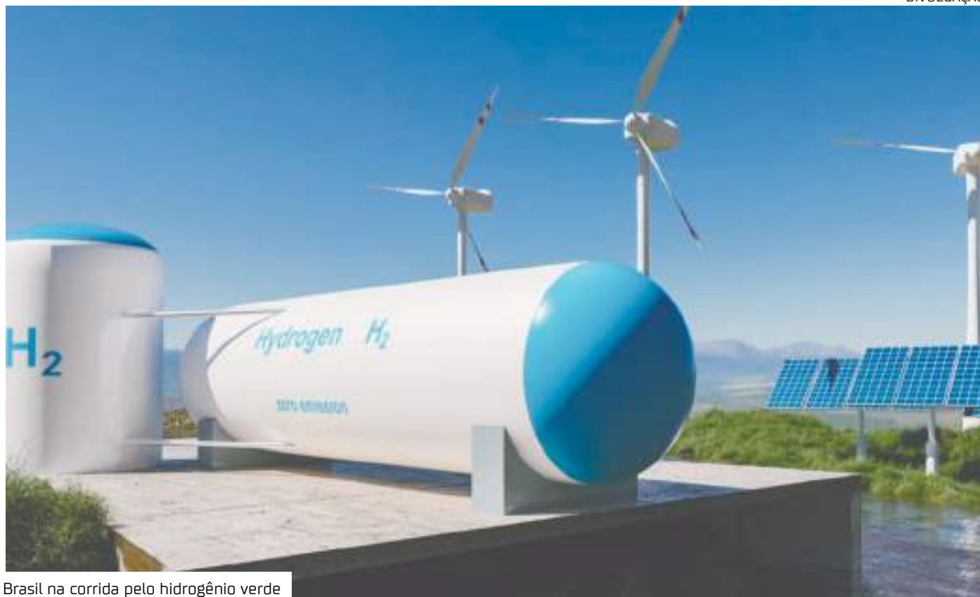
Brasil na corrida pelo hidrogênio verde

As próprias indústrias latino-americanas poderiam ser importantes clientes de hidrogênio, comentou Schaich. "Todos os projetos começarão de fato quando os setores de transporte marítimo, aéreo e pesado assi-