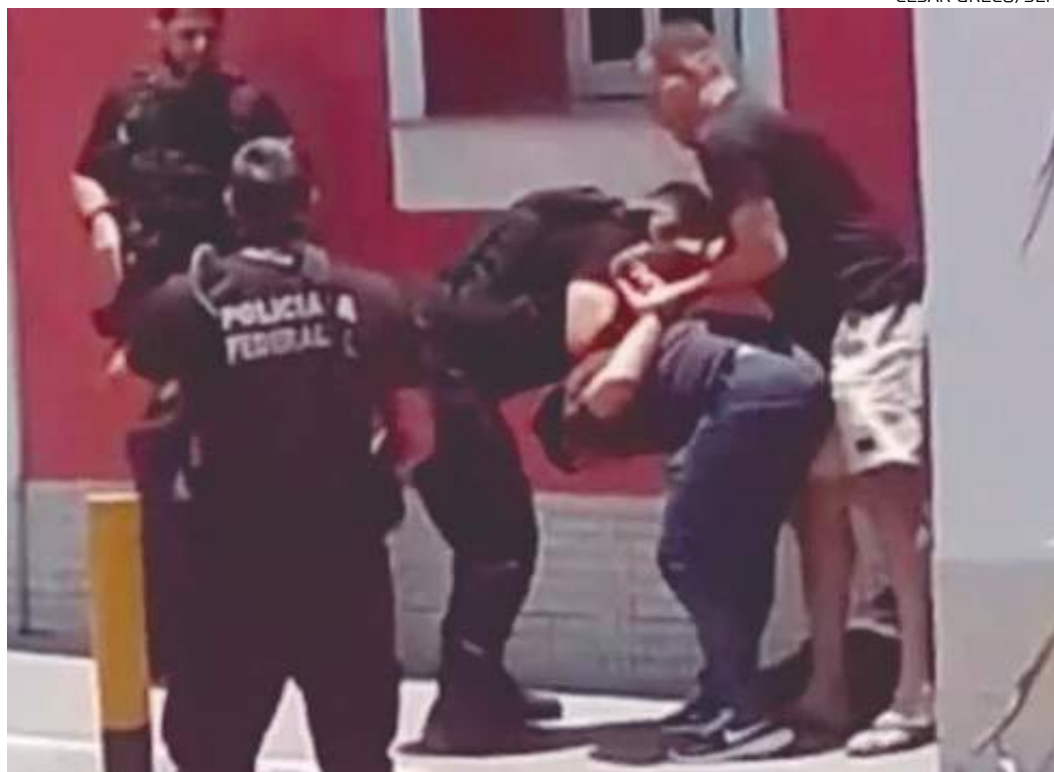
Cunhado do secretário de Parintins é preso pela PF com R$ 30 mil às vésperas da eleição

A legislação eleitoral proíbe "dar, oferecer, prometer, solicitar ou receber, para si ou para outrem, dinheiro, dádiva, ou qualquer outra vantagem, para obter ou dar voto e para conseguir ou prometer a abstenção, ainda que a oferta não seja aceita"