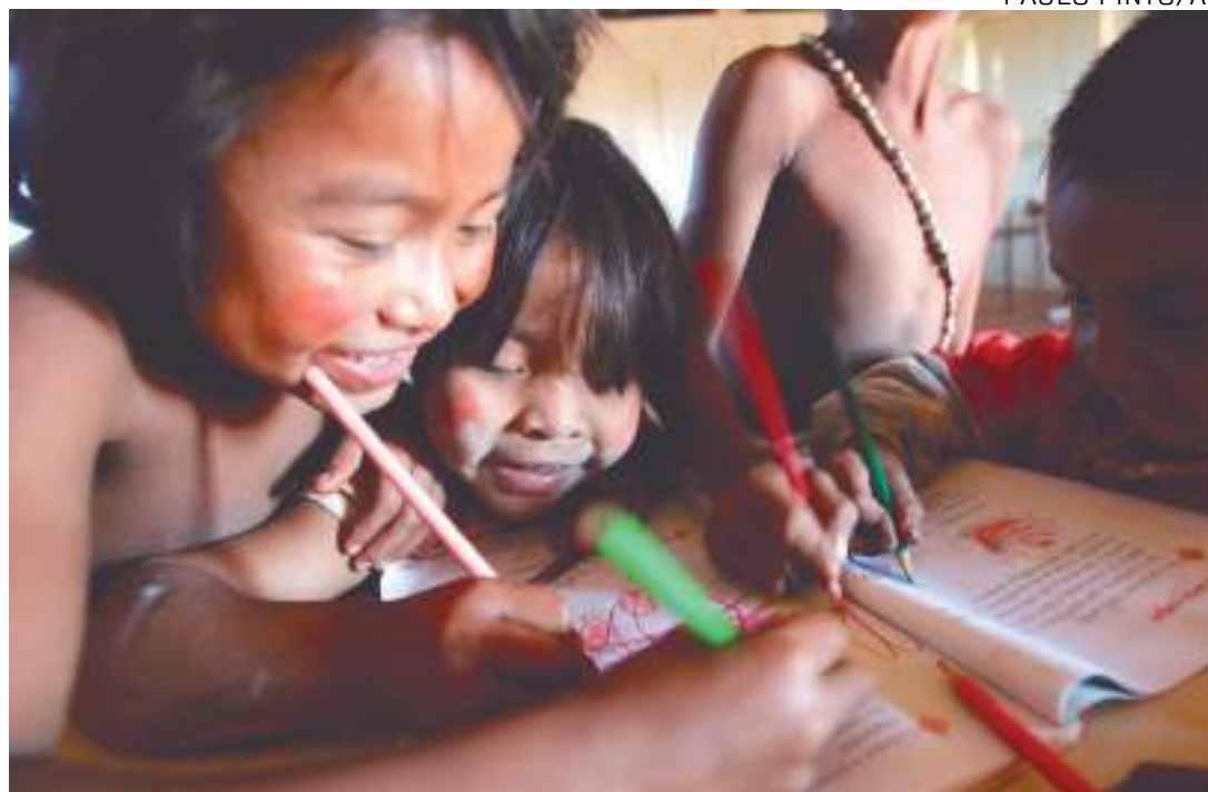
Dados de 2022 revelam que quanto maior a faixa etária, maior a proporção de analfabetismo

O levantamento apurou informações de alfabetização, registro de nascimento e ca-