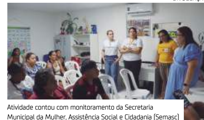
Atividade contou com monitoramento da Secretaria Municipal da Mulher, Assistência Social e Cidadania (Semasc)