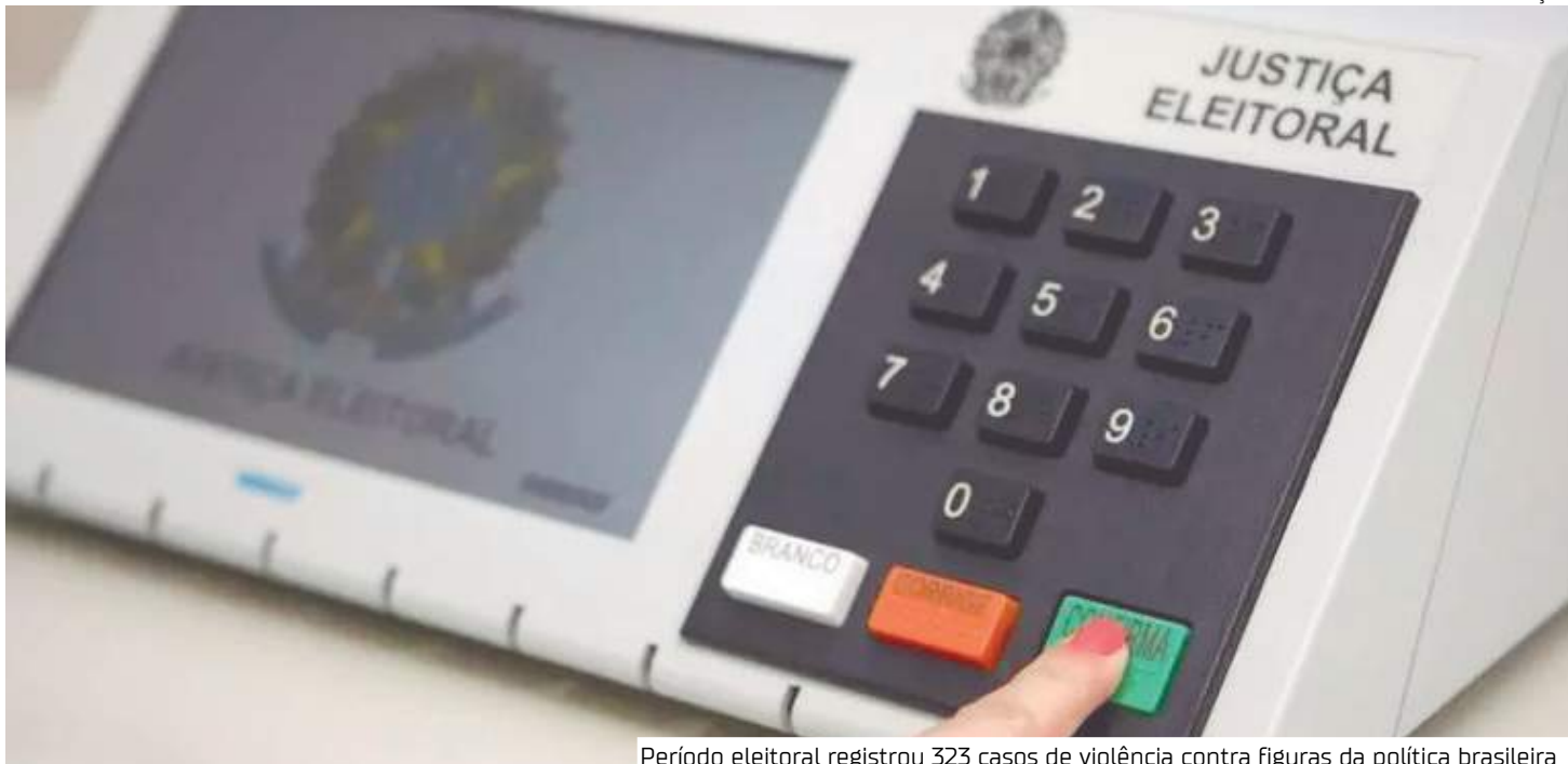
Período eleitoral registrou 323 casos de violência contra figuras da política brasileira

Os outros 81 casos foram tipificados como violência de natureza semiótica (como des-