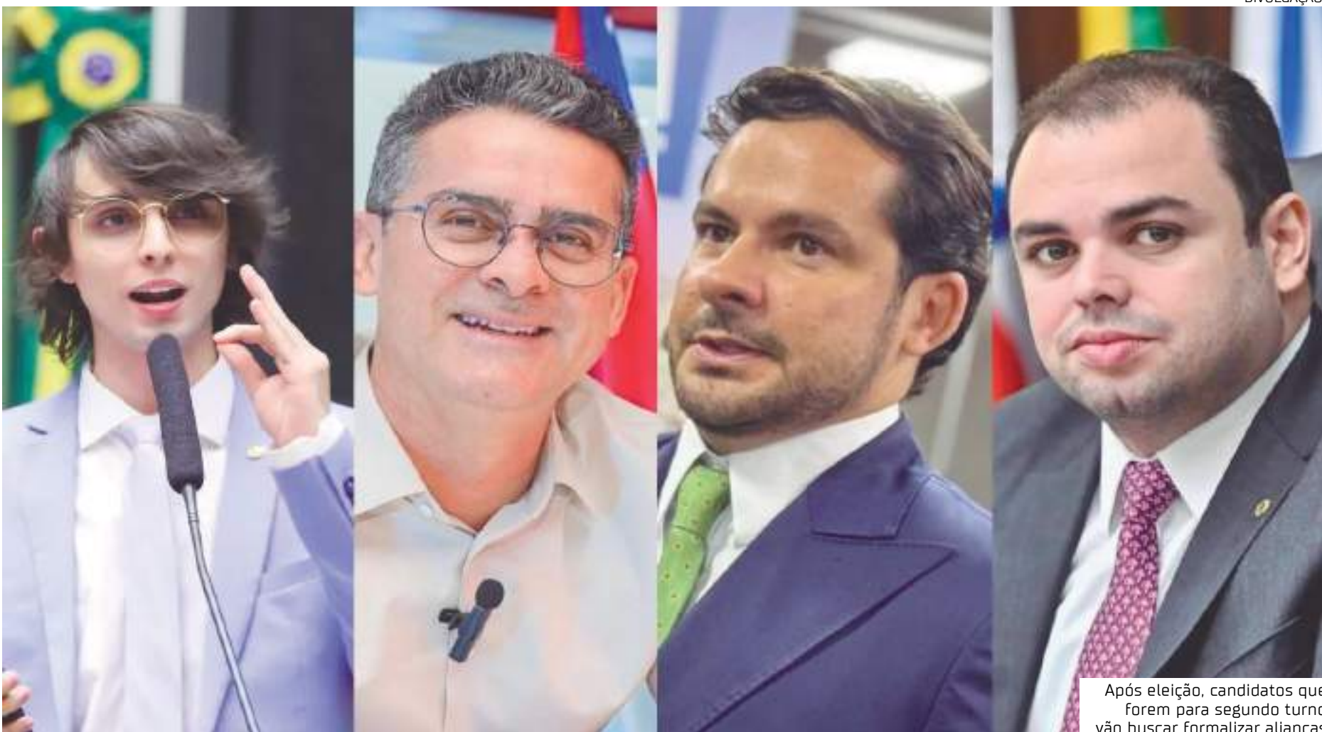
Após eleição, candidatos que forem para segundo turno vão buscar formalizar alianças

votos, não foi para o segundo turno, não quer dizer que esses 200 mil votos sejam direcionados ao candidato que ele apoiará. Mas, uma certa influência acredito que tem sim e aí quem for para o segundo turno vai tentar explorar essa influência ou minimizar caso não tenha o apoio a influência daquele candidato que perdeu".