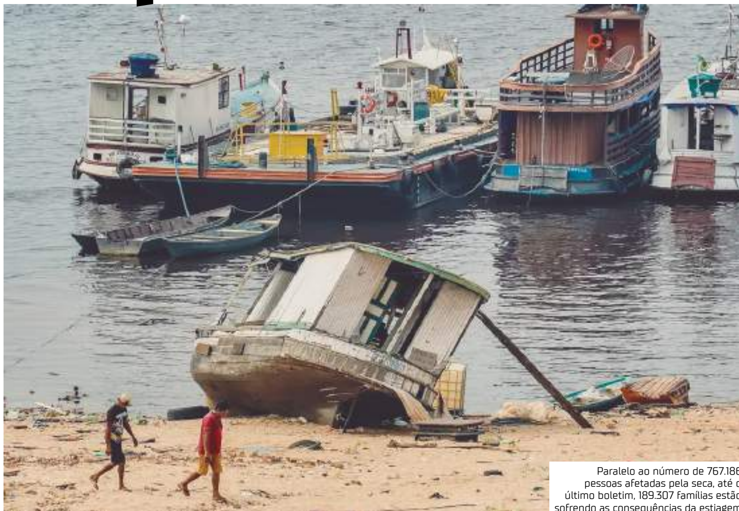
Paralelo ao número de 767.186 pessoas afetadas pela seca, até o último boletim, 189.307 famílias estão sofrendo as consequências da estiagem

No âmbito da assistência humanitária, o Governo do Amazonas já distribuiu 2,1 mil toneladas de alimentos para as regiões mais atingidas.