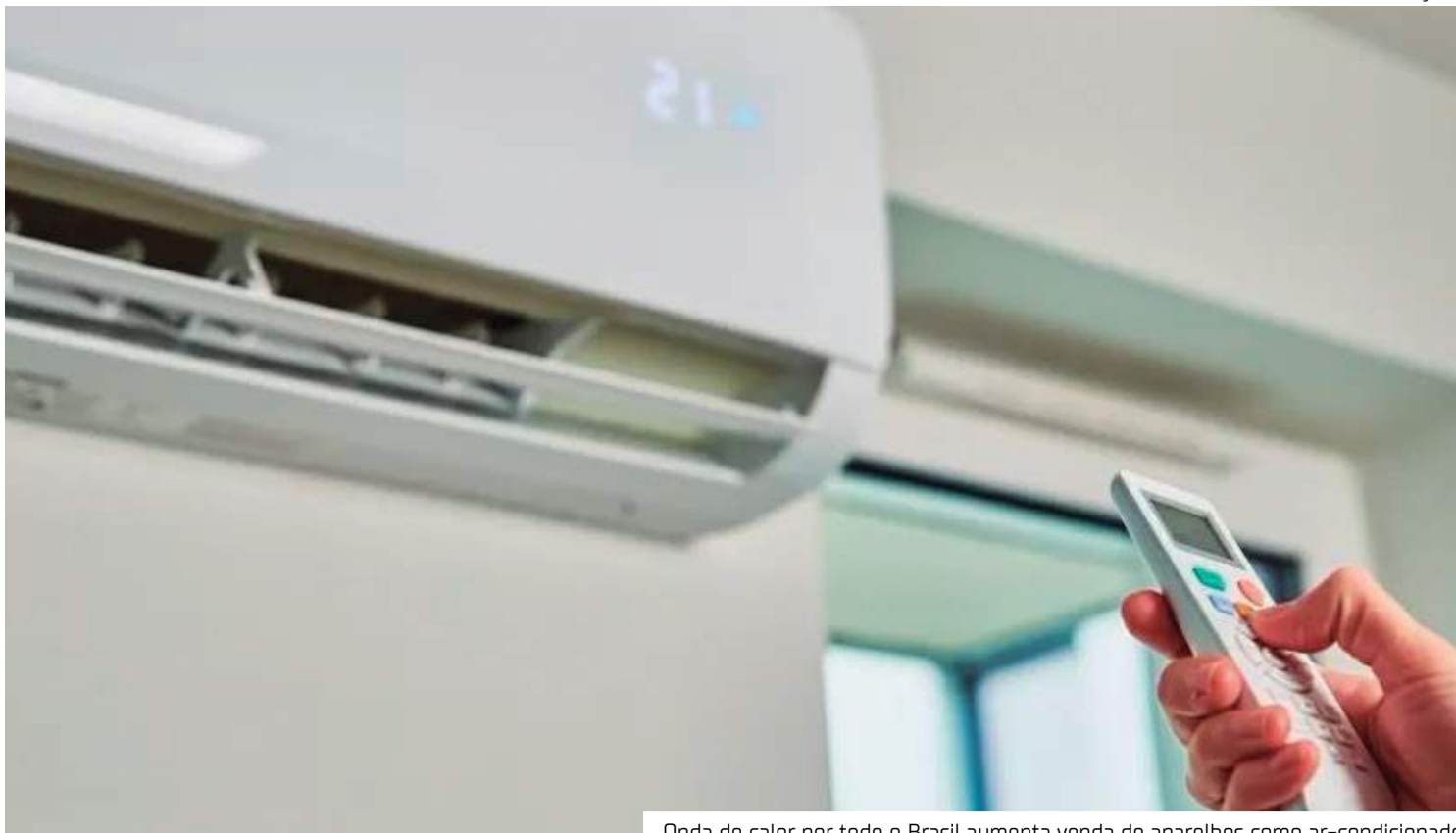
Onda de calor por todo o Brasil aumenta venda de aparelhos como ar-condicionado

"Agora agente, enfim, começa a recuperar todas as perdas que aconteceram em 2022 e no início de 2023. Se os fatores econômico e climático se mantiverem, podemos alcançar um resultado ainda melhor, ou pelo menos igual ao que aconteceu no primeiro semestre. Como esses fatores não estão na decisão ou nas mãos da indústria, a gente tem a expectativa otimista, mas cautelosa,