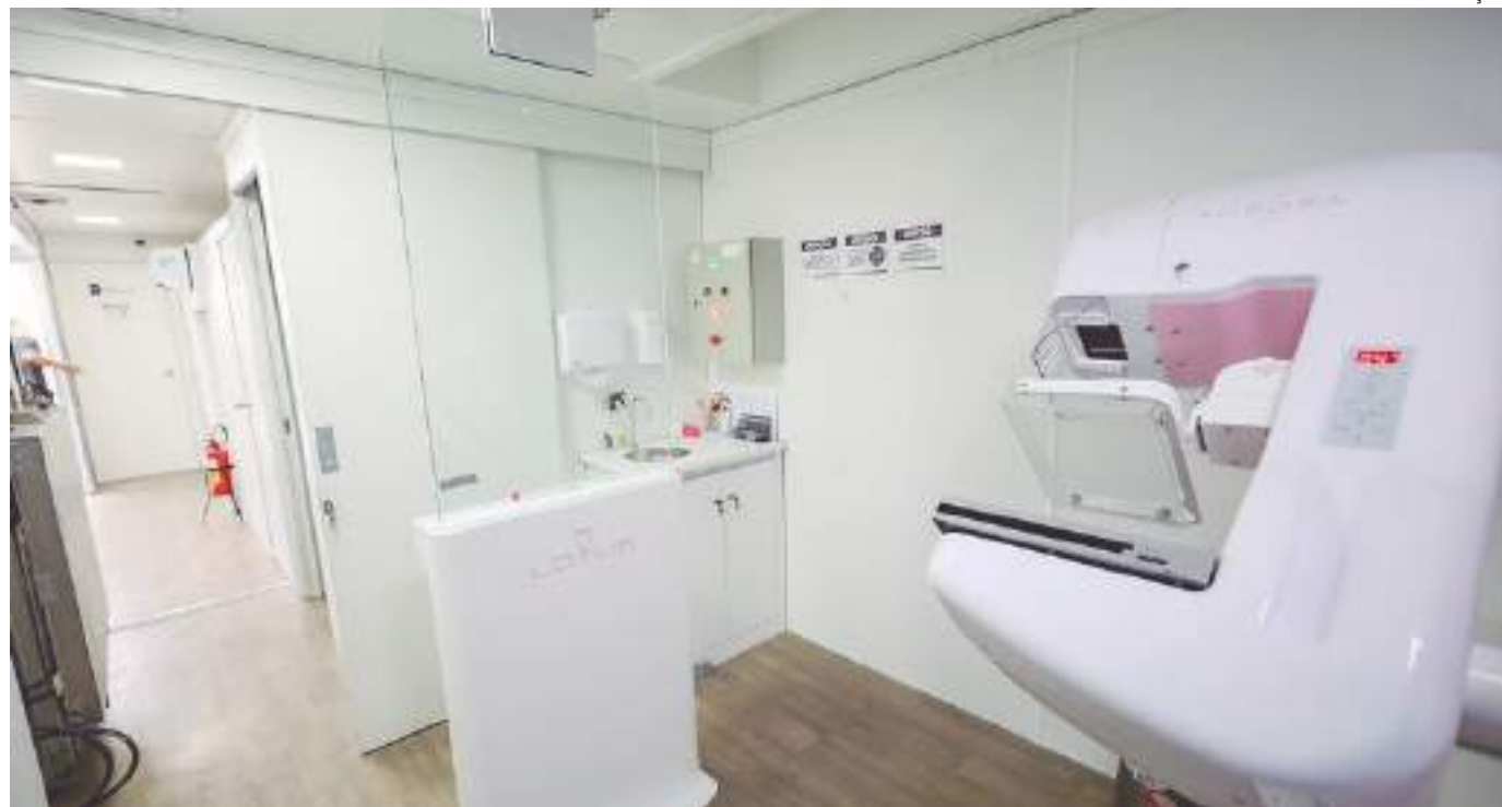
Unidade móvel do Governo do Amazonas oferece mamografia e ultrassonografia