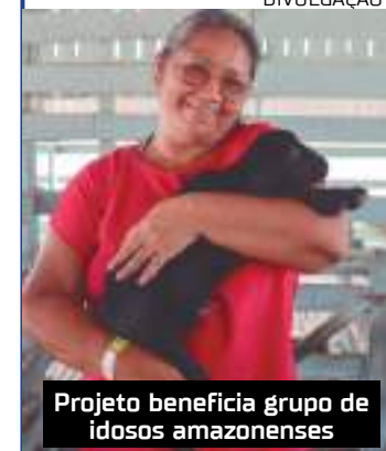
Projeto beneficia grupo de idosos amazonenses