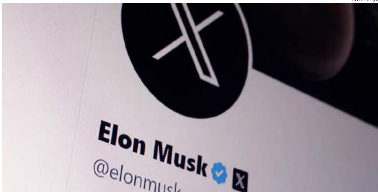
Moraes retirou o X do ar após a empresa fechar seu escritório do Brasil e deixar de ter representante legal

Moraes retirou o X do ar após a empresa fechar seu escritório do Brasil e deixar