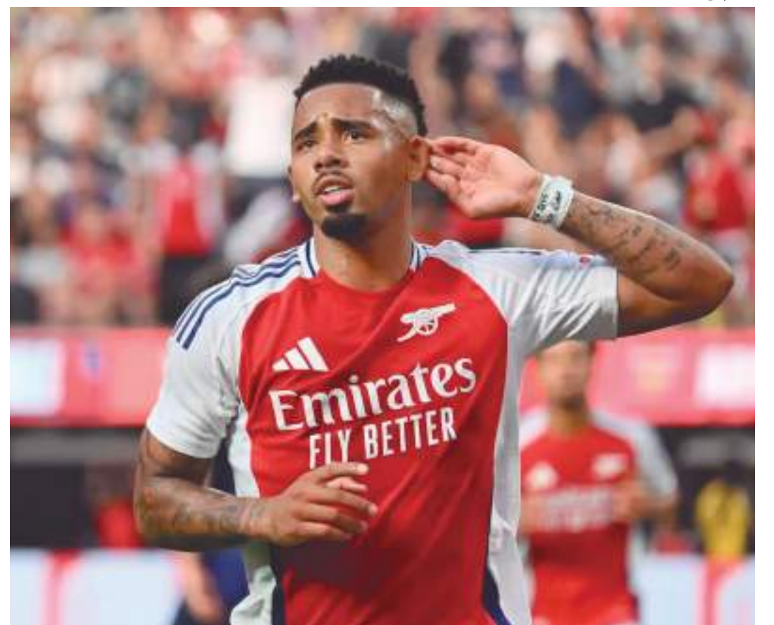
Retorno do atacante dos Gunners é sonho antigo do Alvirverde e dos torcedores