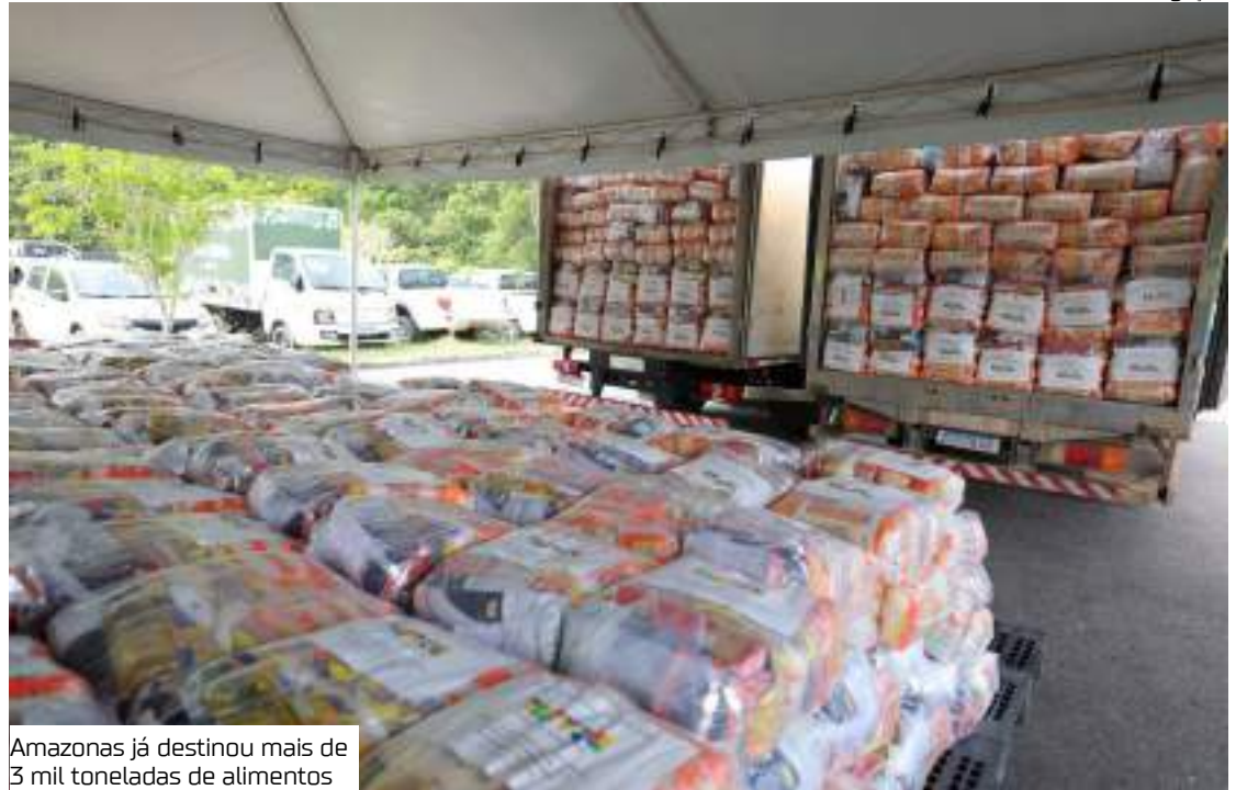
Amazonas já destinou mais de 3 mil toneladas de alimentos

“A cesta básica nesse momento é essencial para os nossos pescadores porque a seca esse ano foi maior do que a do ano passado. O rio