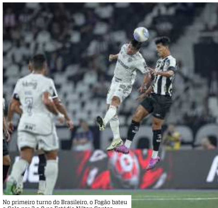
No primeiro turno do Brasileiro, o Fogão bateu o Galo por 3 a 0 no Estádio Nilton Santos

O Botafogo não tem desfalques por lesão ou suspensão. Porém, o técnico Artur Jorge pode não ter todos os jogadores a postos para o embate