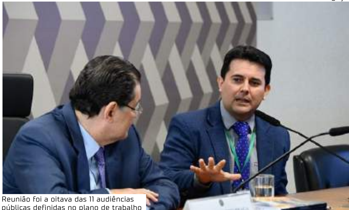
Reunião foi a oitava das 11 audiências públicas definidas no plano de trabalho

No entanto, ele apontou que o mesmo não está previsto para as ALCs, seja com relação à indústria seja quanto ao comércio.