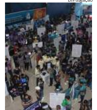
Evento acontece em dois turnos

O evento é também uma excelente oportunidade de networking e visibilidade, conectando profissionais, acadêmicos e especialistas para fortalecer o diálogo entre o presente e o futuro das cidades inteligentes.