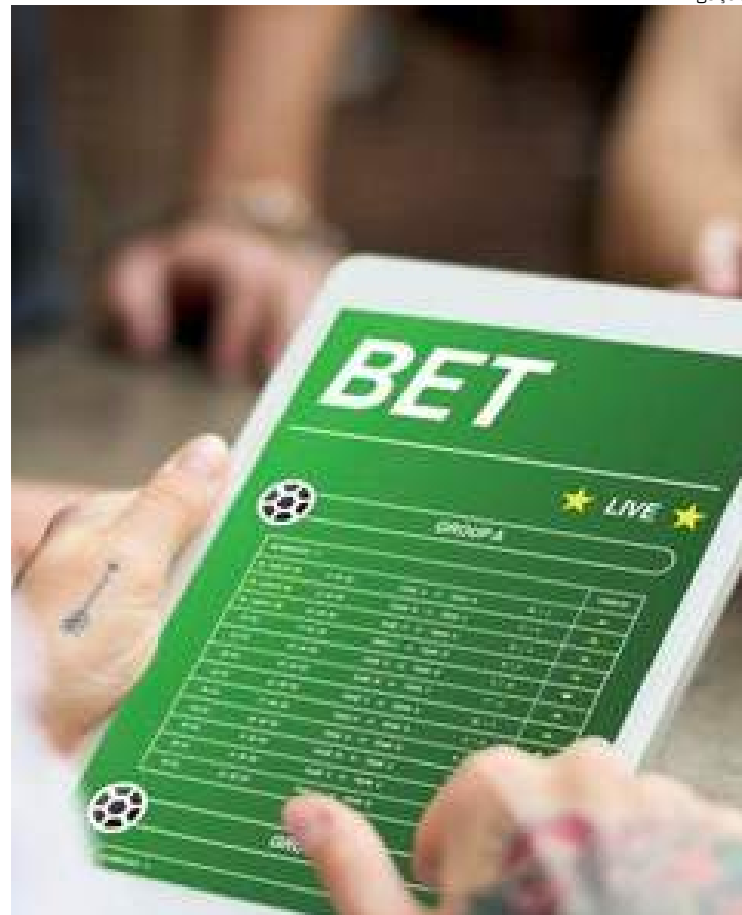
Pesquisa mostra que 37% dos endividados apostam atualmente no Norte

Entre 10 e 18 de outubro, a pesquisa com 34 questões ouviu 4.463 consumidores inadimplentes, acima de 18 anos e de todas as regiões, sendo 52% mulheres e 48% homens. A margem de erro é de 1,4 pp e o intervalo de confiança é de 95%.