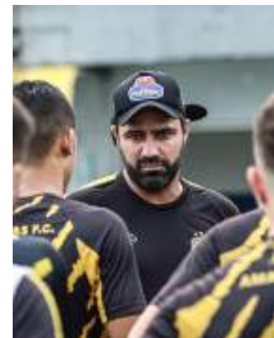
Esta foi a segunda passagem pela Onça

Em sua primeira passagem, comandou o time aurinegro no acesso à Série C, em 2022. No ano seguinte, foi campeão do Campeonato Amazonas e, na terceira divisão nacional, guiou a equipe rumo ao quadrangular final do torneio. Após duas derrotas nos dois primeiros duelos da fase final, foi demitido e viu a equipe subir para a Série B sob o comando de Luizinho Vieira.