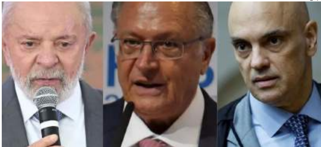
Cinco pessoas foram presas por plano para matar autoridades

Segundo as investigações que respaldaram o aval de Moraes à operação, os suspeitos se conectavam pelo aplicativo Signal em um