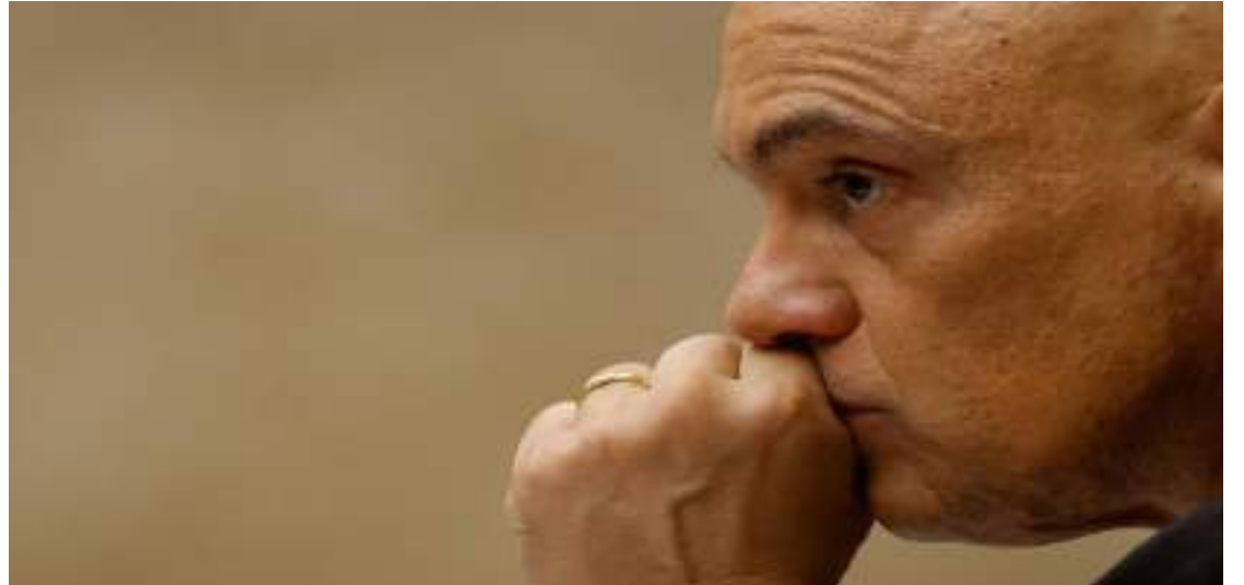
Ministro Alexandre de Moraes durante sessão plenária do Supremo Tribunal Federal

“Nós que acreditamos na democracia — e não importa se é liberal, progressista,