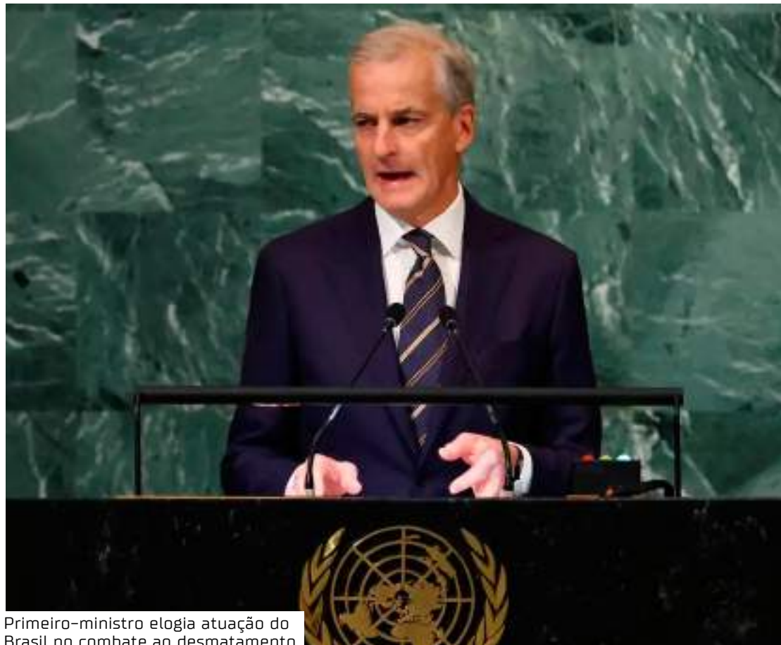
Primeiro-ministro elogia atuação do Brasil no combate ao desmatamento

De acordo com o BNDES, dados do Projeto de Monitoramento do Desmatamento na Amazônia Legal por Satélite (Prodes/Inpe), indicam que no período entre agosto de 2023