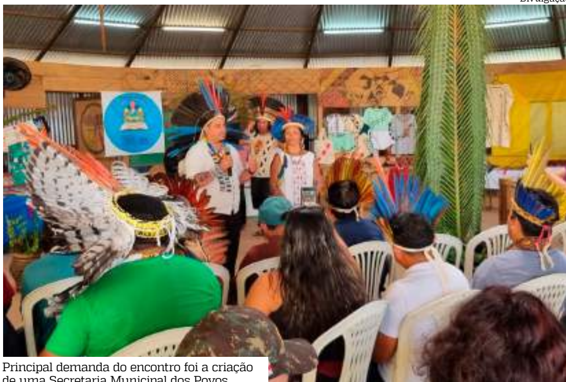
Principal demanda do encontro foi a criação de uma Secretaria Municipal dos Povos