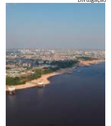
Rio Negro está no nível de 13,85 metros

O Governo do Amazonas já enviou 202,6 toneladas de medicamentos e insumos para municípios das regiões dos rios Madeira, Juruá, Purus e Alto Solimões, 842 cilindros de oxigênio, além da instalação de uma usina de oxigênio em Envira. Também foram distribuídos medicamentos e insumos para diversos municípios, totalizando mais de 22,3 mil volumes.