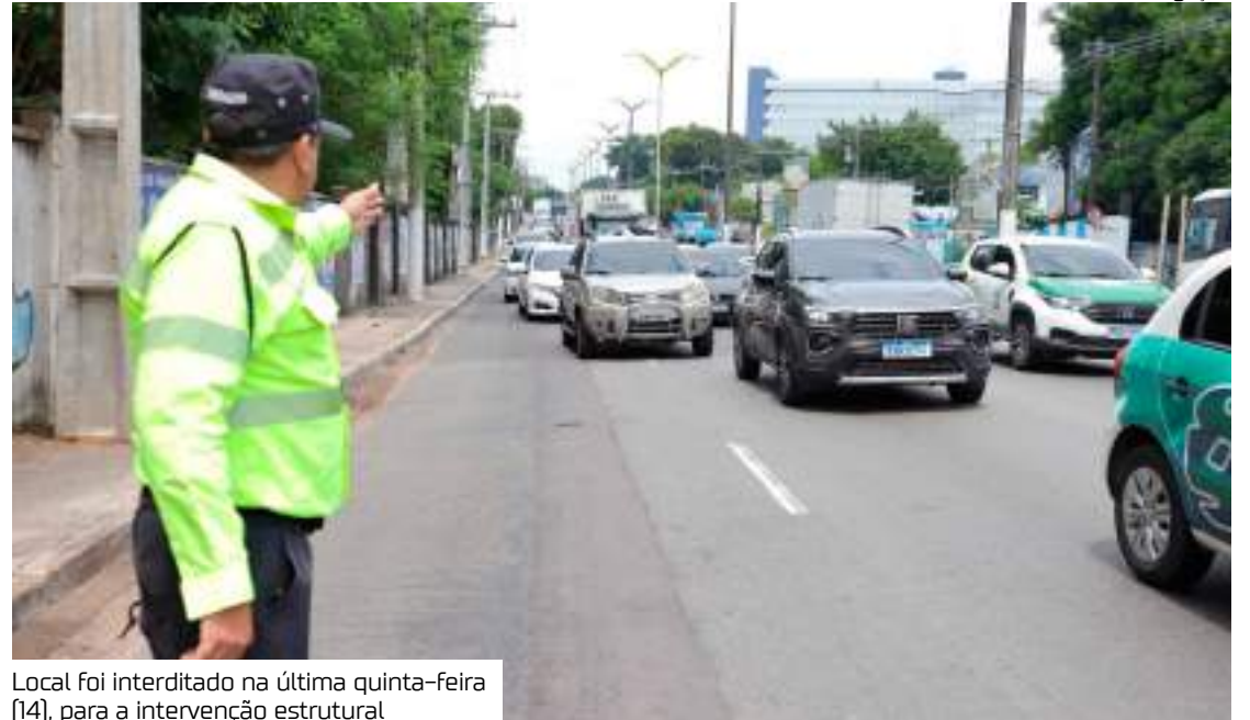
Local foi interditado na última quinta-feira (14), para a intervenção estrutural

última quinta-feira (14), para a intervenção estrutural, após o afundamento lateral da via apontar problemas na antiga rede de drenagem, cujos tubos eram de ferro e estavam comprometidos pela ação do tempo.