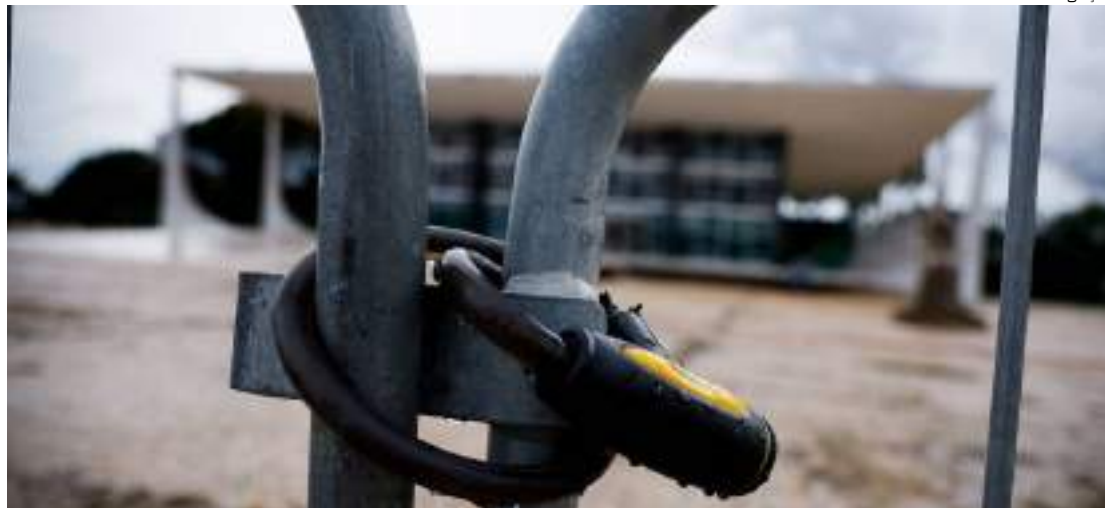
Vestígios do 8 de Janeiro um ano depois dos atos golpistas