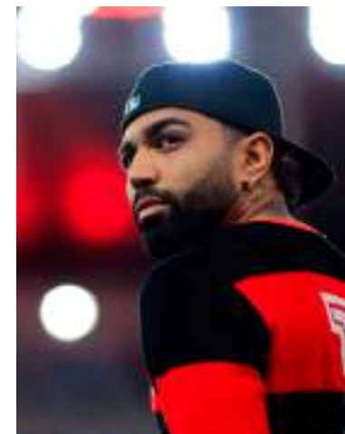
Camisa 99 deve voltar contra o Fortaleza

Momento depois, já fora da Arena MRV, o camisa 99 convidou os colegas de time para uma festa do título na sua casa. Tal comemoração aconteceria ao mesmo tempo que a organizada pelo Flamengo. O jogador não foi à festa oficial do clube, e os companheiros não compareceram na que ele deu.