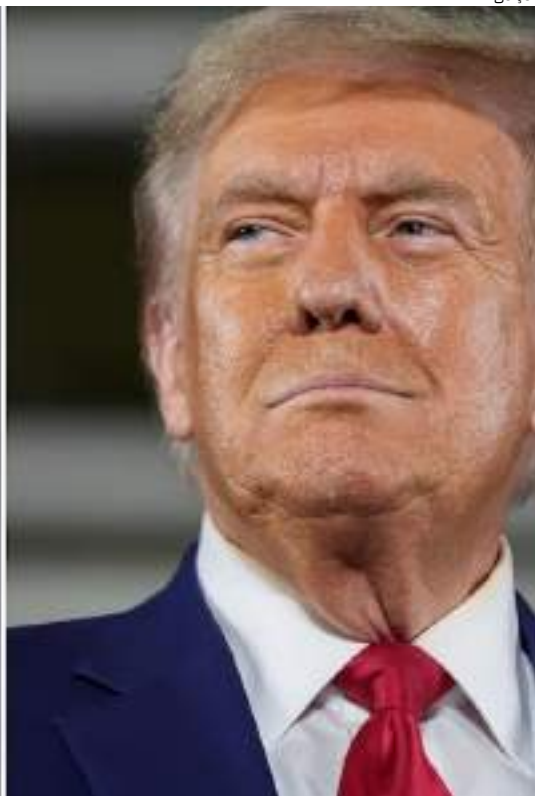
Kamala Harris, vice-presidente democrata, e Donald Trump, ex-presidente republicano

a votação antecipada, como o voto por correio, já está em andamento. O cenário entre Harris e Trump é de indefinição, sobretudo pelo empate técnico nas sondagens realizadas em sete Estados-chave para a vitória no colégio eleitoral.