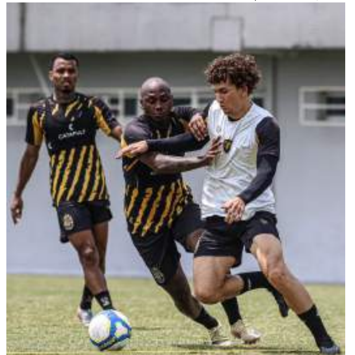
Time amazonense está a 12 do G4 e nove pontos acima do Z4

O adversário da partida de logo mais está na oitava colocação, sete pontos abaixo do G4. Portanto, o Coelho precisa vencer para continuar com alguma chance de acesso à elite do futebol brasileiro. Embalado pela vitória sobre o Sport-PE, dentro de casa, na última rodada, o técnico Lisca vai repetir a escalação.