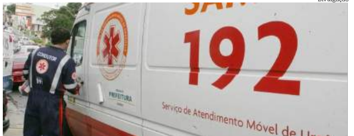
Samu ainda foi acionado para atender a ocorrência, mas a vítima não resistiu

O corpo da criança foi encaminhado ao necrotério do SPA da Galileia e, posteriormente, levado para a unidade do Instituto Médico Legal (IML).