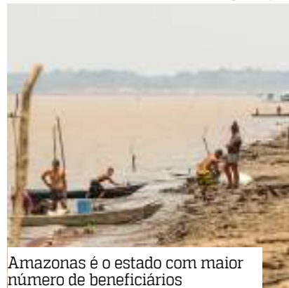
Amazonas é o estado com maior número de beneficiários

O governo federal pagou, nesta segunda-feira (4), o Auxílio Extraordinário para aproximadamente 148 mil pescadores e pescadoras da Região Norte afetados pela seca histórica deste ano. O benefício, no valor de R$ 2.824, será depositado na Caixa Econômica Federal para atender famílias que tiveram suas atividades grave-