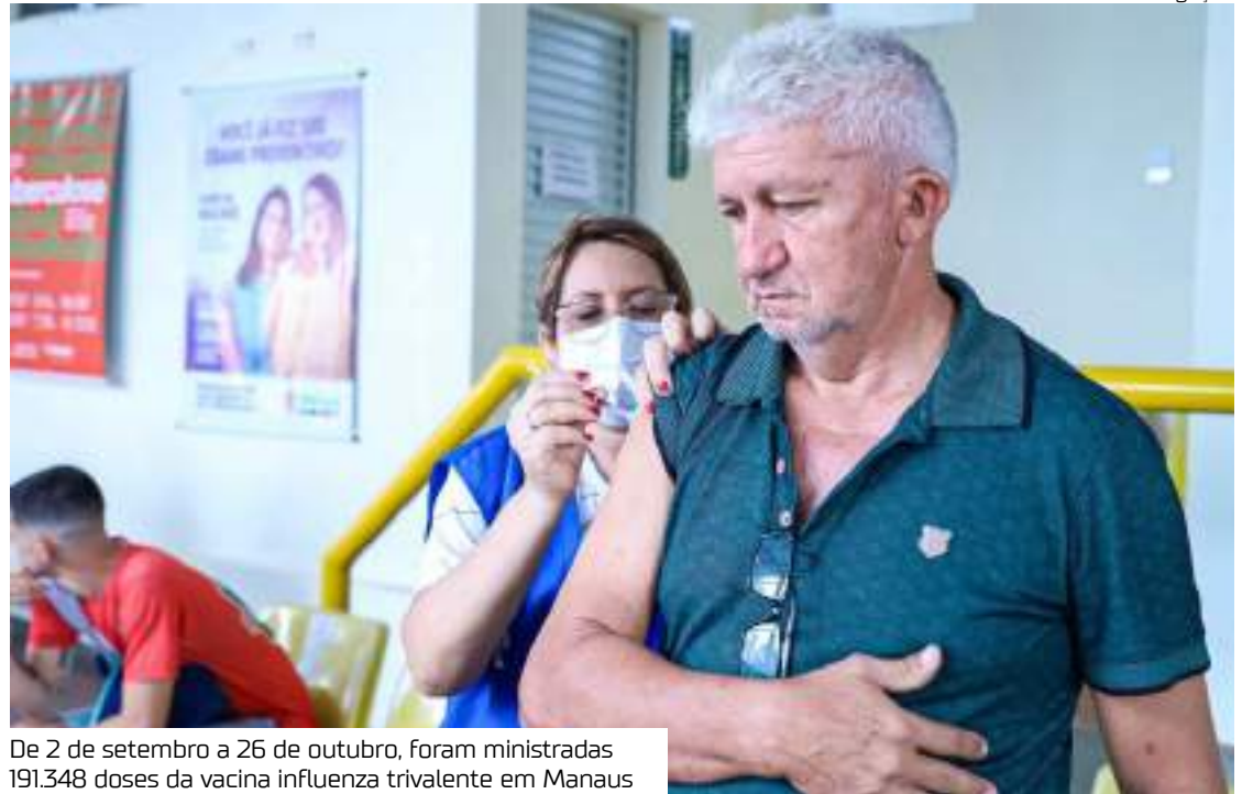
De 2 de setembro a 26 de outubro, foram ministradas 191.348 doses da vacina influenza trivalente em Manaus

Shádia reforça que, além de crianças, idosos, gestantes, puérperas e indígenas, a vacina continua disponível também para pessoas com deficiência permanente; população em situação de rua; forças de segurança e salvamento; integrantes das Forças Armadas; professores do ensino básico ao superior; trabalhadores da saúde; trabalhadores do transporte coletivo; trabalhadores portuários; caminhoneiros; funcionários do sistema penitenciário; adolescentes de até 18 anos em cumprimento