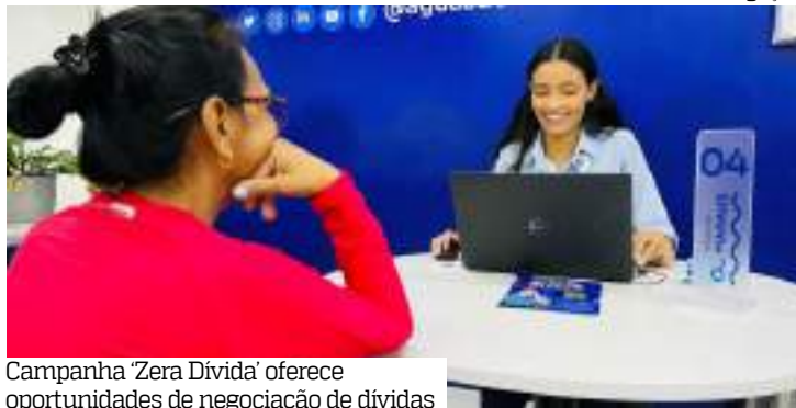
Campanha “Zera Dívida” oferece oportunidades de negociação de dívidas

ocorrem na loja principal da concessionária, situada na Rua Leonardo Malcher, no Centro de Manaus. Os serviços também estarão disponíveis nos guichês situados nos PACs da cidade (Alvorada, Compensa, Sumaúma,