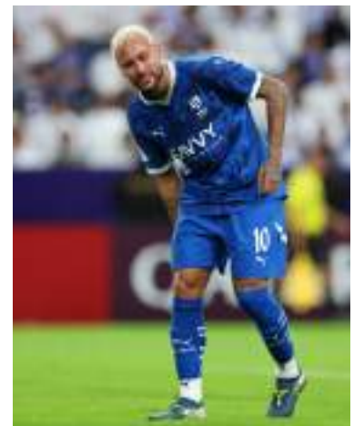
Jogador voltou a sentir incômodo físico

Na sexta-feira (1º), o técnico Dorival Júnior convocou a Seleção Brasileira para dois jogos das Eliminatórias sem Neymar. O craque vai voltar a vestir a Amarelinha apenas no próximo ano.