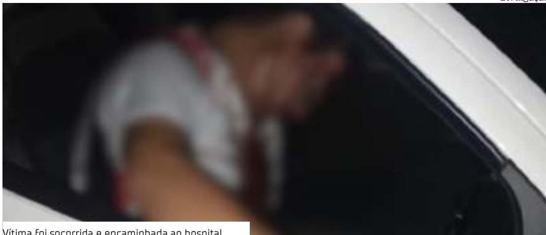
Vítima foi socorrida e encaminhada ao hospital