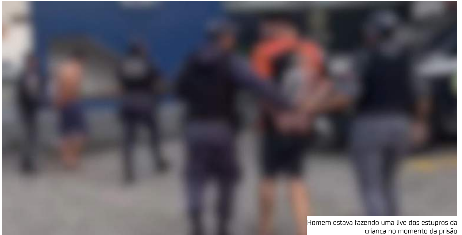
Homem estava fazendo uma live dos estupros da criança no momento da prisão

“A suspeita é que os dois que eles sejam carimbadores, porque isso é emergiu dos autos acerca deles serem positivos e intencionalmente transmitir o vírus HIV. A ela foi encaminhada ao protocolo de vítima sexual na Moura Tapajós e certamente passará