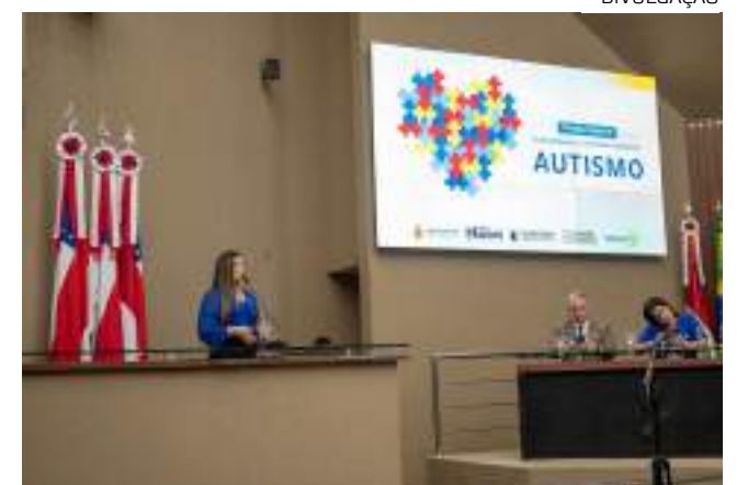
Deputada visa disseminar direitos das pessoas com TEA