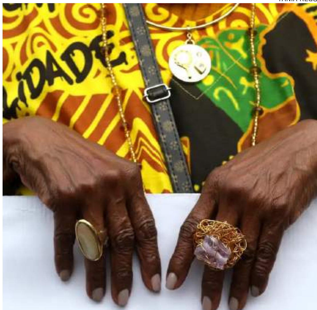
Negros, que totalizam pretos e pardos, representam 55,5% da população brasileira

A Lei nº 14.532, sancionada pelo presidente Luiz Inácio Lula da Silva em janeiro de 2023, aumenta a pena para a injúria relacionada a raça, cor, etnia ou procedência nacional. Com a norma, quem proferir ofensas que desrespeitem alguém, seu decoro, sua honra, seus bens ou sua vida poderá ser punido com reclusão de 2 a 5 anos. A