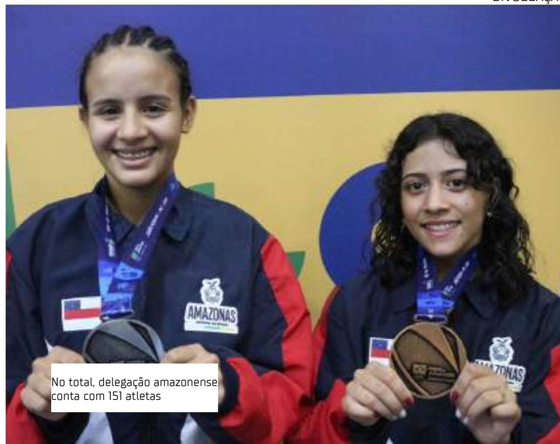
No total, delegação amazonense conta com 151 atletas

"No primeiro campeonato de wrestling que participei, mudei de ideia. Hoje, é minha exclusividade. Fui medalha de prata em dois mundiais escolares, ganhei medalhas também nos Jogos Escolares Brasileiros, em campeonatos brasileiros de wrestling,