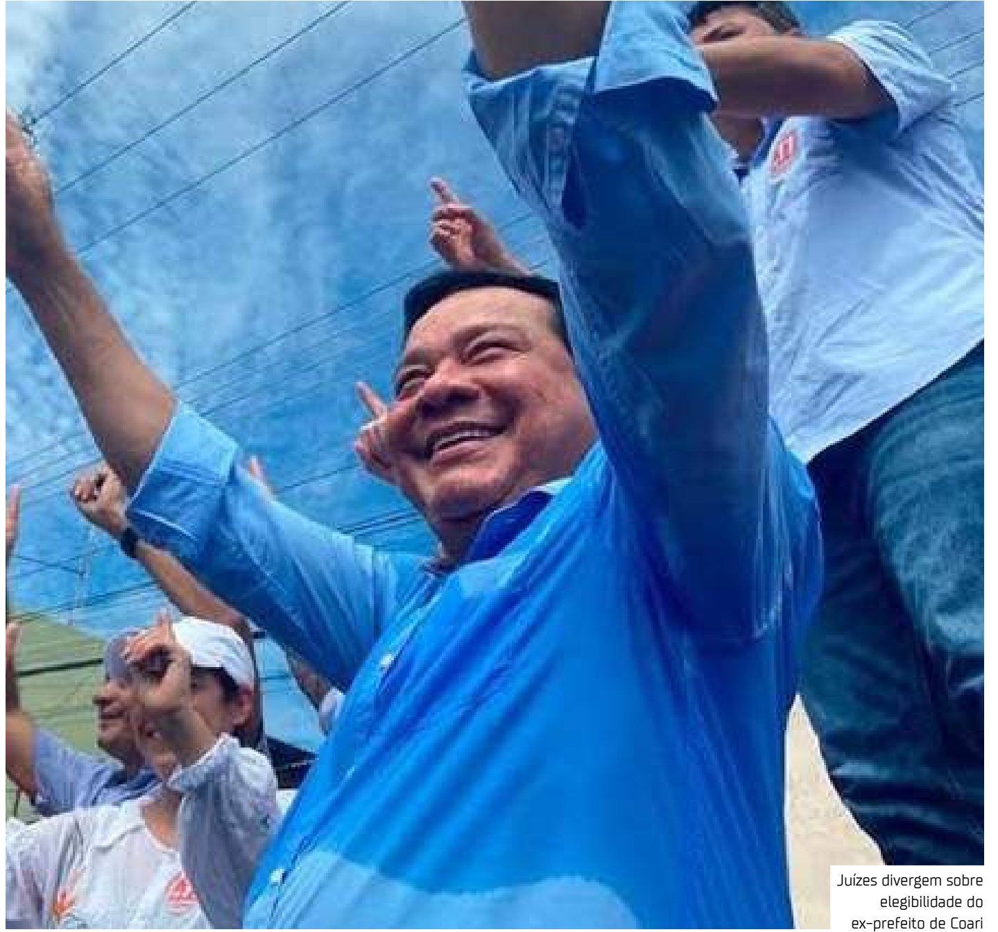
Juízes divergem sobre elegibilidade do ex-prefeito de Coari