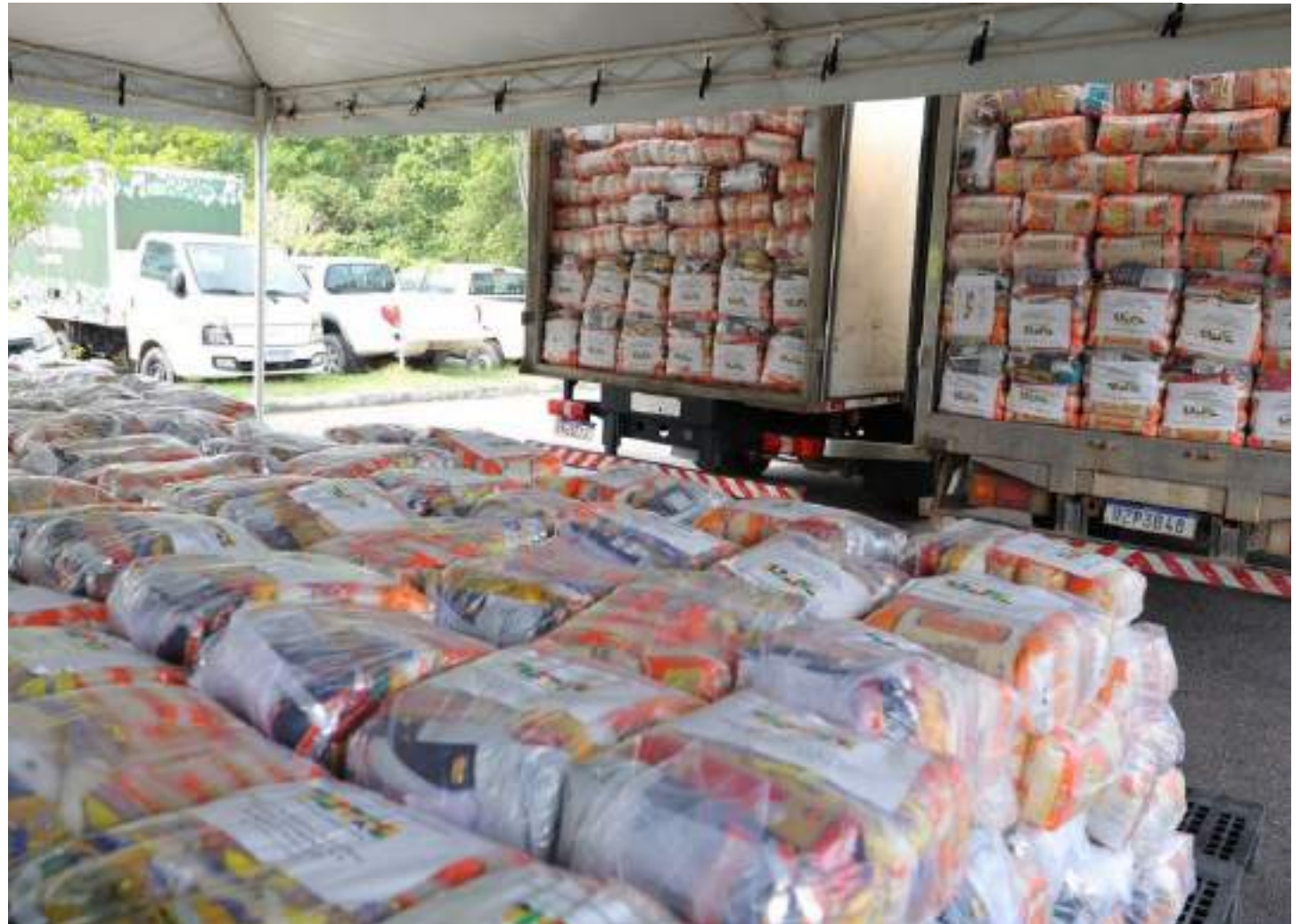
Desde o início da Operação Estiagem 2024, o Amazonas destinou mais de 3 mil toneladas de alimentos para todo o estado

As ações incluem, ainda, o programa Merenda em