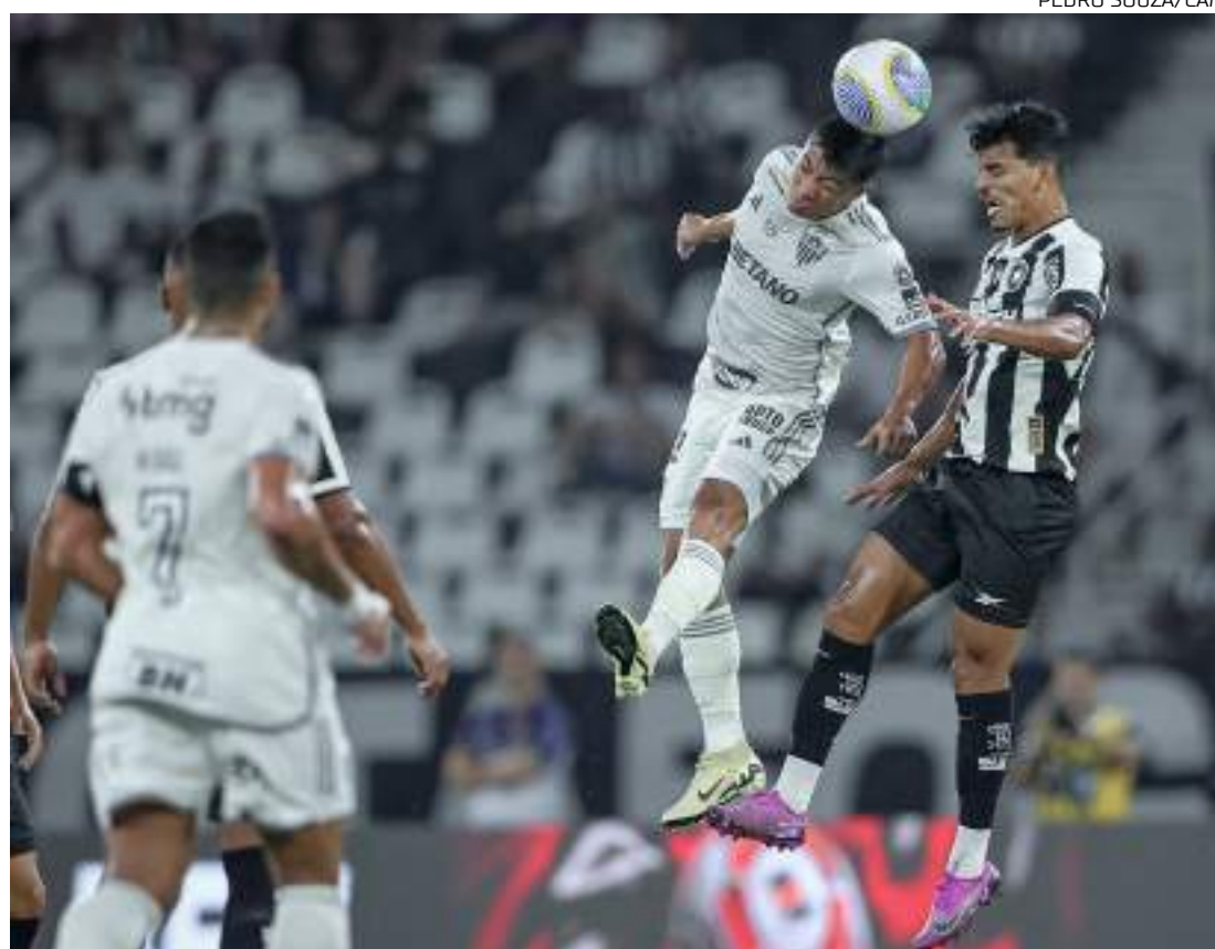
No primeiro turno do Brasileirão, o Botafogo venceu o Atlético-MG por 3 a 0 no Estádio Nilton Santos

deste meio de semana como uma verdadeira decisão, segundo o próprio técnico Gabriel Milito e, por isso, não deve poupar peças. O treinador vai com o que tem de melhor à disposição para o confronto. Porém, Junior Alonso, Alan Franco e Eduardo Vargas estão fora em razão de terem defendido suas respectivas seleções na Data Fifa. Guilherme Arana e Cadu, lesionados, também desfalcam o time. Zaracho é dúvida.