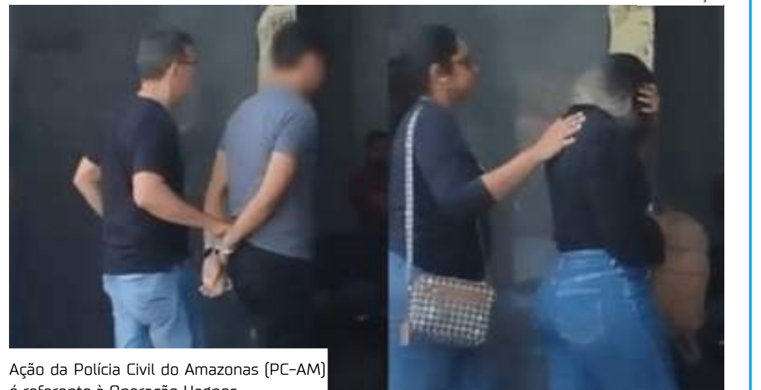
Ação da Polícia Civil do Amazonas (PC-AM) é referente à Operação Hagnos

"Já peticionamos junto à Justiça Estadual quanto à quebra de sigilo dos eletrônicos, para que possamos encaminhá-los para a perícia e extrair os dados que estão possivelmente armazenados. Todavia, já temos materialidade em relação a produção de material pornográfico dos suspeitos, trazidos pelos aparelhos das vítimas, onde constam as ameaças de divulgação das imagens, por meio de mensagens enviadas pelos