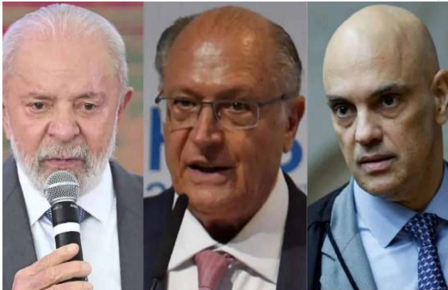
Cinco pessoas foram presas pela Polícia Federal em operação sobre plano para matar Lula, Alckmin e Moraes

Já em um HD externo vinculado a Mário Fernandes, general que atuou no gabinete do deputado federal Eduardo Pazuello (PL), foi encontrado um documento de word que,