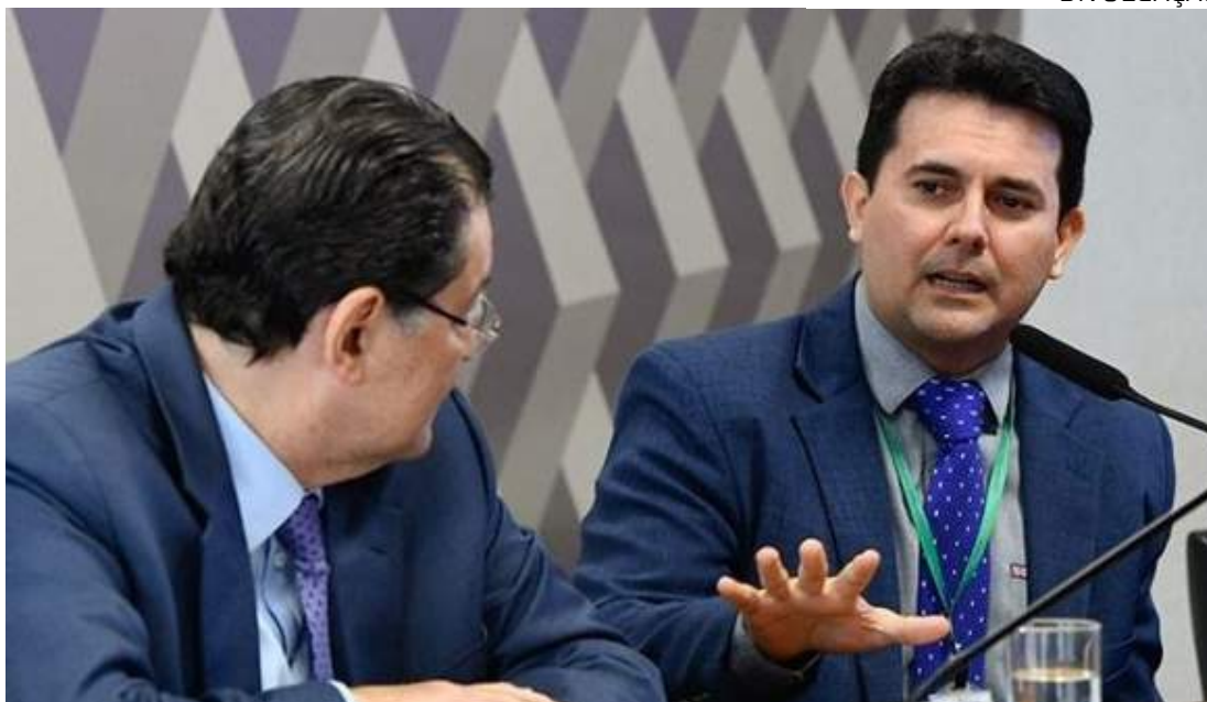
Regras favoráveis às ALCs valerão até o final de 2050

Pereira afirmou que o problema ocorre desde que o IPI (Imposto sobre Produtos Industrializados), que não é cobrado nas ALCs para tornar a região mais atraente, teve cada vez menos participação na arrecadação federal no Brasil como um todo. O IPI será um dos impostos substituídos na reforma tributária.