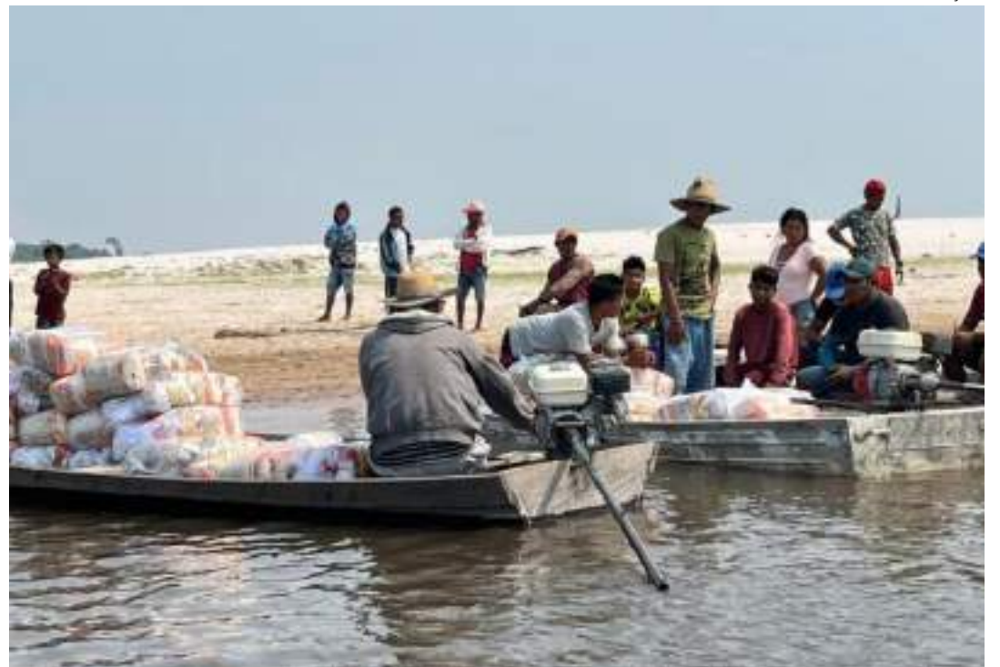
De acordo com a Defesa Civil, mais de 212 mil famílias já foram afetadas pela seca em todo o AM

De acordo com a Defesa Civil, mais de 212 mil famílias já foram afetadas pela seca em todo o Amazonas. O número equivale a mais de 850 mil pessoas impactadas pela descida dos rios, seja pelo isolamento de comunidades ou pela dificuldade de acesso à água, alimentos e serviços básicos.