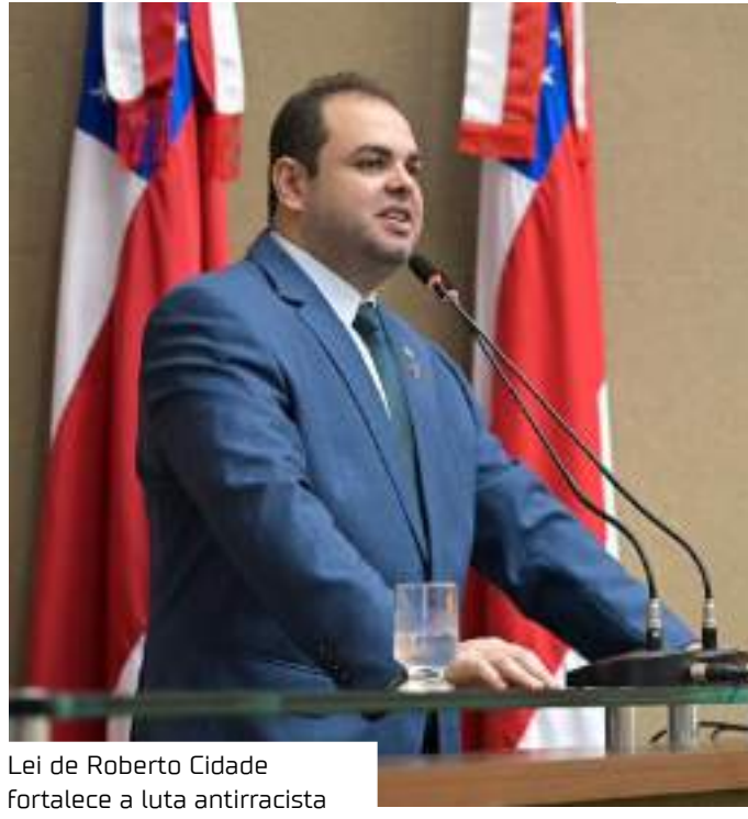
Lei de Roberto Cidade fortalece a luta antirracista

"A legislação proposta reconhece a importância das parcerias com a sociedade civil, instituições de pesquisa e demais organismos sociais para fortalecer a implementação do Protocolo Antirracista. Em síntese, nossa Lei visa garantir um ambiente educacional que promova valores de respeito, igualdade e valorização da diversidade étnico-racial. O Amazonas tem uma rica história cultural, enraizada nas contribuições das populações negras e indígenas, e este protocolo vem ao encontro desse contexto, buscando construir um futuro mais inclusivo e justo para as gerações presentes e futuras", finalizou.