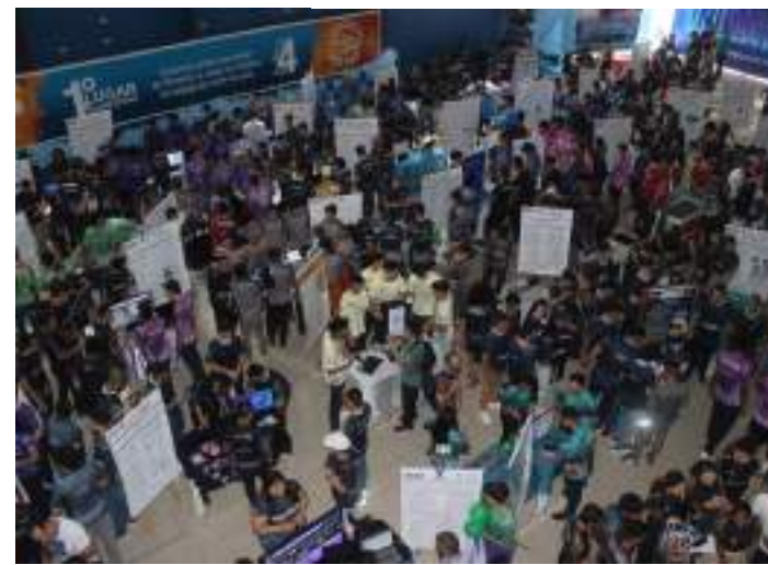
Evento será realizado no Manaus Plaza Shopping em dois turnos

O evento é também uma excelente oportunidade de networking e visibilidade, conectando profissionais, acadêmicos e especialistas para fortalecer o diálogo entre o presente e o futuro das cidades inteligentes.