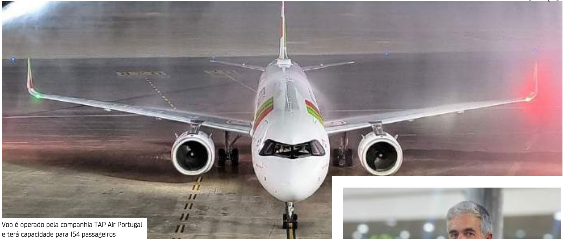
Voo é operado pela companhia TAP Air Portugal e terá capacidade para 154 passageiros

de Genebra, na Suíça, para visitar Manaus, com a esposa e a filha, destacou a logística do voo internacional. "Foi uma experiência muito boa em relação ao tempo, porque antes, nós tínhamos que ir até Guarulhos ou Rio de Janeiro, então, otimizou os horários e melhorou. Para mim também foi um voo muito bom, tranquilo e inclusive, quero agradecer os comissários que ofereceram um serviço de excelência", relatou o manauara que foi recepcionado pela família no saguão do aeroporto.