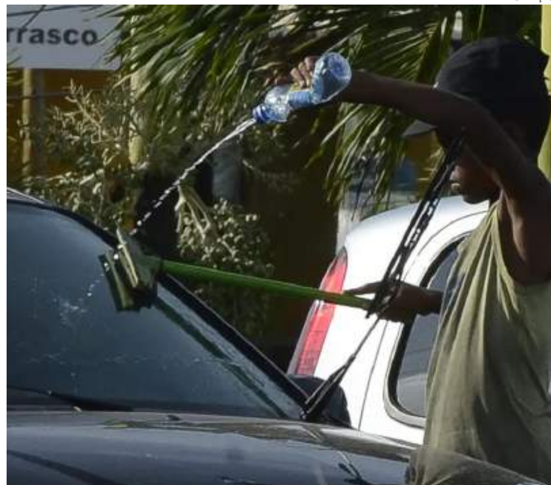
Em 2023, o contingente em situação de trabalho infantil baixou para 1,607 milhão

No Brasil, em 2022, havia 1,88 milhão de crianças e adolescentes de 5 a 17 anos de idade que trabalhavam em atividades econômicas