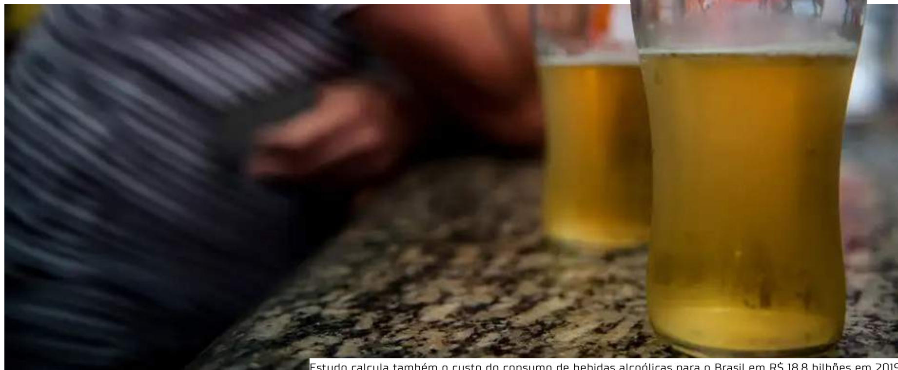
Estudo calcula também o custo do consumo de bebidas alcoólicas para o Brasil em R$ 18,8 bilhões em 2019

custo do consumo de bebidas alcoólicas para o Brasil em R$ 18,8 bilhões em 2019: 78% (R$ 37 bilhões) foram gastos com os homens, 22% com as mulheres (R$ 10,2 bilhões). Do total, R$ 1,1 bilhão são atribuídos a custos federais diretos com hospitalizações e procedimentos ambulatoriais no Sistema Único de Saúde (SUS). Os demais R$ 17,7 bilhões são referentes aos custos indiretos como perda de produtividade pela mortalidade prematura, licenças e aposentadorias precoces decorrentes de doenças asso-