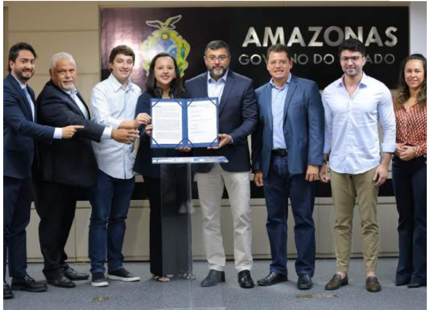
Desde agosto deste ano, o governador Wilson Lima já assinou contratos para construção de outros três conjuntos habitacionais

Os empreendimentos seguem o padrão determinado pelos programas habitacionais, sendo apartamentos com dois quartos, sala de estar e jantar, cozinha com