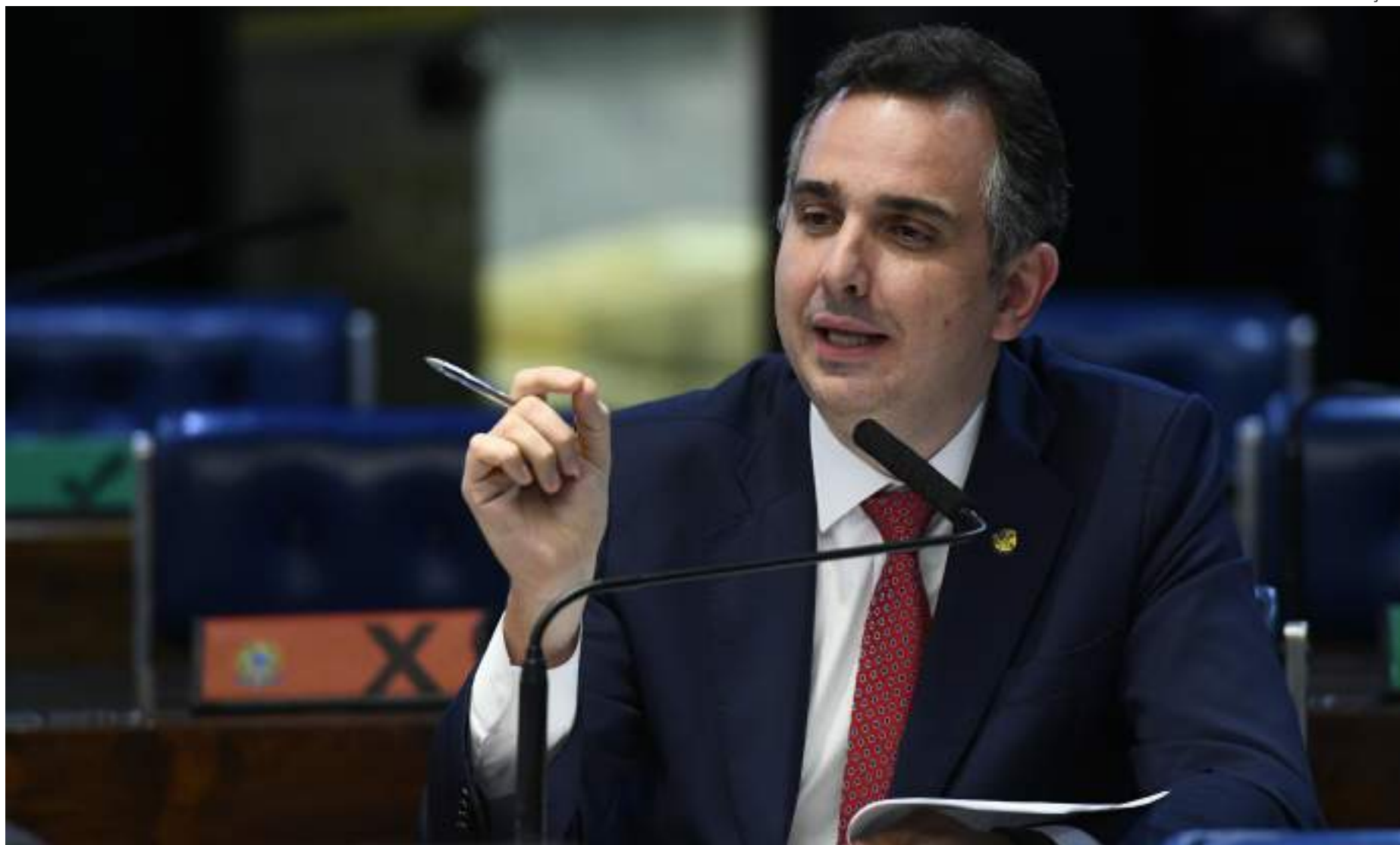
Pacheco pediu que parlamentares e o setor produtivo tenham "compromisso" para a finalização da regulamentação da reforma tributária

"Há a previsão de leitura do parecer no final de novembro, com pedido de vista