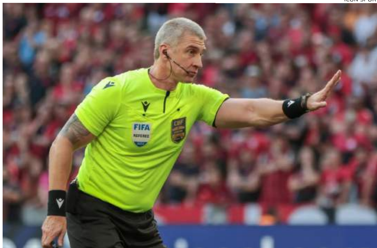
Em sua segunda edição, a Copa da Floresta terá o segundo árbitro do quadro da FIFA em sua final

"É uma honra para o futebol amazonense, para o futebol não profissional do interior e uma honra para meus presidentes de liga do interior termos em solo amazonense, atuando em uma final tão importante para o nosso futebol um ár-