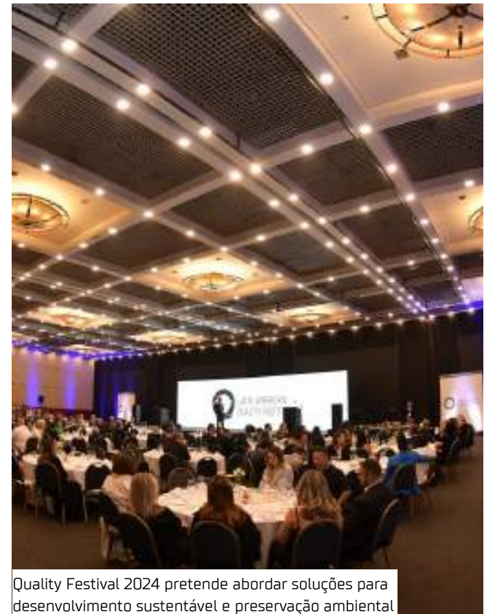
Quality Festival 2024 pretende abordar soluções para desenvolvimento sustentável e preservação ambiental

"Ao debater qualidade e sustentabilidade no coração da Amazônia, reafirmamos a importância de alinhar desenvolvimento econômico e preservação ambiental. Esse evento é mais que um encontro de negócios, é um compromisso com um futuro sustentável e uma oportunidade para que a América Latina lidere a inovação empresarial com baixo impacto ambiental", salienta.