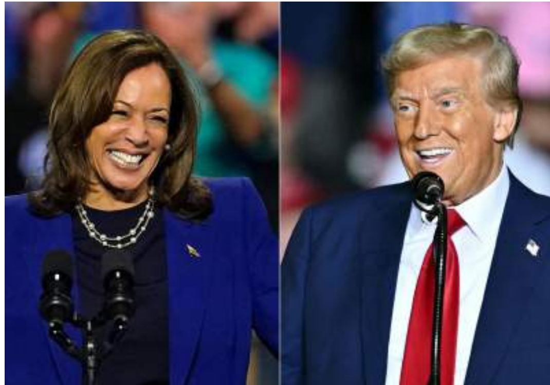
Kamala Harris, vice-presidente democrata, e Donald Trump, ex-presidente republicano