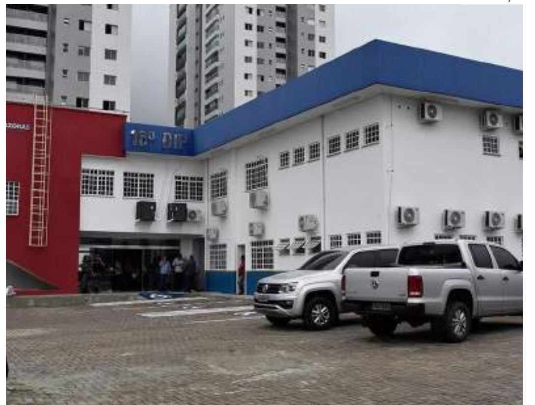
Homem foi autuado por estupro de vulnerável e permanece à disposição da Justiça