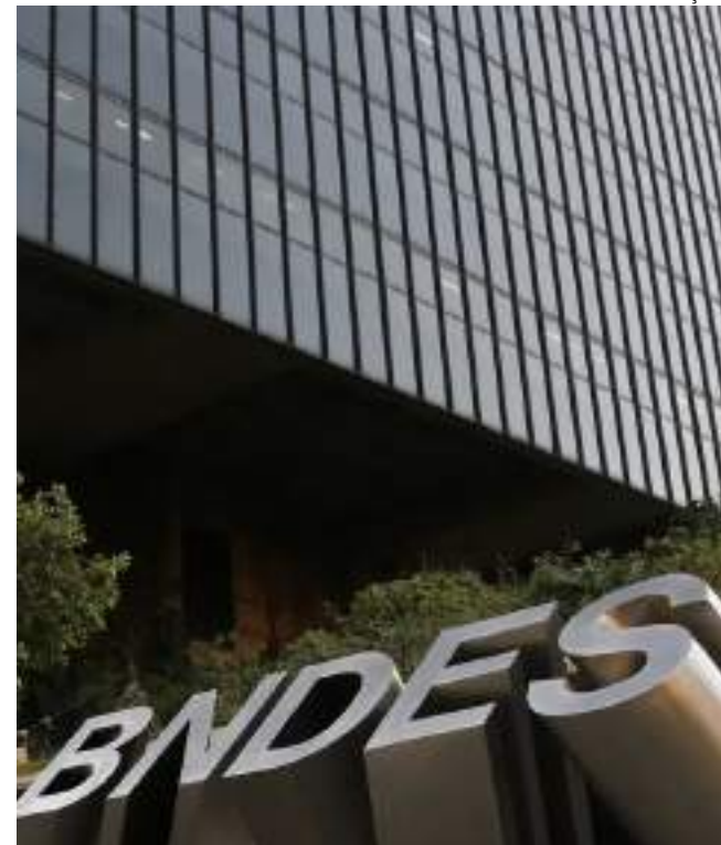
Financiamento poderá ter taxa fixa a partir de 1,49% ao mês