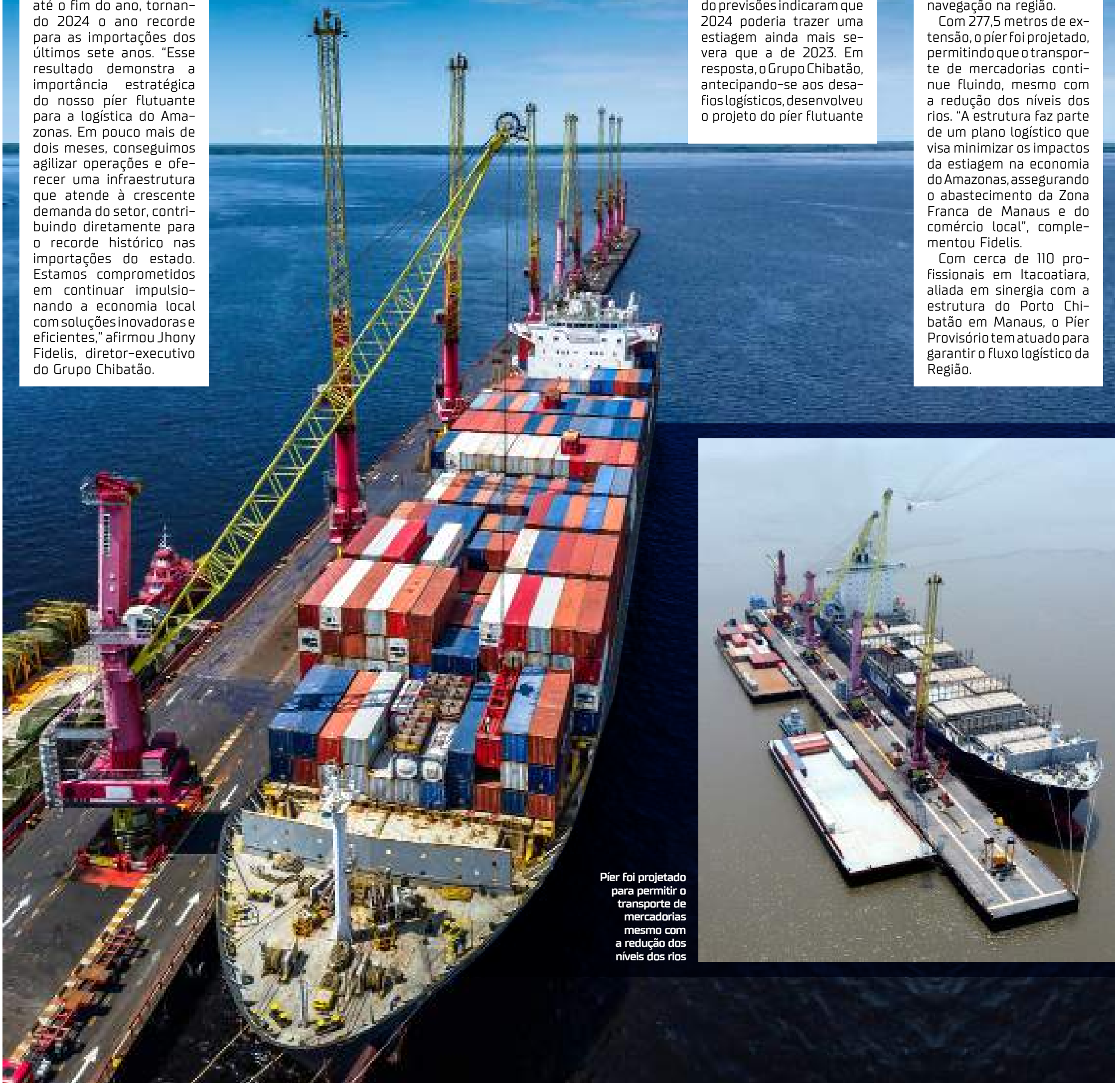
Pier foi projetado para permitir o transporte de mercadorias mesmo com a redução dos níveis dos rios

Com cerca de 110 profissionais em Itacoatiara, aliada em sinergia com a estrutura do Porto Chibatão em Manaus, o Pier Provisório tem atuado para garantir o fluxo logístico da Região.