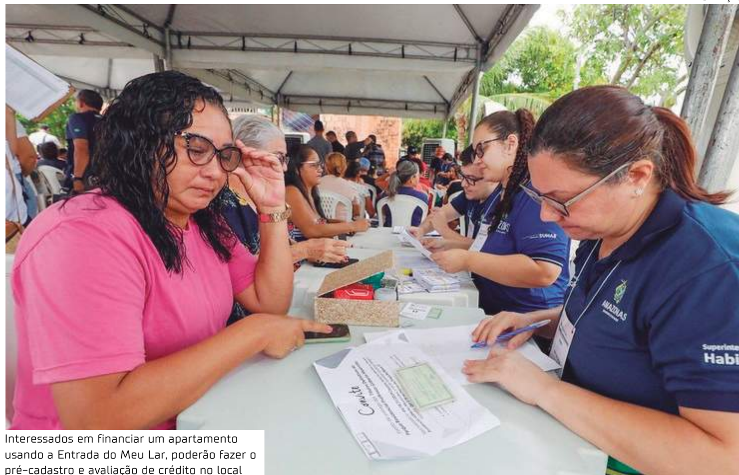
Interessados em financiar um apartamento usando a Entrada do Meu Lar, poderão fazer o pré-cadastro e avaliação de crédito no local