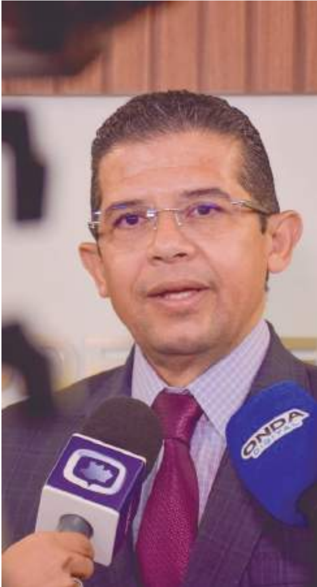
Deputado propõe atualização de legislação sobre uso de celulares