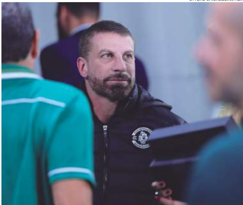
Mandatário afirma que protegerá o clube através de cláusulas contratuais

"Enquanto eu for presidente do Club de Regatas Vasco da Gama, a minha intenção vai ser vender a Vasco SAF. A minha intenção vai ser vender. Vender é um outro processo. Paralelo a isso, eu não posso ficar sentado no sofá de casa esperando um investidor, pois tenho contas a pagar. Preciso fazer com que o clube ande. Tem alguns critérios que são óbvios para que, de forma contratual, alinhe com o possível investidor: credibilidade reconhecida, saúde financeira, um planejamento esportivo com prazos para cumprimentos, estrutura de CT com prazos para cumprimentos. A gente precisa ter algumas garantias para proteger a instituição e não cometer erros, como os que foram cometidos com a 777. Eu quero vender a Vasco SAF. Quando isso