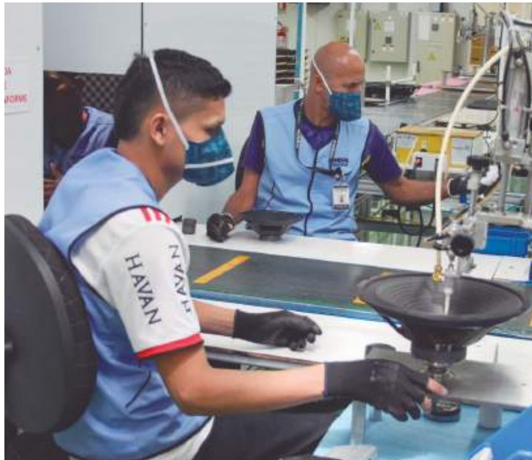
Amazonas mostrou força econômica com o setor de serviços e a indústria

Alguns estados, como Pará (-0,69%) e Espírito Santo (-1,7%), apresentaram retração econômica, o que ressalta a importância de políticas regionais adaptadas às realidades locais.