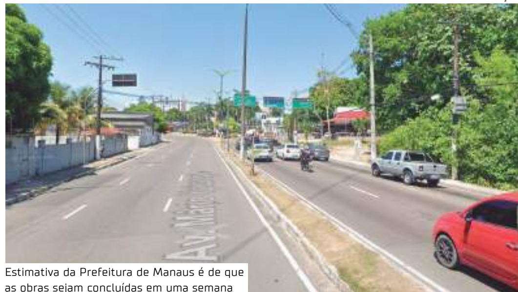
Estimativa da Prefeitura de Manaus é de que as obras sejam concluídas em uma semana