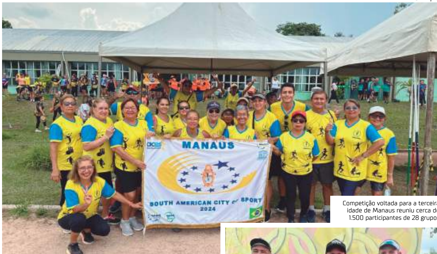
Competição voltada para a terceira idade de Manaus reuniu cerca de 1.500 participantes de 28 grupos

O evento incentivou os idosos a participarem do ambiente esportivo, oferecendo a