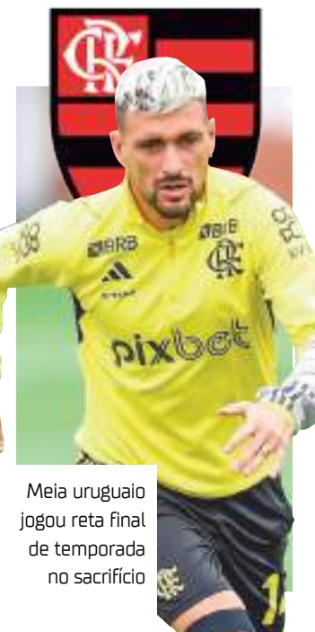
Meia uruguaio jogou reta final de temporada no sacrifício

Sem o meio-campista, o Flamengo volta a campo diante do Cuiabá na quinta-feira (20), às 18h (de Manaus), na Arena Pantanal, pela 34ª rodada do Brasileirão.