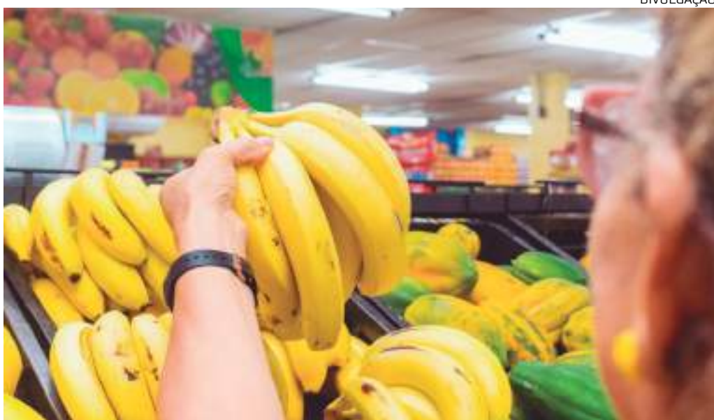
Vagas são para nova unidade da rede de supermercados Super Nova, em Manaus

A rede amazonense de supermercados Super Nova está com vagas disponíveis para início imediato em sua sexta unidade, localizada no Parque Residencial Mosaico, bairro Planalto, Zona Centro-Oeste de Manaus. A data de inauguração será divulgada nas redes sociais.