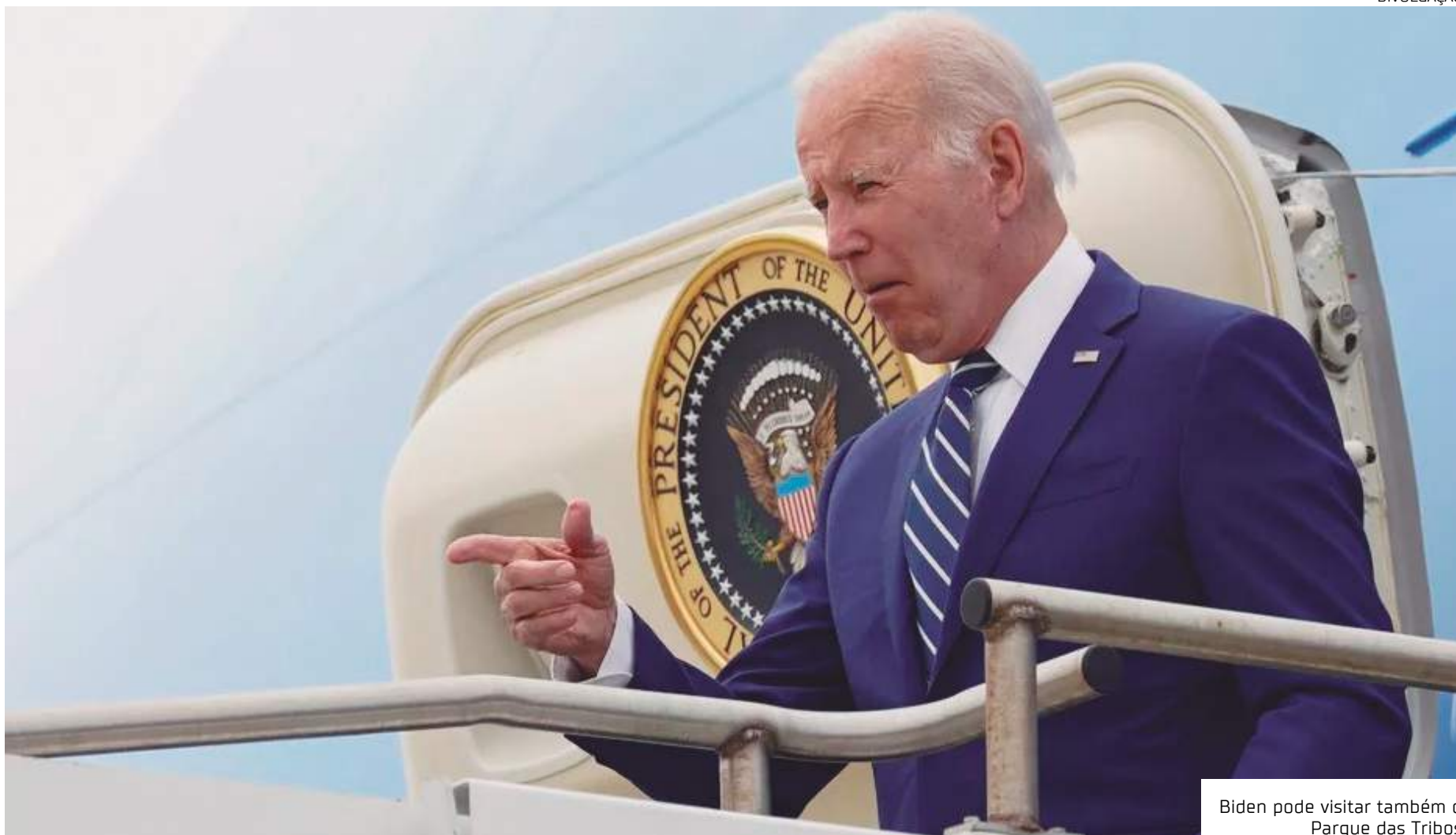
Biden pode visitar também o Parque das Tribos

O museu ocupa 100 hectares da reserva florestal Adolpho Ducke, do Instituto Nacional de Pesquisas da Amazônia (Inpa). É um dos poucos lugares em Manaus onde turistas podem ter contato com a floresta.