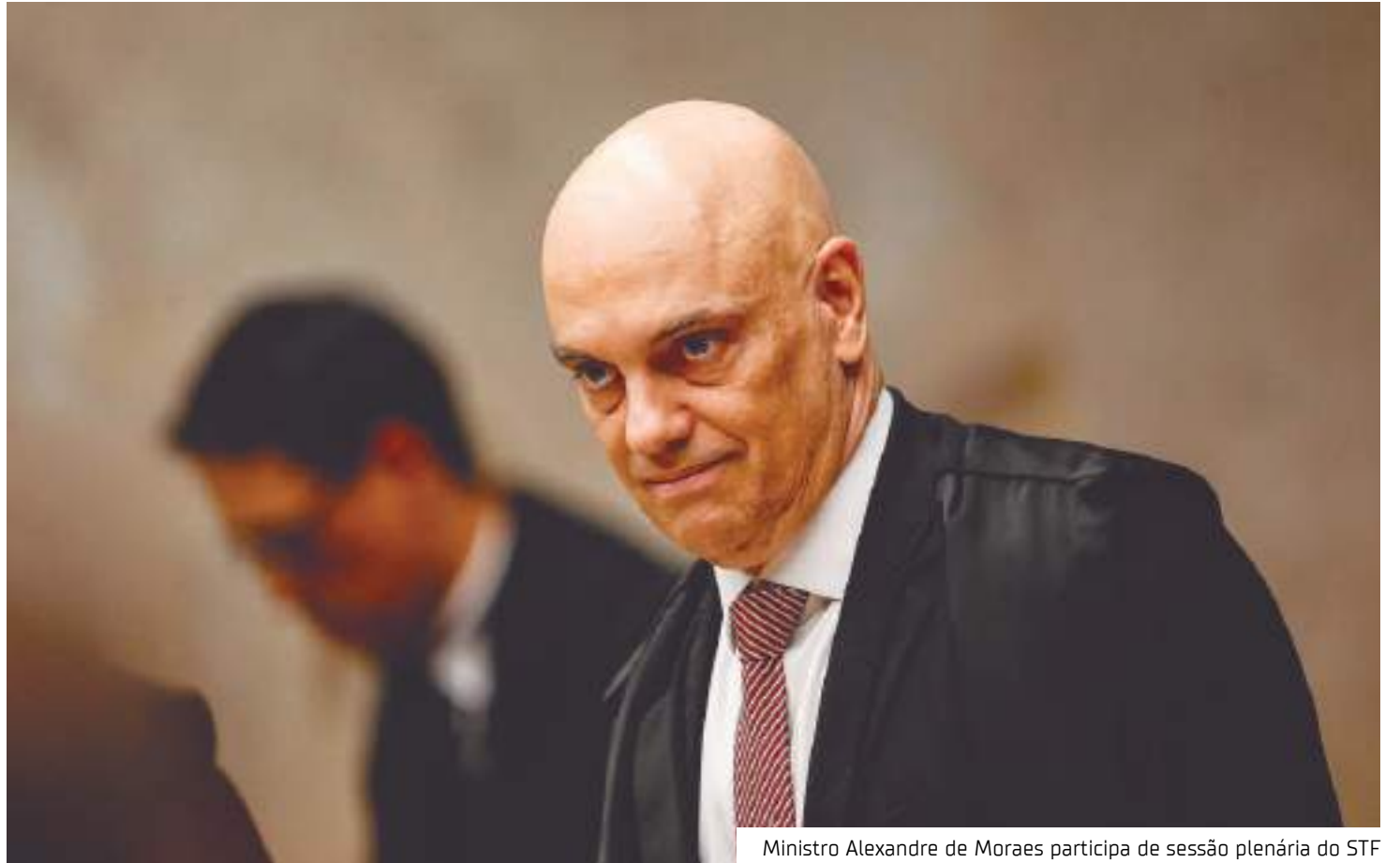
Ministro Alexandre de Moraes participa de sessão plenária do STF