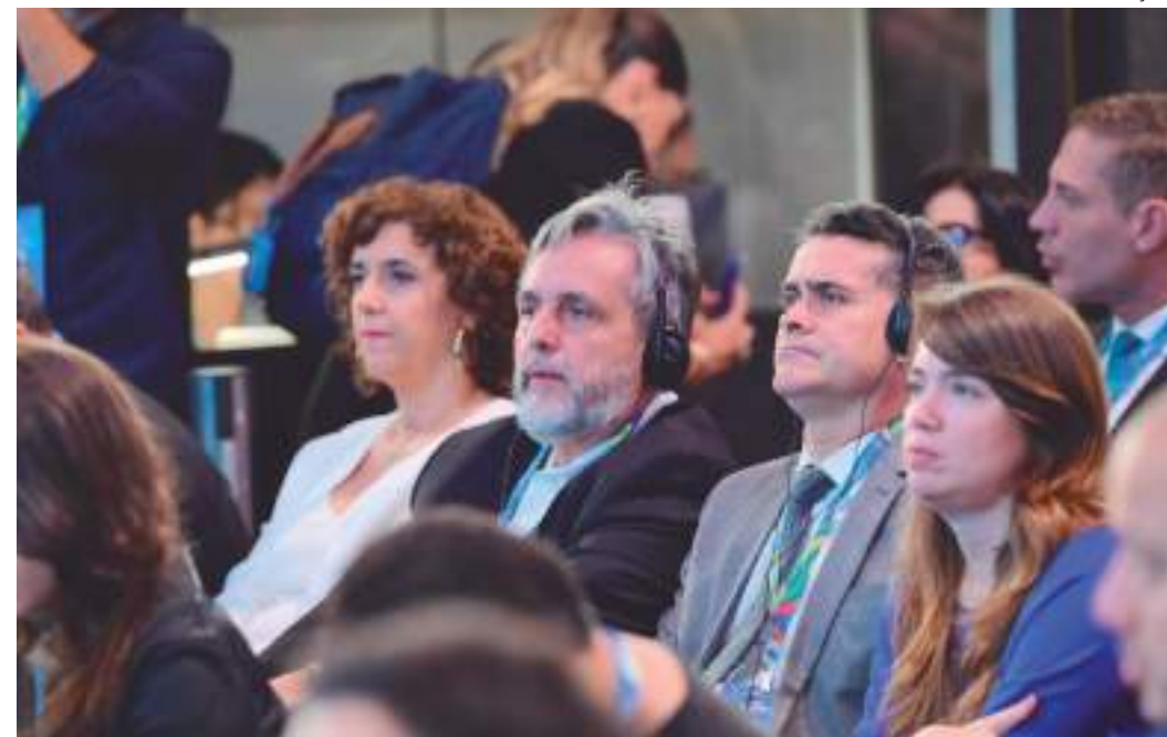
Prefeito de Manaus participa da abertura do Urban 20 e G20 Social, no Rio de Janeiro

A iniciativa U20 é permanentemente convocada pelo Grupo C40 de Grandes Cidades (C40 Cities, em inglês), rede global de prefeitos das principais cidades do mundo que estão unidos em ações para