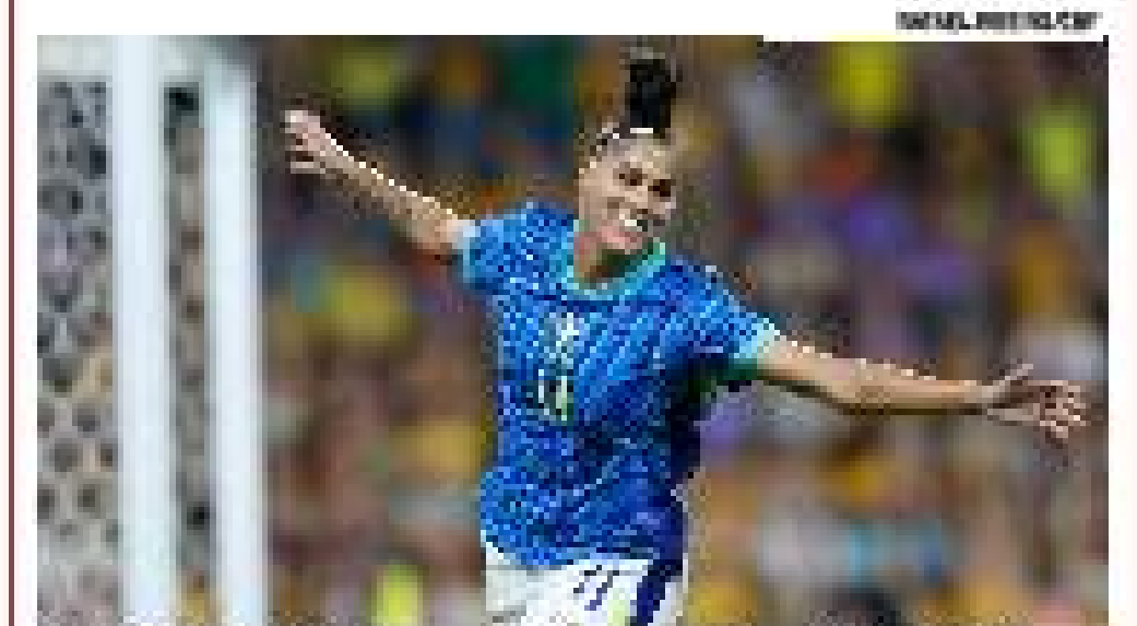
Christine Sinclair marcou o primeiro gol do Brasil na partida contra a Austrália

O jogo foi disputado no Estádio de Wembley, em Londres, Inglaterra. O Brasil venceu por 3 a 1, com gols de Fran Kirby (15), Christine Sinclair (55) e Fran Kirby (75).