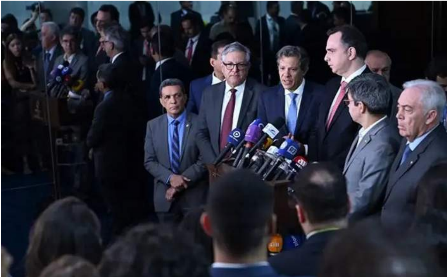
Ministro da Fazenda, Fernando Haddad, fala sobre o pacote fiscal no Senado, ao lado do presidente da Casa, Rodrigo Pacheco

grande desafio. São 24 dias de trabalho. Fiz um apelo aos líderes para termos um esforço concentrado e fazermos as entregas necessárias. Estimo que a Câmara dos Deputados possa fazer essa apreciação nas próximas duas semanas. E talvez se reserve a última semana útil antes do recesso para que o Senado possa apreciar”, afirmou.