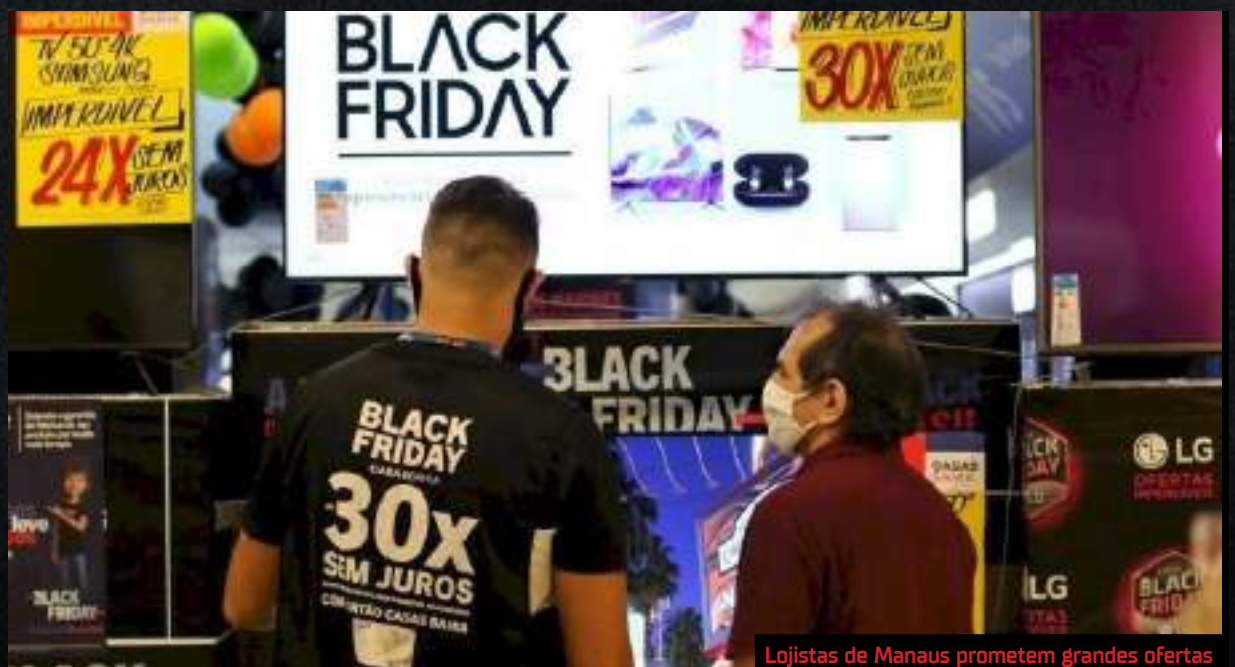
Lojistas de Manaus prometem grandes ofertas

é que, até 1º de dezembro, vários "caçadores de ofertas", que são influenciadores digitais, estarão pelo centro de compras em busca de condições exclusivas para os clientes, que serão divulgadas nas redes sociais do @manausplaza.