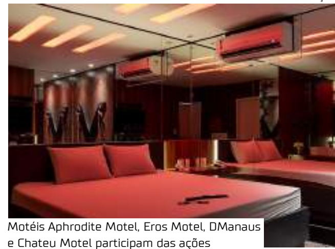
Motéis Aphrodite Motel, Eros Motel, DManaus e Chateu Motel participam das ações