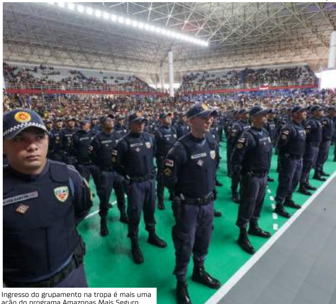
Ingresso do grupamento na tropa é mais uma ação do programa Amazonas Mais Seguro