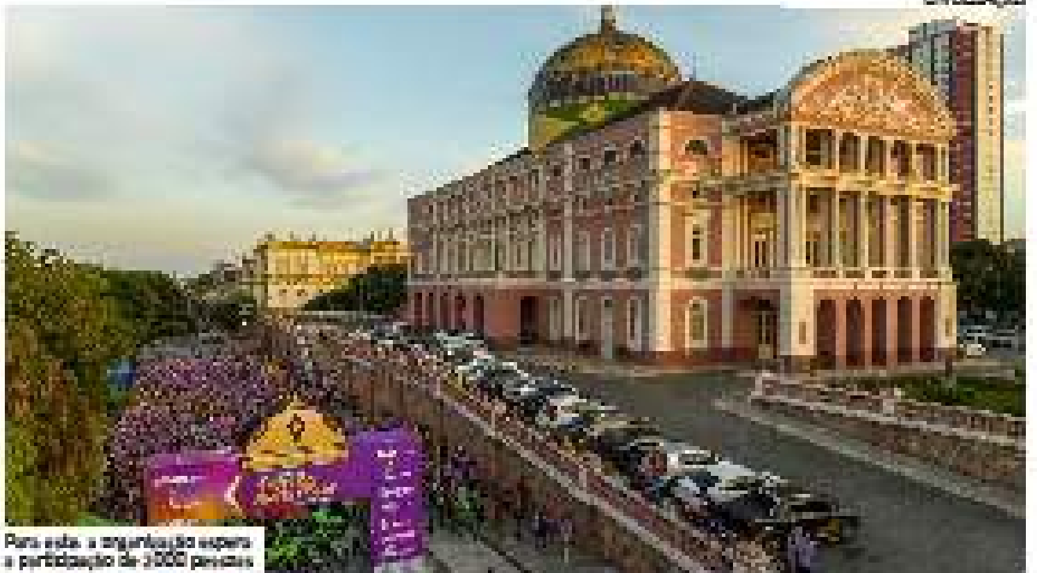
Para esta, a organização espera a participação de 3.000 pessoas

A inscrição é gratuita e pode ser feita no site www.teatroamazonas.com.br .