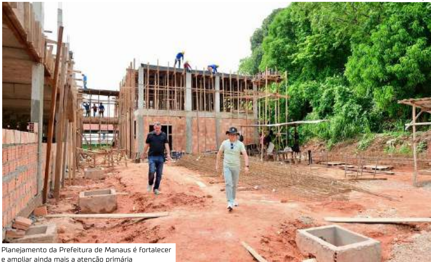
Planejamento da Prefeitura de Manaus é fortalecer e ampliar ainda mais a atenção primária