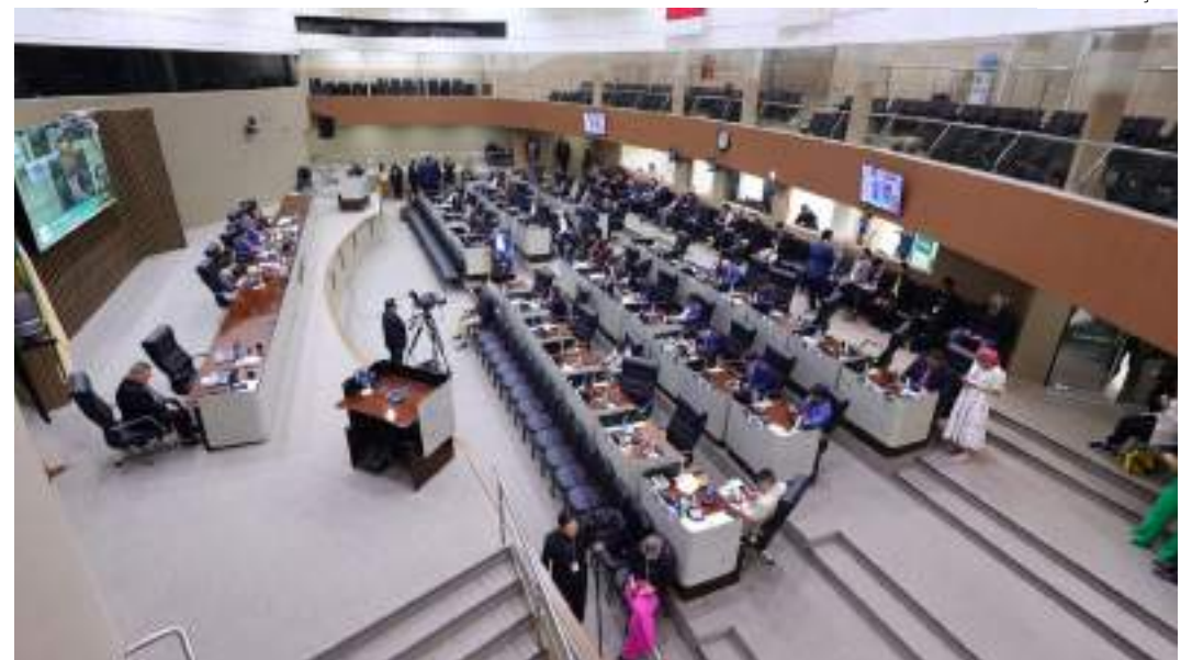
Salários dos vereadores da Câmara de Manaus poderão chegar a R$ 26 mil

Descontos por faltas: Caso os vereadores faltem a sessões deliberativas, o subsídio será reduzido proporcionalmente, exceto em situações de falta