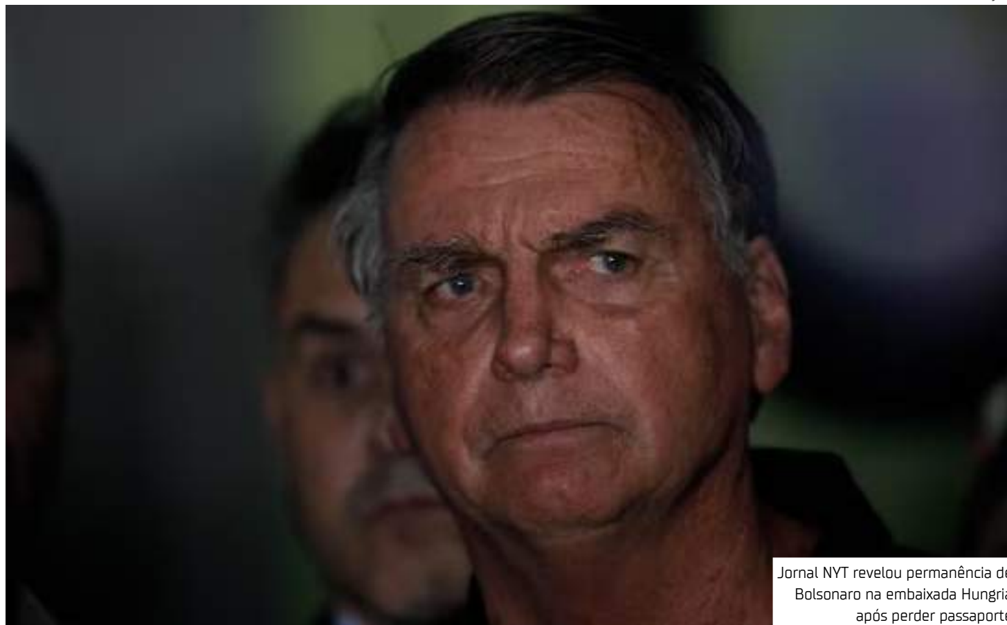
Jornal NYT revelou permanência de Bolsonaro na embaixada da Hungria após perder passaporte

Segundo o NYT, ele ficou no local durante os dois dias seguintes, acompanhado por dois seguranças e na companhia do embaixador húngaro e de membros da equipe diplomática. Bolsonaro não poderia ser preso em uma embaixada estrangeira, porque o local está