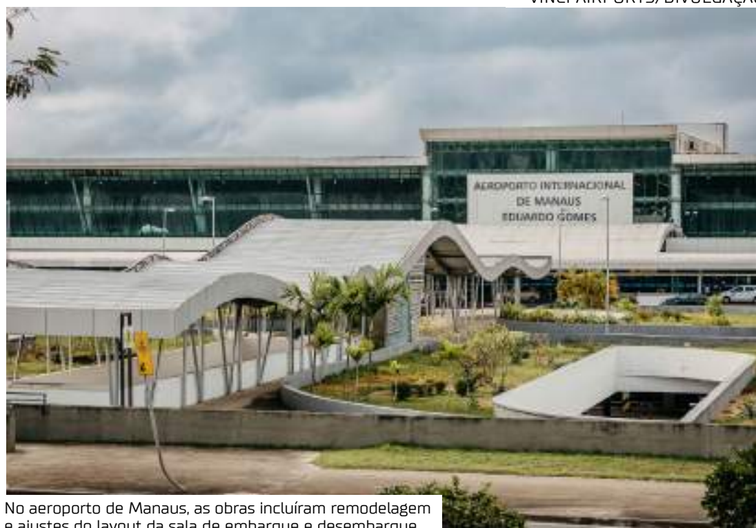
No aeroporto de Manaus, as obras incluíram remodelagem e ajustes do layout da sala de embarque e desembarque

As obras incluem também uma nova praça de alimentação; a construção de uma central de tratamento de resíduos; e a adequação das áreas de órgãos públicos. "As obras dobraram a área do terminal de passageiros, permitindo receber voos domésticos e internacionais simultaneamente", informou o ministério. A nova área tem