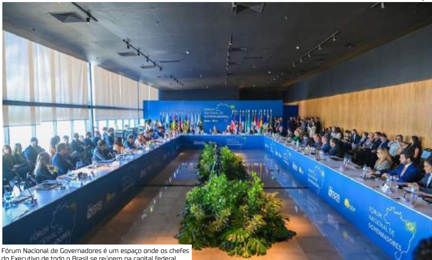
Fórum Nacional de Governadores é um espaço onde os chefes do Executivo de todo o Brasil se reúnem na capital federal