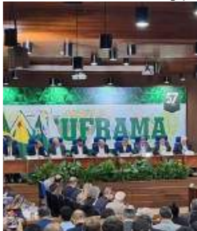
Última reunião do ano será conduzida pelo presidente em exercício

O Conselho de Administração da Suframa (CAS) prevê investimentos de R$ 400 milhões na Zona Franca de Manaus (ZFM).