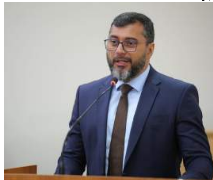
Wilson Lima anunciou que o governo realizará o pagamento do abono

O Fundeb é um mecanismo de financiamento da educação básica no Brasil, formado por recursos provenientes de impostos estaduais, distritais e municipais, com complementação da União. A participação federal no