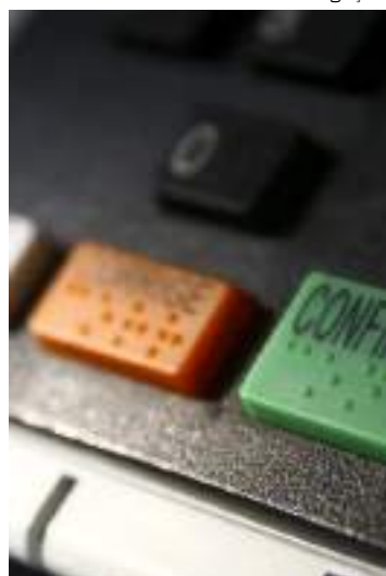
Projeto ainda precisa ser aprovado em Plenário, pela Câmara e Senado

A Comissão de Constituição e Justiça e de Cidadania da Câmara dos Deputados aprovou, na quarta-feira (11), o Projeto de Lei n.º 1.169/2015, que visa a permitir que partidos políticos peçam a recontagem física de votos em eleições nacional, estaduais, distritais ou municipais.