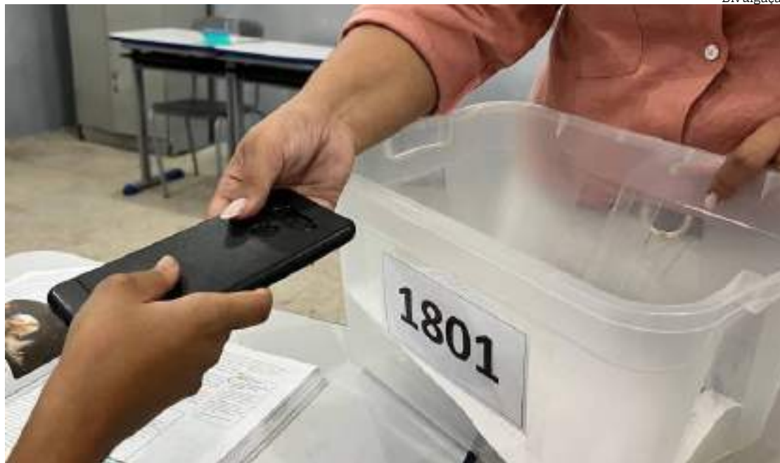
Lei proíbe o uso de celulares nas escolas públicas e privadas

Ainda de acordo com o texto aprovado pela CCJ, os estabelecimentos de ensino terão de disponibilizar espaços de escuta e acolhimento para