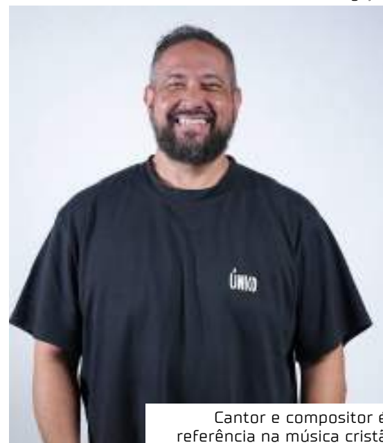
Cantor e compositor é referência na música cristã

A festa de Réveillon mobiliza artistas do segmento gospel/cristão, beneficiando, muitos deles, com a oportunidade de mostrar seus talentos em eventos oficiais da cidade.