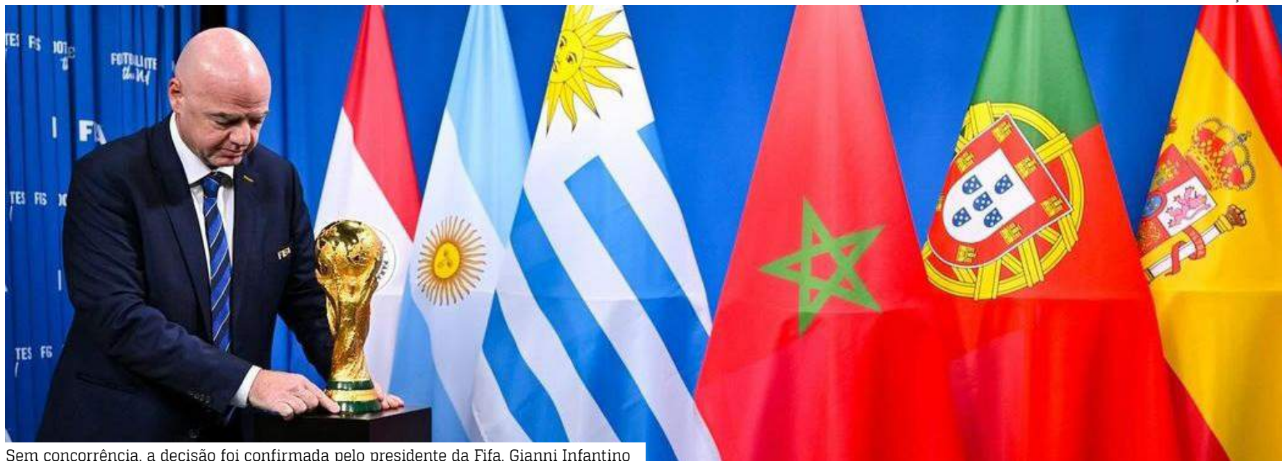
Sem concorrência, a decisão foi confirmada pelo presidente da Fifa, Gianni Infantino

A Fifa anunciou, nesta quarta-feira (11), Espanha, Marrocos e Portugal como sedes da edição da Copa do Mundo de 2030, por meio do Congresso Extraordinário da entidade. No entanto, três jogos serão disputados na América do Sul (Argentina, Paraguai e Uruguai), com uma partida em cada país.