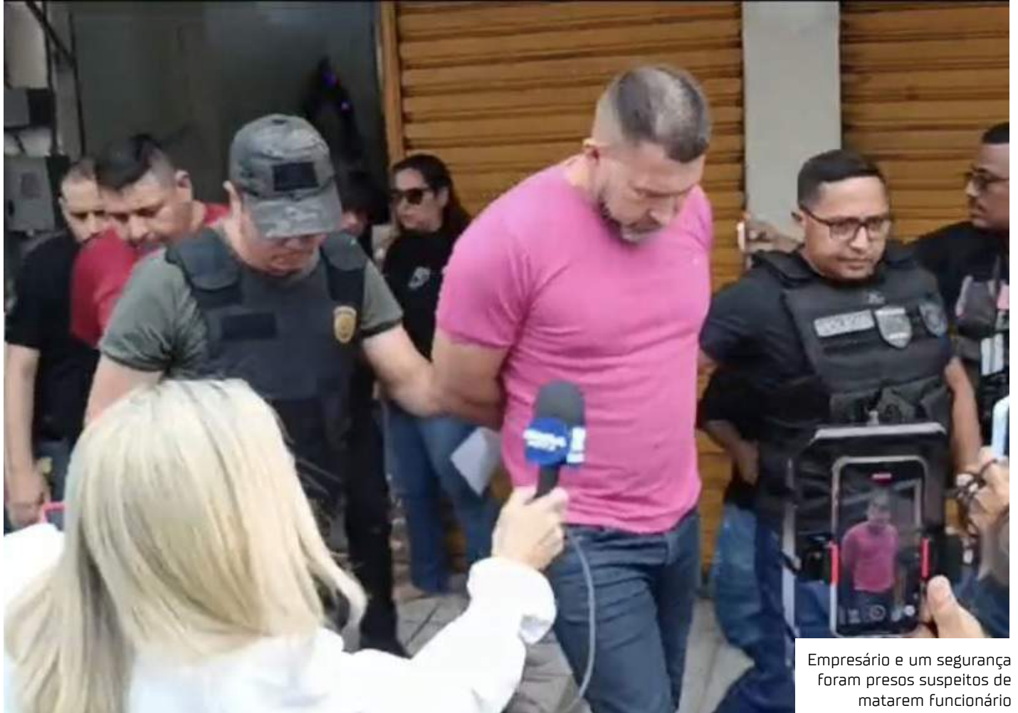
Empresário e um segurança foram presos suspeitos de matarem funcionário

Os suspeitos responderão por homicídio qualificado, com agravantes por motivo torpe e impossibilidade de defesa da vítima.