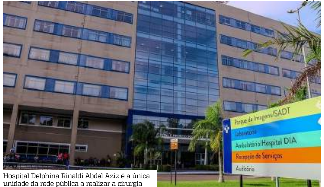
Hospital Delphina Rinaldi Abdel Aziz é a única unidade da rede pública a realizar a cirurgia