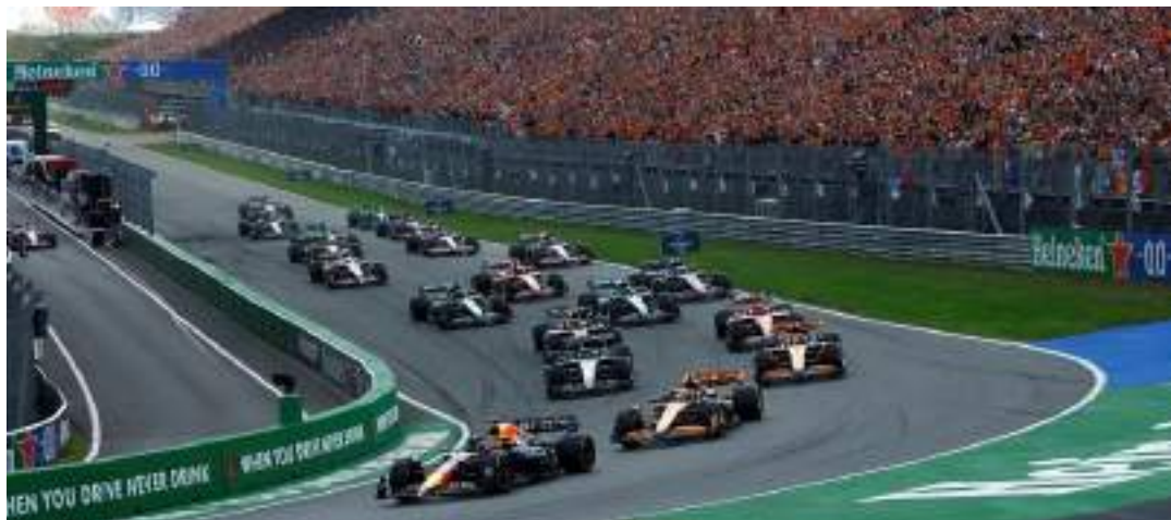
Temporada 2024 termina domingo (8), em Abu Dhabi

O Grande Prêmio da Holanda, casa do tetracampeão mundial Max Verstappen, deixará de fazer parte do calendário a partir de 2026, anunciou a Fórmula 1 nesta quarta-feira (4).