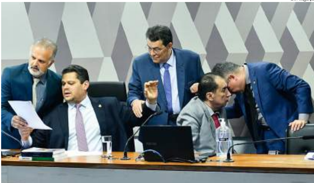
Braga informou que foram apresentadas 1.940 emendas e realizadas 35 audiências públicas

“Portanto, não faltou debate com a sociedade, não faltou debate com o setor produtivo, não faltou apresentação de emendas. 1.940 emendas, além do trabalho que a CAE fez, que recomenda 510 sugestões e apresenta 180 proposições de emendas. Portanto, este é um tema que foi debatido, conversado. Todo esse trabalho, toda essa construção está sendo feita e, portanto, vossa excelência decidindo a leitura na segunda-feira, nós apresentaremos o relatório e começaremos a