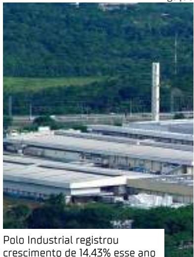
Polo Industrial registrou crescimento de 14,43% esse ano

O Polo Industrial de Manaus (PIM) registrou faturamento de R$ 170,44 bilhões nos dez primeiros meses deste ano, representando crescimento de 14,43% em relação ao desempenho do mesmo período de 2023 (R$ 148,96 bilhões).