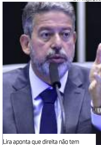
Lira aponta que direita não tem ninguém além de Bolsonaro

O presidente da Câmara dos Deputados, Arthur Lira (PP-AL), afirmou que o presidente Lula (PT) é candidato forte à reeleição se chegar ao ano eleitoral com economia em bom desempenho.