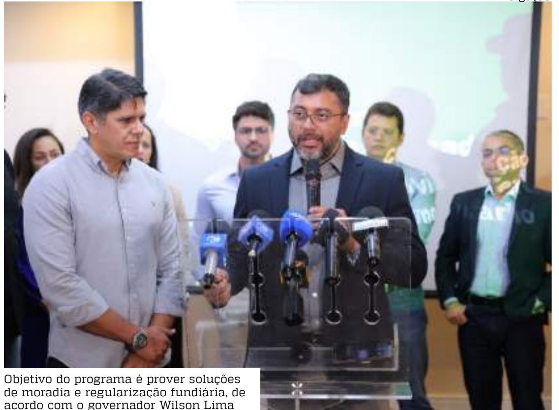
Objetivo do programa é prover soluções de moradia e regularização fundiária, de acordo com o governador Wilson Lima

A primeira edição do Feirão do Amazonas Meu Lar elaborou mais de 3 mil propostas. Desse montante, 434 solicitações estão em análise pela Superintendência Estadual de Habitação (Suhab) e 96 certificados foram emitidos pela