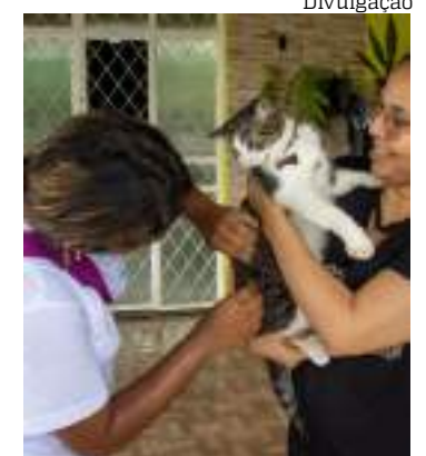
Animais disponíveis para adoção são castrados e vermifugados

A ação com a OBA será neste sábado (07), das 9h às 12h, no Nova Era da avenida Torquato Tapajós, 11.558, bairro Tarumã. A OBA estará presente com cerca de oito animais que aguardam um novo lar.