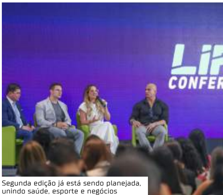
Segunda edição já está sendo planejada, unindo saúde, esporte e negócios

O Life Conference nasceu da visão de que Manaus pode e deve ser referência em saúde no Brasil. Em uma capital com alarmantes índices de obesidade e obesidade infantil, esse evento