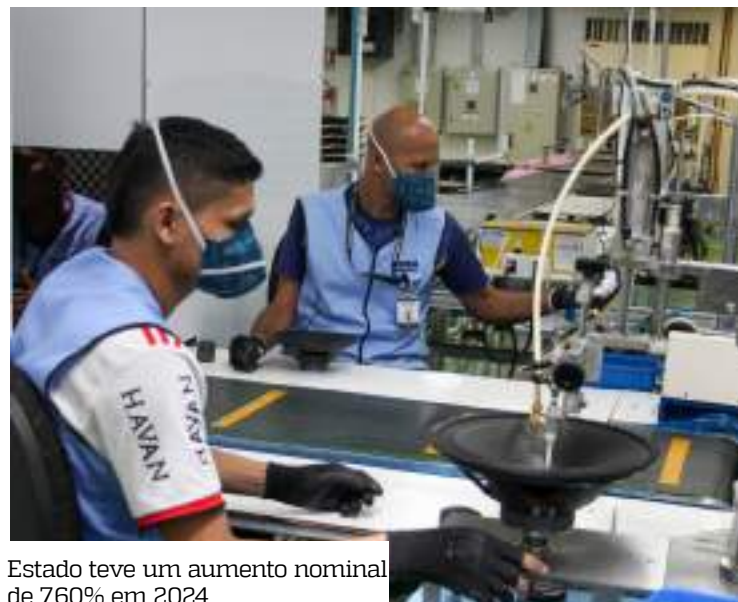
Estado teve um aumento nominal de 7,60% em 2024

Quando comparado ao 2º trimestre de 2024, o setor apresentou alta de 8,12% na receita nominal e 7,01% no volume de