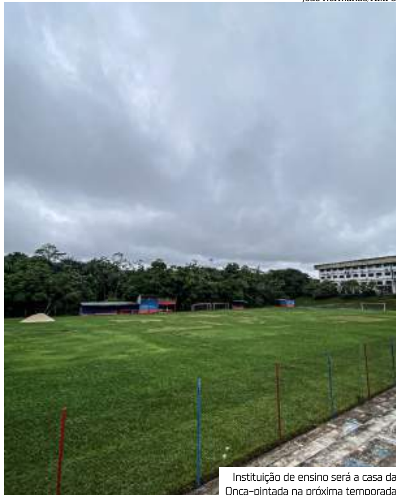
Instituição de ensino será a casa da Onça-pintada na próxima temporada