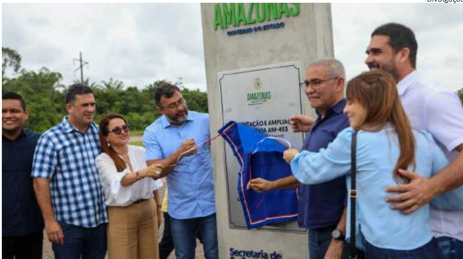
Governador Wilson Lima inaugura rodovia AM-453 ampliada e pavimentada em Manacapuru

A estrada está localizada no quilômetro 56 da rodovia AM-070 e recebeu investimentos de R$ 26,5 milhões do Governo do Amazonas. A pavimentação da estrada foi uma determinação do governador Wilson Lima após pedido dos morado-