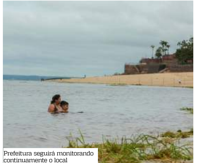
Prefeitura seguirá monitorando continuamente o local

Com a reabertura da praia e a programação especial, a prefeitura também busca estimular a economia da cidade. Comerciantes locais,