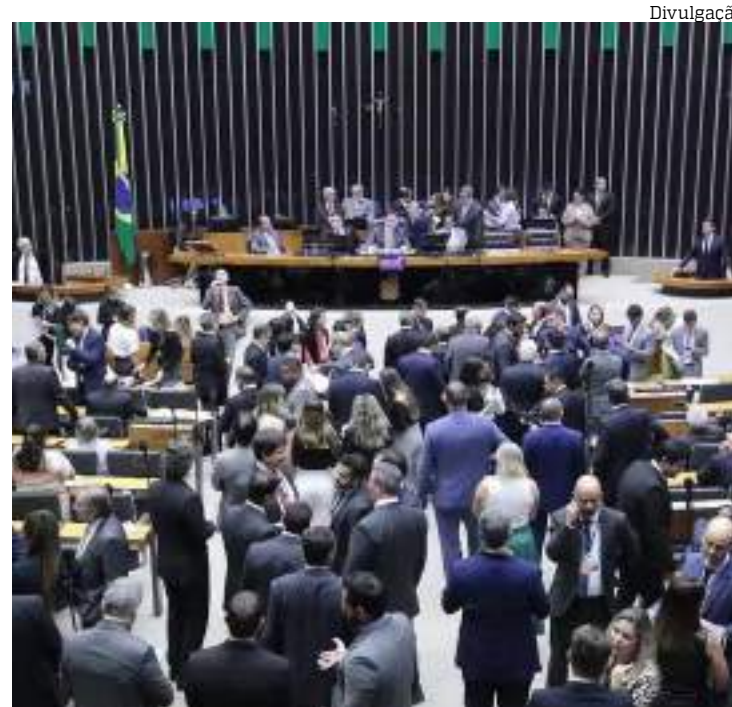
Flávio Dino decidiu suspender o pagamento de R$ 4,2 bi em emendas

“Lamentamos que esse recurso tenha sido bloqueado. Trata-se de emendas parlamentares que cobrem valores aos quais os municípios têm direito. Sem esses recursos, é impossível realizar custeios e adquirir equipamentos necessários para implementar os projetos de saúde de cada prefeito. Quando os prefeitos receberam esses recursos, muitos já pagaram forne-