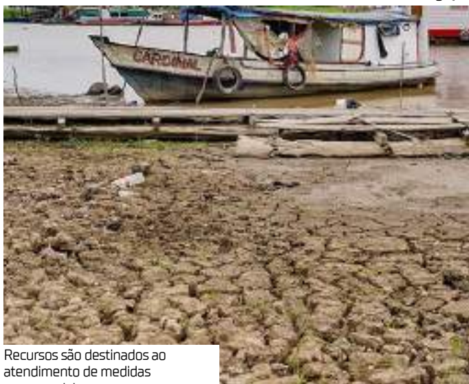
Recursos são destinados ao atendimento de medidas emergenciais

O Congresso Nacional vai analisar medida provisória que abre crédito extraordinário de R$ 233,2 milhões para os Ministérios de Minas e Energia, do Meio Ambiente e Mudança do Clima e de Portos e Aeroportos. Os recursos são destinados ao atendimento de medidas emergenciais determinadas pelo Supremo Tribunal Federal (STF) para a recuperação a municípios afetados por seca ou estiagem, incêndios florestais e chuvas. A MP 1.281/2024 foi publicada no Diário Oficial da União de terça-feira (24) e já está em vigor.