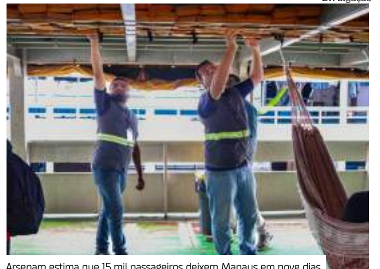
Arsepam estima que 15 mil passageiros deixem Manaus em nove dias

Lasmar também reforçou que qualquer irregularidade observada nos veículos ou embarcações pode ser denunciada pelos passageiros por meio da Ouvidoria da Arsepam, que atende pelo número 2020-1117, disponível 24 horas por dia.