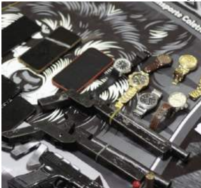
Polícia apreende armas, celulares e joias com criminosos

A Polícia Civil do Amazonas (PC-AM), com apoio da Secretaria de Segurança Pública (SSP-AM), deflagrou, na quinta-feira (26), uma operação policial que resultou nas prisões de seis pessoas, sendo quatro homens e duas mulheres, envolvidas com roubos a ônibus e rotas e nas apreensões de duas armas caseiras, um aparelho celular com restrição de roubo, relógios e joias.