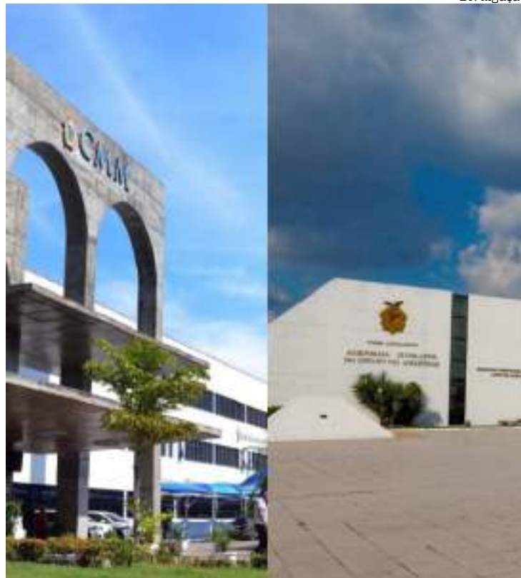
Ações criam base sólida para o crescimento do Amazonas e Manaus