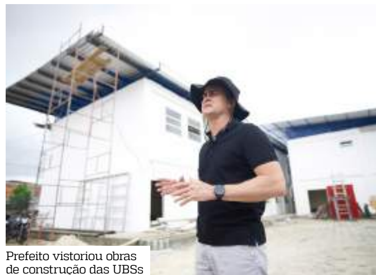
Prefeito vistoriou obras de construção das UBSs

De acordo com o prefeito, as obras estão em fase final de acabamento, com a previsão de serem concluídas e entregues ao longo do primeiro semestre do próximo ano.