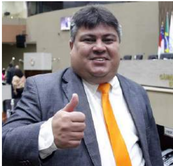
Reis conta com o apoio direto do prefeito David Almeida e de base aliada

A presidência da Câmara Municipal de Manaus carrega grande poder político e administrativo. O presidente da CMM administra um orçamento de R$ 301,2 milhões em 2025 e tem influência di-