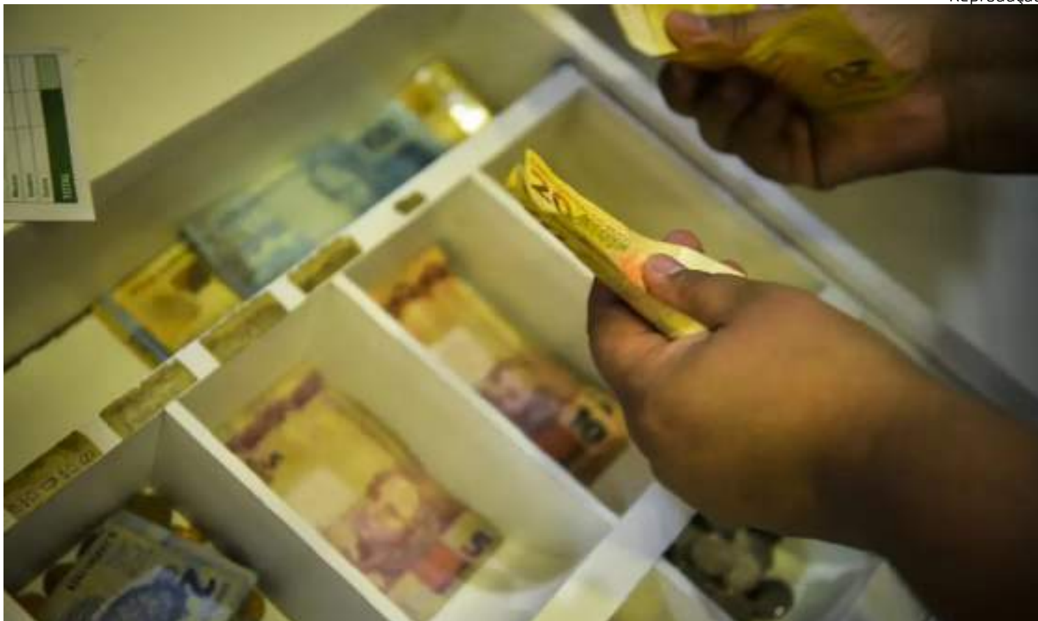
Aumento de R$ 106 em relação ao valor anterior supera a inflação acumulada no período

Para o ministro, seria uma “tragédia” se não houvesse a política de valorização do salário míni-