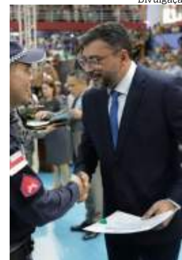
Wilson Lima na formatura de novos PMs

Entre as ações priorizadas, Wilson Lima destacou o projeto Governo Presente, que atendeu quase 100 mil pessoas em 2024 e terá continuidade em 2025. As ações incluem a emissão de documentos, atendimentos médicos e outros serviços de cidadania, ampliando a inclusão social em diversas regiões da capital.