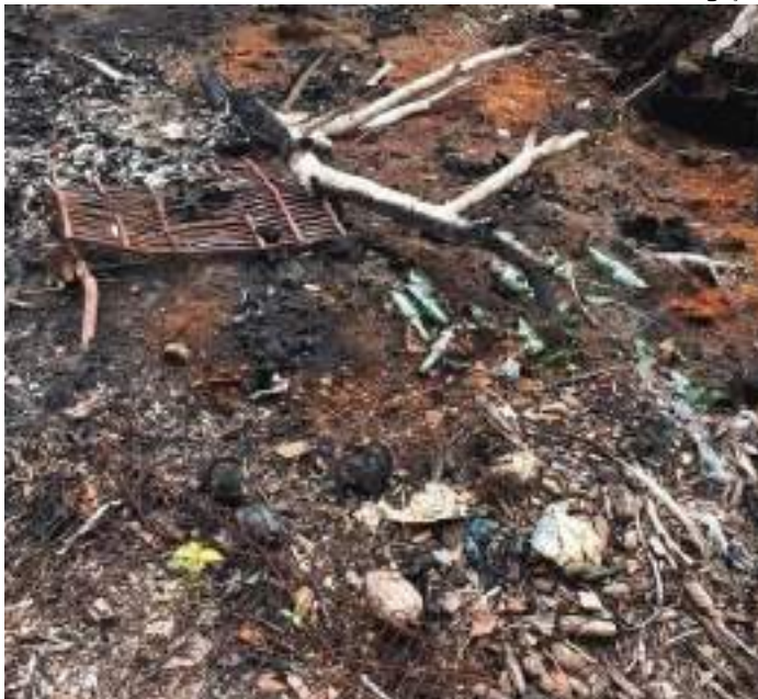
Casal acendeu uma fogueira e passou o dia carbonizando os restos mortais