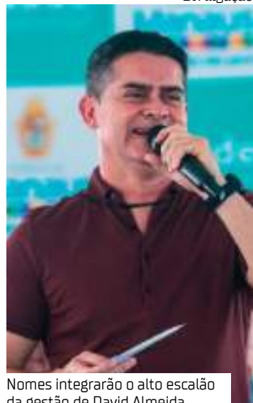
Nomes integrarão o alto escalão da gestão de David Almeida

O prefeito eleito de Manaus, David Almeida (Avante), anunciou na segunda-feira (30), nomes que integrarão o alto escalão de sua gestão, a partir do dia 1º de janeiro de 2025.