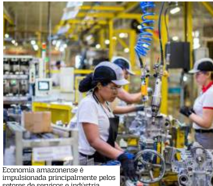
Economia amazonense é impulsionada principalmente pelos setores de serviços e indústria

O setor industrial foi o principal destaque no período, com