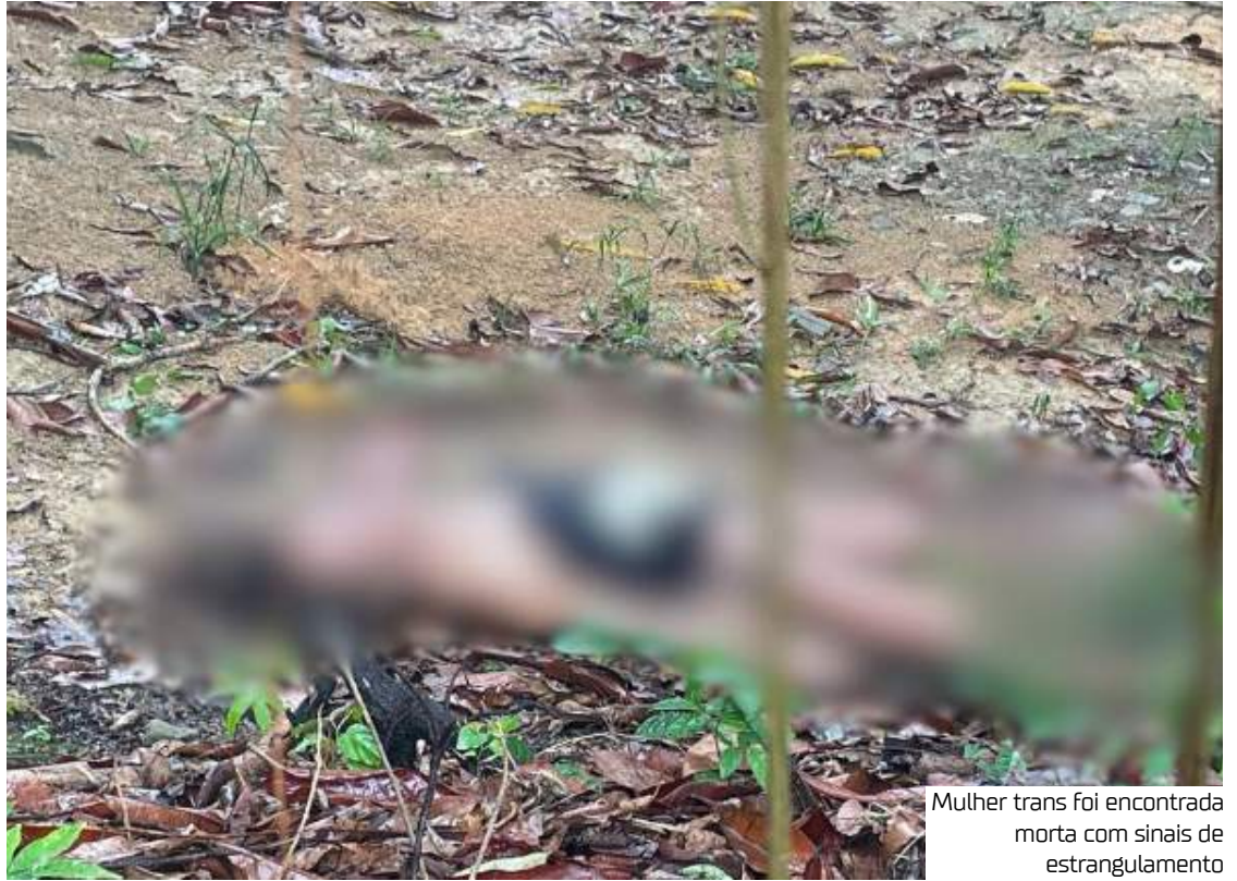
Mulher trans foi encontrada morta com sinais de estrangulamento

O ranking da violência LGBTfóbica é liderado por Mato Grosso do Sul, com 3,26 mortes por milhão; Ceará, com 2,73 mortes, Alagoas, com 2,56, e Rondônia, com 2,53 mortes por milhão.