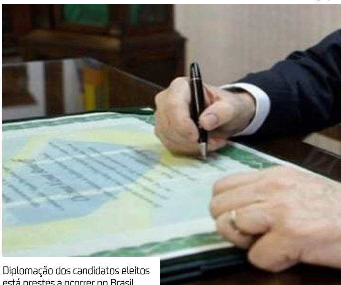
Diplomação dos candidatos eleitos está prestes a ocorrer no Brasil

A diplomação dos candidatos eleitos em 2024 está prestes a ocorrer, com o prazo final definido pela Justiça Eleitoral para o dia 19 de dezembro. Este ato representa a etapa final do processo eleitoral, oficializando os resultados das urnas e habilitando os eleitos a assumirem seus mandatos em 1º de janeiro de 2025.