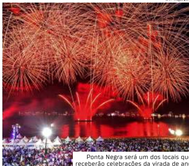
Ponta Negra será um dos locais que receberão celebrações da virada de ano