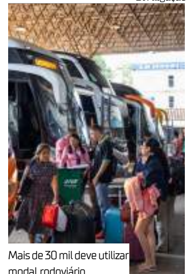
Mais de 30 mil deve utilizar modal rodoviário

Dezoito mil pessoas devem utilizar o modal hidroviário intermunicipal durante os dez dias de operação. Segundo o Departamento de Transporte Hidroviário (DETH), as fiscalizações devem ultrapassar 500 no período.