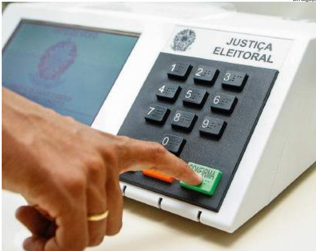
Pesquisa revela um aumento recorde nos casos de violência política em 2024

“O alto nível de violência política em 2024 preocupa,