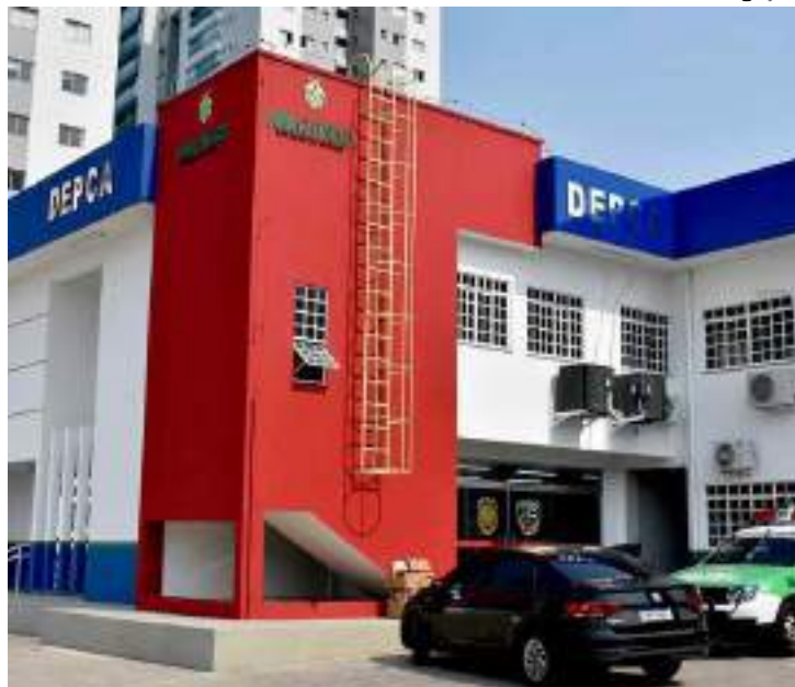
Suspeito foi autuado em flagrante por estupro de vulnerável

Um homem de 36 anos, foi preso por estupro de vulnerável contra a filha de sua companheira, uma criança de cinco anos. A prisão ocorreu em um shopping center localizado na avenida Autaz Mirim, na Zona Leste de Manaus.