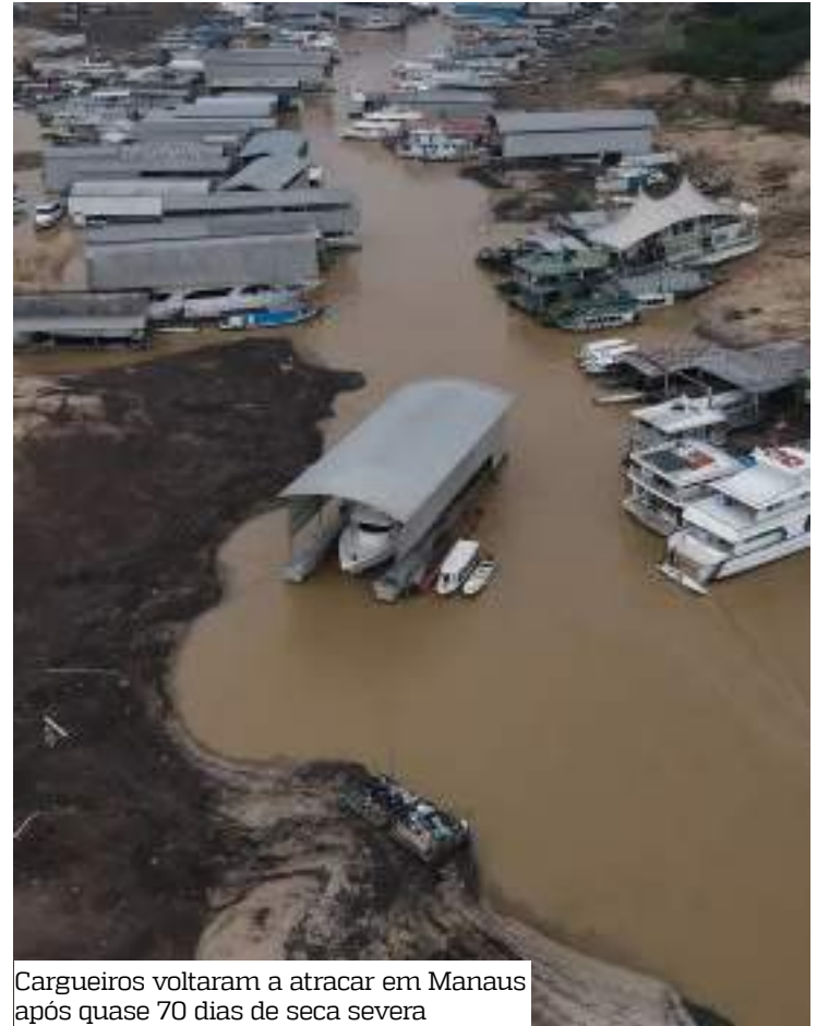
Cargueiros voltaram a atracar em Manaus após quase 70 dias de seca severa

O Governo do Amazonas já enviou 202,6 toneladas de medicamentos e insumos para municípios das regiões dos rios Madeira, Juruá, Purus e Alto Solimões, 854 cilindros de oxigênio, além da instalação de uma usina de oxigênio em Envira. Também foram distribuídos medicamentos e insumos para diversos municípios, totalizando mais de 35 mil volumes.