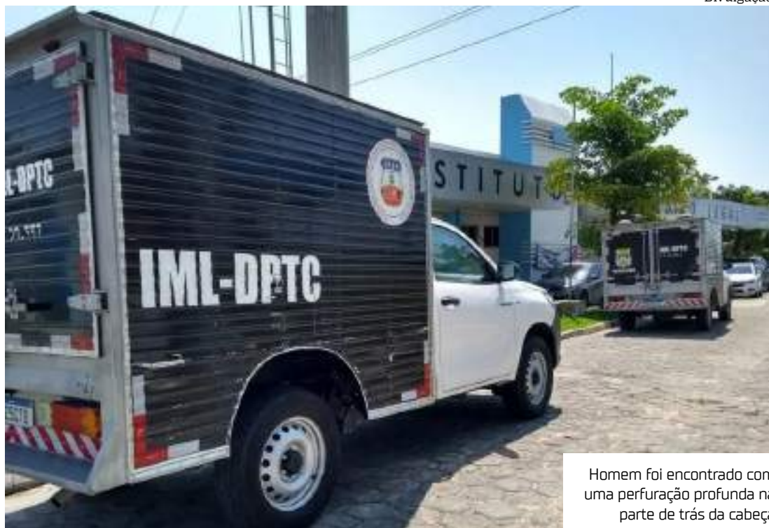
Homem foi encontrado com uma perfuração profunda na parte de trás da cabeça

O corpo foi removido para o Instituto Médico Legal (IML), e a Delegacia Especializada em Homicídios e Sequestros (DEHS) ficará responsável pelas investigações para esclarecer o caso.