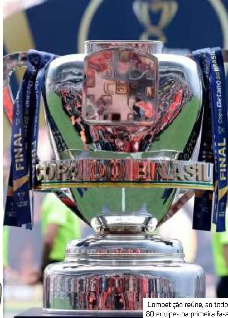
Competição reúne, ao todo, 80 equipes na primeira fase