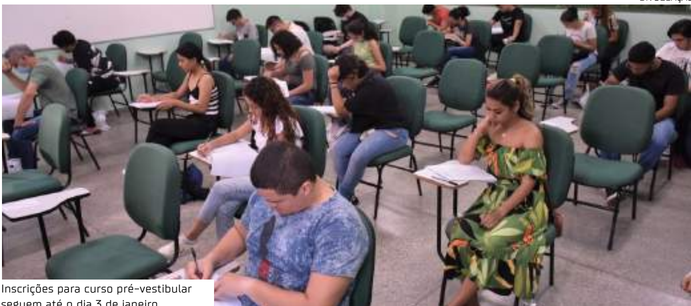
Inscrições para curso pré-vestibular seguem até o dia 3 de janeiro