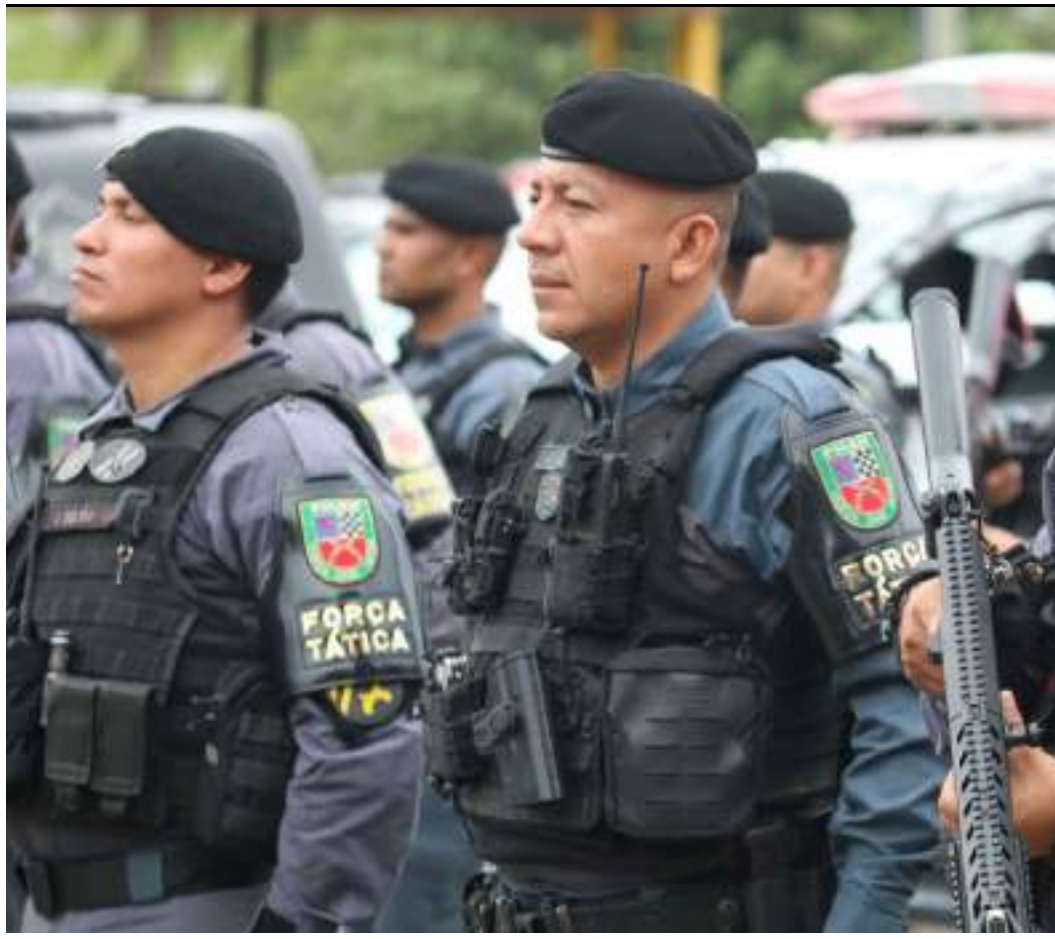
Mais de 2 mil policiais militares atuarão nas festas de fim de ano no Estado

Serão oferecidas 330 vagas distribuídas nos cursos de mestrado em segurança pública, especialização em gestão estratégica em segurança pública, especialização em segurança e saúde no trabalho aplicada à segurança pública e especialização em gestão financeira e contábil no setor público.