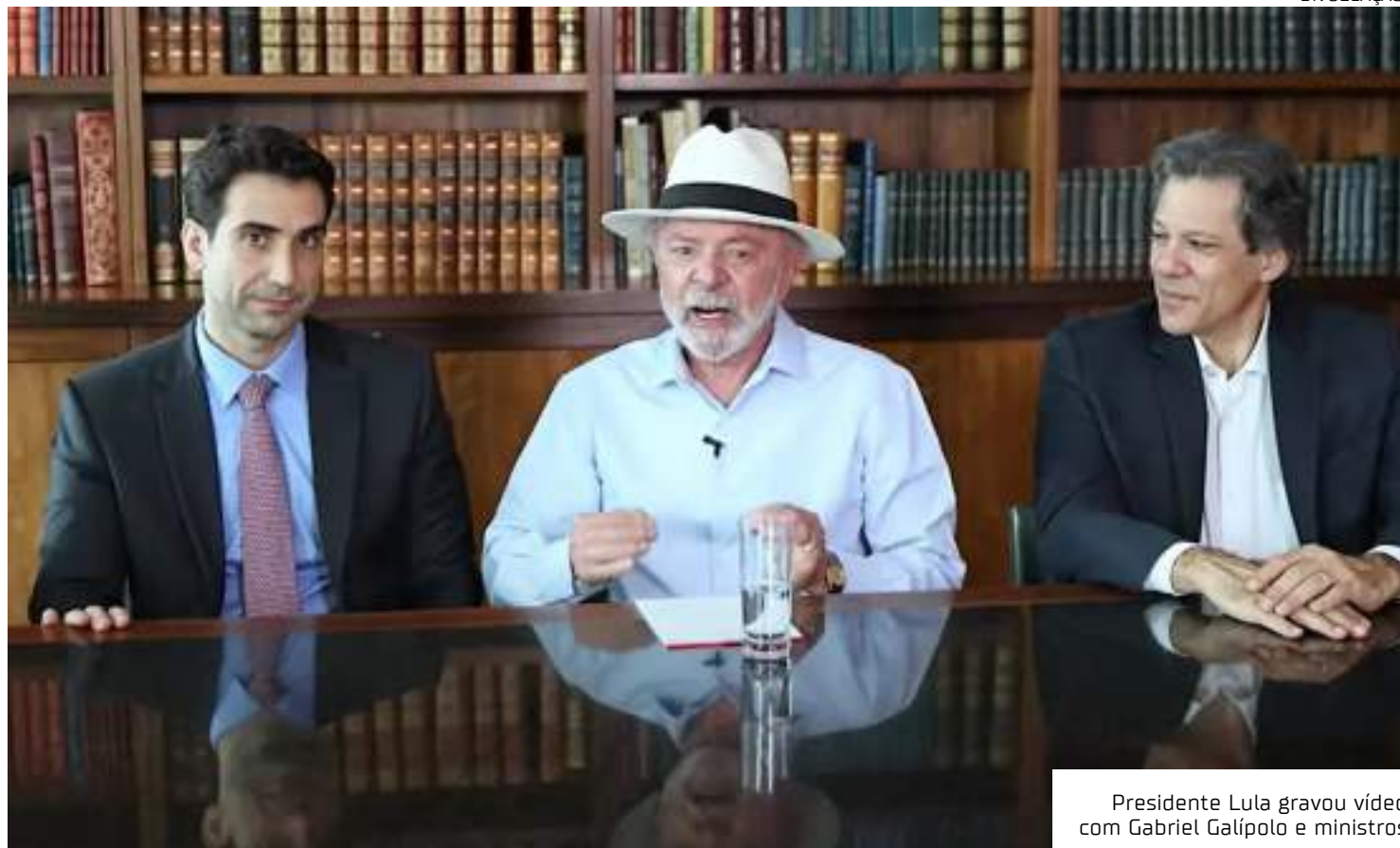
Presidente Lula gravou vídeo com Gabriel Galípolo e ministros

Segundo relatos ainda da reunião, o presidente defendeu o corte de gastos e disse estar feliz com o que foi aprovado no Congresso. Lula afirmou que a pauta era difícil, mas que tinha dado certo, e agradeceu o empenho de ministros na votação, citando Haddad e Alexandre Padilha (Relações