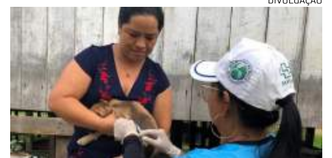
Campanha de vacinação antirrábica em cães e gatos

“O alcance da cobertura em 41 municípios é resultado de esforço conjunto entre os municípios e a FVS-RCP, antecipando envio de doses por ocasião da estiagem, por exemplo, realizando treinamento contínuo com os profissionais e campanhas de educação em saúde para prevenir a raiva”, destacou a diretora-presidente da FVS-RCP, Tatyana Amorim.