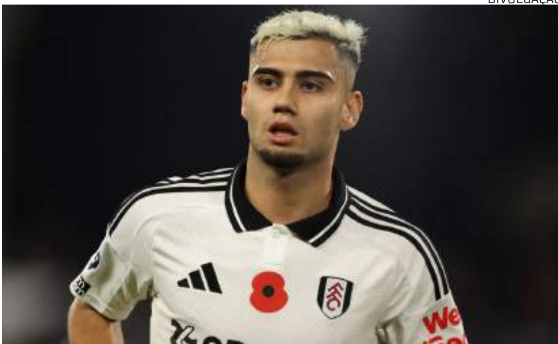
Andreas Pereira demonstrou interesse em jogar no Palmeiras

Formado nas categorias de base do Manchester United, o atleta acumulou passagens por alguns clubes do futebol europeu antes de retornar ao Brasil, em 2021, para defender o Flamengo. As boas atuações pelo Rubro-Negro, inclusive, garantiram a Andreas Pereira vaga na Seleção Brasileira.