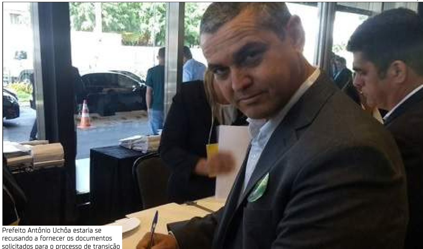
Prefeito Antônio Uchôa estaria se recusando a fornecer os documentos solicitados para o processo de transição

De acordo com o ação, mesmo após decisão do Tribunal de Contas do Amazonas (TCE-AM) e recomendação do Ministério Público local, o (atual) prefeito Antônio Brito não acatou a determinação que orienta a entrega de documentos essenciais, como relatórios financeiro e fiscais, informações sobre folha de pagamento, inventário de bens móveis e imóveis e aplicação de recursos do Fundeb e FNS.