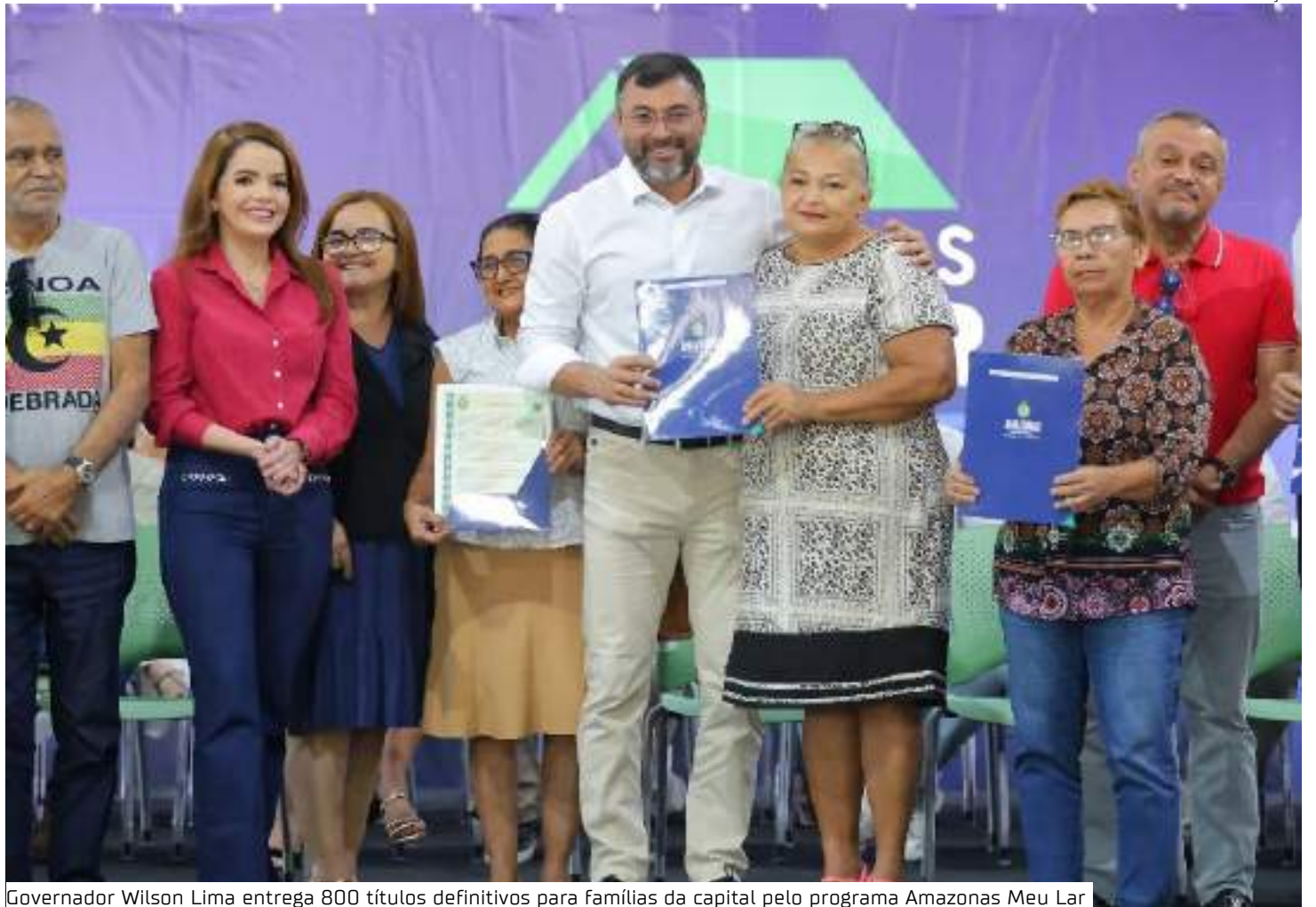
Governador Wilson Lima entrega 800 títulos definitivos para famílias da capital pelo programa Amazonas Meu Lar