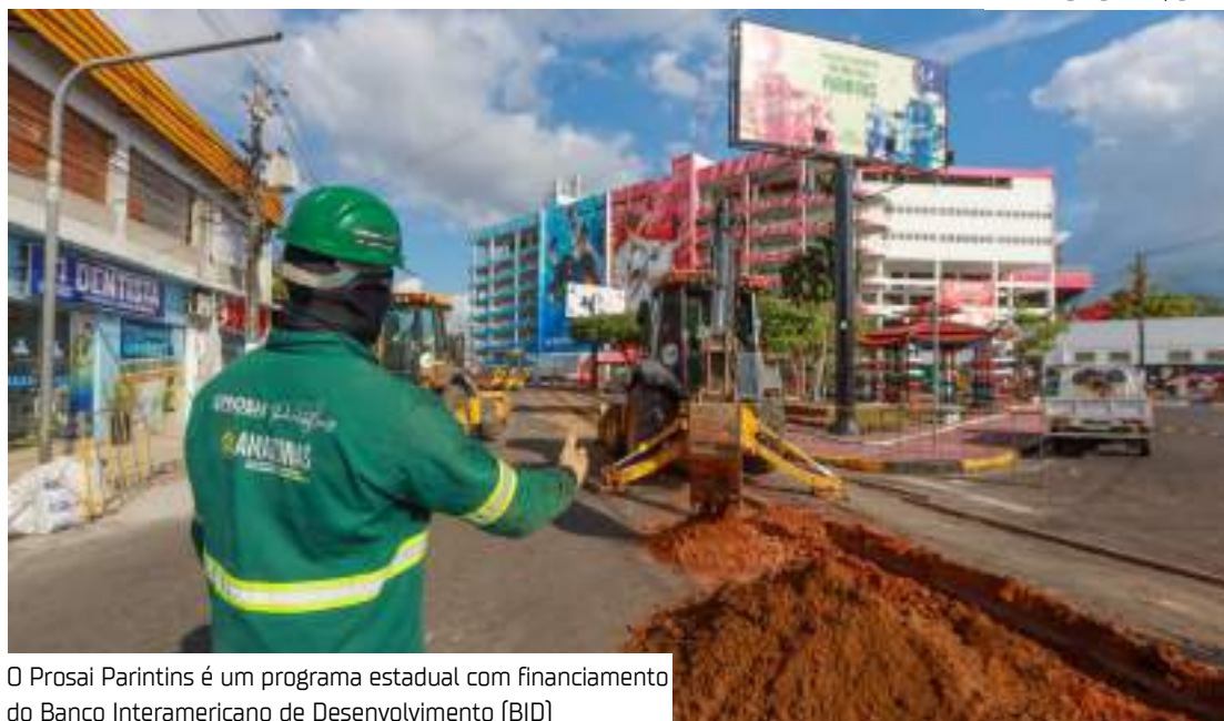
O Prosai Parintins é um programa estadual com financiamento do Banco Interamericano de Desenvolvimento (BID)

Todos os reservatórios estão sendo construídos seguindo normas técnicas rigorosas, garantindo uma durabilidade estimada de até 60 anos.