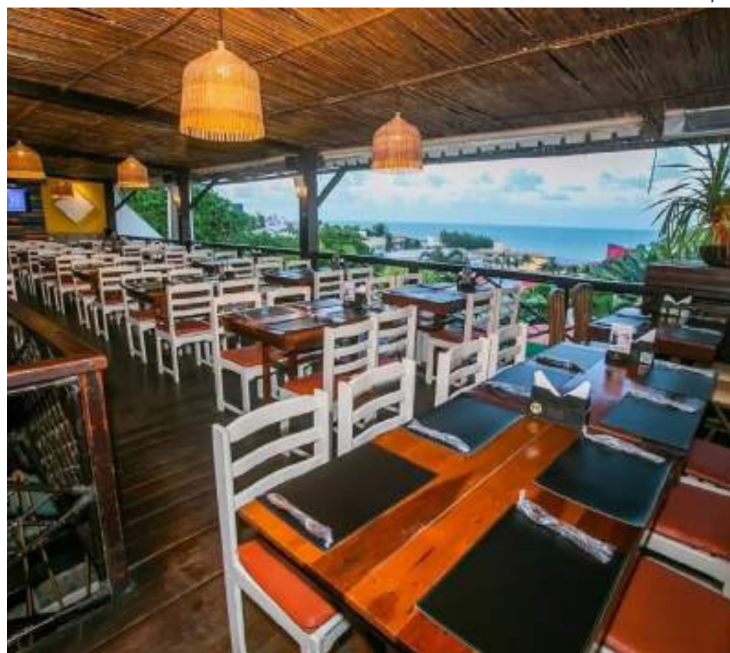
Restaurantes apostam em contratação e treinamento de funcionários, além de cardápios especiais

"Ao priorizar a fidelização, os restaurantes têm a chance de iniciar 2025 com uma base de clientes mais sólida, capaz de sustentar o negócio mesmo fora de períodos sazonais. Esse planejamento estratégico reforça a estabilidade e a lucratividade dos estabelecimentos, reduzindo a dependência de datas comemorativas para manter o fluxo de caixa", explica Solmucci.