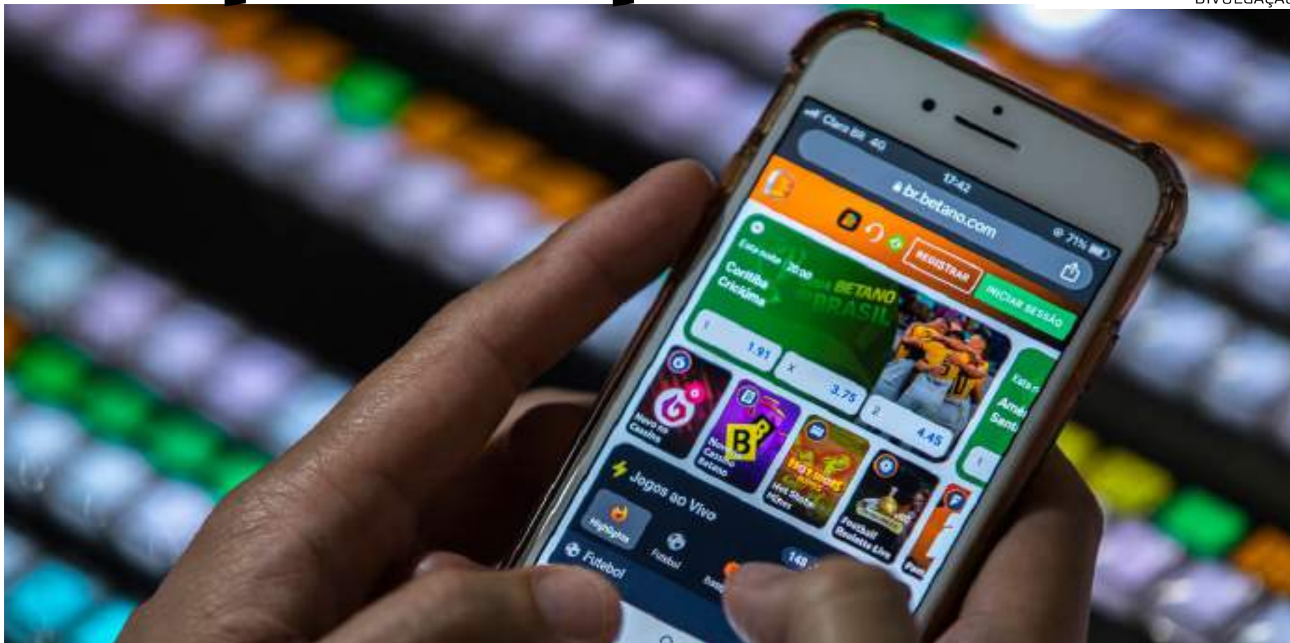
Bancos já começaram a reduzir os limites de crédito de clientes que fazem apostas em sites e aplicativos

envolve equipes de tecnologia, análise de riscos e de crédito.