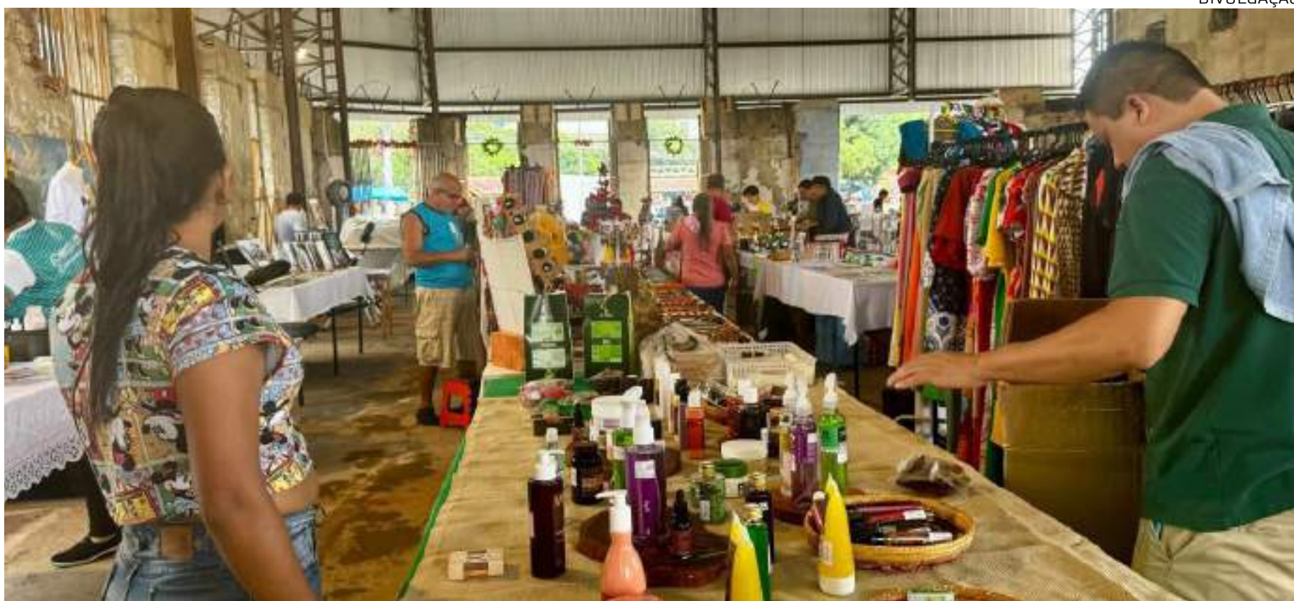
Primeira Feira de Natal no Complexo Booth Line - Mercado de Origem da Amazônia no Centro de Manaus

"A Feira de Natal é uma excelente opção para garantir aquele presente especial, experimentar sabores únicos e entrar no clima natalino em um espaço que respira a história de Manaus. Estamos movimentando esse espaço com agricultura familiar, extrativismo, artesanato e demais segmentos, enquanto a obra de revitalização continua. É o Centro da cidade sendo resgatado e apoiado por toda a população que sempre sonhou em ver esse local de portas abertas novamente. Todos podem vir visitar os eventos que estamos promovendo aqui com o objetivo de ocupar para preservar", destacou o idealizador do projeto, o presidente