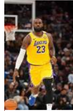
Astro jogou mais de 1.500 partidas na carreira