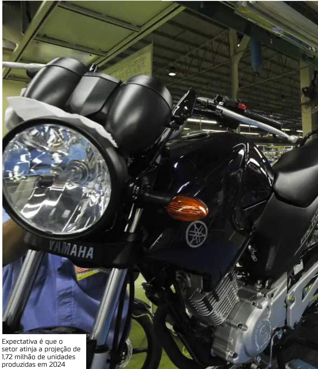
Expectativa é que o setor atinja a projeção de 1,72 milhão de unidades produzidas em 2024