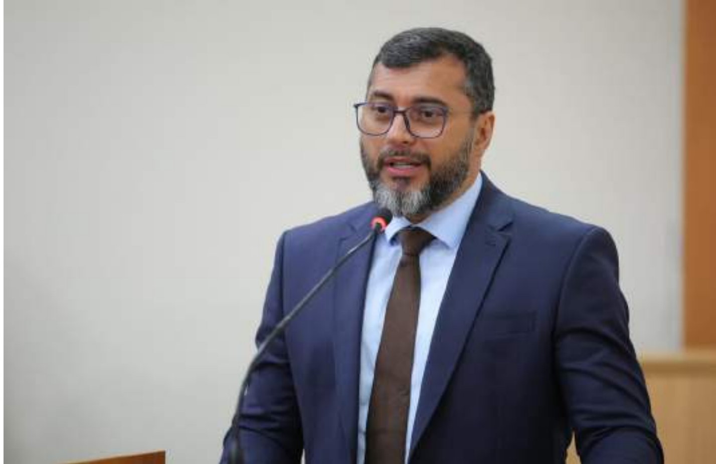
Wilson Lima anunciou que o governo do Amazonas realizará o pagamento do Fundeb

O Fundo de Manutenção e Desenvolvimento da Educação Básica (Fundeb) representa uma das principais fontes de recursos para a educação básica pública no Brasil. Criado em 2020, o fundo