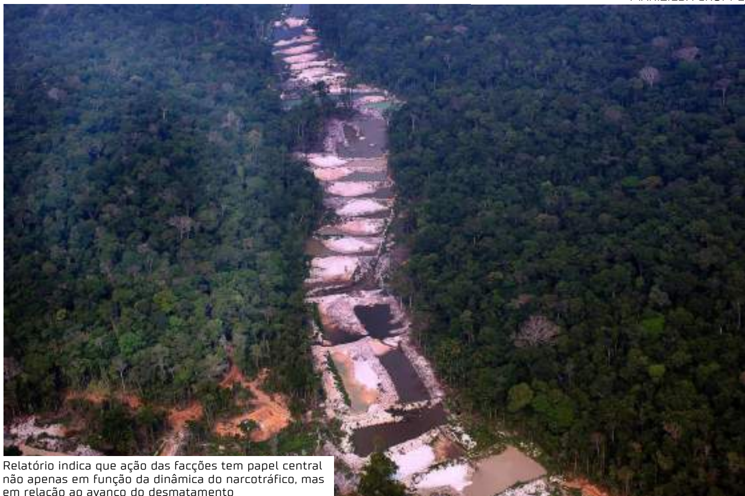
Relatório indica que ação das facções tem papel central não apenas em função da dinâmica do narcotráfico, mas em relação ao avanço do desmatamento

Considerando o triênio 2021-2023, 445 dos 772 municípios tiveram taxas de mortes violentas intencionais (MVI) mais elevadas do que as da média do país. Tais cidades concentram 66,8% da população da região e 83,7% de todos os assassinatos. Ainda que o levantamento aponte a redução