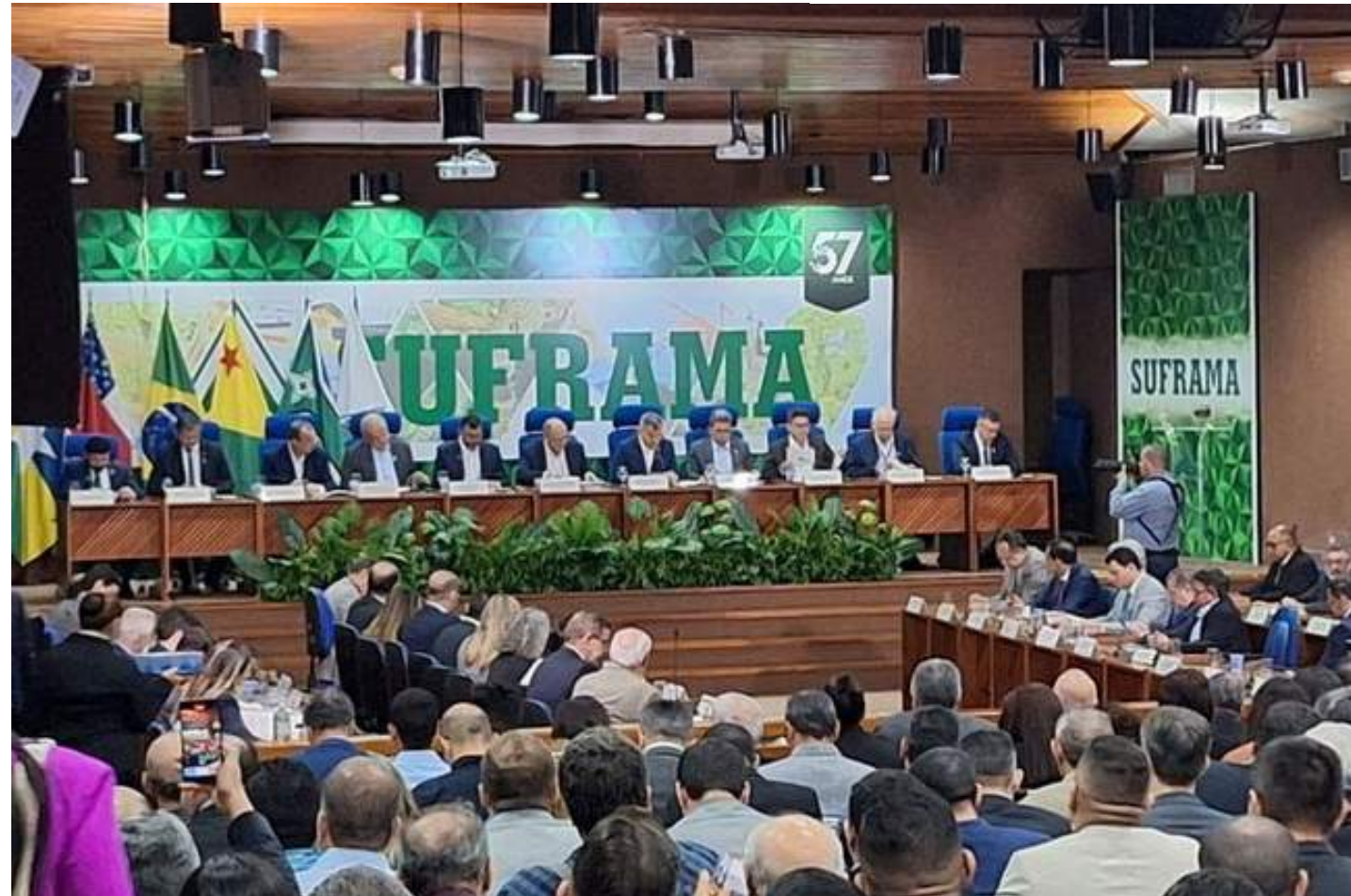
Última reunião do CAS em 2024 será conduzida pelo presidente da República em exercício e ministro do MDIC

Dentre eles, merece destaque o projeto de diversificação da Digitron da Amazônia Indústria e