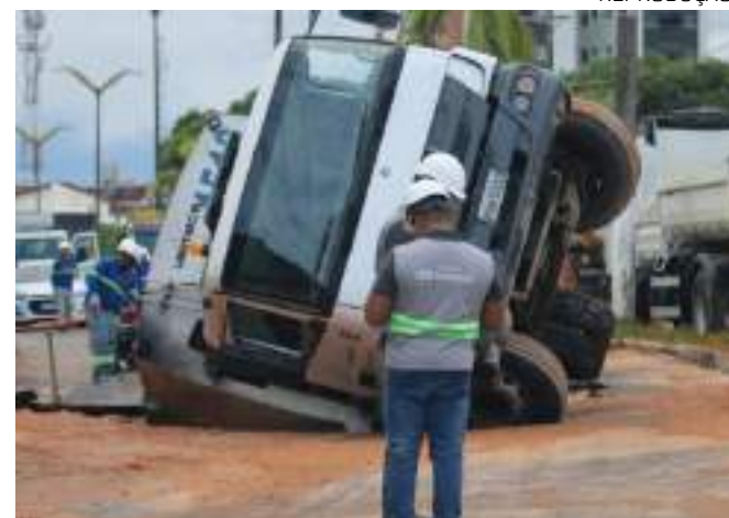
Trânsito na área foi alterado com interdições