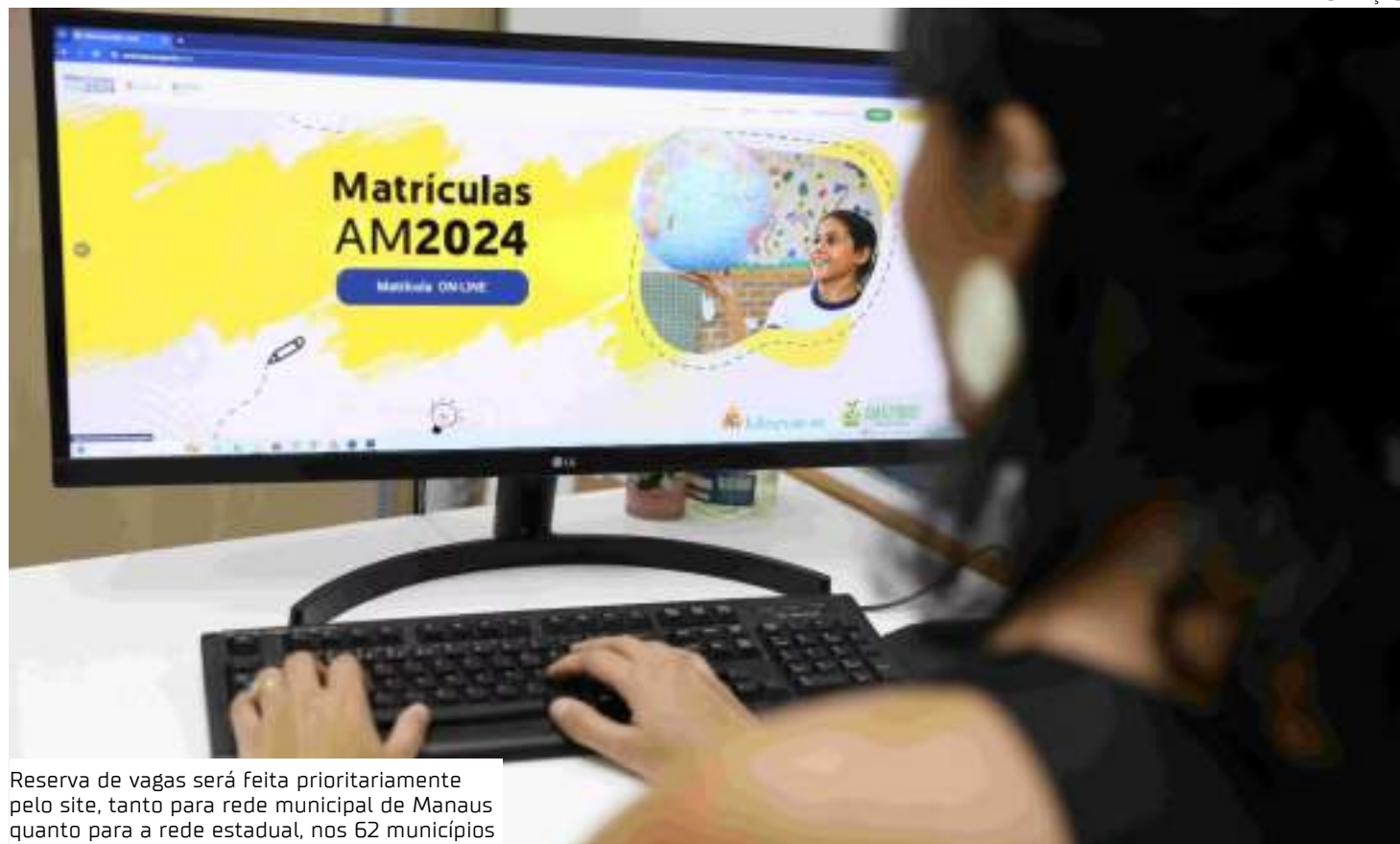
Reserva de vagas será feita prioritariamente pelo site, tanto para rede municipal de Manaus quanto para a rede estadual, nos 62 municípios

O próximo passo é referente à transferência e matrícula de alunos novos com deficiência, que têm prioridade de atendimento, baseada na Lei 13.146 - Estatuto da Pessoa com Deficiência, que acontece nos dias 09 e 10 de janeiro. Após as prioridades, as transferências seguem