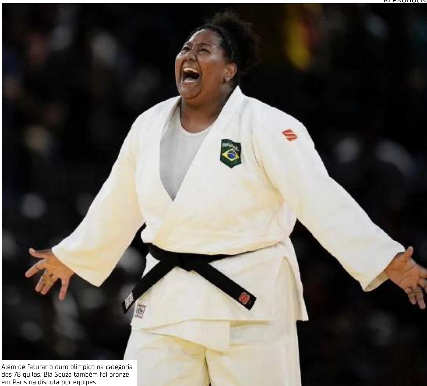
Além de faturar o ouro olímpico na categoria dos 78 quilos, Bia Souza também foi bronze em Paris na disputa por equipes

Antes de Paris 2024, Bia Souza foi campeã no Grand Prix da Áustria em março, e também faturou ouro no mês seguinte no Campeonato Pan-Americano de judô, no Rio de Janeiro. A brasileira fecha a temporada na vice-liderança do ranking mundial dos 78 kg (pesos-pesados).