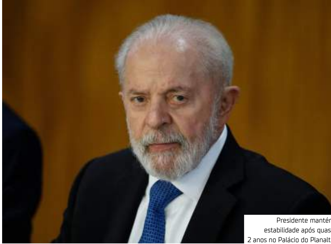
Presidente mantém estabilidade após quase 2 anos no Palácio do Planalto

O resultado de dezembro representa uma oscilação po-