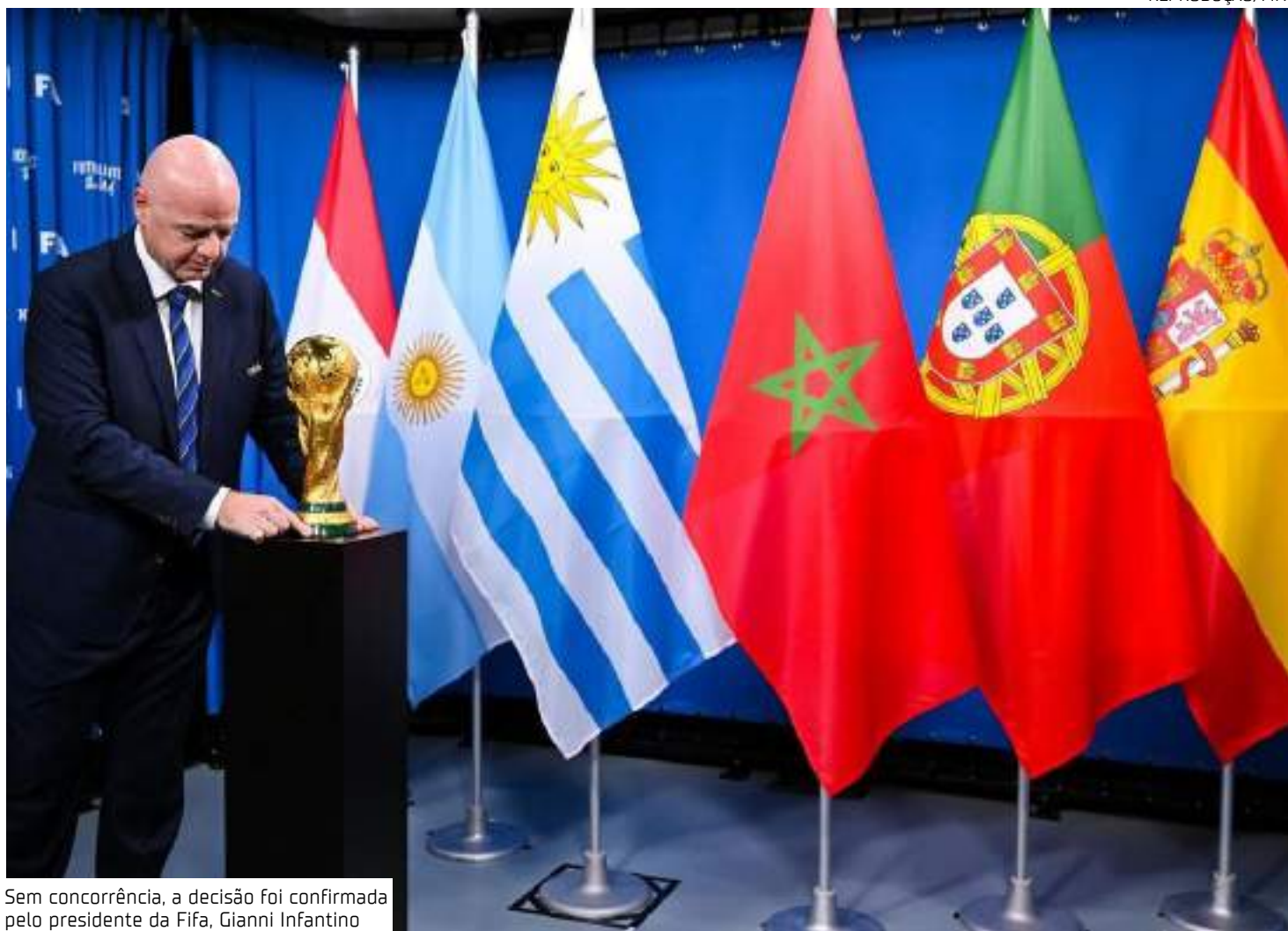
Sem concorrência, a decisão foi confirmada pelo presidente da Fifa, Gianni Infantino

O Congresso da Fifa designou o país como adequado para a competição. 211 membros deram aval para a realização, exceto a Federação Norueguesa,