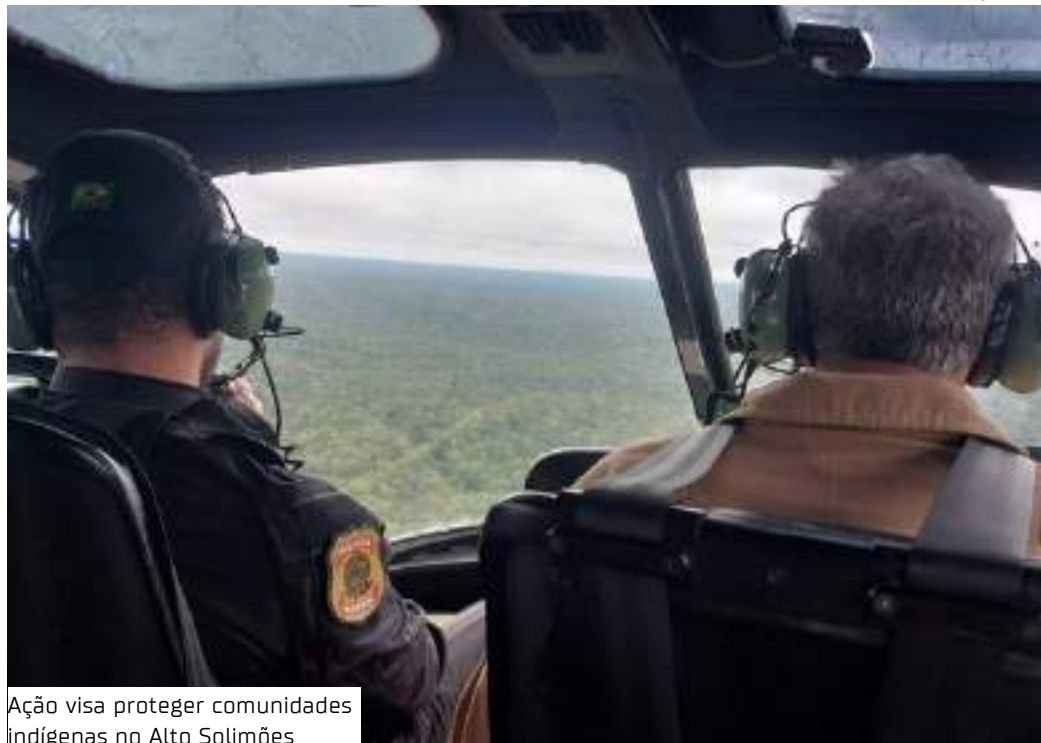
Ação visa proteger comunidades indígenas no Alto Solimões