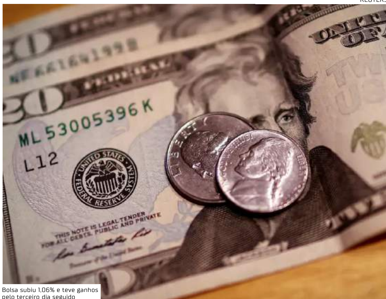
Bolsa subiu 1,06% e teve ganhos pelo terceiro dia seguido

O comunicado da reunião do Copom foi divulgado após o fechamento do mercado financeiro. Dessa forma, a repercussão só será sentida nesta quinta-feira (12). Juros mais altos que o previsto tendem a reduzir a pressão sobre o dólar, ao estimular a entrada de capitais estrangeiros em busca de maior rentabilidade.