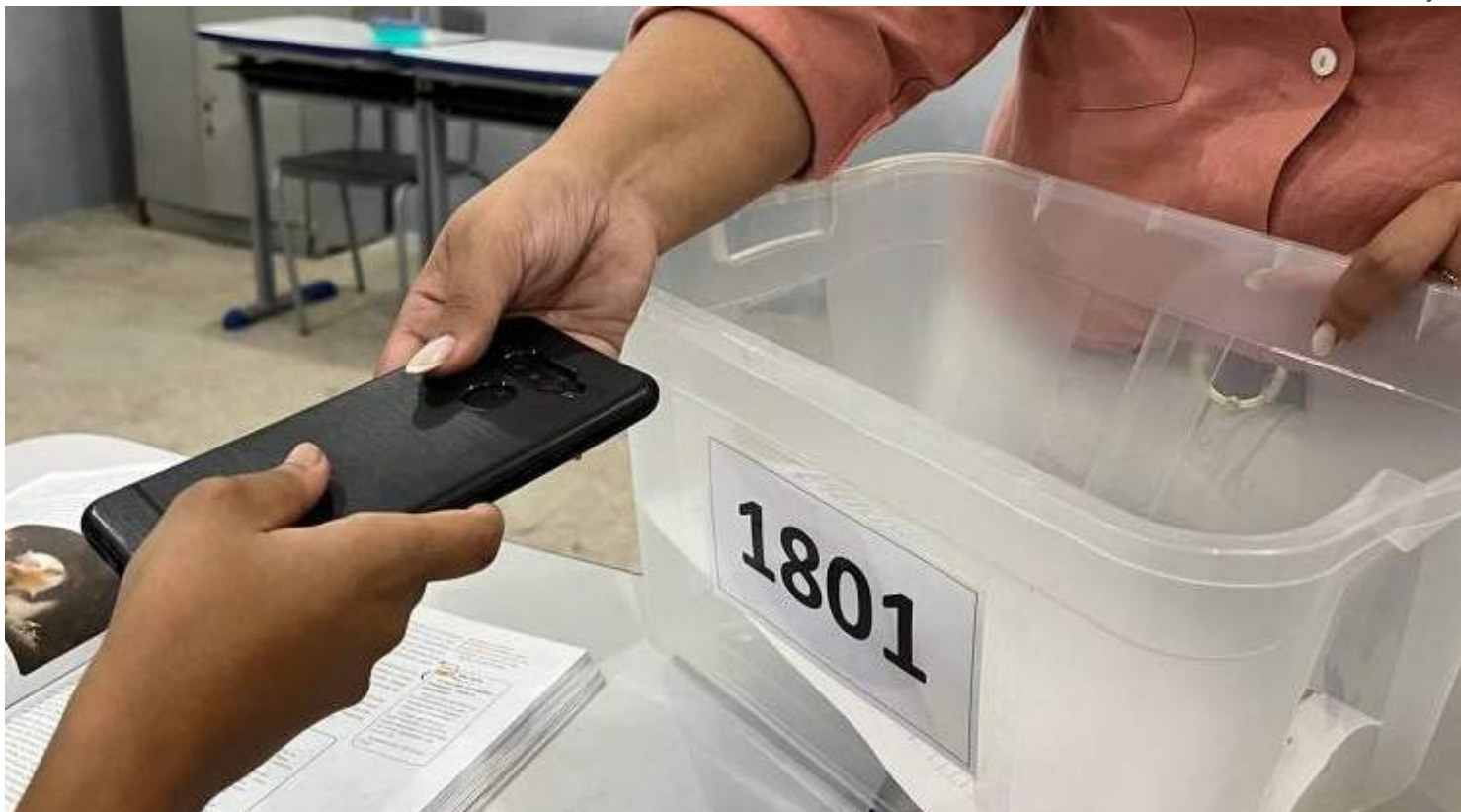
Lei proíbe o uso de celulares nas escolas públicas e privadas, durante a educação básica

ministro da Educação, Camilo Santana (PT), afirmou que apoiava o projeto. A pasta também informou que estava preparando medidas para coibir o uso de celulares nas escolas públicas.