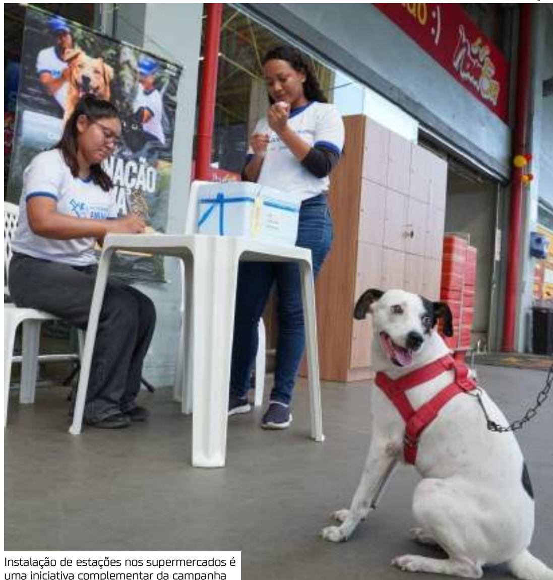
Instalação de estações nos supermercados é uma iniciativa complementar da campanha

A campanha antirrábica da Prefeitura de Manaus já imunizou 203 mil animais, entre gatos e cachorros, na capital. Iniciada no dia 1º de outubro, a campanha deste ano, que é executada pela Secretaria Municipal de Saúde (Sems), por meio do Centro de Controle de Zoonoses (CCZ), além da vacinação casa a casa, traz como diferencial a oferta do imunizante em pontos fixos estrategicamente localizados, facilitando acesso para os tutores e ampliando a proteção dos animais.