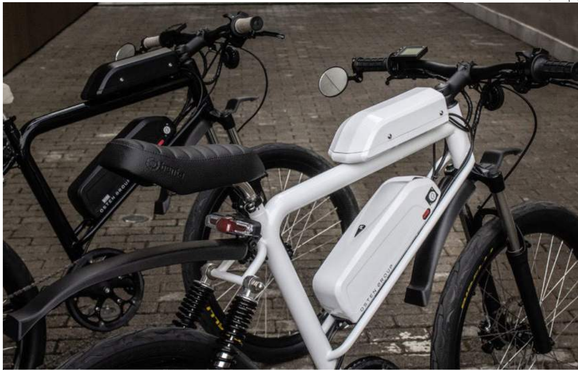
Mountain Bike (MTB) foi a bicicleta elétrica mais fabricada pelas empresas do Polo Industrial de Manaus

A produção de bicicletas elétricas se manteve como destaque no ano, com cres-