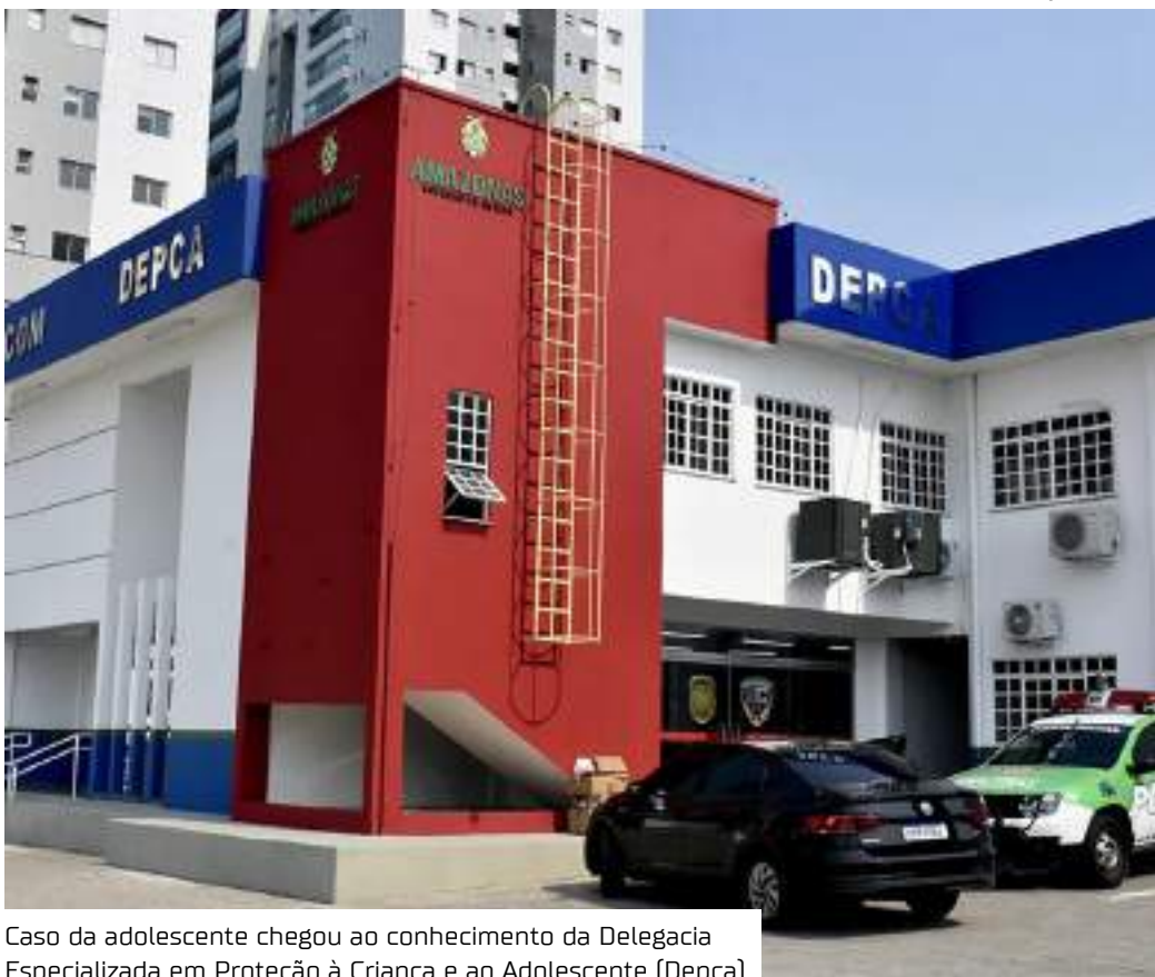
Caso da adolescente chegou ao conhecimento da Delegacia Especializada em Proteção à Criança e ao Adolescente (Depca)