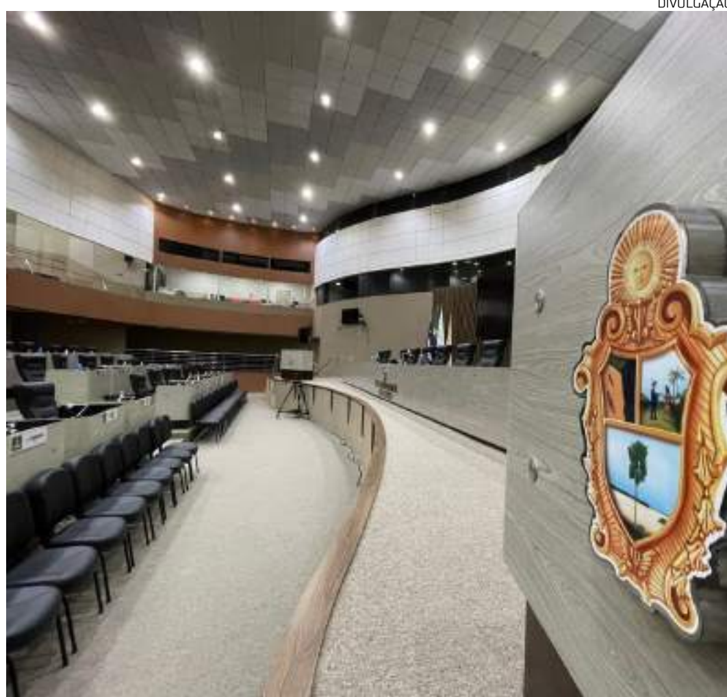
PGM apresentou provas de que os repasses à CMM têm sido realizados regularmente