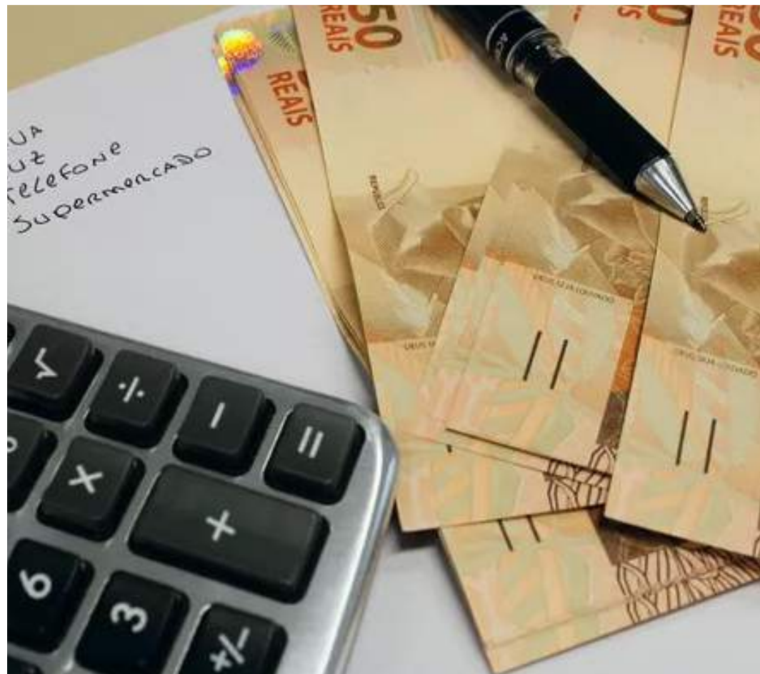
Pesquisa revela que 66% dos consumidores planejam com antecedência como aproveitar o valor

Com o propósito de revolucionar o acesso ao crédito no Brasil, a Serasa oferece um ecossistema completo voltado para a melhoria da saúde financeira da população por meio de produtos e serviços digitais.