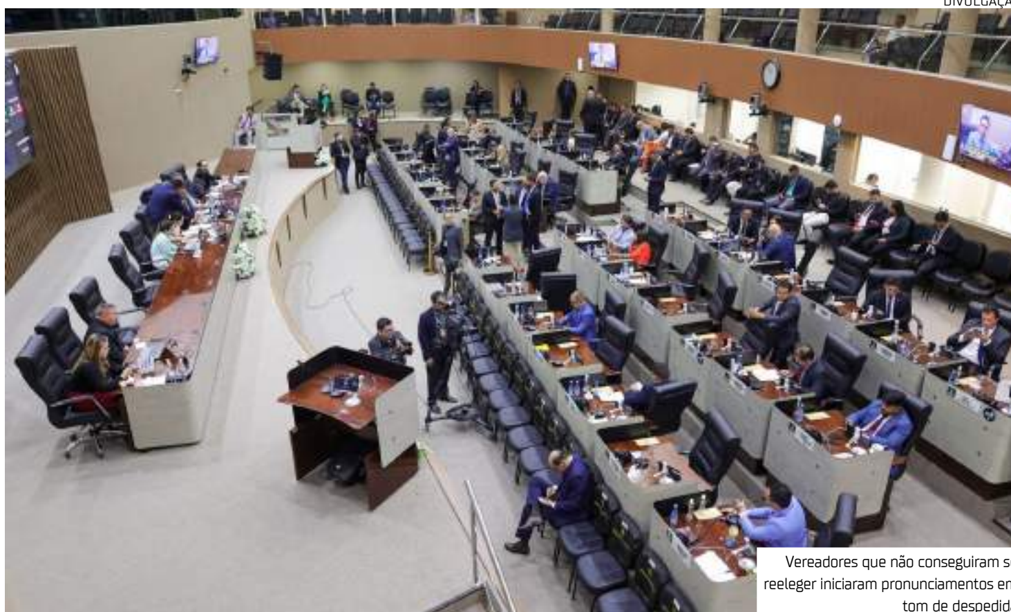
Vereadores que não conseguiram se reeleger iniciaram pronunciamentos em tom de despedida

"Nós fizemos um trabalho de modernização tecnológica e transparência deste Poder.