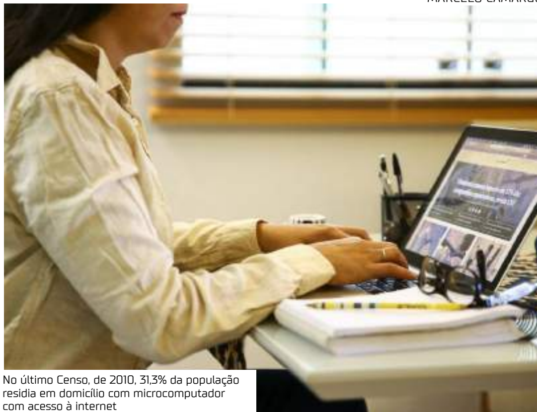
No último Censo, de 2010, 31,3% da população residia em domicílio com microcomputador com acesso à internet

44,5% não contavam com internet em casa.