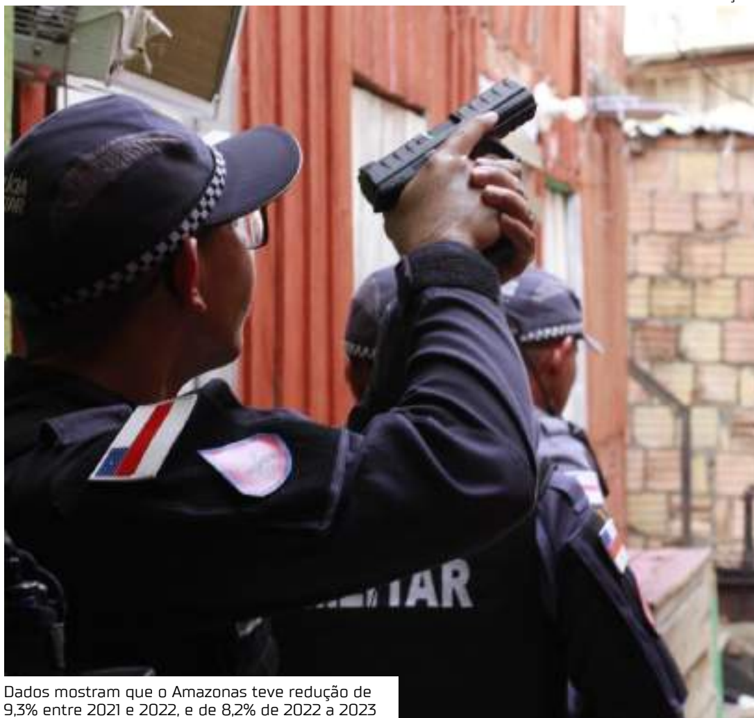
Dados mostram que o Amazonas teve redução de 9,3% entre 2021 e 2022, e de 8,2% de 2022 a 2023

Os dados mostram que o Amazonas teve redução de 9,3% entre 2021 e 2022, e de 8,2% de 2022 a 2023. No resultado geral, a redução das mortes violentas