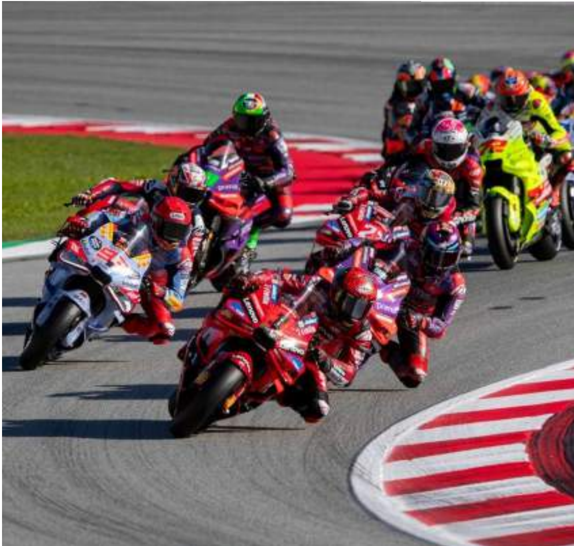
Última vez que a MotoGP foi realizada no Brasil foi em 2004, no extinto Autódromo de Jacarepaguá, no Rio de Janeiro