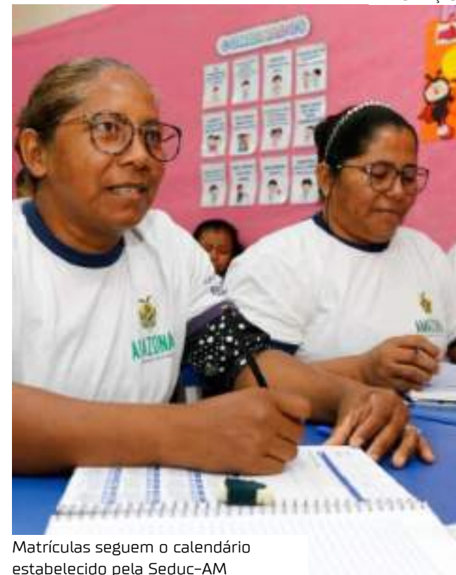
Matrículas seguem o calendário estabelecido pela Seduc-AM