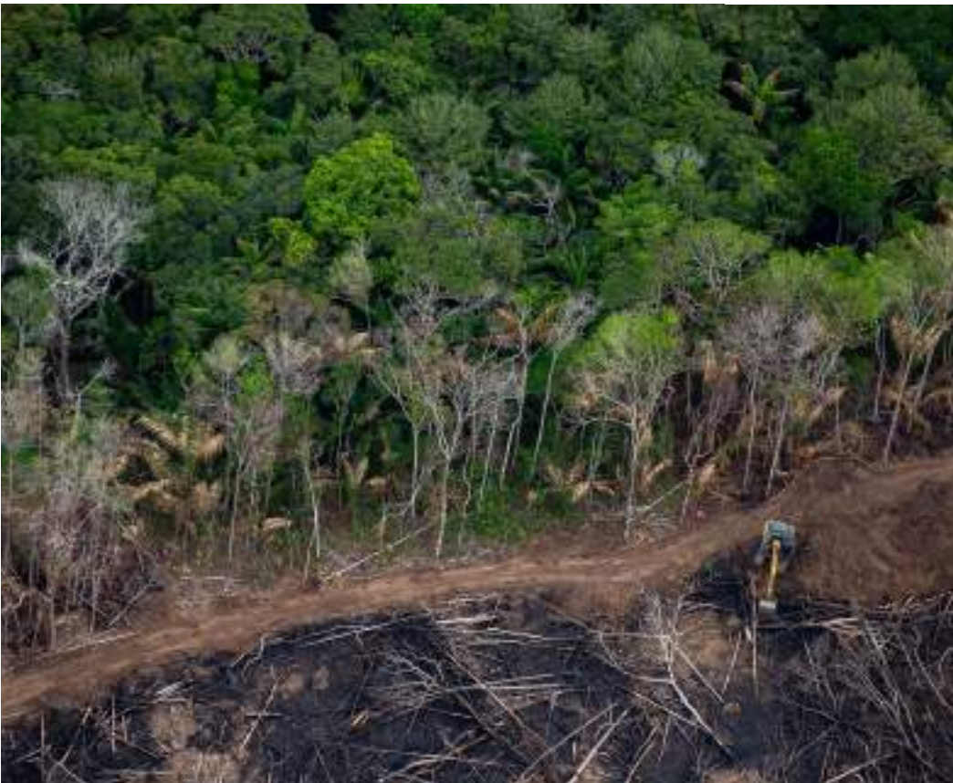
Pará, Amazonas e Mato Grosso possuem as maiores áreas sob risco de desmatamento