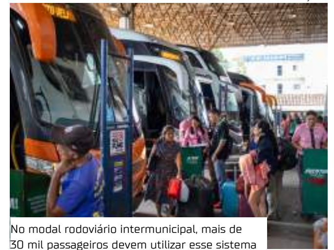
No modal rodoviário intermunicipal, mais de 30 mil passageiros devem utilizar esse sistema