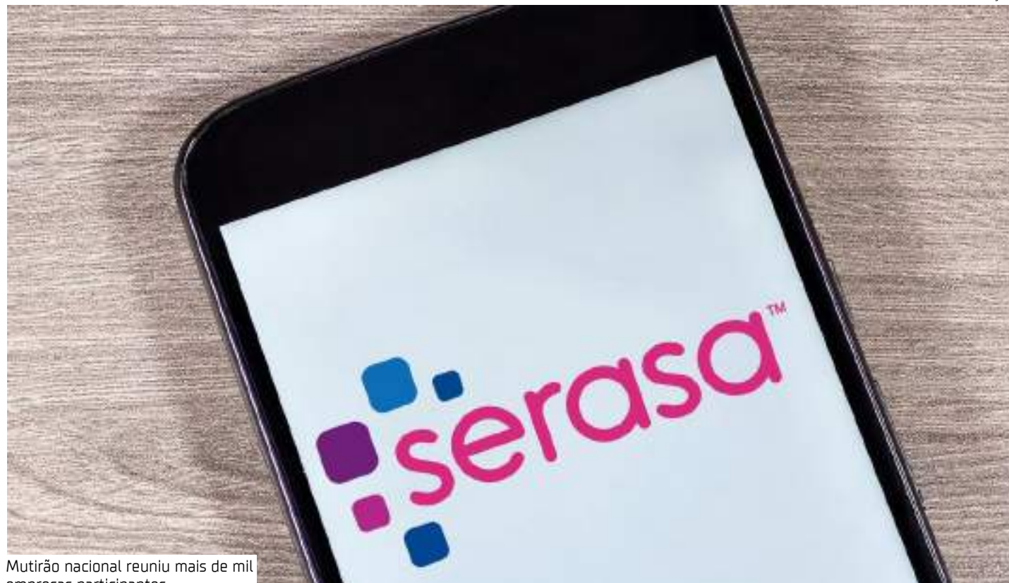
Mutirão nacional reuniu mais de mil empresas participantes

“Os resultados recordes do mutirão devem se refletir no Mapa de Inadimplência do Brasil, que deve