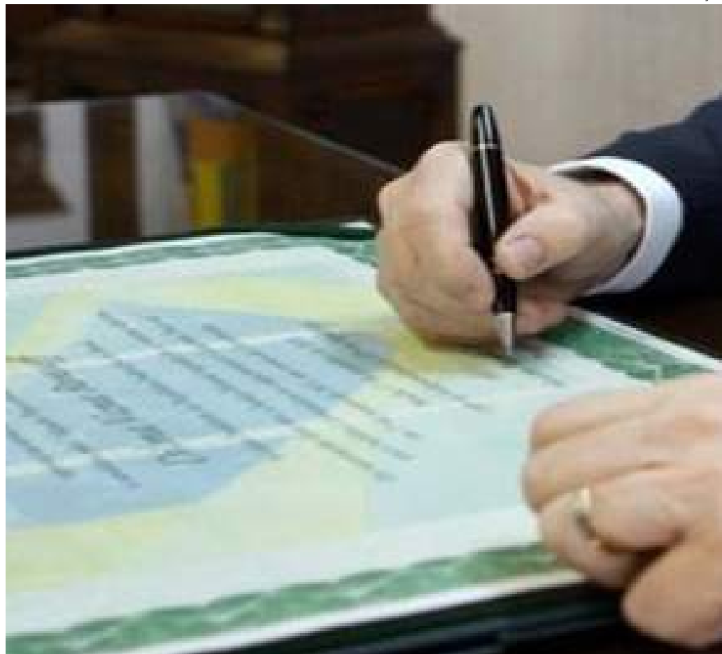
Este ato representa a etapa final do processo eleitoral