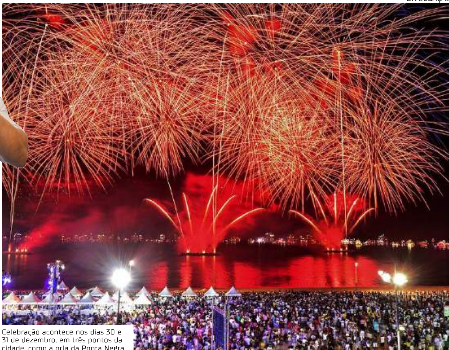
Celebração acontece nos dias 30 e 31 de dezembro, em três pontos da cidade, como a orla da Ponta Negra