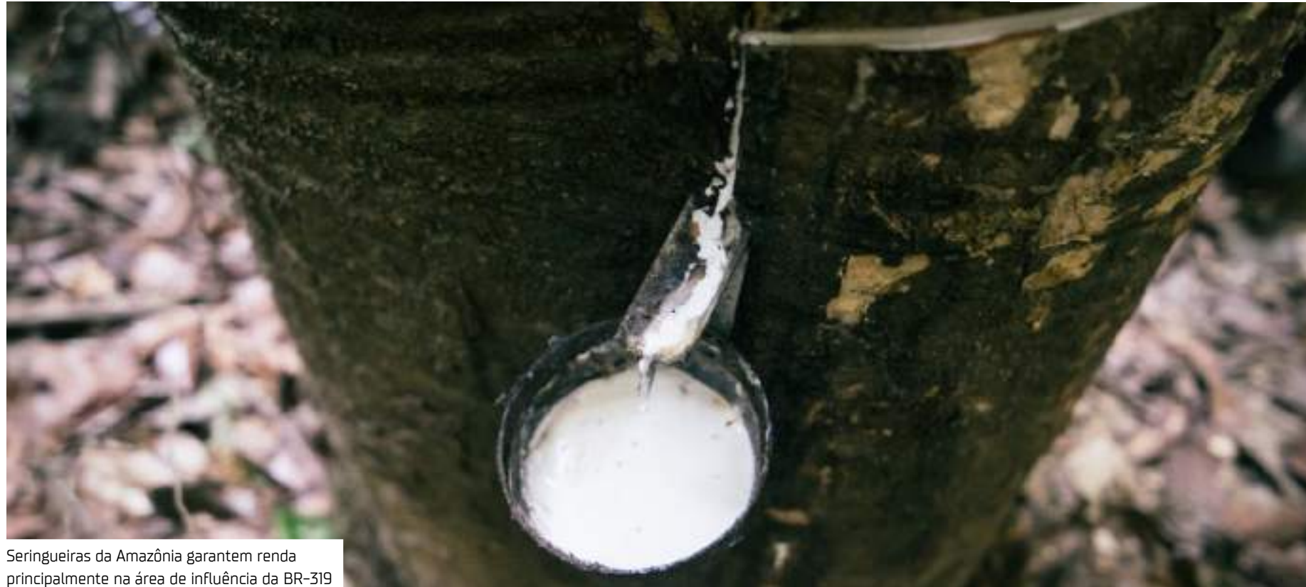
Seringueiras da Amazônia garantem renda principalmente na área de influência da BR-319

“Com a retomada da cadeia da borracha, começamos com sete famílias em 2021, que geraram 2.102kg. Em 2022, chegamos a 47 famílias com 19.624kg e, no ano passado, atingimos 69 famílias e mais de 29,2 toneladas de borracha. Neste ano, temos 101 famílias associadas atuando diretamente com a produção da borracha e a previsão é atingir mais de 40 toneladas. Esse projeto está mudando a nossa realidade e a vida de muitas pessoas. A família toda ajuda, com seringueiros e seringueiras, além de seus filhos retirando o látex. Tem família que vai apresentar uma tonelada de borracha na produção de 2024 e isso gera um bom dinheiro