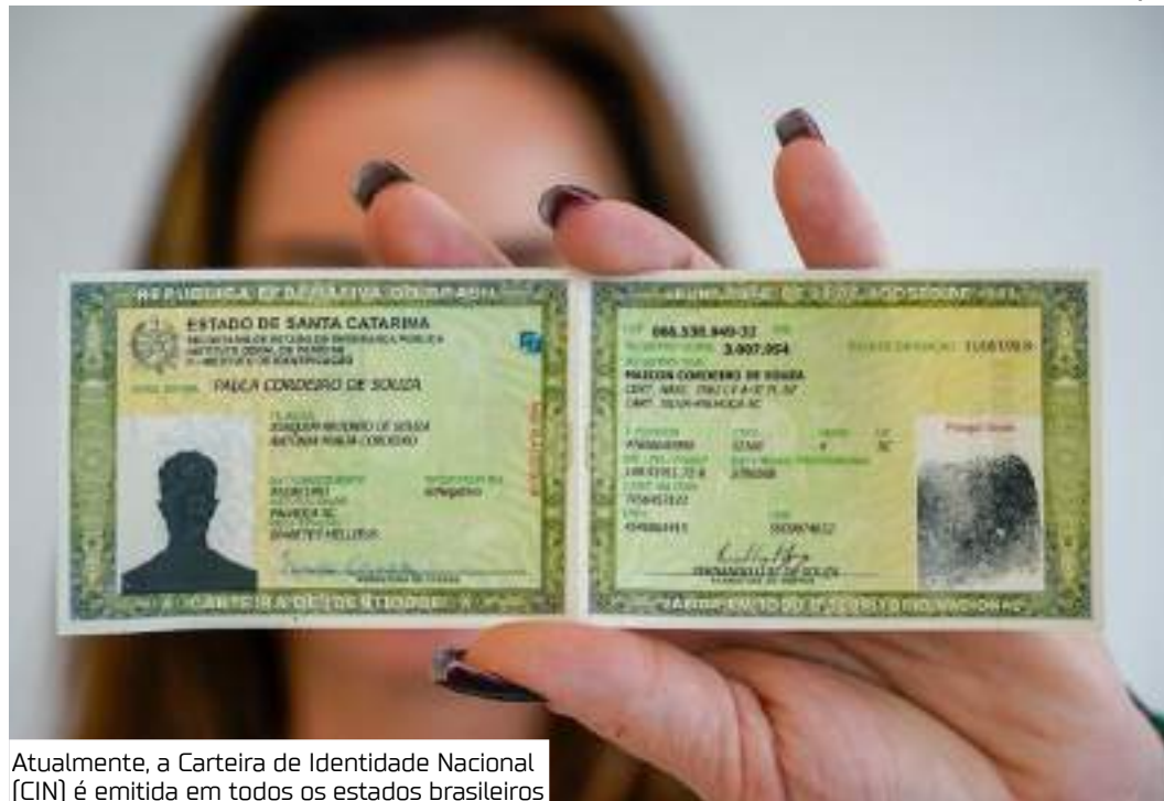
Atualmente, a Carteira de Identidade Nacional (CIN) é emitida em todos os estados brasileiros

A proposta é que o Gov.br passe a informar, por exemplo, sobre o Exame Nacional do Ensino Médio (Enem) ou sobre como tirar a carteira de motorista se quem estiver acessando for uma pessoa com 18 anos. Caso seja um idoso, a plataforma poderá informar sobre aposentadoria ou sobre a concessão de benefícios.