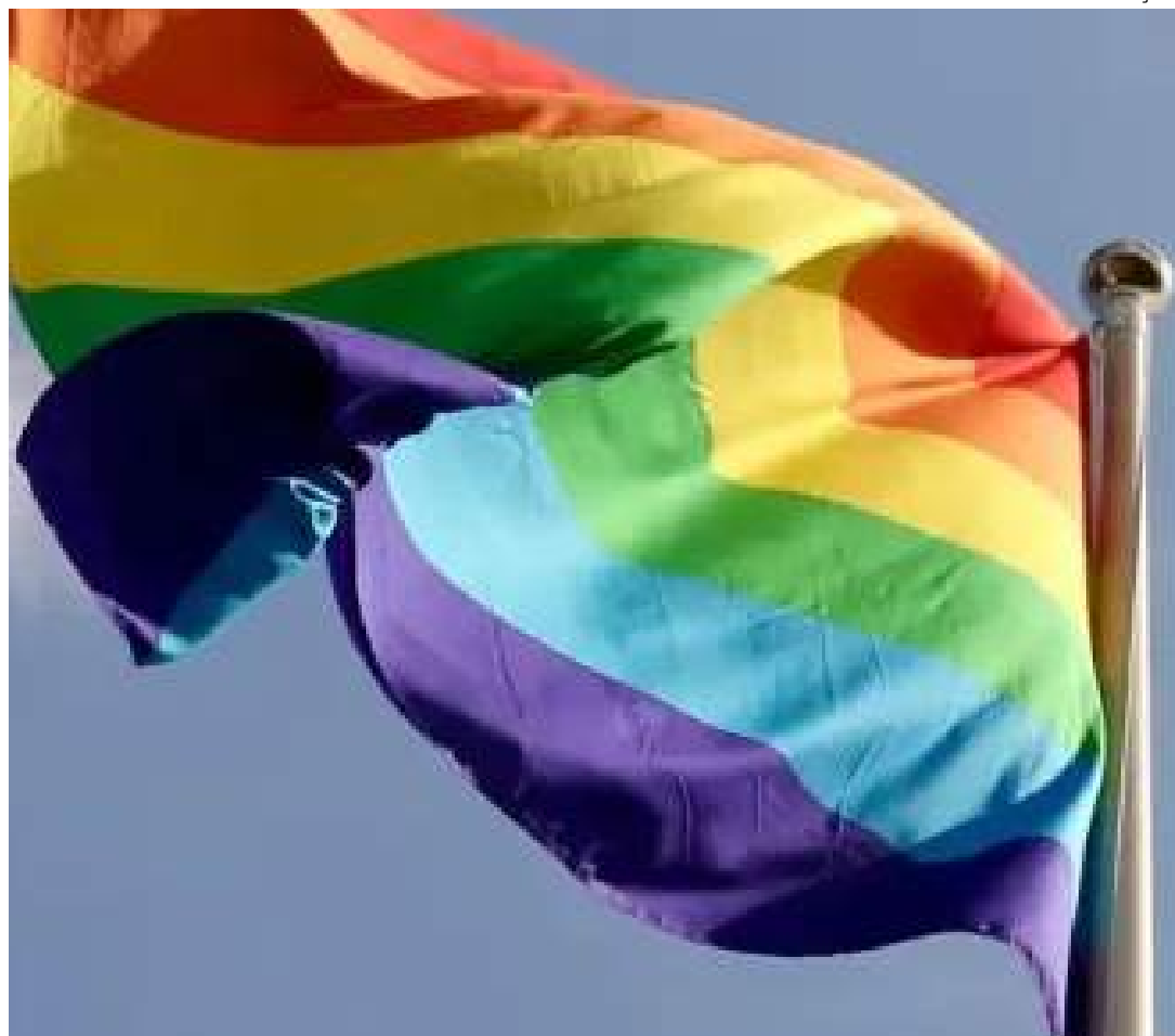
Dados levantados até outubro mostram um cenário positivo para comunidade LGBT

Em relação aos objetos mais comuns nas propostas que tinham como finalidade cercar algum direito, o que se sobressaiu, ao longo dos últimos anos, na Câmara foram os que queriam proibir linguagem neutra em documentos públicos, escolas e