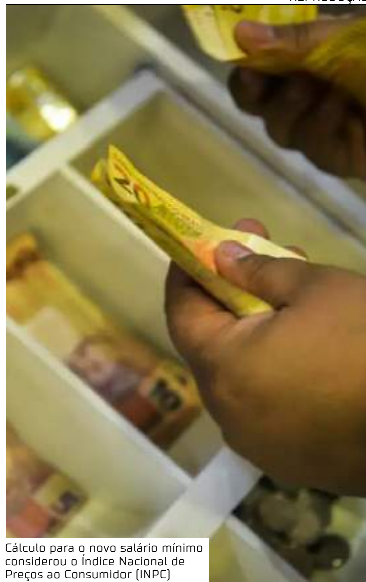
Cálculo para o novo salário mínimo considerou o Índice Nacional de Preços ao Consumidor (INPC)

O novo salário só começará a ser pago no fim de janeiro ou início de fevereiro, referente aos dias trabalhados em janeiro de 2025.