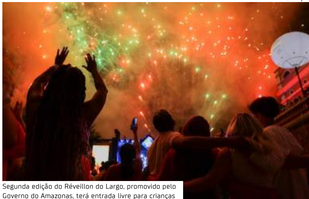
Segunda edição do Réveillon do Largo, promovido pelo Governo do Amazonas, terá entrada livre para crianças