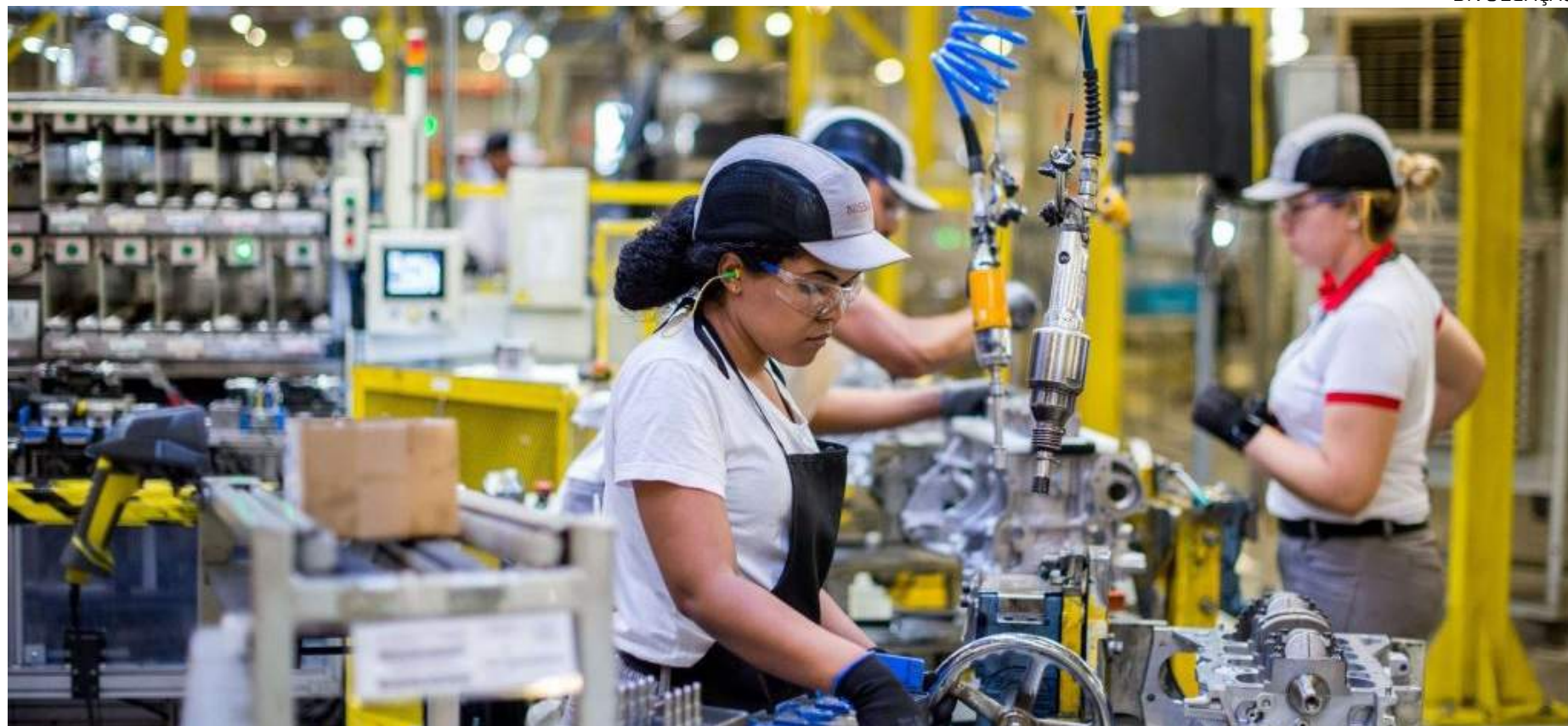
Economia amazonense é impulsionada principalmente pelos setores de serviços e indústria

O valor total do PIB para o período foi de R$ 40,3 bilhões, apresentando um crescimento nominal de 5,9% em comparação ao mesmo trimestre do ano anterior. Os dados foram divulgados pela Secretaria de Estado de Desenvolvimento