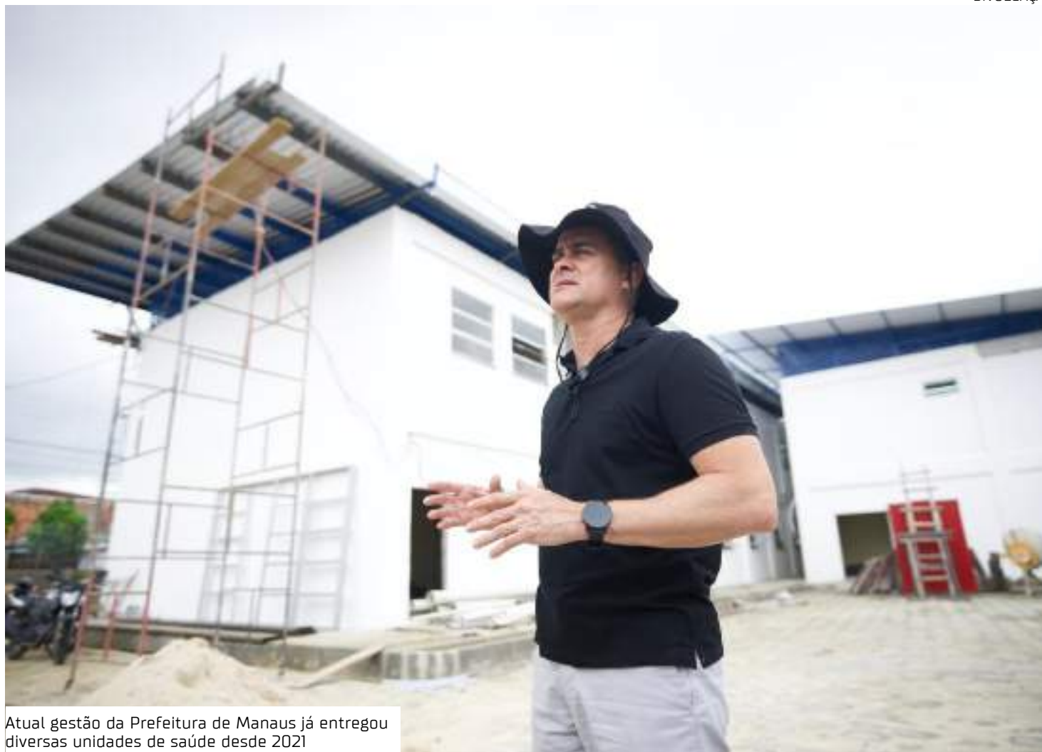
Atual gestão da Prefeitura de Manaus já entregou diversas unidades de saúde desde 2021

"Cultura, lazer, esporte e mobilidade urbana também são pautas cruciais e impres-