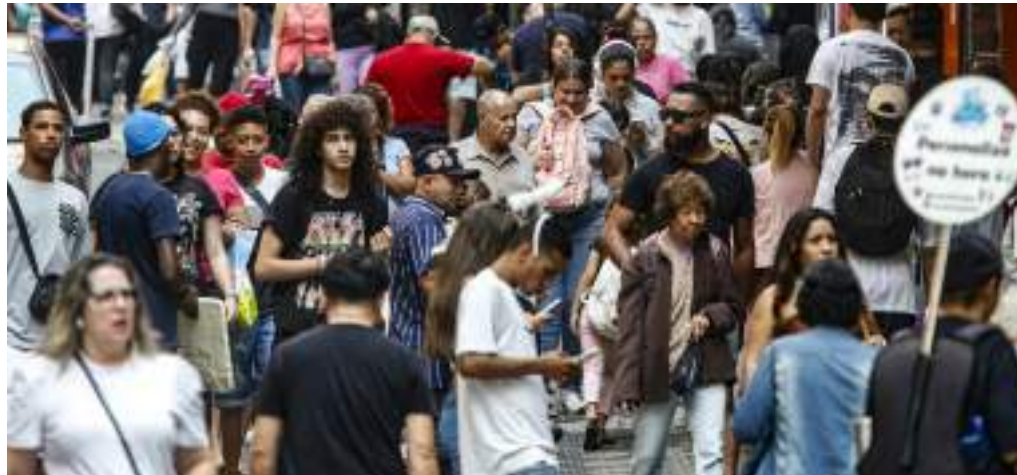
Ao menos 73,10 milhões de pessoas devem terminar o ano endividadas

Liliam ressaltou que muitas vezes as dívidas chegam ao limite deixando a pessoa sem opção. Nesse caso, é preciso