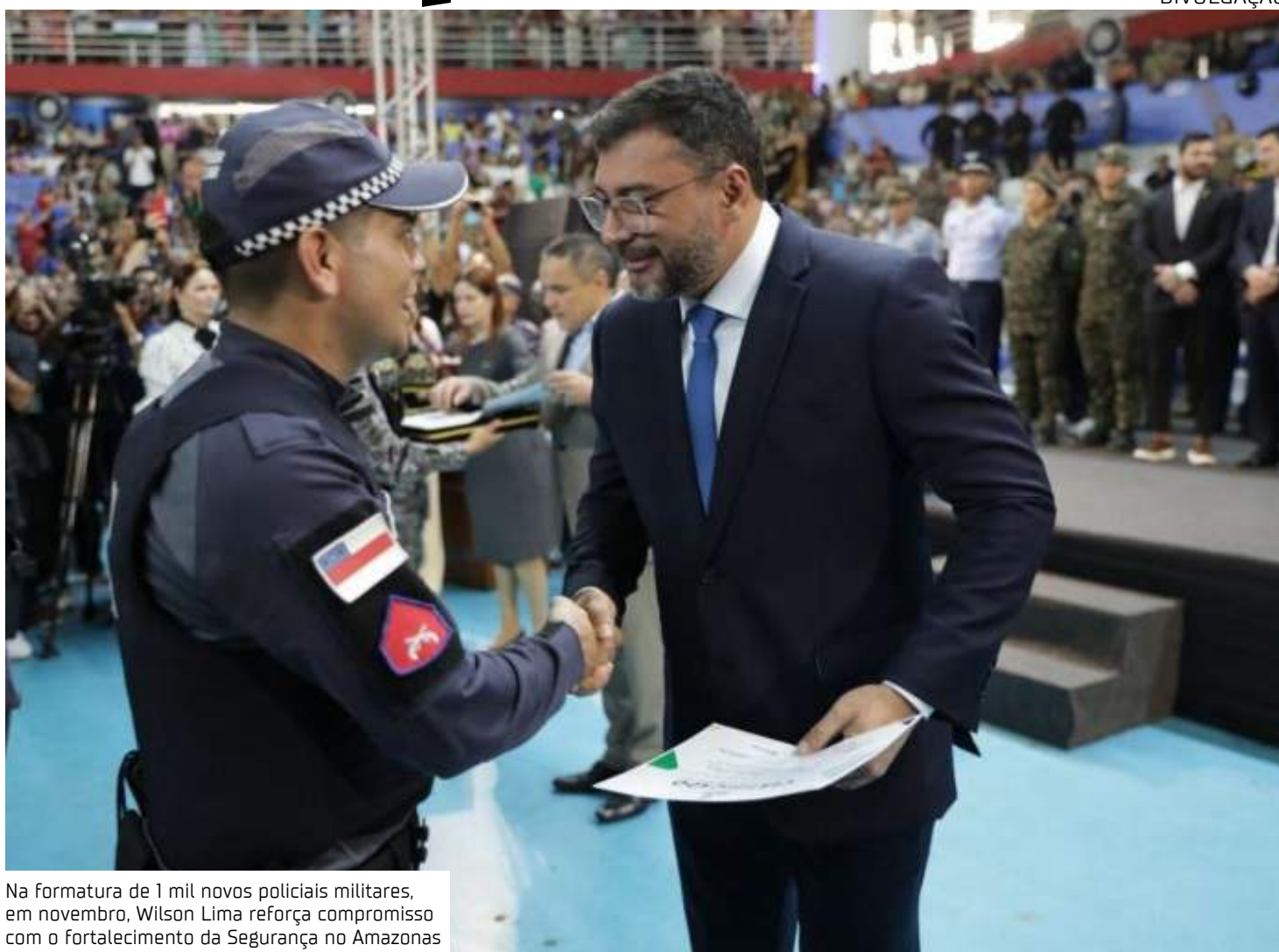
Na formatura de 1 mil novos policiais militares, em novembro, Wilson Lima reforça compromisso com o fortalecimento da Segurança no Amazonas

Entre as ações prioritárias, Wilson Lima destacou o projeto Governo Presente, que atendeu quase 100 mil pessoas em 2024 e terá continuidade em 2025. As ações incluem a emissão de