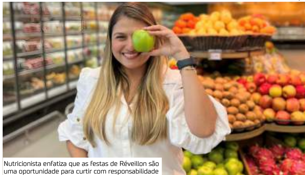
Nutricionista enfatiza que as festas de Réveillon são uma oportunidade para curtir com responsabilidade