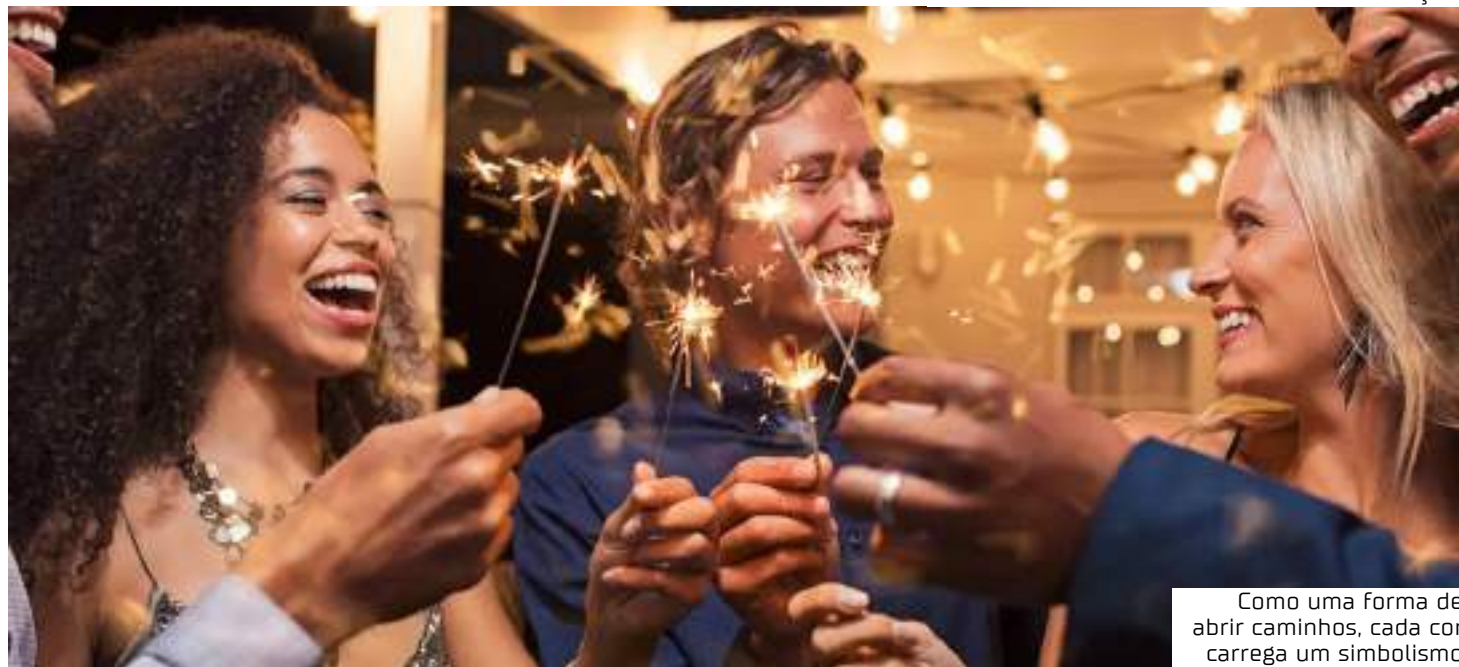
Como uma forma de abrir caminhos, cada cor carrega um simbolismo