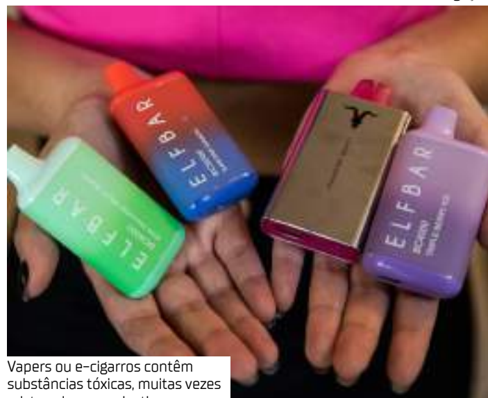
Vapers ou e-cigarros contêm substâncias tóxicas, muitas vezes misturadas com nicotina

Com o objetivo de combater o uso de cigarros eletrônicos no Amazonas, o Governo do Estado sancionou a Lei nº 7.252, de autoria da deputada estadual Mayra Dias (Avante). A legislação estabelece diretrizes de conscientização e combate aos malefícios dos Dispositivos Eletrônicos para Fumar (DEF) em instituições de ensino públicas e privadas amazonenses, priorizando a saúde dos jovens e a proteção contra os riscos associados ao consumo desses dispositivos.