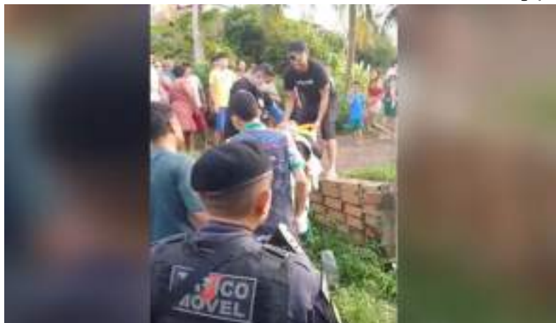
Adolescente, de 17 anos, estava sendo torturado por criminosos

Um adolescente, de 17 anos, foi resgatado pela Polícia Militar na tarde de terça-feira (7), após ter sido vítima de tortura e tentativa de homicídio em Manacapuru, interior do Amazonas.