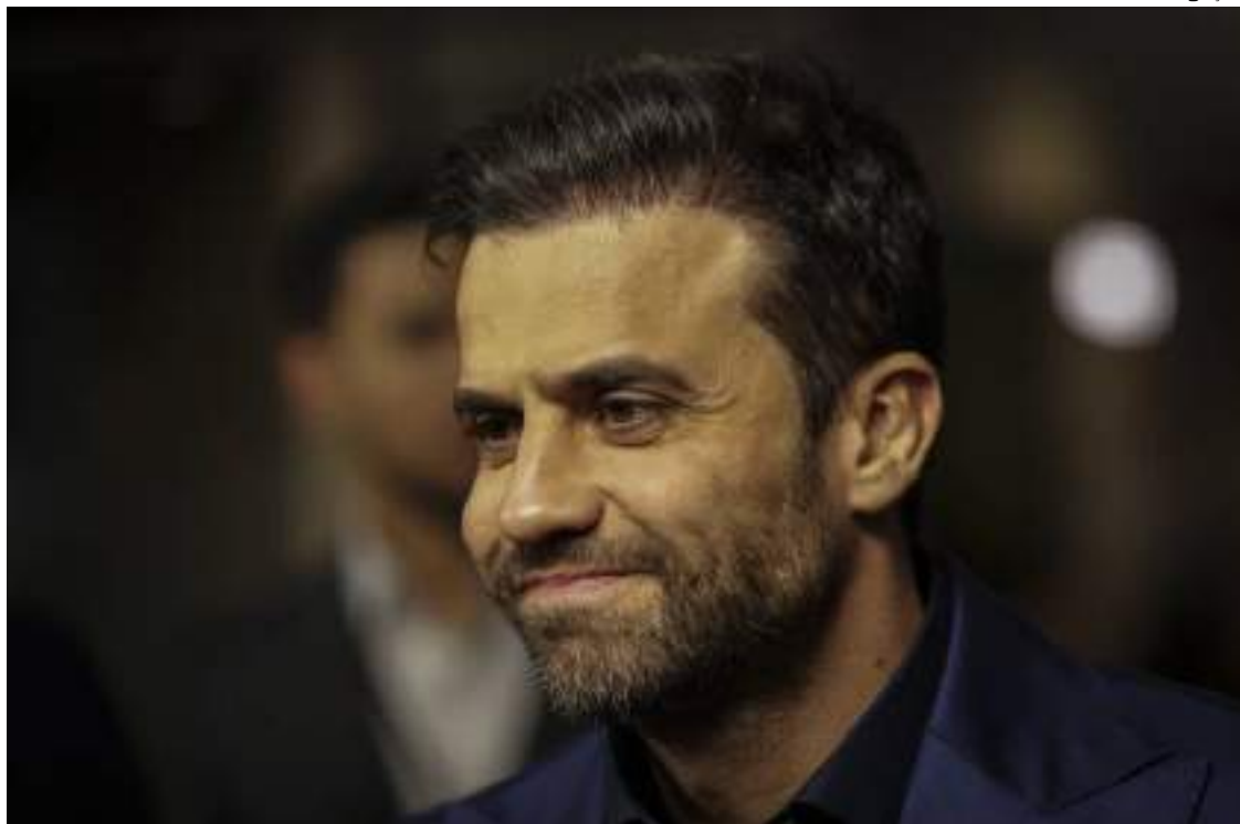
Pablo Marçal (PRTB) anunciou que pretende disputar a Presidência em 2026

A divulgação pelo influenciador de laudo falso contra Boulos, na tentativa de associá-lo ao uso de drogas às vésperas do primeiro turno, não é objeto de nenhuma ação de investigação judicial elei-