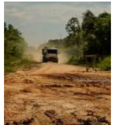
Medida do órgão será válida entre dezembro e junho, anualmente

A depender da gravidade, o descumprimento também pode ser caracterizado como crime de dano ao patrimônio da União.