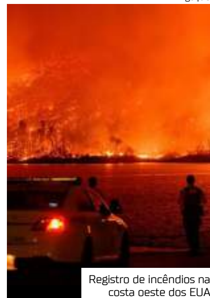
Registro de incêndios na costa oeste dos EUA

"Olhamos e o fogo tinha saltado de um lado da estrada para o outro. As pessoas saíam dos carros com os seus cães, bebês e sacos. Elas choravam e gritavam", afirmou Trainor.