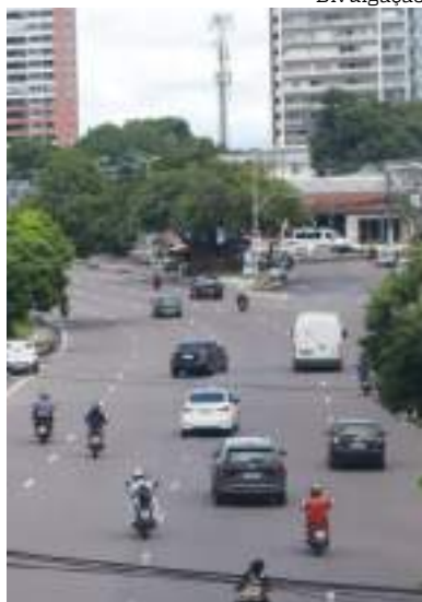
Desconto do Bom Condutor incentiva a direção responsável

A Secretaria de Estado da Fazenda (Sefaz-AM) disponibilizou, na quarta-feira (8), o serviço de solicitação do desconto legal do IPVA para Bom Condutor em 2025. O desconto é um instrumento de redução tributária que incentiva a direção responsável, concedendo um abatimento de até 20% no pagamento do tributo para proprietários de veículos sem multas em sua CNH no período de um a três anos anteriores.