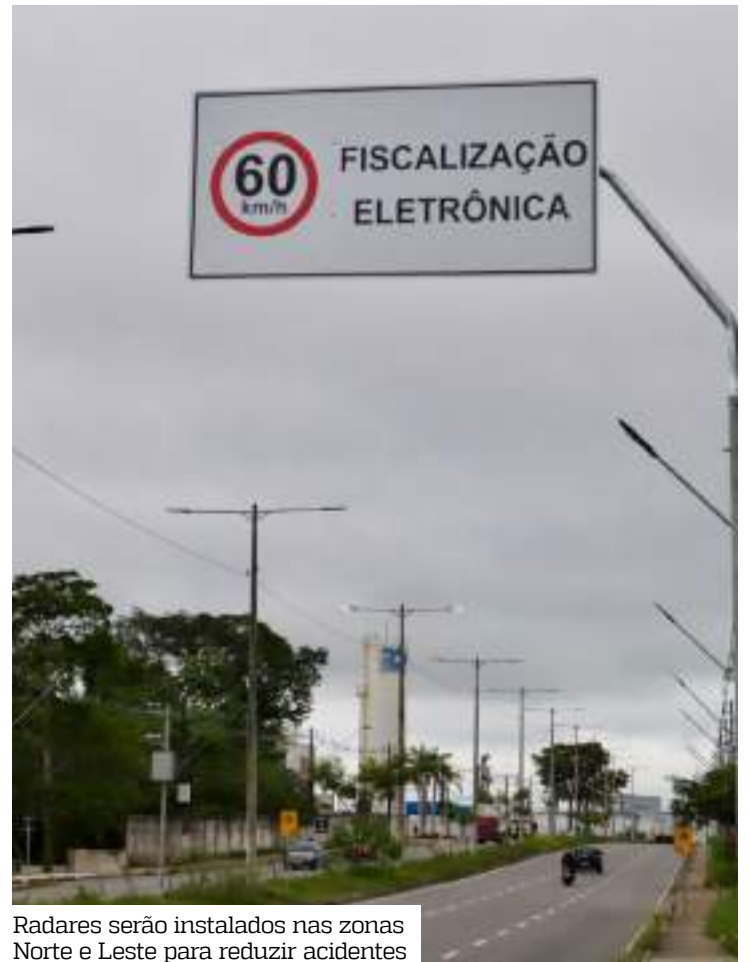
Radares serão instalados nas zonas Norte e Leste para reduzir acidentes

Avenida do Turismo, nº 12.568, oposto à empresa Vida Film – sentido oeste.