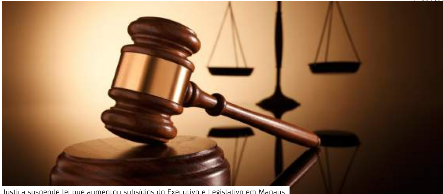
Justiça suspende lei que aumentou subsídios do Executivo e Legislativo em Manaus

Decisão da 2. a Vara da Fazenda Pública da Comarca de Manaus suspendeu o aumento do subsídio concedido a vereadores, prefeito, vice-prefeito e secretários e subsecretários de Manaus, previsto na Lei Municipal nº 587, de 11/12/2024, fixando o prazo de cinco dias para cumprimento, sob pena de multa diária no valor de R$ 5 mil, no limite de até 20 dias/multa.