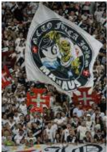
Jogo será no dia 23 de janeiro

A venda de ingressos para Vasco e Madureira, que acontece em Manaus no dia 23 de janeiro, às 20h30 (horário de Manaus) abriu de forma online, nesta quarta-feira (8). O jogo na Arena da Amazônia será válido pela quarta rodada do Campeonato Carioca e os valores da entrada partem de R$ 129 e vão até R$ 458 - com taxa do site já inclusa.