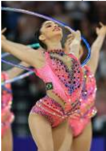
Brasil é sempre favorito na ginástica

O primeiro ano do ciclo olímpico promete ser recheado de Campeonatos Mundiais, oferecendo oportunidade para atletas brasileiros conquistarem espaço e experiência no caminho até Los Angeles 2028.