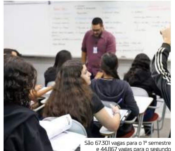
São 67.301 vagas para o 1º semestre e 44.867 vagas para o segundo

A nova modalidade permite financiamento de até 100% dos encargos educacionais, além de reservar cotas para pretos, pardos, indígenas, quilombolas e pessoas com deficiência. No primeiro semestre de 2024, 39.419 estudantes migraram do Fies para o Fies Social.