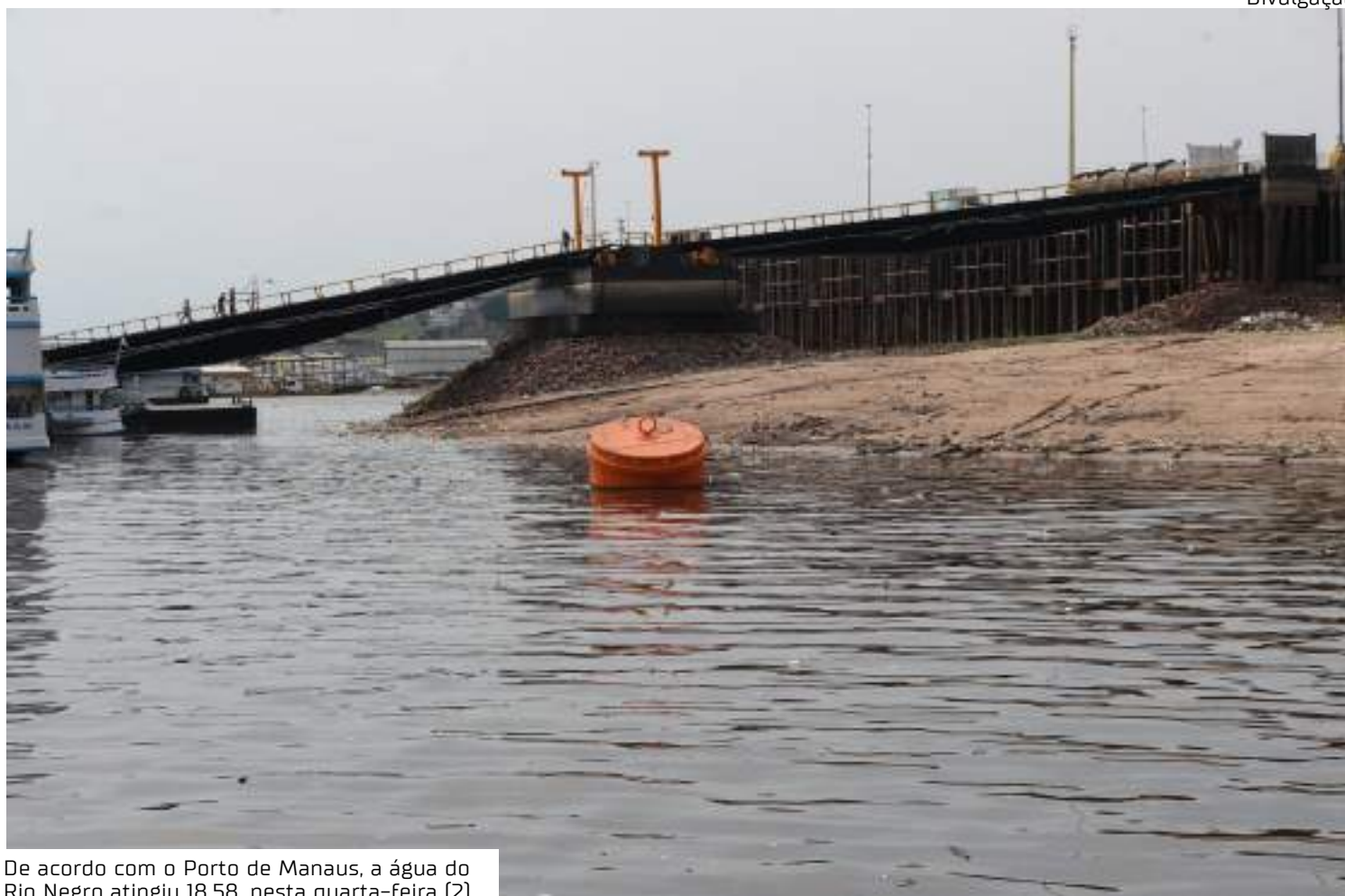
De acordo com o Porto de Manaus, a água do Rio Negro atingiu 18,58, nesta quarta-feira (2)

Com o início da estação chuvosa em grande parte do Amazonas, o Serviço Geológico do Brasil (SGB) apontou que a recuperação das águas ganhou mais força devido ao forte índice de chuvas registradas em outras bacias influentes no Rio Negro. De acordo com o Porto de Manaus, a água do Negro atingiu 18,58, nesta