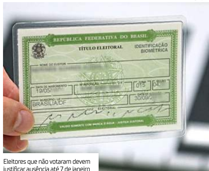
Eleitores que não votaram devem justificar ausência até 7 de janeiro

O prazo para que o eleitor que não votou no segundo turno das eleições municipais de 2024 justifique a ausência terminará na próxima terça-feira (7). O segundo turno do pleito ocorreu em 27 de outubro, em 51 municípios do país, sendo 15 capitais.