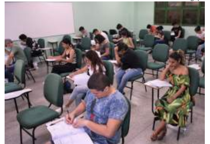
Aulas do cursinho da UEA serão presenciais e estão previstas para 1/2

Podem inscrever-se estudantes do 1º, 2º e 3º anos do ensino médio ou portadores de certificado de conclusão do segundo grau, para as redes pública ou particular. As aulas serão presenciais, estão previstas para começar dia 1º de fevereiro de 2025 e acontecerão até data próxima à realização do concurso Vestibular UEA, ingresso 2026.