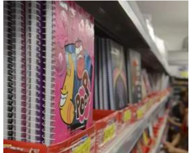
Compras impactam o orçamento de 85% das famílias brasileiras

Esses valores impactam os orçamentos de 85% das famílias com filhos em idade escolar. O impacto é maior para as famílias de classe C, em que