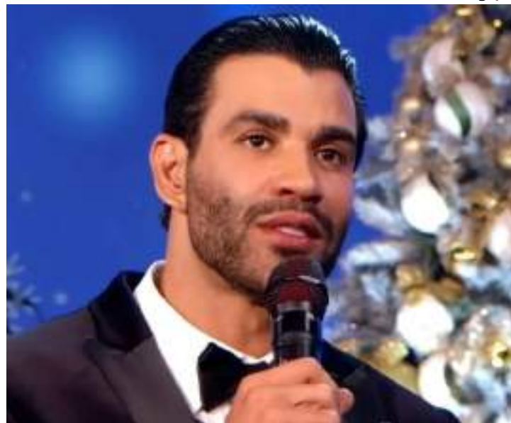
Cantor se colocou à disposição para concorrer ao cargo de presidente

O cantor chegou a ter seu nome incluído como um dos alvos da Operação Integração, deflagrada em 4 de setembro de 2024 pela Polícia