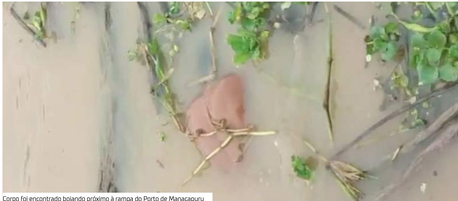
Corpo foi encontrado boiando próximo à rampa do Porto de Manacapuru

O corpo de um homem foi encontrado boiando próximo à rampa do Porto de Manacapuru, no bairro Correnteza, na quinta-feira (2). A cidade fica a 68 quilômetros a oeste de Manaus.