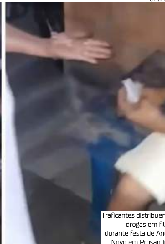
Traficantes distribuem drogas em fila durante festa de Ano Novo em Prosamin