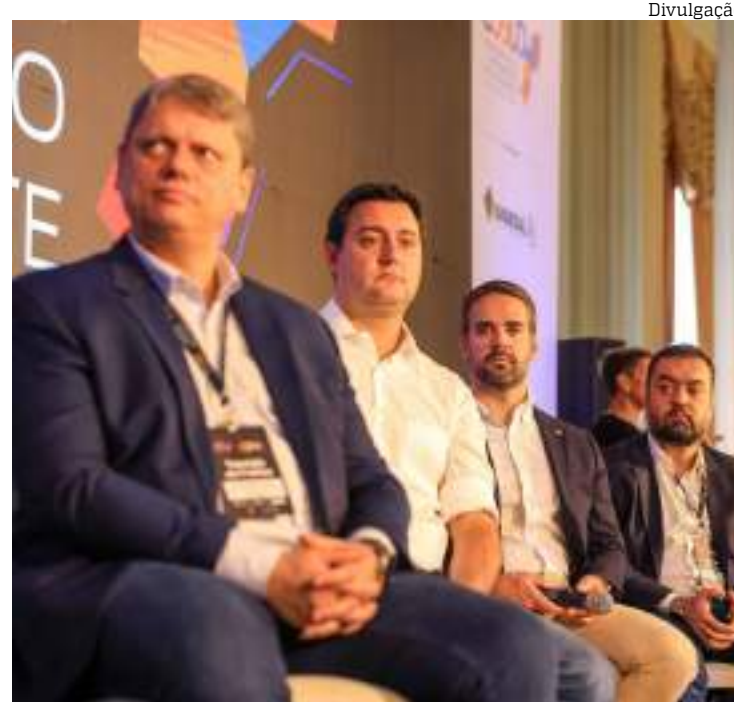
Tarcísio, Ratinho Jr., Eduardo Leite, Claudio Castro e Zema em encontro

“Eu serei candidato a presidente da República. Não tem condicionante para a minha