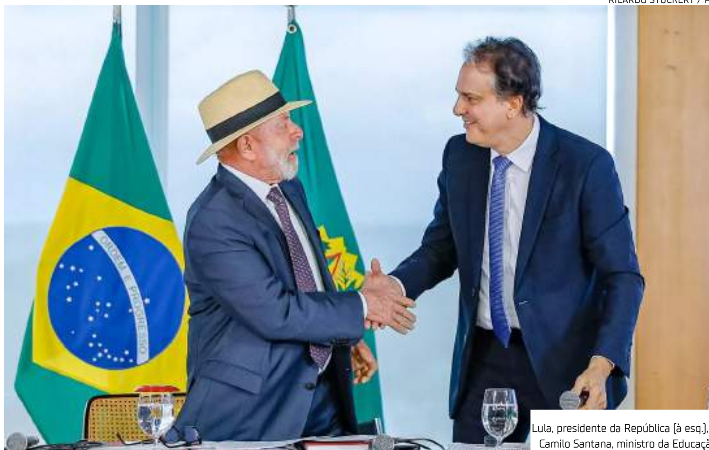
Lula, presidente da República (à esq.), e Camilo Santana, ministro da Educação

Pé-de-meia Licenciatura O governo federal vai pagar R$ 1.050 reais por mês para estudantes de licenciatura. O valor será dividido em uma parcela de R$ 700