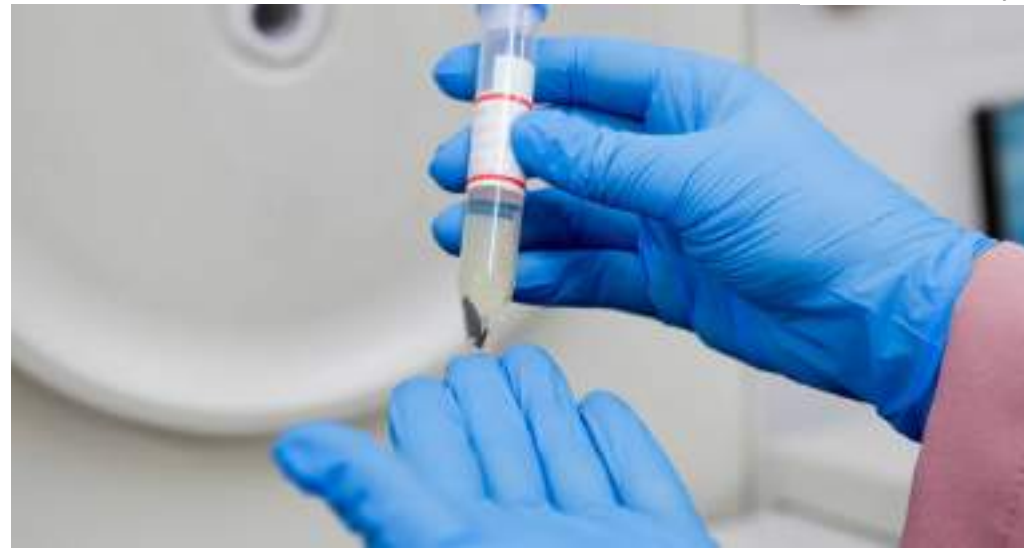
Estudo verificou a presença de bactérias em carnes de animais silvestres

O objetivo do estudo foi quantificar o número de animais silvestres mortos para alimentar a população no Médio Solimões e alertar sobre os riscos que esse consumo pode acarretar. Foram coletadas amostras de tecido muscular de 2 centímetros