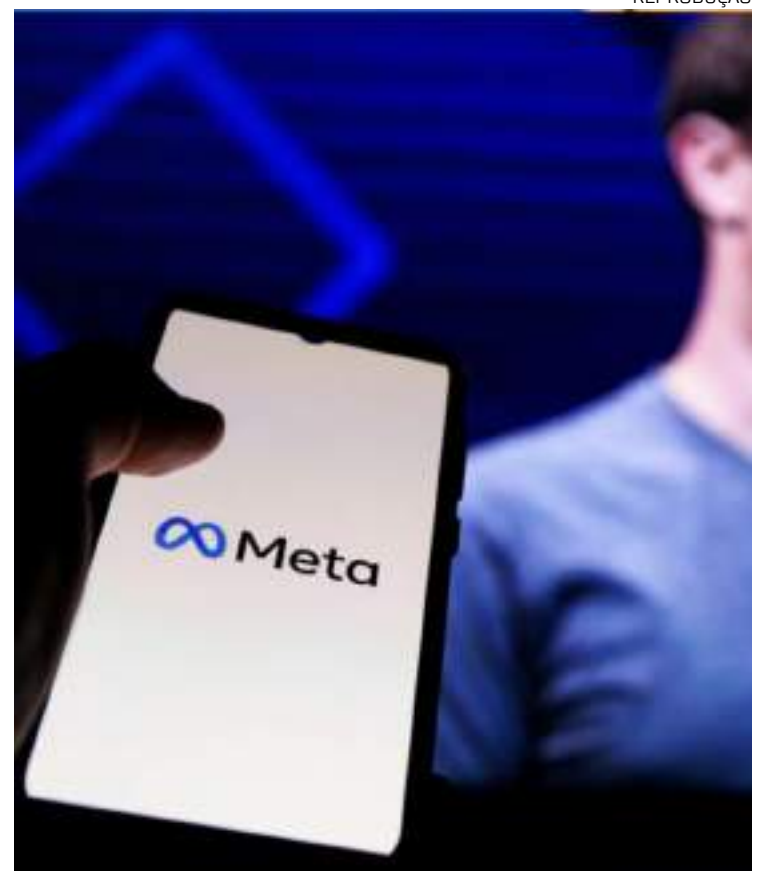
Companhia defende permitir ofensas em nome da liberdade de expressão

Na semana passada, a Meta anunciou uma série de mudanças e o alinhamento da política da empresa à agenda de governo do presidente eleito dos Estados Unidos, Donald Trump, que defende a desregulamentação do ambiente digital e é contrário à política de checagem de fatos. Em seguida, a Meta liberou a possibilidade de ofensas preconceituosas nas plataformas.