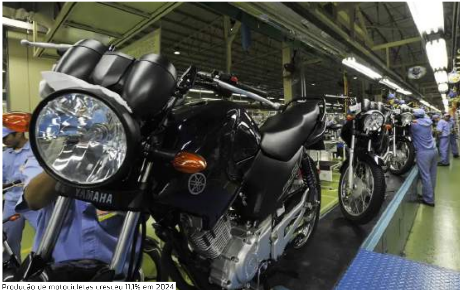
Produção de motocicletas cresceu 11,1% em 2024

O balanço da Abraciclo também registrou um bom desempenho no varejo em 2024, com vendas totalizando 1.876.427 unidades, um aumento de 18,6%