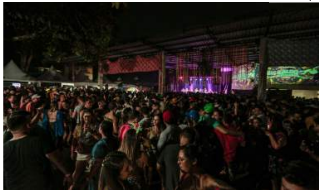
Bloco acontece no dia 15 de fevereiro, a partir das 17h, na Arena da Amazônia