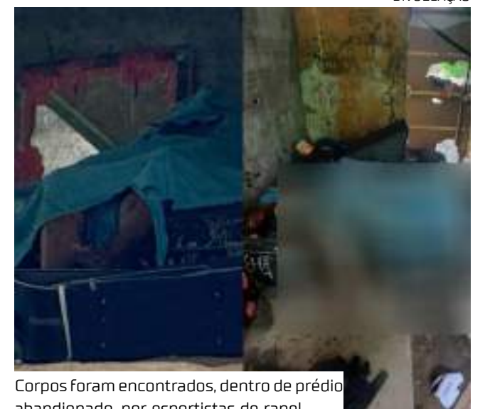
Corpos foram encontrados, dentro de prédio abandonado, por esportistas de rapel

Até o fechamento desta edição, nenhum dos envolvidos no assassinato foi localizado ou preso.