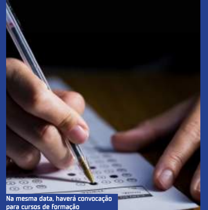
Na mesma data, haverá convocação para cursos de formação