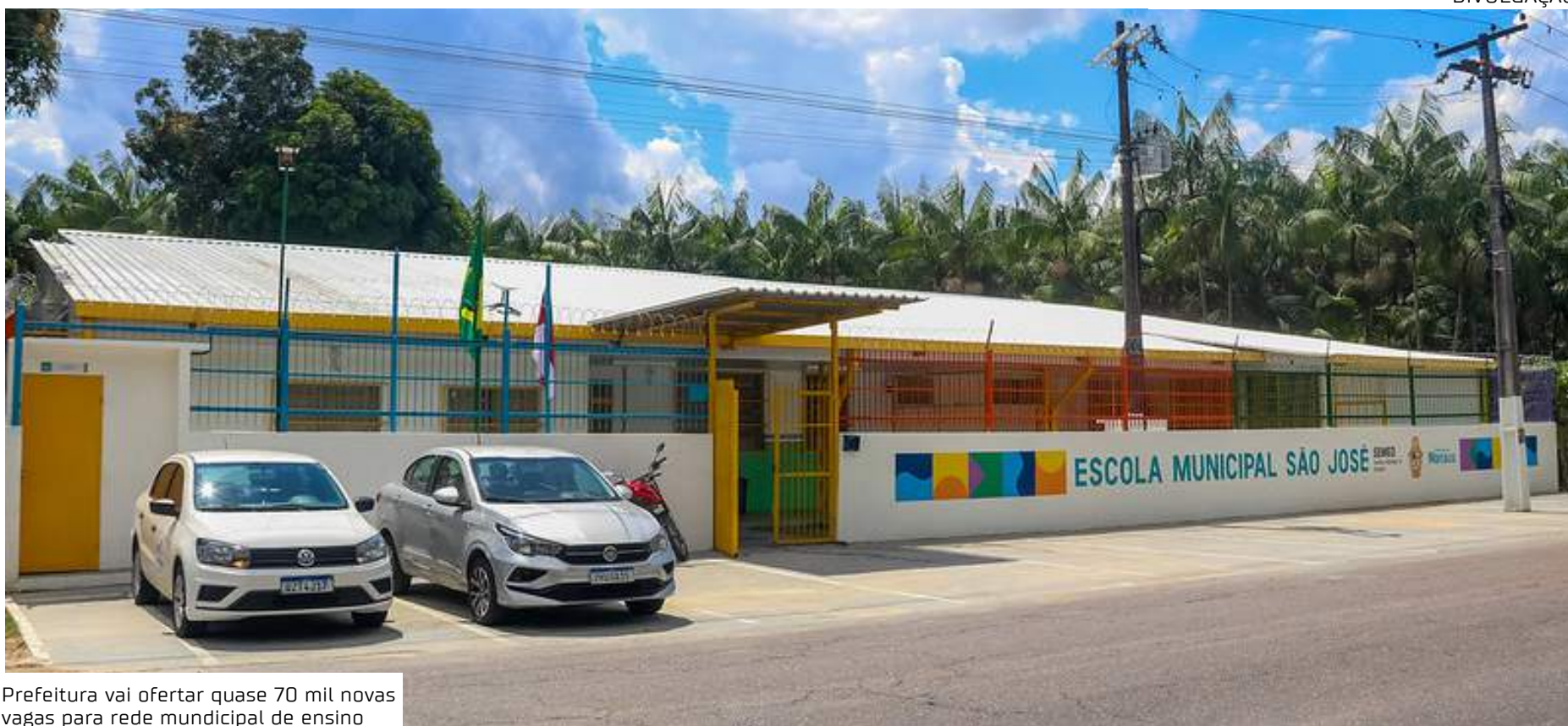
Prefeitura vai ofertar quase 70 mil novas vagas para rede municipal de ensino