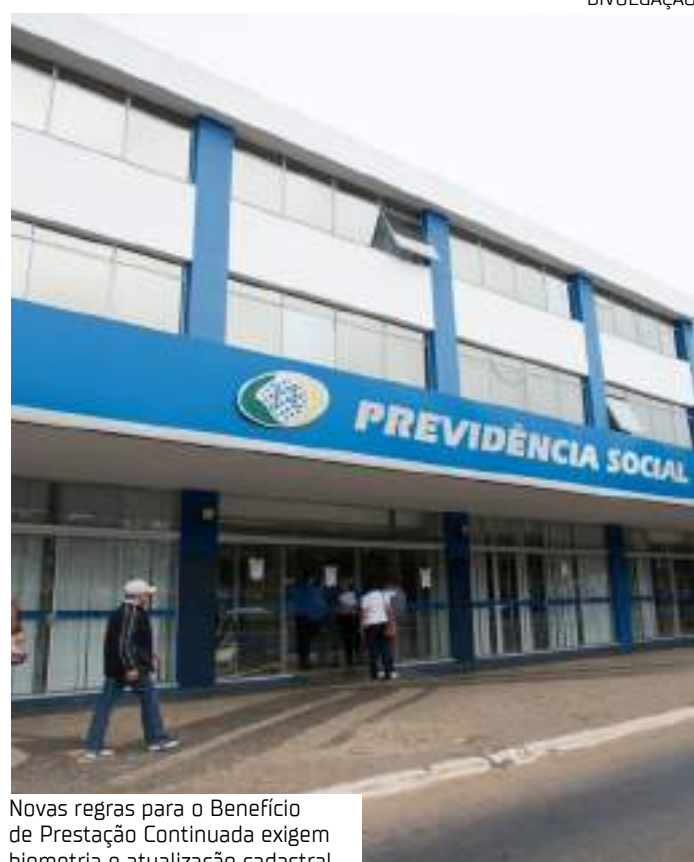
Novas regras para o Benefício de Prestação Continuada exigem biometria e atualização cadastral

"Em regra geral, o processo administrativo dura entre 3 a 6 meses. No entanto, em 2024, tivemos greve e com essas atualizações em relação ao pente-fino, muitas