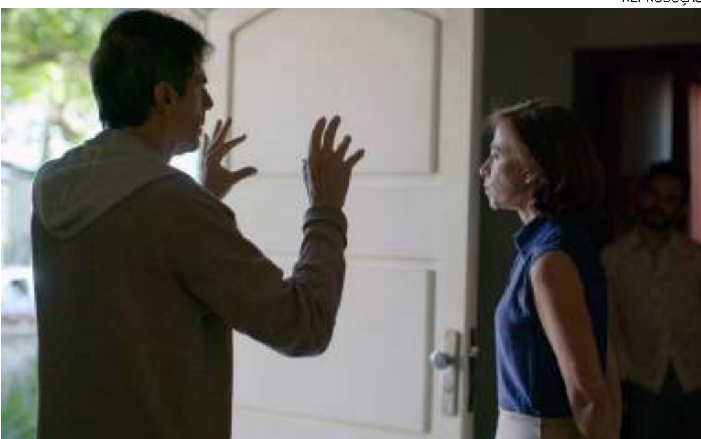
Diretor Walter Salles e a atriz Fernanda Torres durante gravações do longa