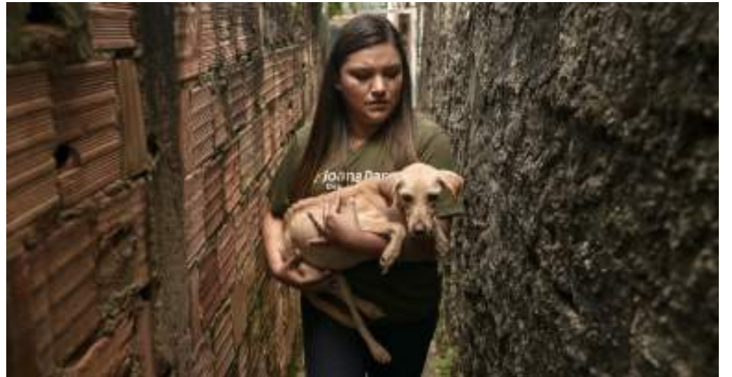
Deputada estadual Joana Darc é autora do projeto na Assembleia Legislativa do Amazonas

"As penalidades mais rigorosas contribuem para a conscientização da sociedade sobre a gravidade dos maus-tratos aos animais. Isso é um crime que precisa ser combatido de todas as maneiras, e sabemos que fazer doer no bolso do indivíduo