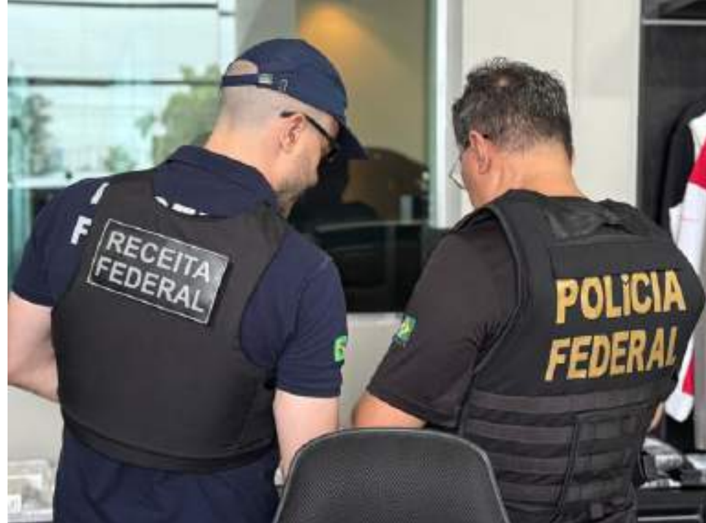
Policiais federais realizaram Operação Creditum no Amazonas e Rio de Janeiro

A apuração da Polícia Federal revelou que os investigados obtinham, por meio de fraudes, financiamentos de veículos de luxo com descontos oriundos de beneficiários fiscais. Esses veículos eram