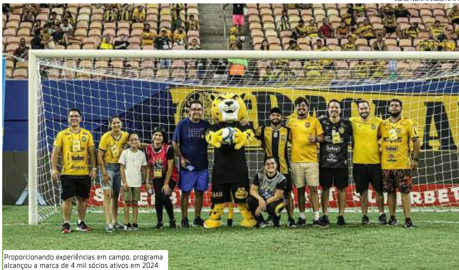
Proporcionando experiências em campo, programa alcançou a marca de 4 mil sócios ativos em 2024