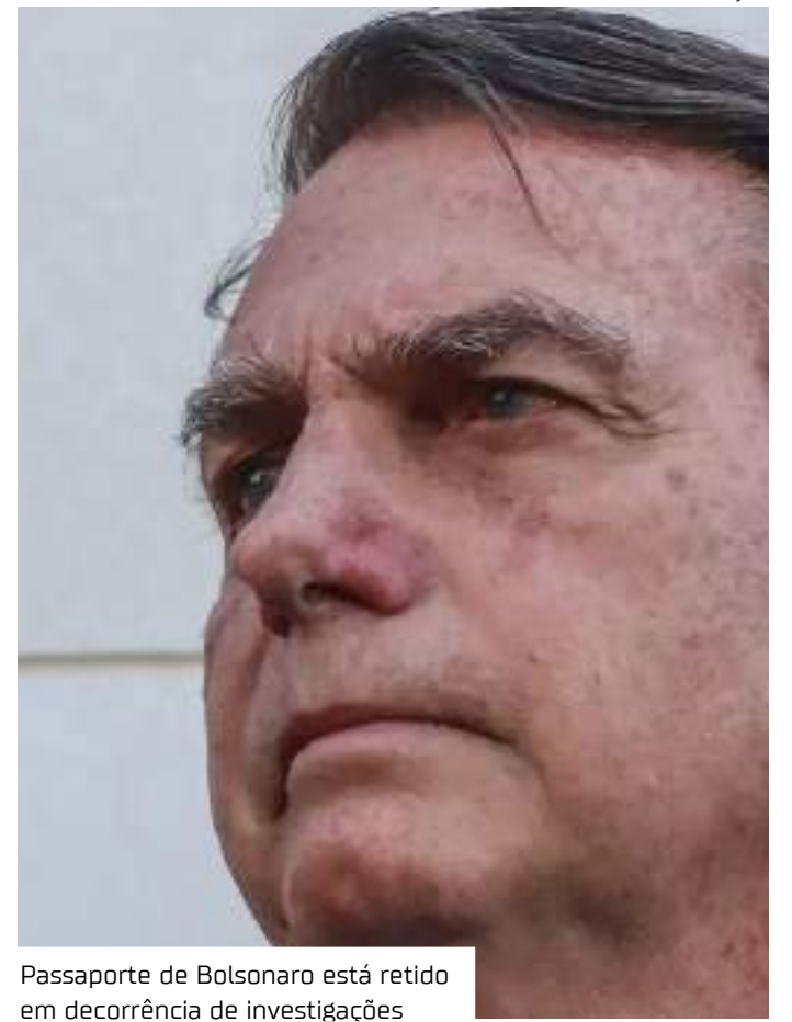
Passaporte de Bolsonaro está retido em decorrência de investigações

O passaporte de Bolsonaro está retido em decorrência das investigações das quais ele é alvo, incluindo a que trata da suspeita de envolvimento numa trama de golpe de Estado em 2022.