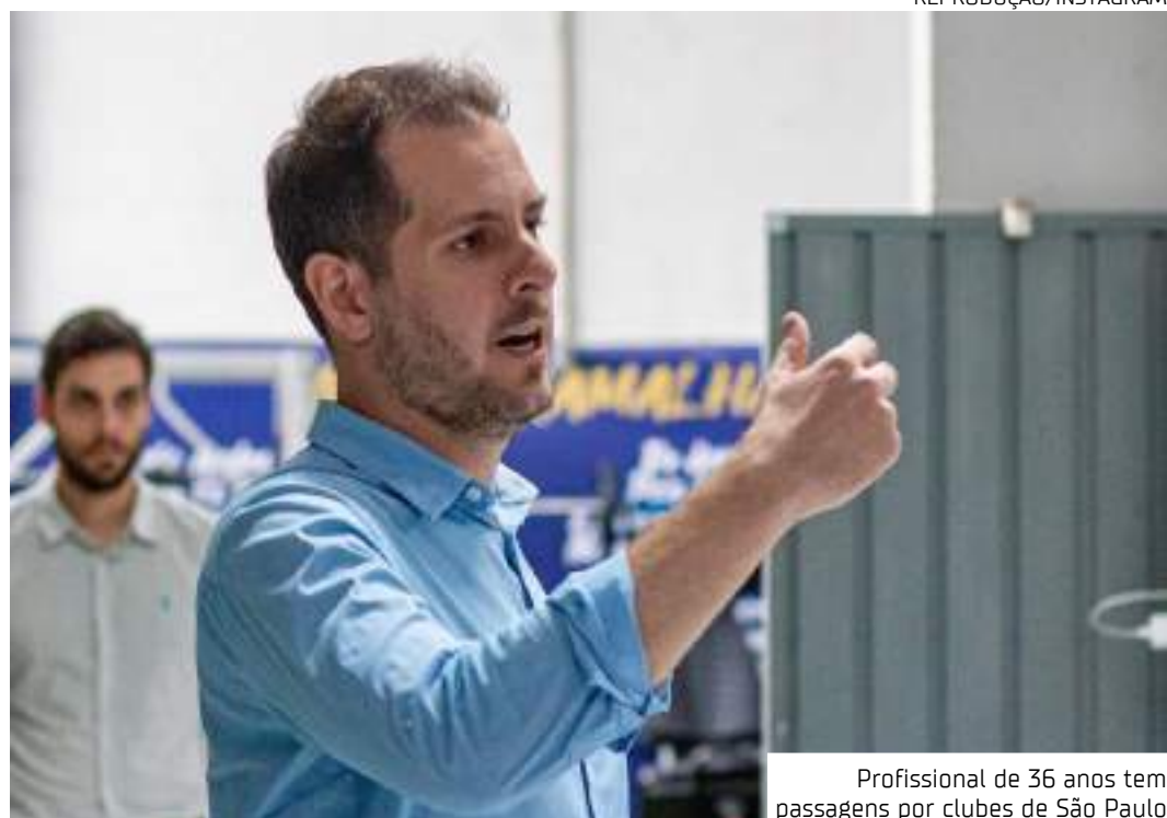
Profissional de 36 anos tem passagens por clubes de São Paulo

Além de ser diretor da ABEX, o executivo possui os cursos de Gestão de Futebol, Programa de Formação de Executivos de Futebol e Análise de Mercado da CBF Academy.