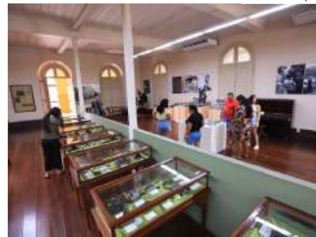
Monumento histórico oferece visitas guiadas ao espaço