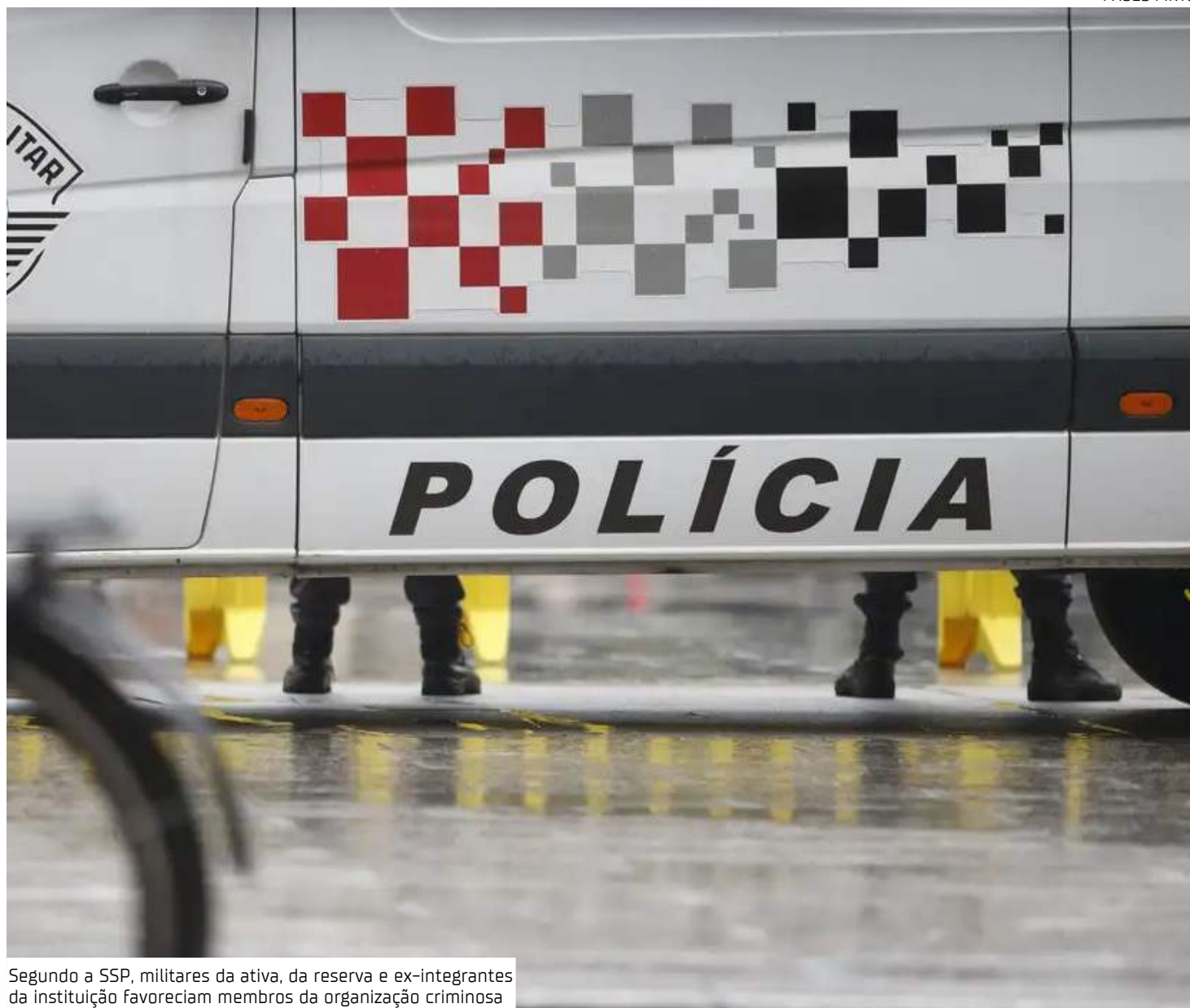
Segundo a SSP, militares da ativa, da reserva e ex-integrantes da instituição favoreciam membros da organização criminosa

"Com ferramentas de inteligência, quebra do sigilo telefônico, análise no transcorrer do IPM [inquérito policial militar], oitivas dos policiais militares, chegou-se