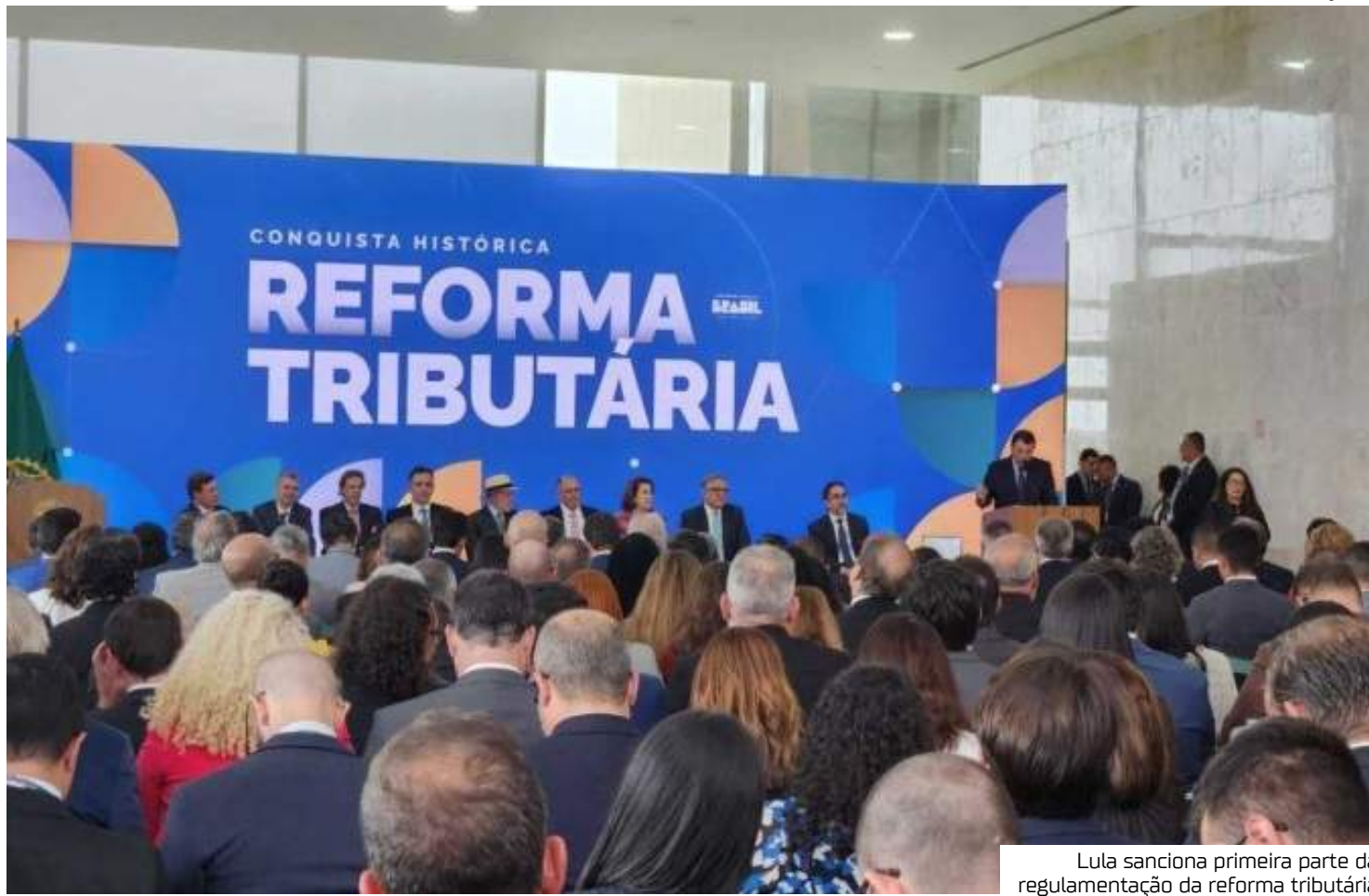
Lula sanciona primeira parte da regulamentação da reforma tributária