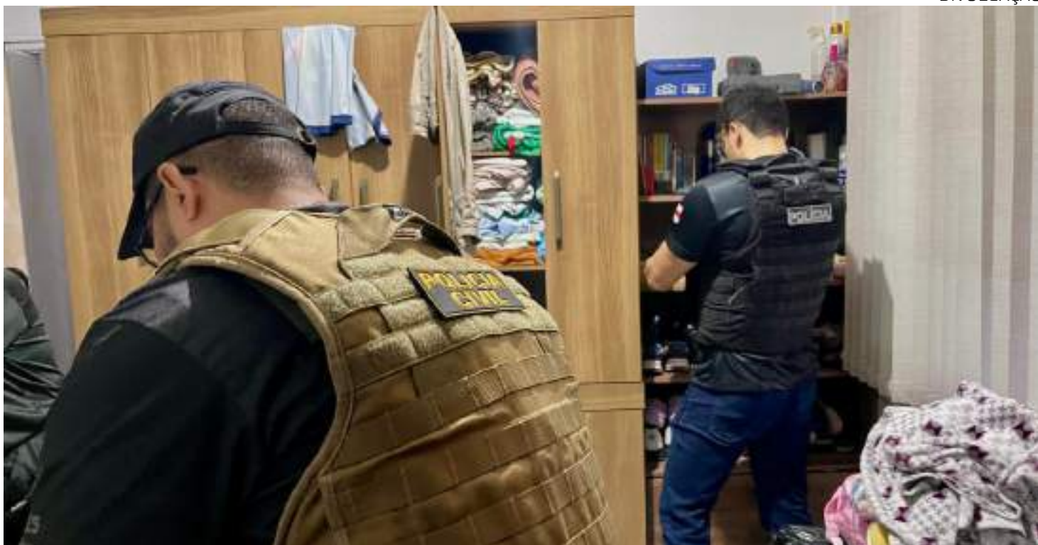
Na casa do suspeito, policiais civis encontraram cartões do Auxílio Estadual

"Recebemos a denúncia da Seas sobre o atraso