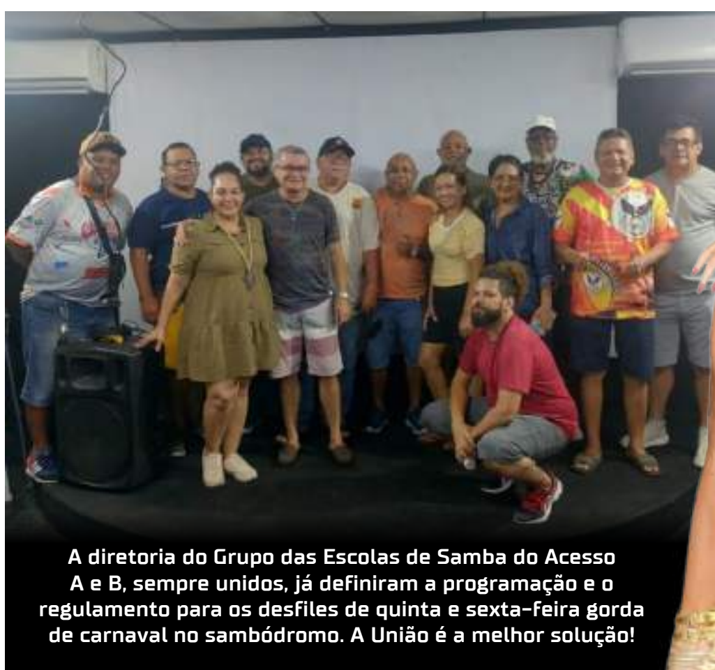
A diretoria do Grupo das Escolas de Samba do Acesso A e B, sempre unidos, já definiram a programação e o regulamento para os desfiles de quinta e sexta-feira gorda de carnaval no sambódromo. A União é a melhor solução!