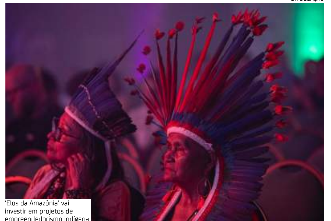
'Elos da Amazônia' vai investir em projetos de empreendedorismo indígena

"Pesquisadores que tenham tecnologias inovadoras e disruptivas desenvolvidas a partir do seu conhecimento, e que naturalmente trazem também na sua bagagem histórica de conhecimento