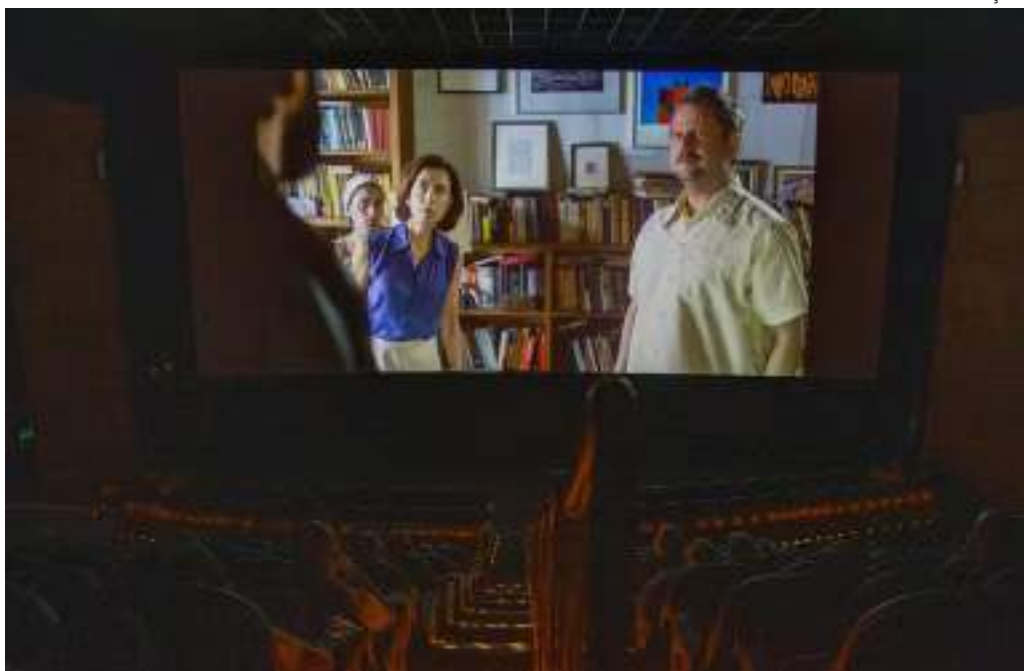
No Brasil, 'Ainda Estou Aqui' é um fenômeno de bilheteria, assistido por 3,4 milhões de espectadores