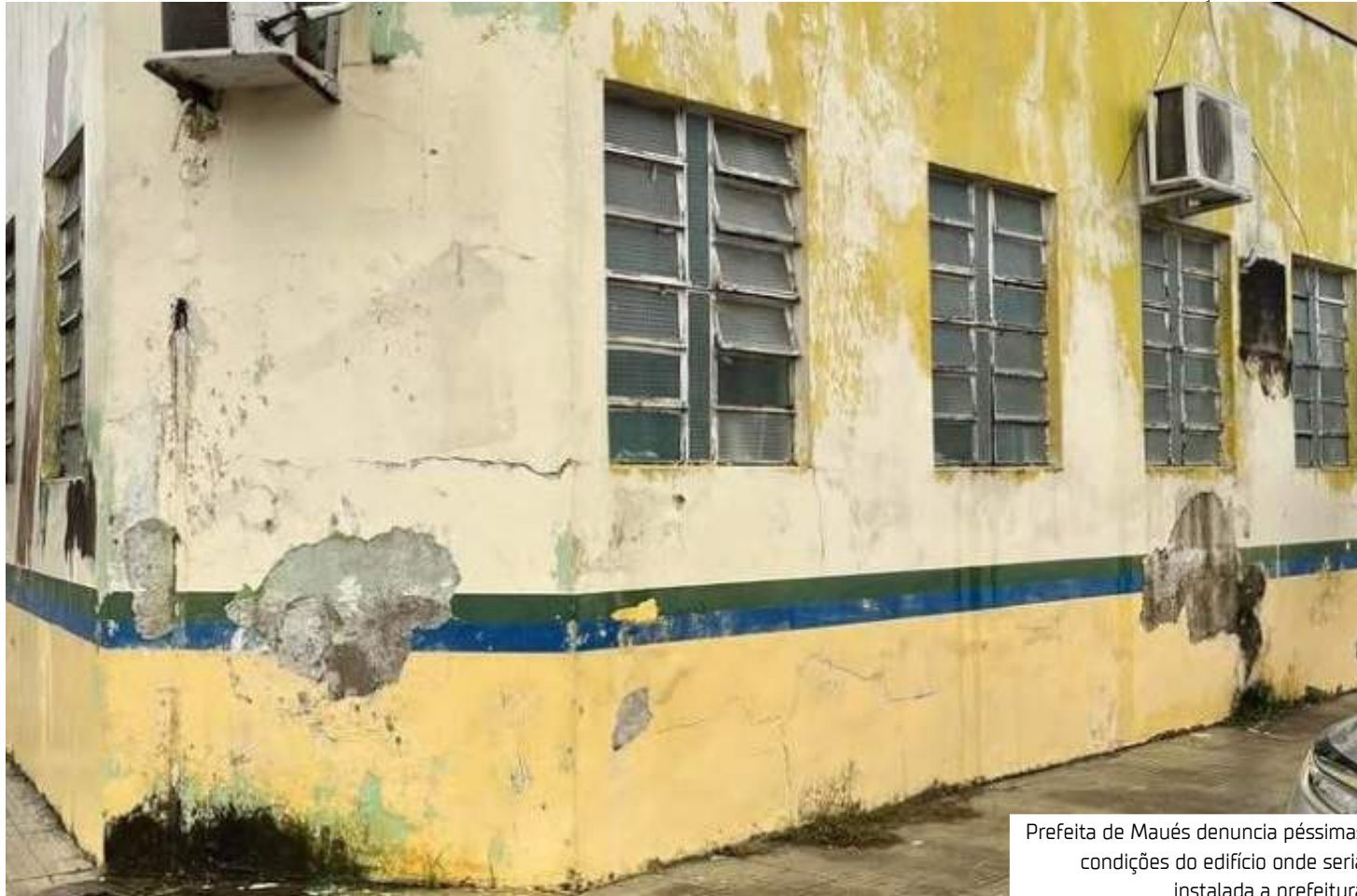
Prefeita de Maués denuncia péssimas condições do edifício onde seria instalada a prefeitura

Em Eirunepé, o decreto de emergência foi motivado por problemas administrativos e fi-