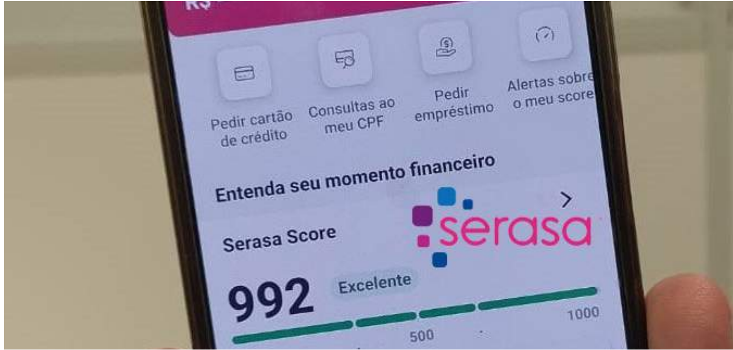
Pagamento via Pix pelo aplicativo atualiza o score instantaneamente, impulsionando o consumo

"A Serasa não necessita mais depender do credor para avisar a empresa que a dívida foi paga. Agora temos acesso à informação do pagamento e fazemos a baixa da negativação. No mesmo instante, será possível atualizar o score que o consumidor vê e, mais importante, o score que todo o mercado vê para