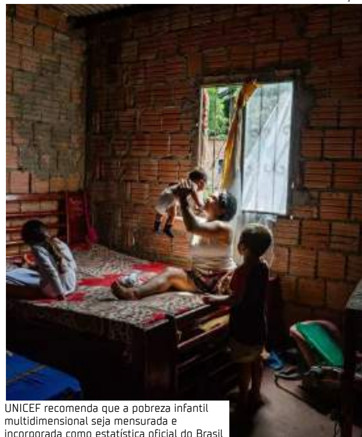
UNICEF recomenda que a pobreza infantil multidimensional seja mensurada e incorporada como estatística oficial do Brasil

No Brasil, no mesmo ano, 7,7% das crianças estavam privadas de educação, 3,5% de informação, 3,4% estavam em trabalho infantil, 11,2% estavam privadas de moradia adequada, 5,4% sem água adequada, 38% sem saneamento adequado e 19,1% privadas de renda.