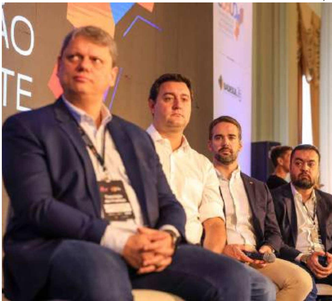
Tarcísio de Freitas, Ratinho Jr., Eduardo Leite, Claudio Castro e Romeu Zema durante encontro

Caiado, por sua vez, já disse que pretende se candidatar independentemente dos arranjos entre os demais governadores e partidos —a sua idade, 75 anos, é apontada como um fator para que ele queira disputar já em 2026.