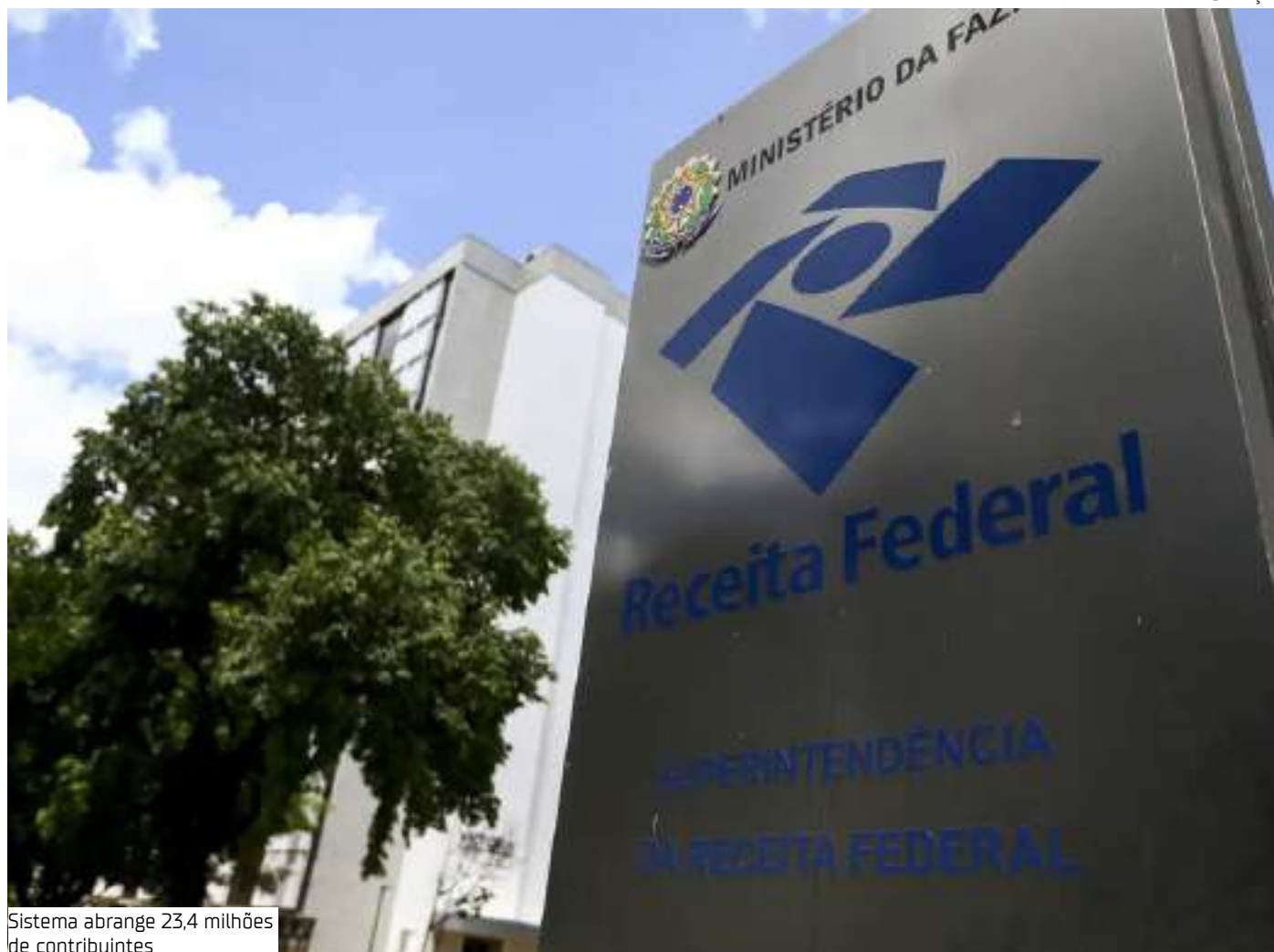
Sistema abrange 23,4 milhões de contribuintes

Dados da autarquia mostram que, atualmente, 23,4 milhões de contribuintes são abrangidos pelo Simples Nacional, sendo 16 milhões microempresendedores individuais (MEI). A Receita Federal, até 31 de janeiro, um número de pedidos formulados compatível com os anos anteriores – em torno de 1,2 milhão de contribuintes.