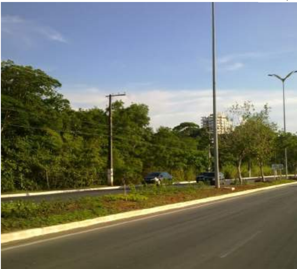
Prefeitura de Manaus já planeja a ampliação do sistema para outras áreas da cidade