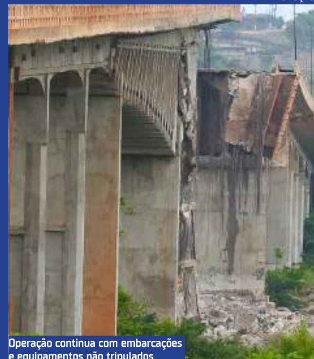
Operação continua com embarcações e equipamentos não tripulados