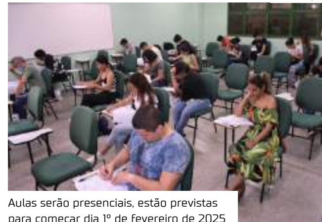
Aulas serão presenciais, estão previstas para começar dia 1º de fevereiro de 2025