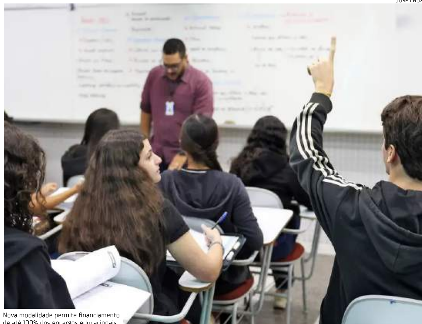
Nova modalidade permite financiamento de até 100% dos encargos educacionais