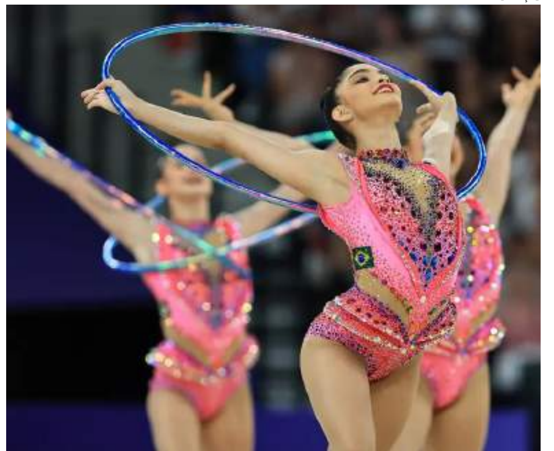
Na ginástica, o Brasil promete ser protagonista de dois Mundiais; o calendário completo está no site do COB