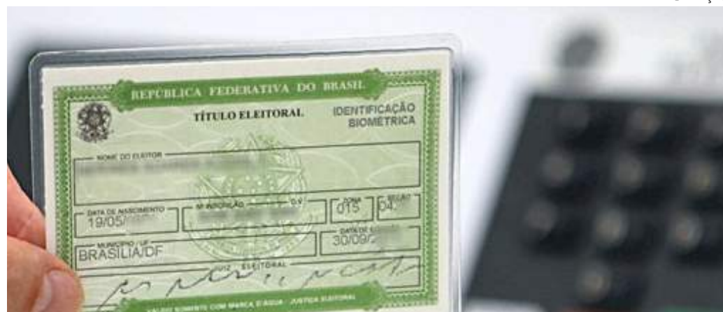
Eleitores que não votaram devem justificar ausência até 7 de janeiro

Entre elas, está o pagamento da multa de R$ 35,13 imposta