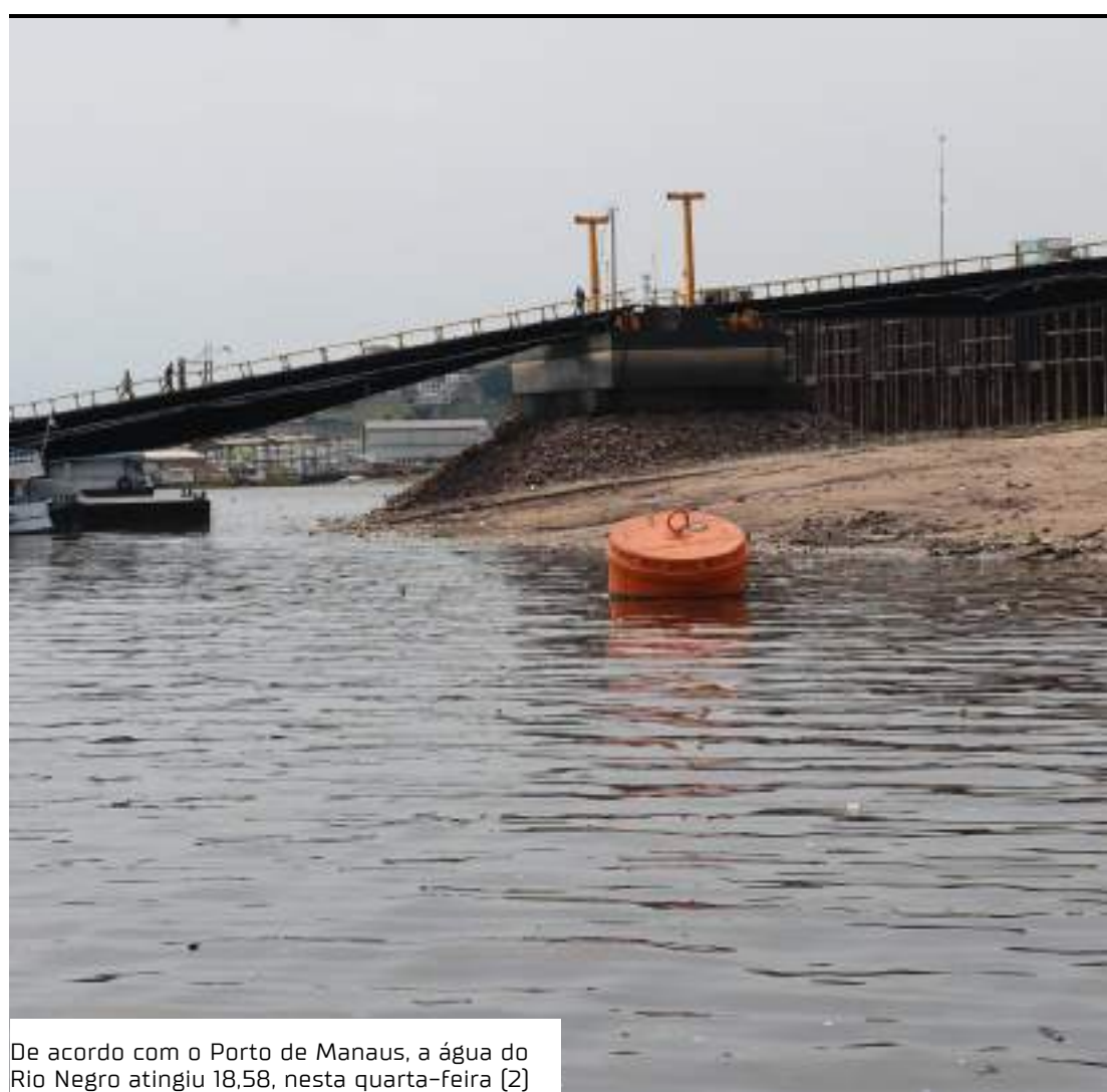
De acordo com o Porto de Manaus, a água do Rio Negro atingiu 18,58, nesta quarta-feira (2)

“O que podemos observar é uma boa recuperação das bacias localizadas na porção mais ao sul da bacia, dos rios afluentes de margem