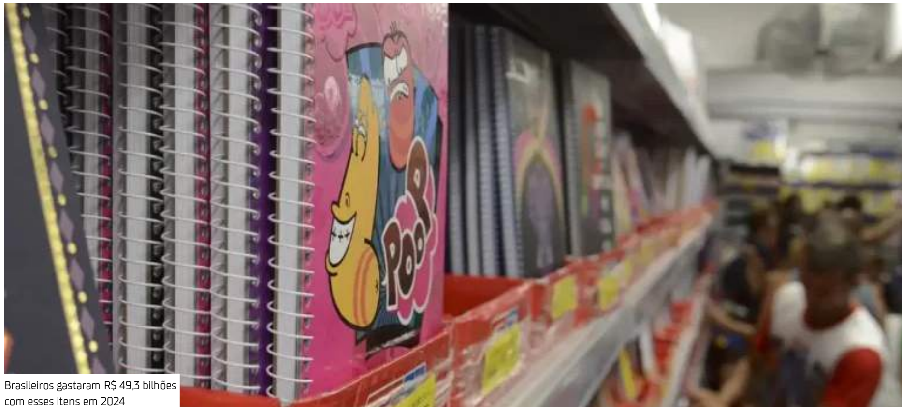
Brasileiros gastaram R$ 49,3 bilhões com esses itens em 2024

Os pesquisadores estimam que os valores gastos com materiais escolares aumentaram ao longo dos últimos anos, passando de um montante nacional