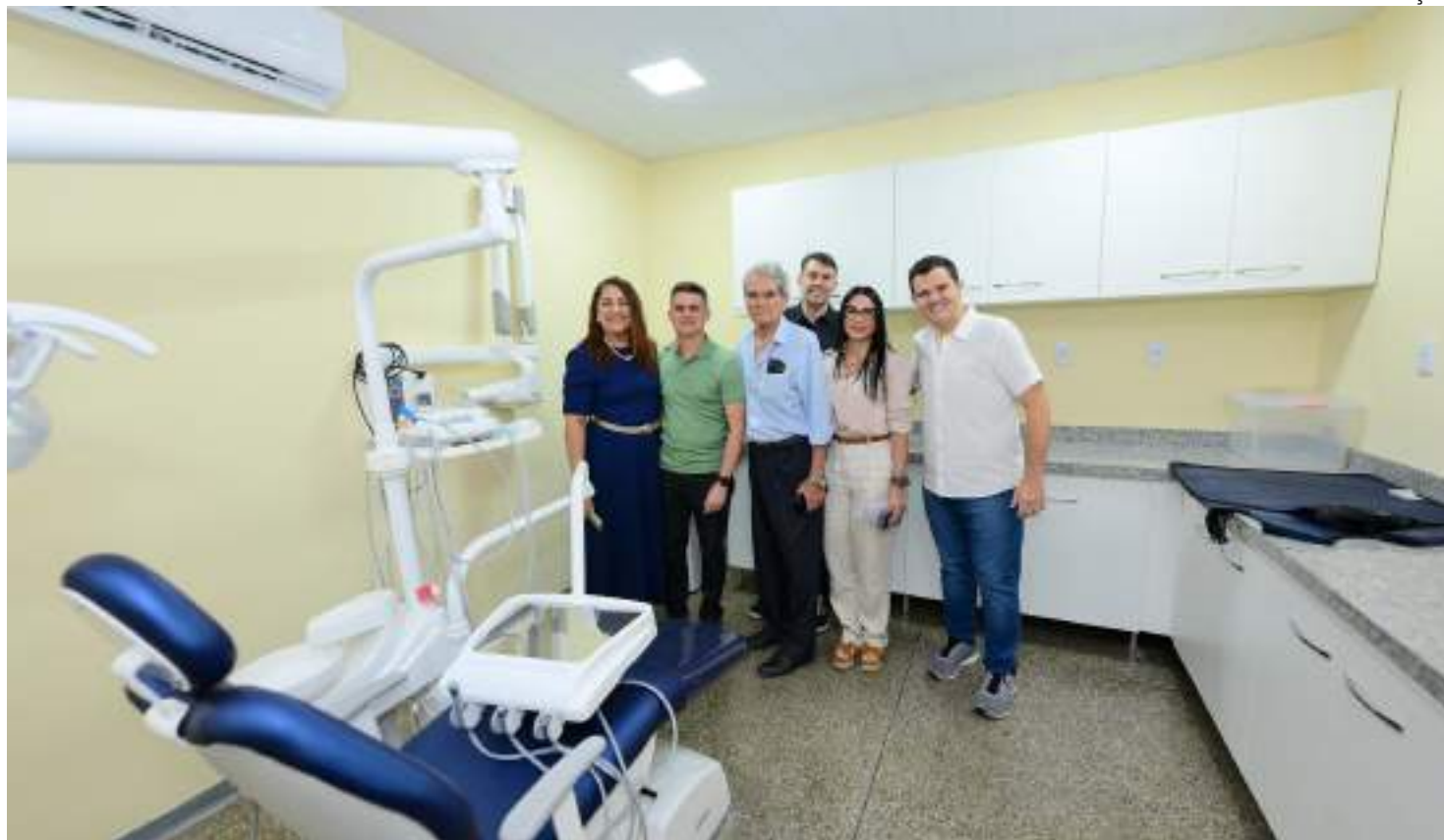
USF conta com consultórios amplos e equipamentos modernos, projetados para oferecer um ambiente acessível e acolhedor

Entre os atendimentos disponíveis estão consultas médicas, odontológicas e de enfermagem, além de exames laboratoriais,