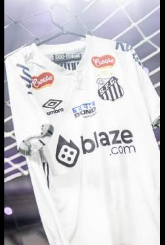
Marca da Nissei ainda estará no Manto do Peixe