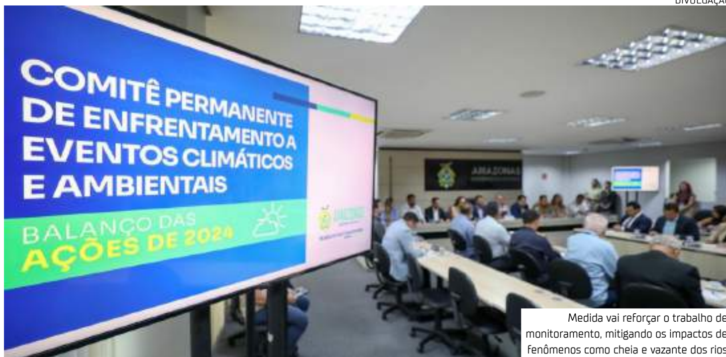
Medida vai reforçar o trabalho de monitoramento, mitigando os impactos de fenômenos como cheia e vazante dos rios

Desde junho, está ativo o comitê para resposta à estiagem severa que atingiu