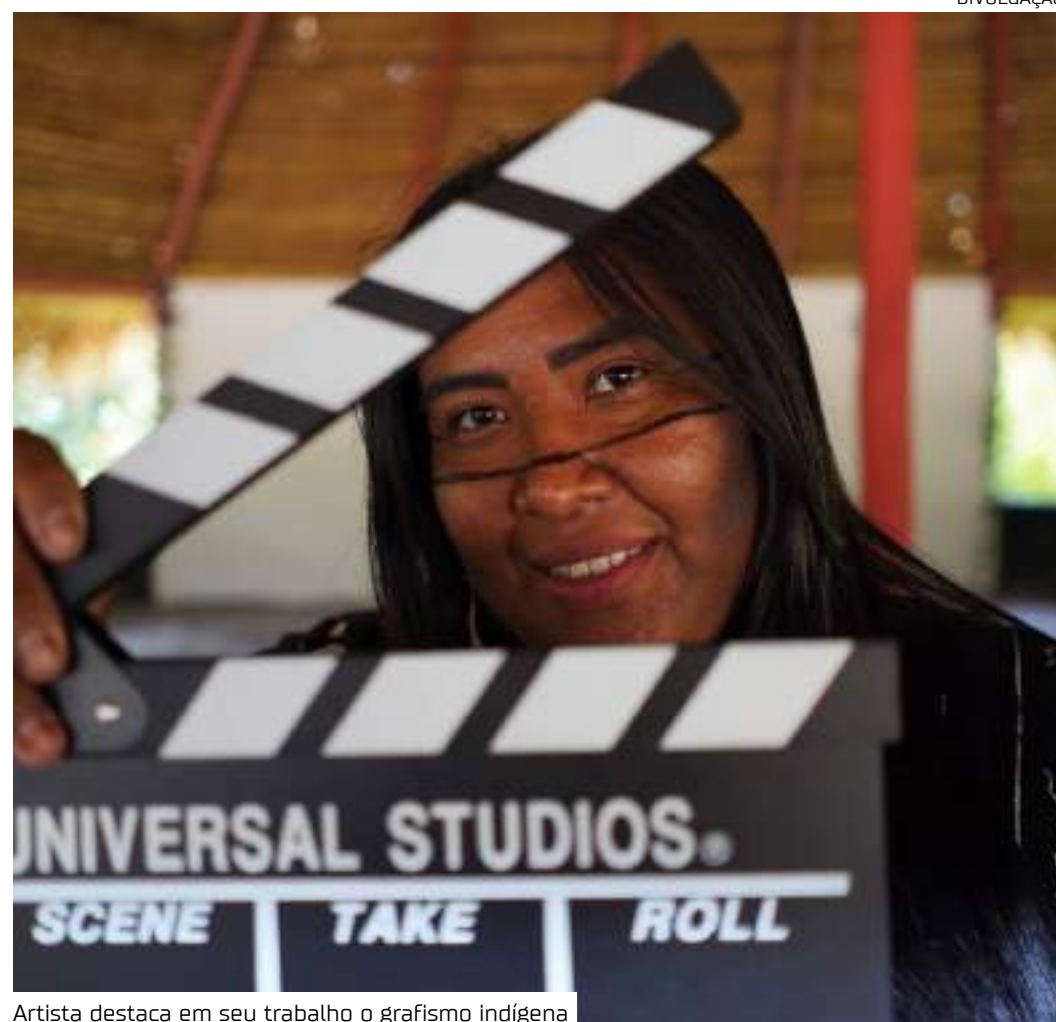
Artista destaca em seu trabalho o grafismo indígena

O lançamento do documentário ocorrerá na nova sala de cinema "Cine Aldeia", que será inaugurada no mesmo dia. Além da exibição do documentário, outros filmes com temática indígena estarão na programação do evento.