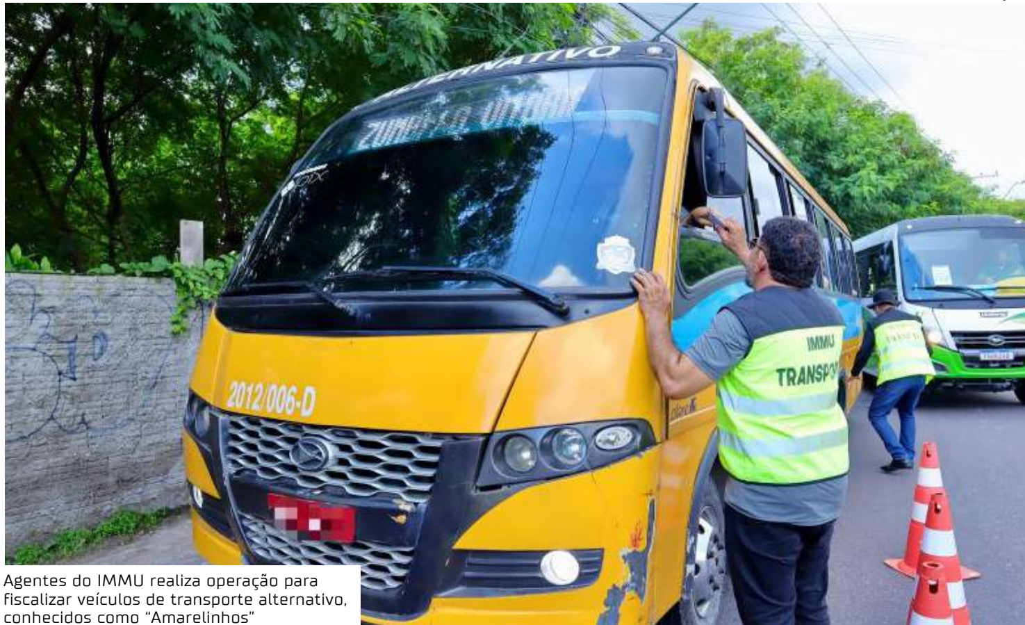
Agentes do IMMU realiza operação para fiscalizar veículos de transporte alternativo, conhecidos como "Amarelinhos"

Durante a operação, os fiscais de transportes do IMMU abordaram mais de 60 veículos, resultando em autuações por irregularidades. Entre elas, um motorista foi flagrado sem Carteira Nacional de Habilitação (CNH), dois veículos apresentaram pneus em condições inadequadas para rodagem e um deles