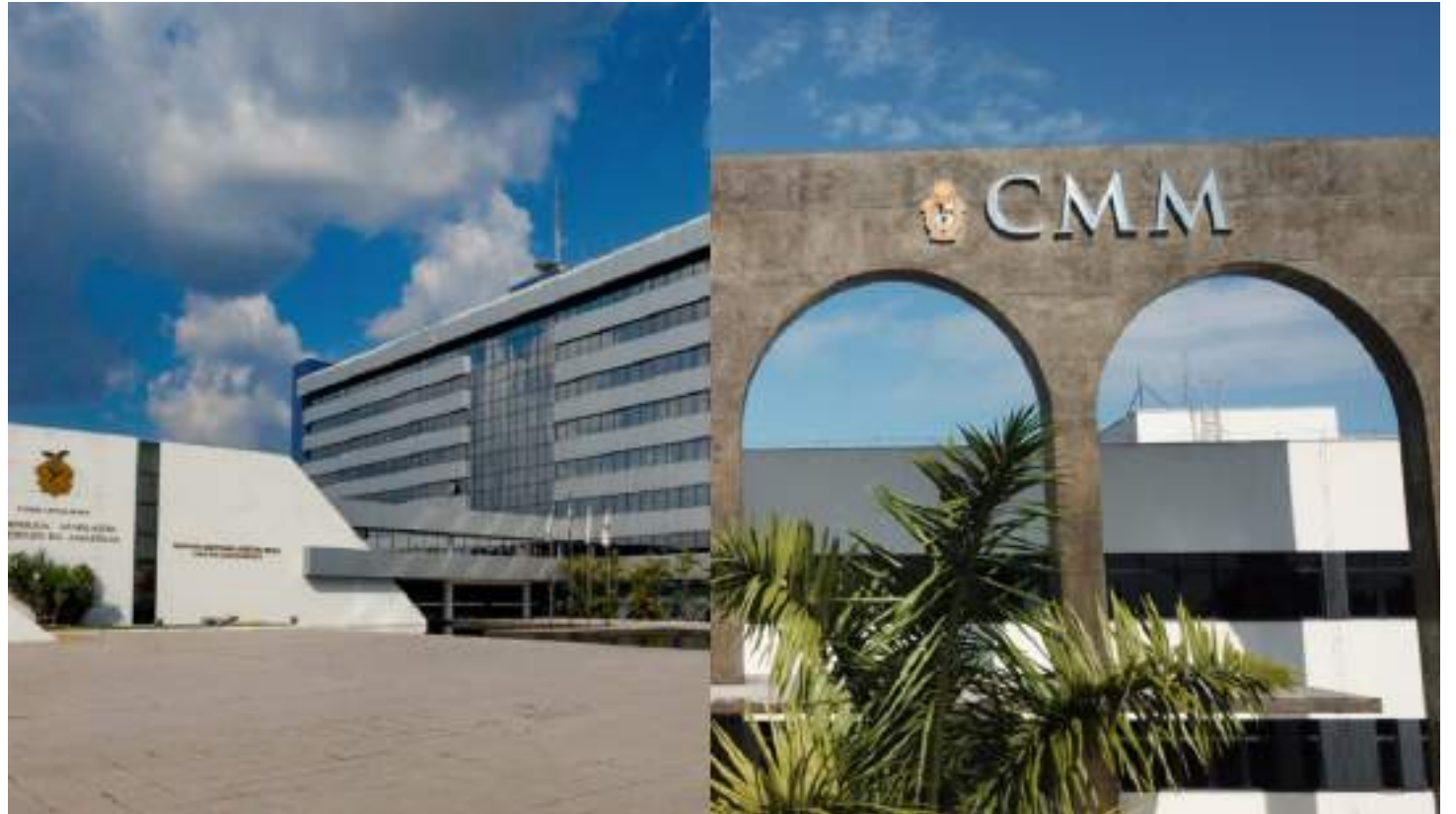
Retorno das casas legislativas será marcado por importantes discursos dos líderes executivos

A capital amazonense, com desafios urbanos e sociais específicos, deverá ver a continuidade de projetos nas áreas de saúde, educação, transporte e infraestrutura, além de medidas voltadas para o