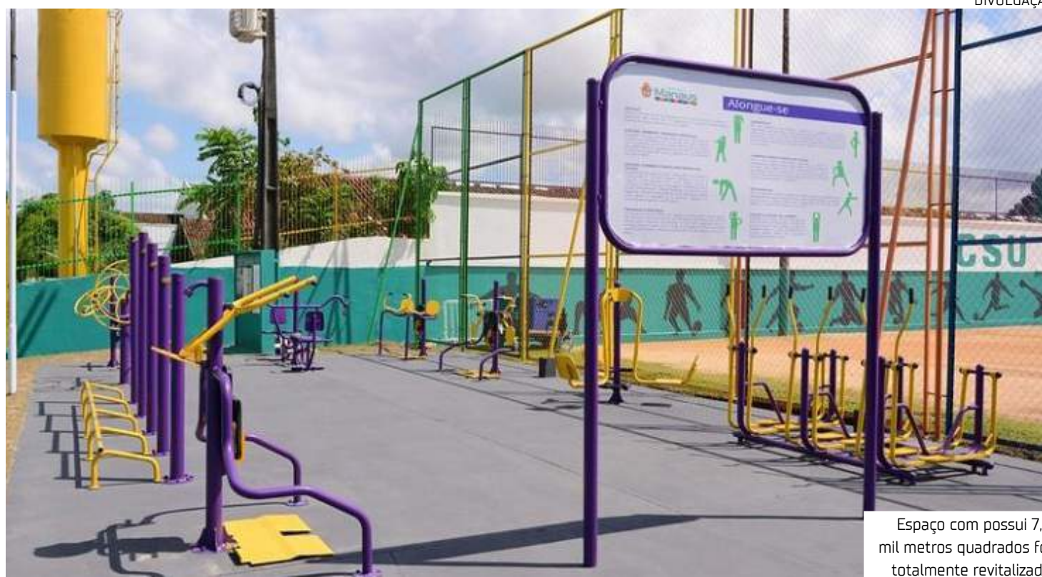
Espaço com possui 7,8 mil metros quadrados foi totalmente revitalizado

O projeto de revitalização incluiu a drenagem do campo, a construção de duas quadras de vôlei e novos vestiários para homens, mulheres e Pessoas com Deficiência (PcDs). Além disso, a área administrativa, a academia ao ar livre e os alambrados foram restaurados e pintados. Outro destaque foi a revitalização das arquibancadas, agora com cobertura para pro-