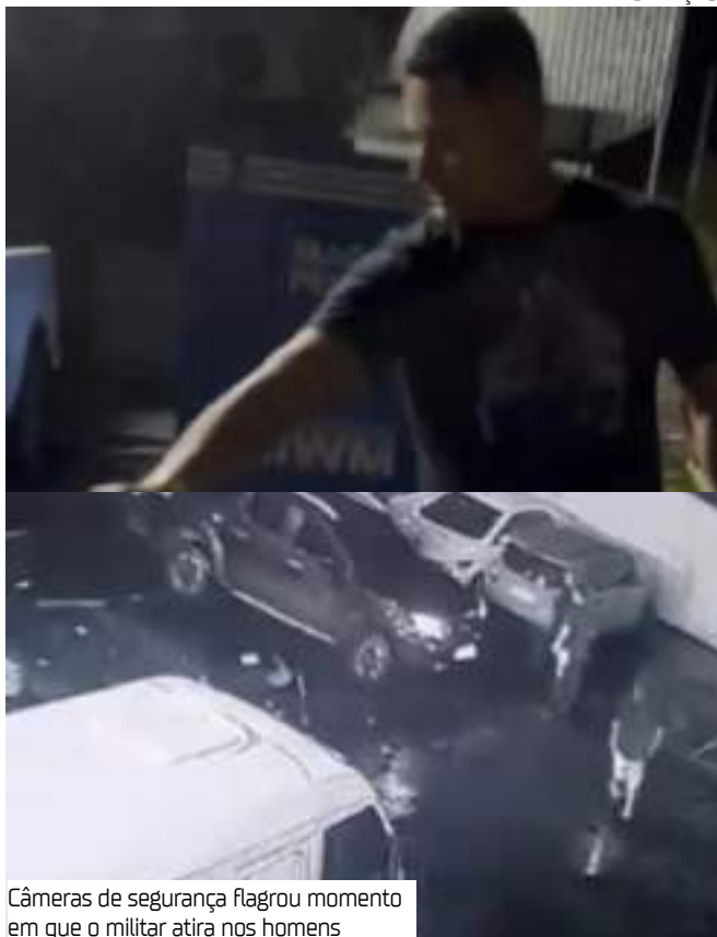
Câmeras de segurança flagrou momento em que o militar atira nos homens