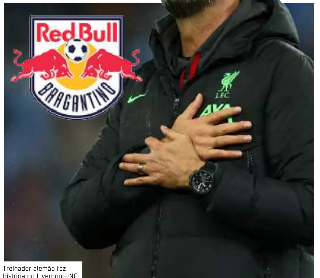
Treinador alemão fez história no Liverpool-ING