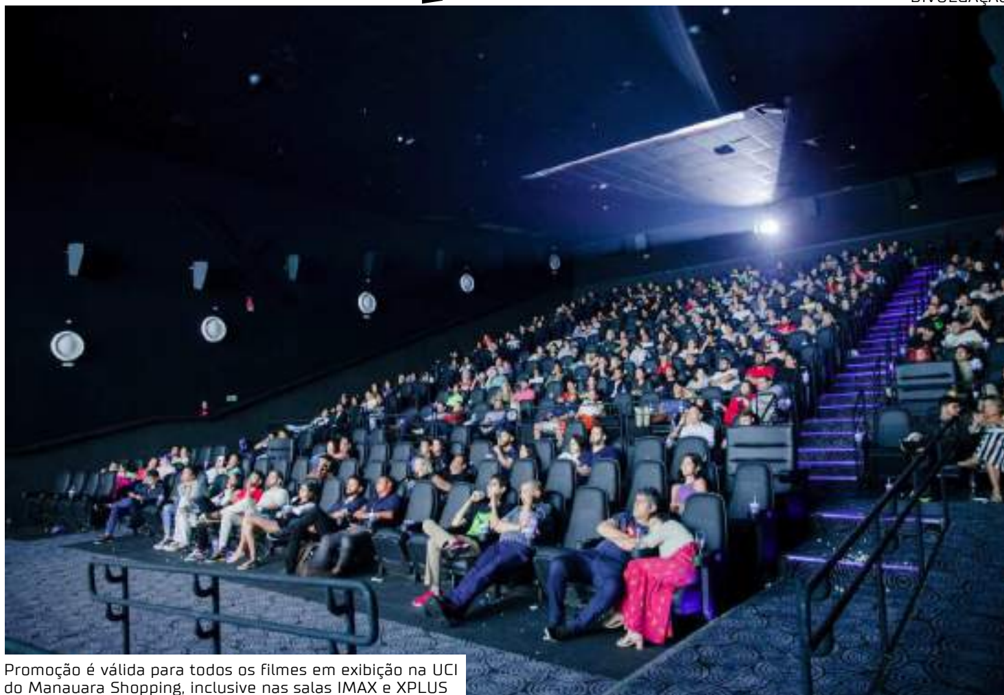
Promoção é válida para todos os filmes em exibição na UCI do Manuara Shopping, inclusive nas salas IMAX e XPLUS

Concorrendo a oito estatuetas, entre elas Melhor Filme, Melhor Ator e Melhor Roteiro Adaptado, "Conclave" também participa da promoção, assim como a comédia dramática "Anora", indicada em seis categorias, incluindo Melhor Filme,