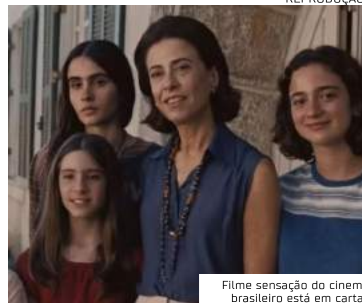
Filme sensação do cinema brasileiro está em cartaz

Além disso, o público poderá conferir outras grandes superproduções, como "Mufasa: O Rei Leão" — que retornou às salas especiais IMAX e conta a história do pai de Simba antes dos acontecimentos de "O Rei Leão". Os sucessos da criançada, "Paddington: Uma Aventura na Floresta", "Moana 2", "Chico Bento e a Goiabeira Maraviosa" e "Sonic 3" também marcam presença na maratona.