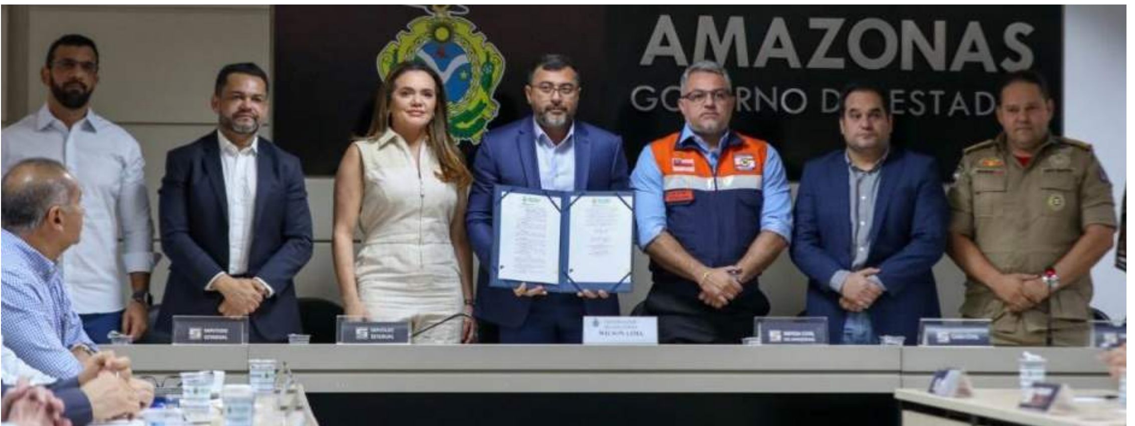
Governo do Amazonas vai manter comitê permanente para prevenir e mitigar os impactos de eventos climáticos extremos, como cheias e secas.