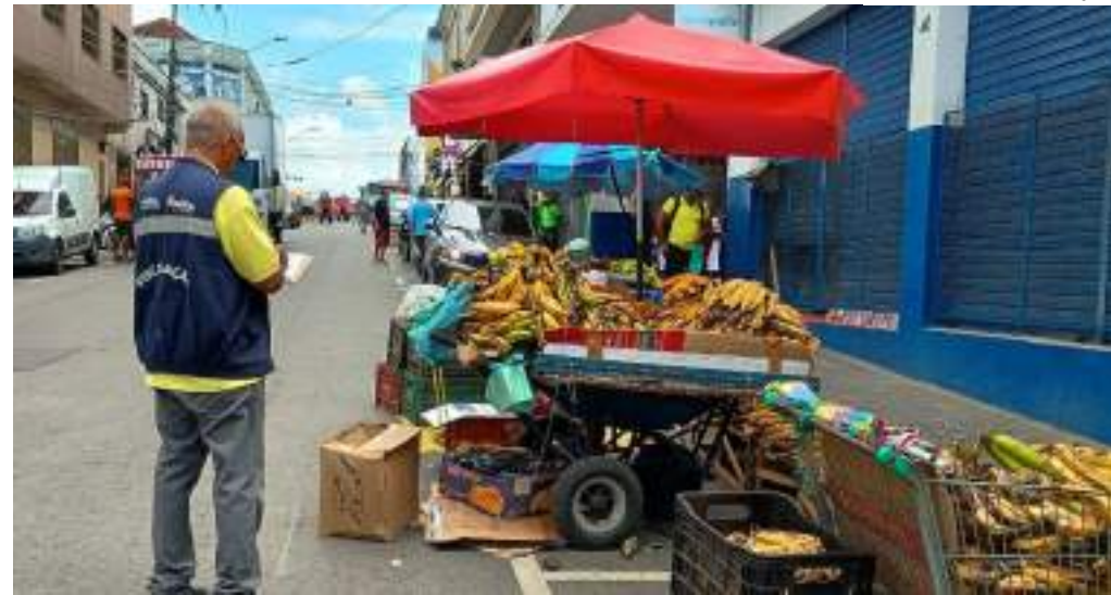
Vendedores frutas e motocicletas estacionam de maneira irregular no Centro