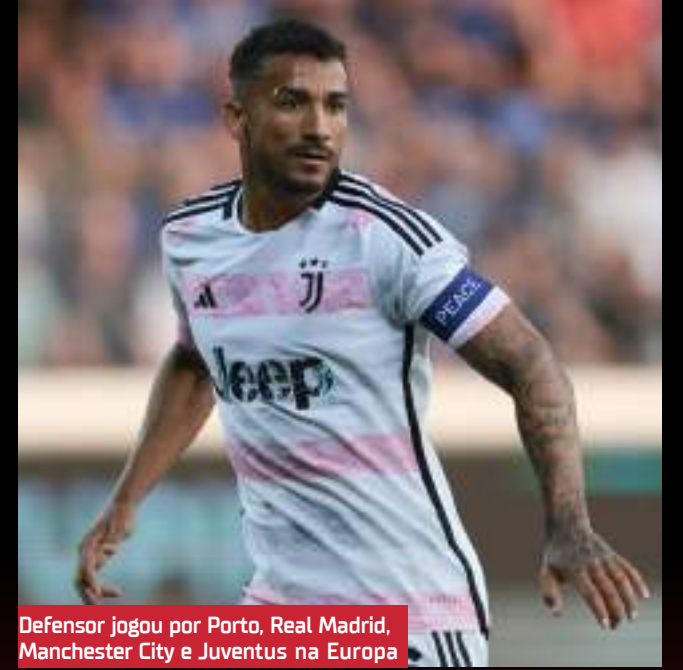
Defensor jogou por Porto, Real Madrid, Manchester City e Juventus na Europa