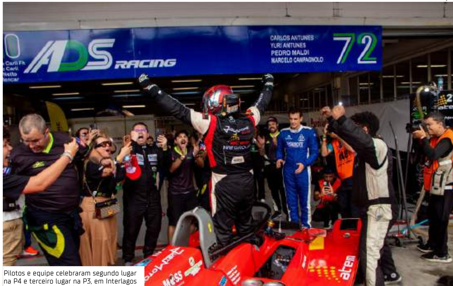
Pilotos e equipe celebraram segundo lugar na P4 e terceiro lugar na P3, em Interlagos