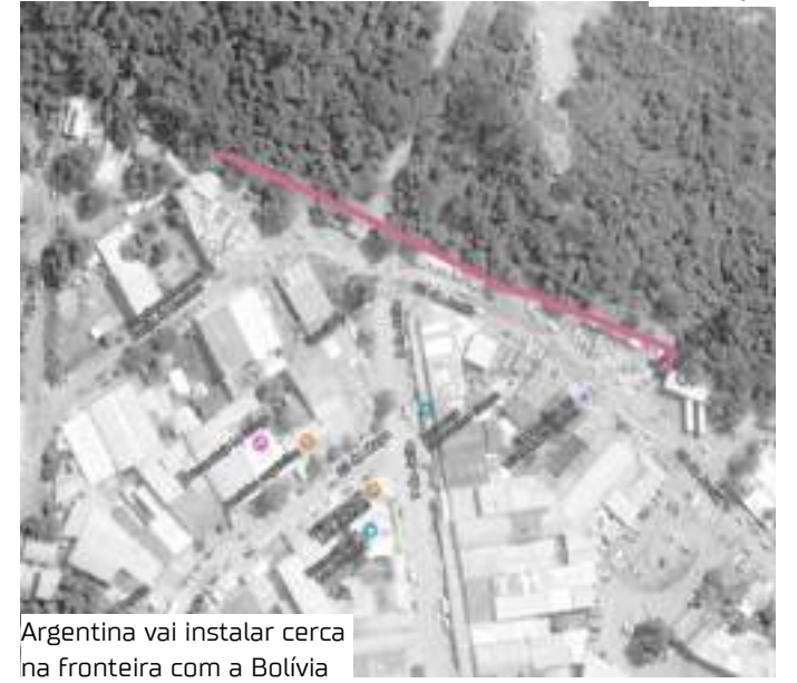
Argentina vai instalar cerca na fronteira com a Bolívia

A chancelaria de Luis Arce disse ainda que solicitará à Argentina informações, mediante canais diplomáticos, sobre a iniciativa, para "empreender ações correspondentes".