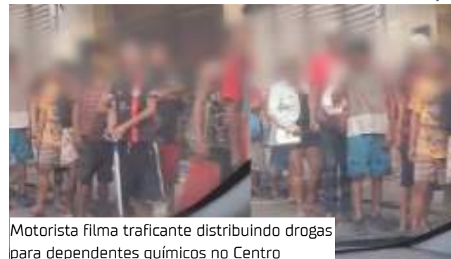
Motorista filma traficante distribuindo drogas para dependentes químicos no Centro