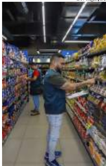
Cestas, composta por 16 itens essenciais, apresentaram diferença de R$ 42,98

A primeira pesquisa do Procon Manaus, divulgada na terça-feira (4), revelou uma diferença significativa nos preços da cesta básica em diferentes supermercados da capital amazonense. A cesta, composta por 16 itens essenciais, apresentou um valor mínimo de R$ 263,40 e o mais alto de R$ 306,38, representando uma diferença de R$ 42,98.