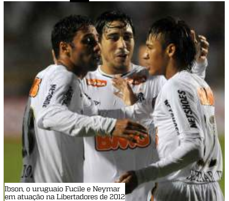
Ibson, o uruguaio Fucile e Neymar em atuação na Libertadores de 2012

Santos e Botafogo-SP são rivais de longa data. Ao longo da história, essas equipes já se enfrentaram em 101 partidas, com 62 vitórias do Peixe, 22 empates e 17 triunfos da Pantera, segundo dados do portal Ogol.