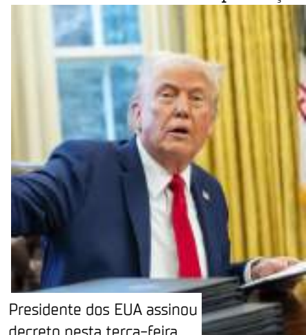
Presidente dos EUA assinou decreto nesta terça-feira

Esta não é a primeira vez, durante o mandato atual, que Trump corta assistência a programas da ONU. No fim de janeiro deste ano, ele anunciou a suspensão de fundos americanos de repasse à agência da ONU que ajuda imigrantes venezuelanos em Manaus.