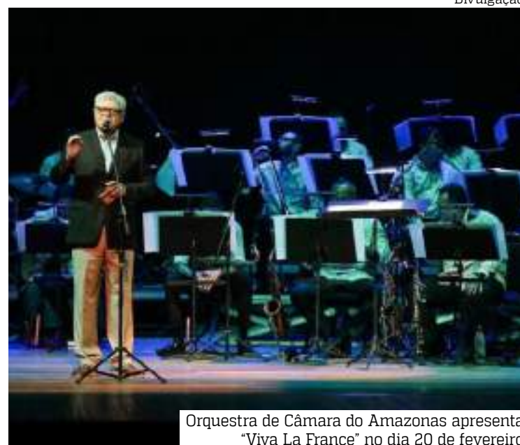
Orquestra de Câmara do Amazonas apresenta "Viva La France" no dia 20 de fevereiro

Nos dias 14, 15 e 16 de fevereiro, os atores Letícia Sabatella e Daniel Dantas encenam "Ilíada", retratando a epopeia de Homero sobre o último ano da Guerra de Tróia. As apresentações acontecem às 20h na sexta e no sábado, e às 19h no