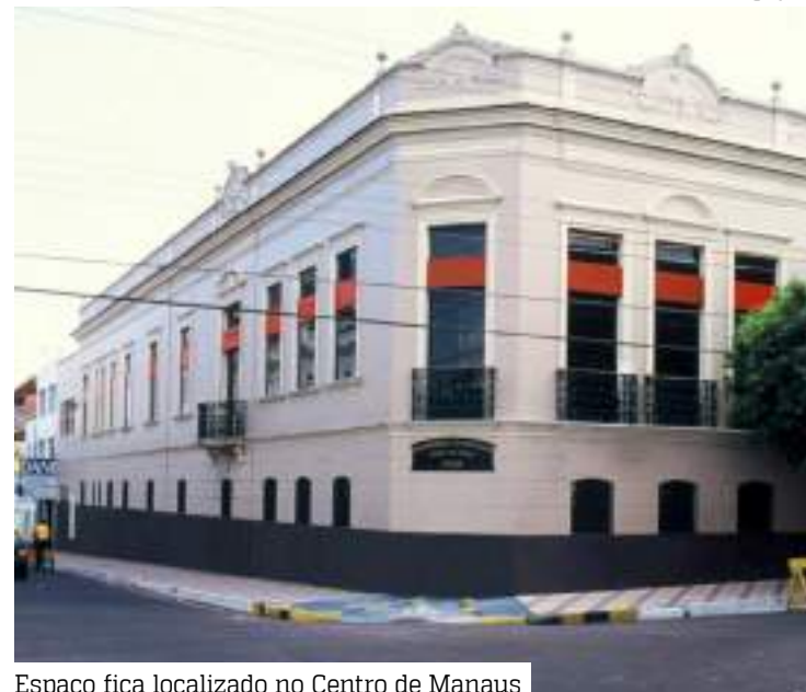
Espaço fica localizado no Centro de Manaus