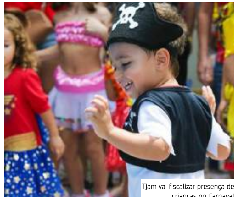
Tjam vai fiscalizar presença de crianças no Carnaval

Durante o Carnaval, o Tjam, em parceria com órgãos de segurança e proteção à infância, realizará ações de fiscalização para garantir o cumprimento das normas. O objetivo é proteger as crianças e adolescentes, prevenindo situações de risco, trabalho infantil, exploração sexual e maus-tratos. Menores de 5 anos: não podem desfilarem.