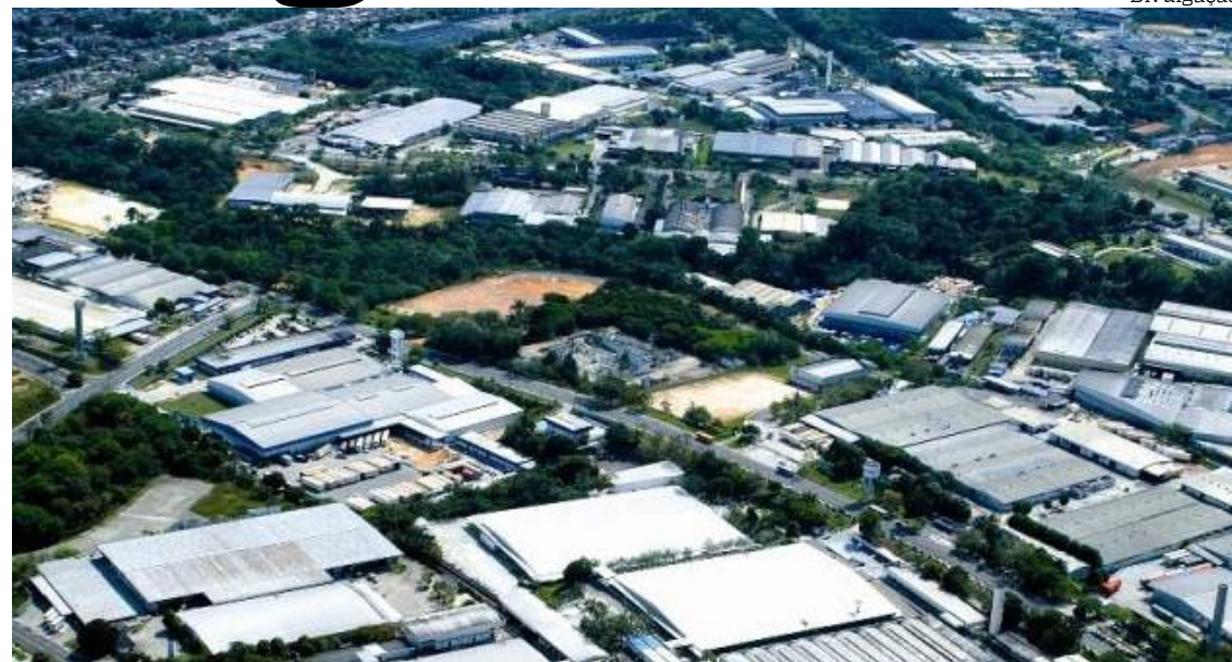
Sistemas de IA são estudados para otimização de processos no PIM

Durante a reunião, a capacitação profissional emergiu como prioridade, com o superintendente-adjunto de Administração da Suframa,