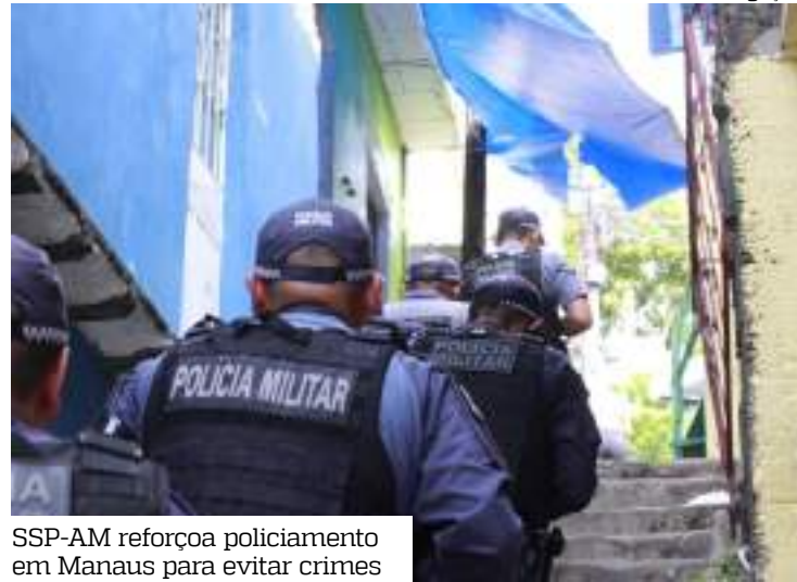
SSP-AM reforça policiamento em Manaus para evitar crimes

Conforme os dados do Ciesp, em janeiro de 2024, foram contabilizados em Manaus, 51 homicídios. Este ano, durante o mesmo período, a capital re-