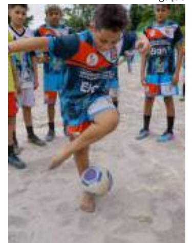
Atletas aproveitam espaço

"Tenho um filho que está começando hoje no projeto. Este espaço será muito bom não só para as crianças, mas também para os adultos. Esse lugar ficou esquecido por mais de 20 anos. Então, quero agradecer ao prefeito pelo que ele fez pela comunidade e espero que esses projetos continuem, não só para o Coroado e o Ouro Verde, mas para todos os bairros", afirmou o morador.