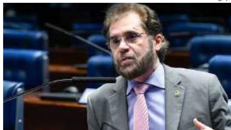
Senador aponta que acordo envolve o acesso a 14% do território brasileiro

O senador também mencionou que pretende apresentar requerimentos no Senado para que o caso seja discutido ao nível federal, ressaltando que a questão envolve a segurança nacional, dado que