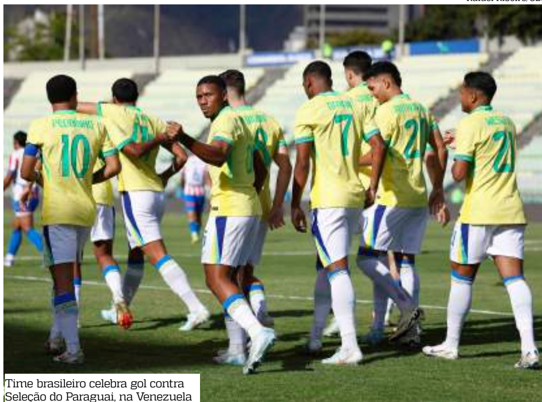
Time brasileiro celebra gol contra Seleção do Paraguai, na Venezuela

Na última, em 2011, a Seleção superou Portugal na decisão pelo placar de 3 a 2, na prorrogação. Oscar anotou os três gols do Brasil no Es-