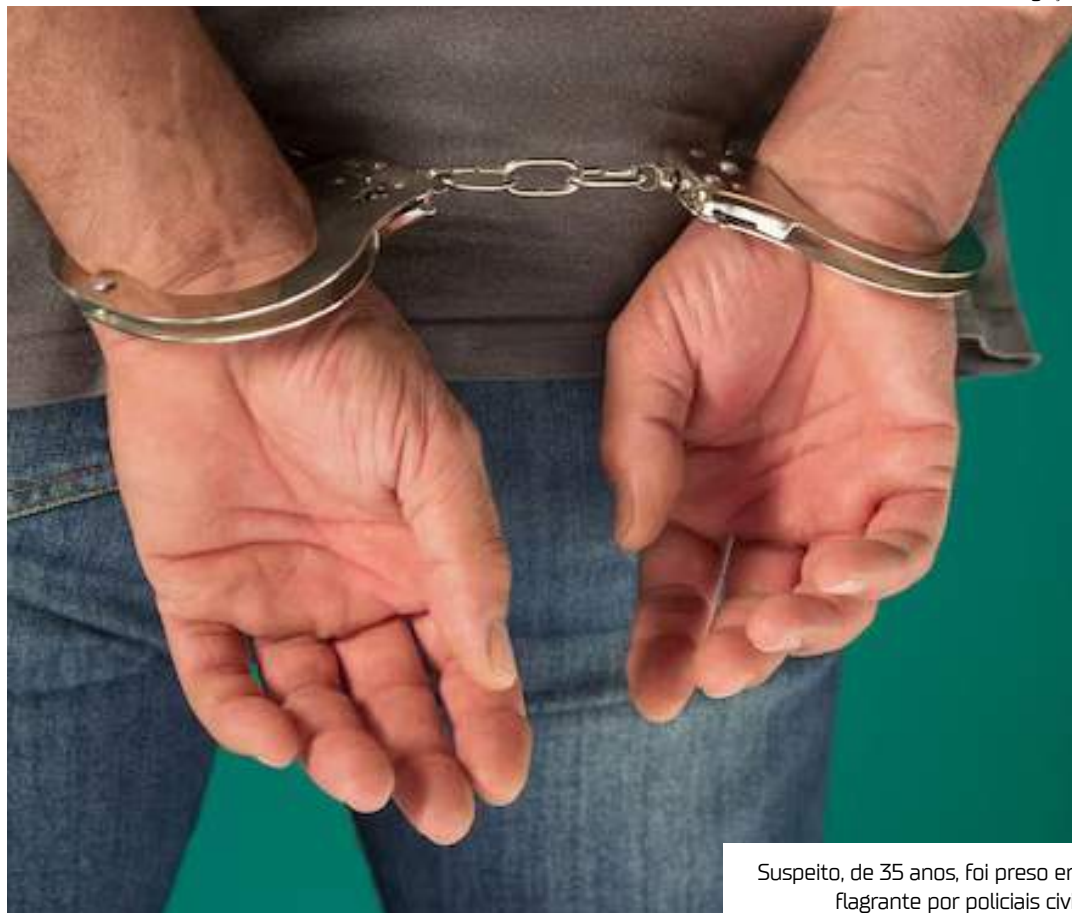
Suspeito, de 35 anos, foi preso em flagrante por policiais civis