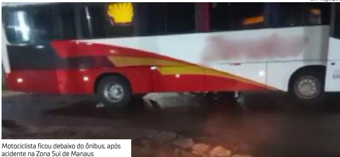
Motociclista ficou debaixo do ônibus, após acidente na Zona Sul de Manaus