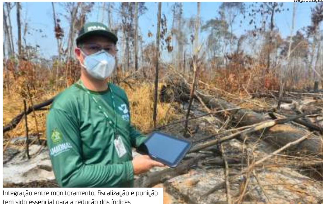
Integração entre monitoramento, fiscalização e punição tem sido essencial para a redução dos índices

Entre 1º de janeiro e 10 de fevereiro de 2025, os