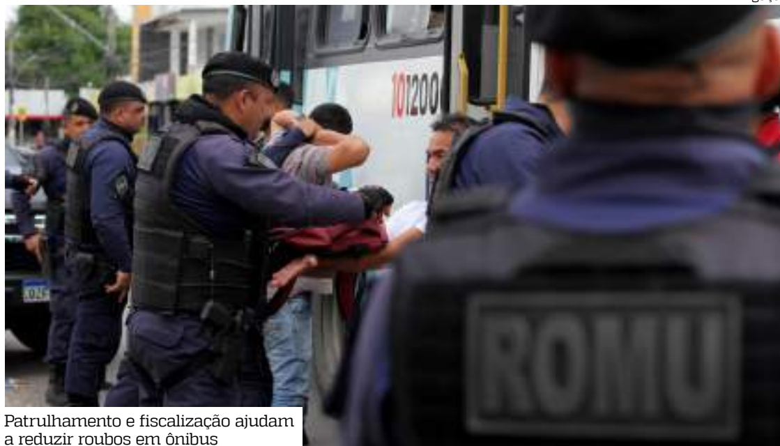
Patrulhamento e fiscalização ajudam a reduzir roubos em ônibus

tram resultados expressivos: o número de assaltos no transporte coletivo teve uma queda significativa de 58%. Em janeiro de 2024, foram registrados 80 casos, enquanto no mesmo período de 2025, esse número caiu para 33. A redução é reflexo do in-