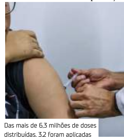
Das mais de 6,3 milhões de doses distribuídas, 3,2 foram aplicadas

Em 2024, o imunizante também foi pré-qualificado pela OMS. A entidade define a Qdenga como uma vacina viva atenuada que contém versões enfraquecidas dos quatro sorotipos do vírus causador da dengue e recomenda que a dose seja aplicada em crianças e adolescentes de 6 a 16 anos em locais com alta transmissão.