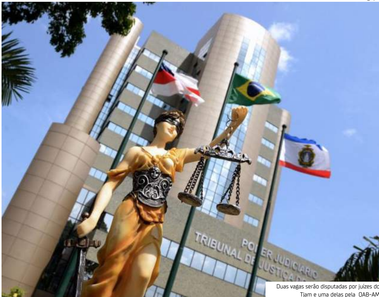
Dois vagas serão disputadas por juizes do Tjam e uma delas pela OAB-AM