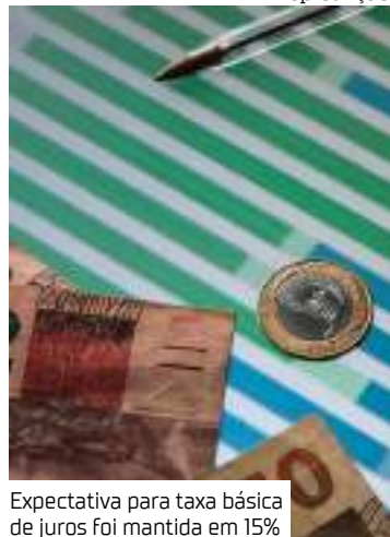
Expectativa para taxa básica de juros foi mantida em 15%

O mercado financeiro aumentou a projeção da inflação e do crescimento da economia para este ano. Segundo o Boletim Focus, divulgado nesta segunda-feira (10) pelo Banco Central, a inflação, medida pelo Índice Nacional de Preços ao Consumidor Amplo (IPCA), ficou em 5,58%, ante os 5,51% da semana passada.