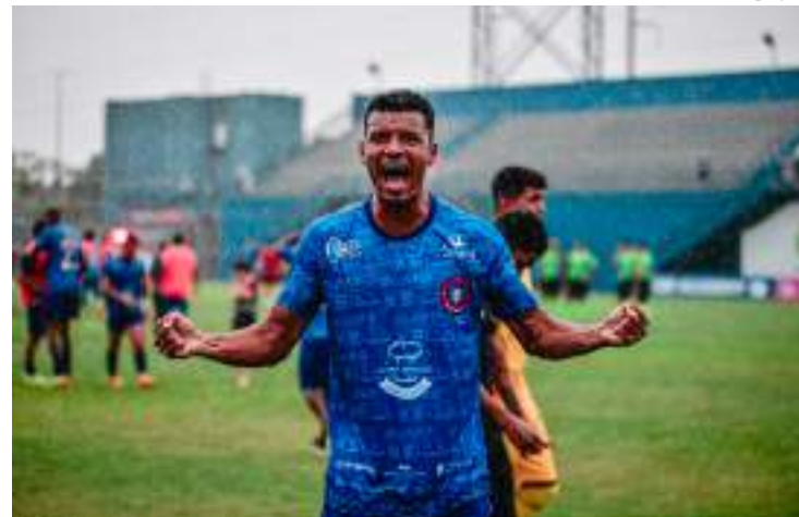
RPE Parintins venceu na última rodada e garantiu vaga no mata-mata

Até a última rodada, o RPE Parintins tinha perdido para São Raimundo, Amazonas e Manaus.