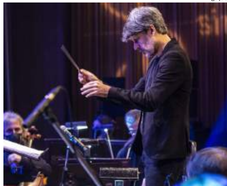
Apresentações acontecem nesta terça (11) e quarta (12), às 20h

Além de Manaus, a turnê 2025 passará por Brasília, Goiânia, Belém, Belo Horizonte e Vitória.