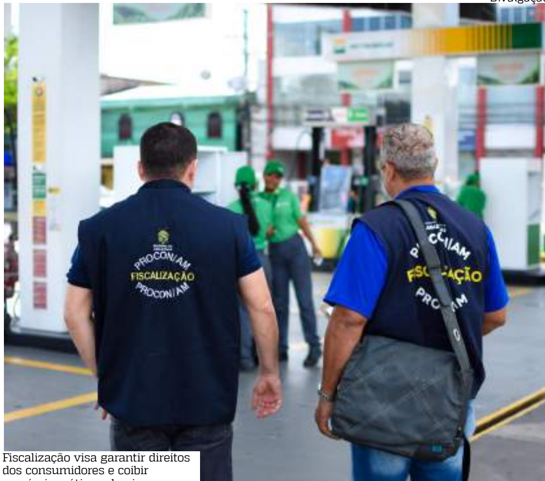
Fiscalização visa garantir direitos dos consumidores e coibir possíveis práticas abusivas

Recentemente, houve um aumento do Imposto de Circulação de Bens e Serviços (ICMS) sobre os combustíveis, resultando em um