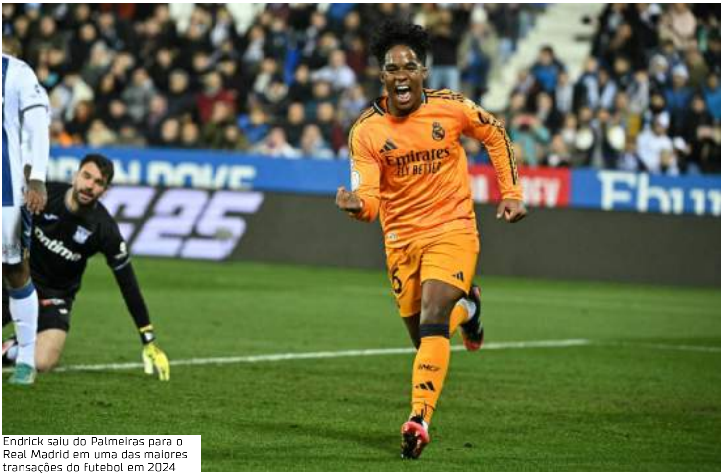
Endrick saiu do Palmeiras para o Real Madrid em uma das maiores transações do futebol em 2024

Brasil se consolidou como o país com maior número de transferências internacionais no futebol em 2024. De acordo com o Global Transfer Report 2024, divulgado pela FIFA, os clubes brasileiros lideraram tanto em número de negociações quanto em volume financeiro movimentado no ano passado. Foram 1.113 jogadores brasileiros transferidos para o exterior, enquanto 1.102 atletas foram contratados por clubes do país. Além disso, os clubes brasileiros estiveram no topo da lista de gastos, somando US$ 1,2 bilhão (cerca de R$ 6,91 bilhões) em transferências. A França apareceu em segundo lugar, com US$ 927 milhões (cerca de R$ 5,39 bilhões). O protagonismo brasileiro também se refletiu no volume total de jogadores negociados internacionalmente: 2.350 atletas brasileiros se transferiram para clubes es-