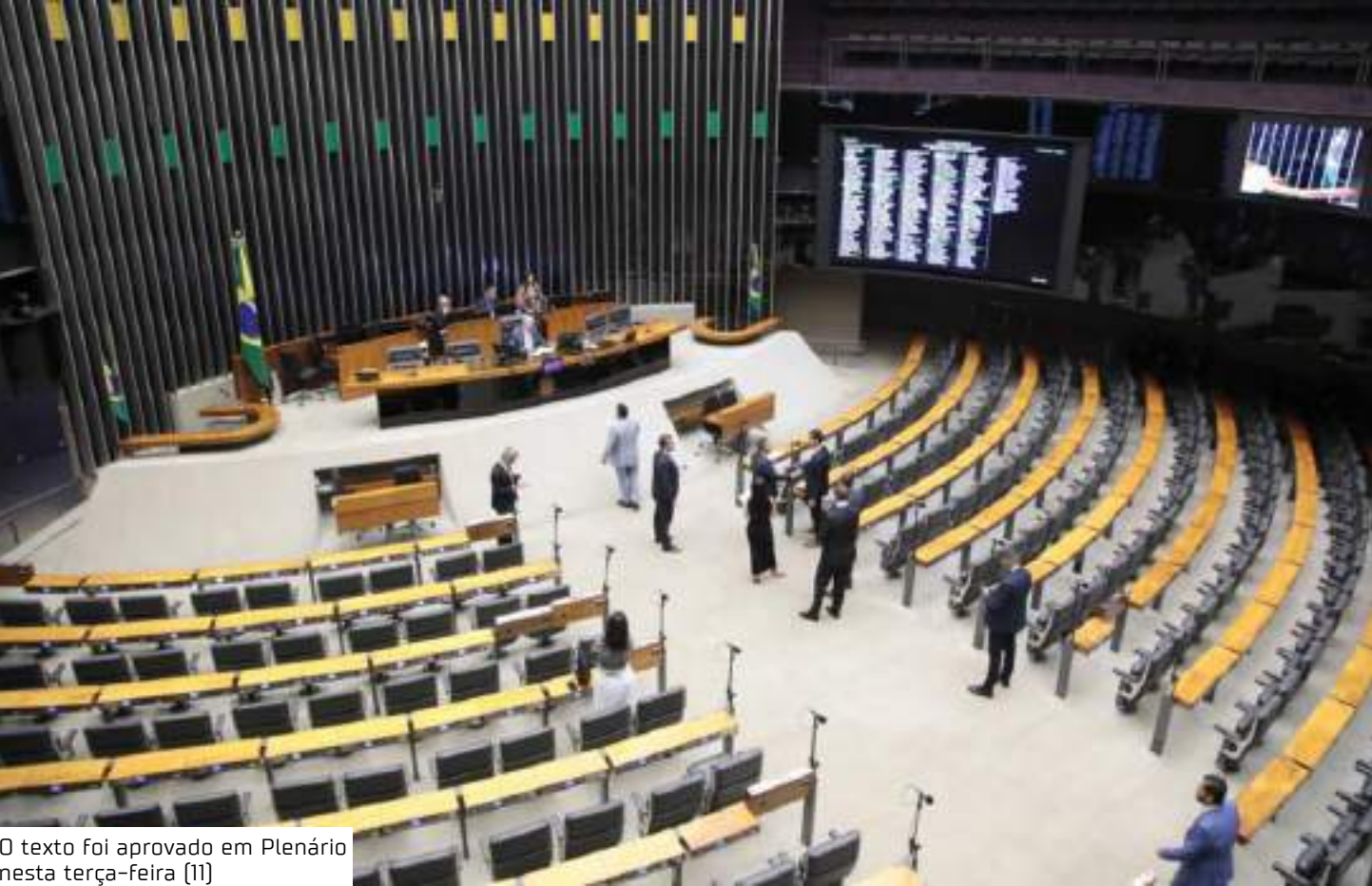
O texto foi aprovado em Plenário nesta terça-feira (11)

Para o deputado Chico Alencar (Psol-RJ), o mais