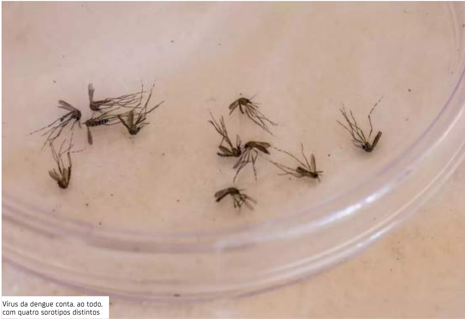
Vírus da dengue conta, ao todo, com quatro sorotipos distintos