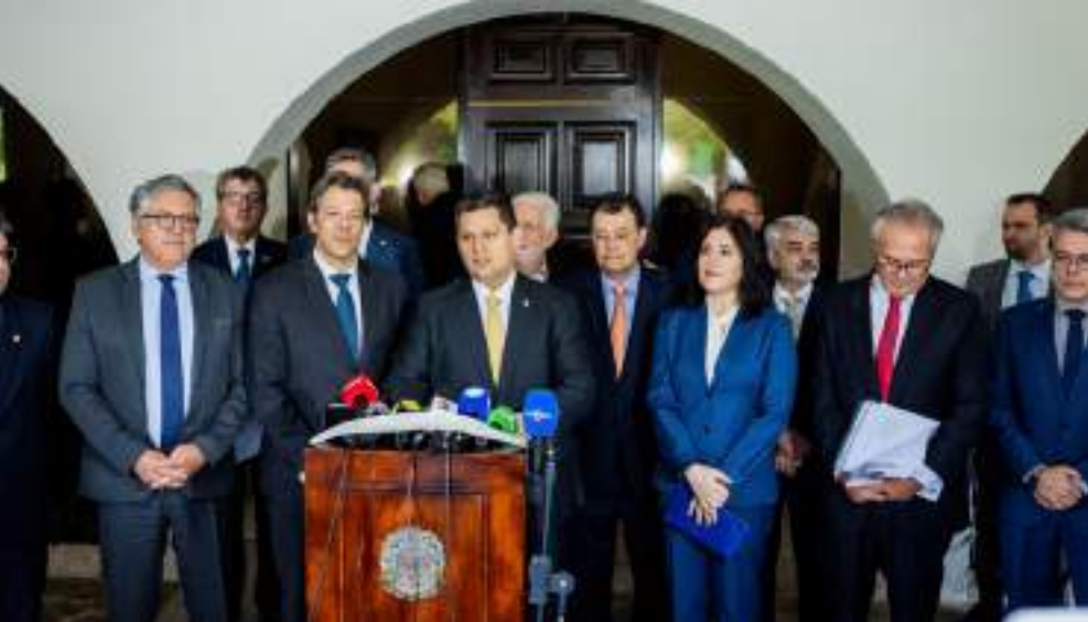
As duas casas [Senado e Câmara] estão unidas no propósito de ajudar o Brasil