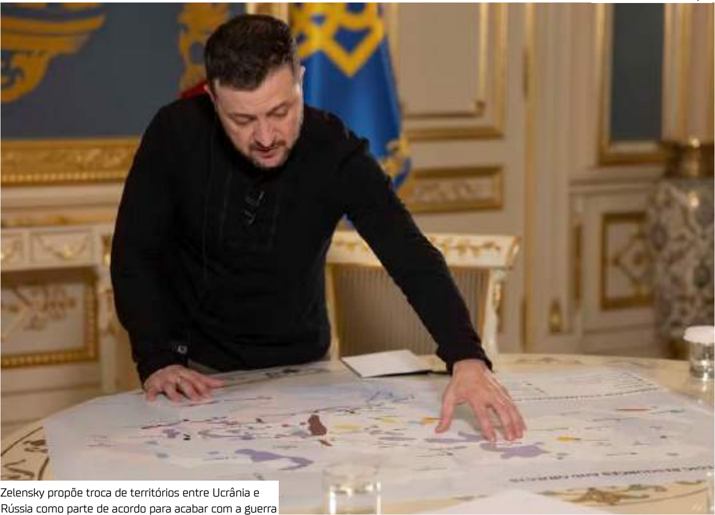
Zelensky propõe troca de territórios entre Ucrânia e Rússia como parte de acordo para acabar com a guerra

A incursão fez com que Putin readaptasse planos de guerra de forma emergencial.