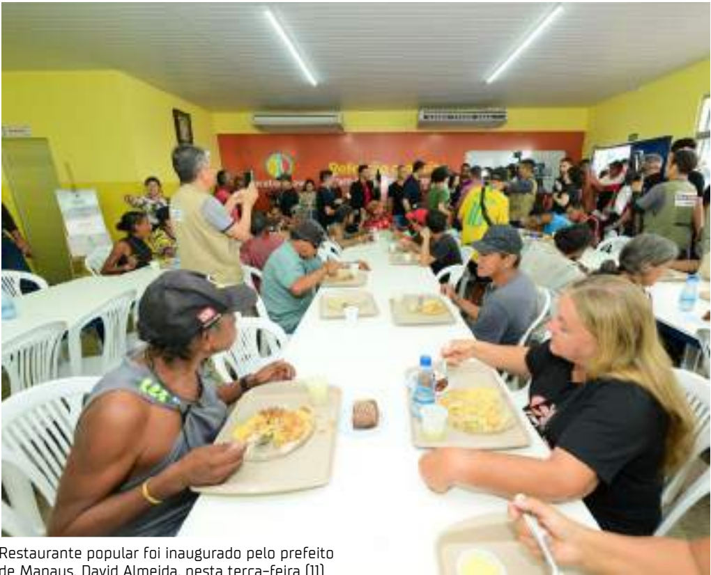
Restaurante popular foi inaugurado pelo prefeito de Manaus, David Almeida, nesta terça-feira (11)

O prefeito de Manaus, David Almeida, inaugurou nesta terça-feira (11), a 12ª unidade do programa "Prato do Povo", localizada na Feira da Panair, no bairro Educandos, Zona Sul de Manaus. A ação faz parte do programa "Manaus sem Fome", lançado em dezembro de 2023, e tem o objetivo de garantir alimentação saudável e acessível para a população.