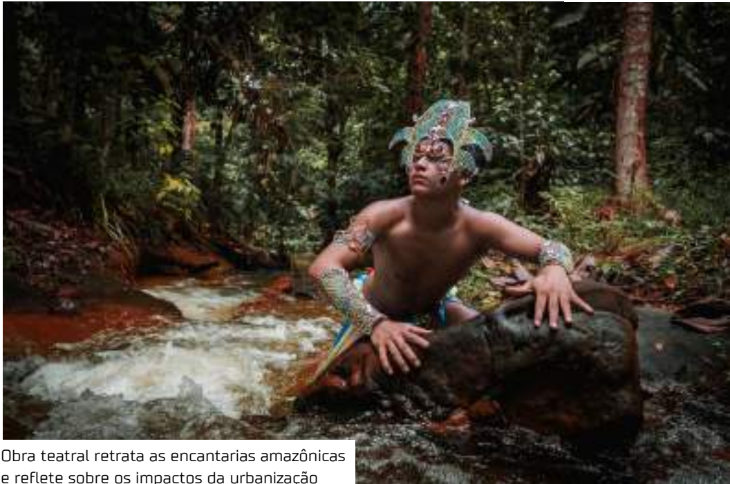
Obra teatral retrata as encantarias amazônicas e reflete sobre os impactos da urbanização

“O espetáculo bebe em fontes como o Folgado Cavalinho, a religião Tambor de Mina, a manifestação