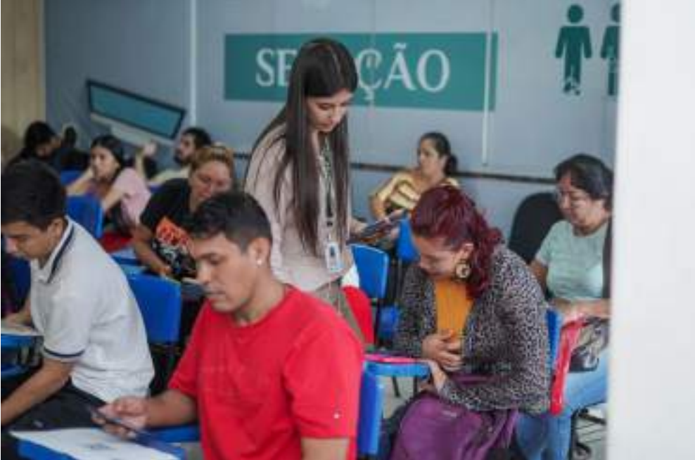
Deputado estadual Roberto Cidade (UB) discursa na Assembleia Legislativa do Amazonas (Aleam)

A Prefeitura de Manaus, por meio da Secretaria Municipal do Trabalho, Empreendedorismo e Inovação (Semtepi), deu início, nesta terça-feira, 11, a um processo seletivo de candidatos, em parceria com a rede de supermercados Rodrigues. A seleção acontece no posto do Sine Manaus, localizado na avenida Constantino Nery, no bairro São Geraldo, zona Sul.