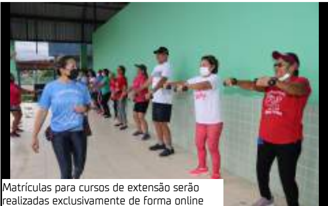
Matrículas para cursos de extensão serão realizadas exclusivamente de forma online