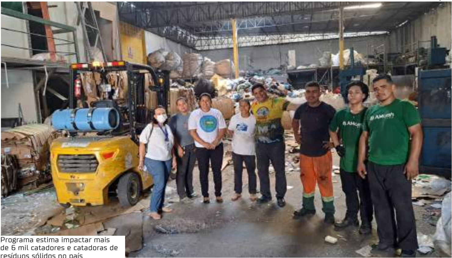
Programa estima impactar mais de 6 mil catadores e catadoras de resíduos sólidos no país

Além de desempenhar aspectos socioeconômicos, por meio da economia solidária, acesso a mais oportunidades de emprego e renda, o trabalho dos catadores e catadoras tem um papel fundamental para a mitigação das mudanças climáticas.