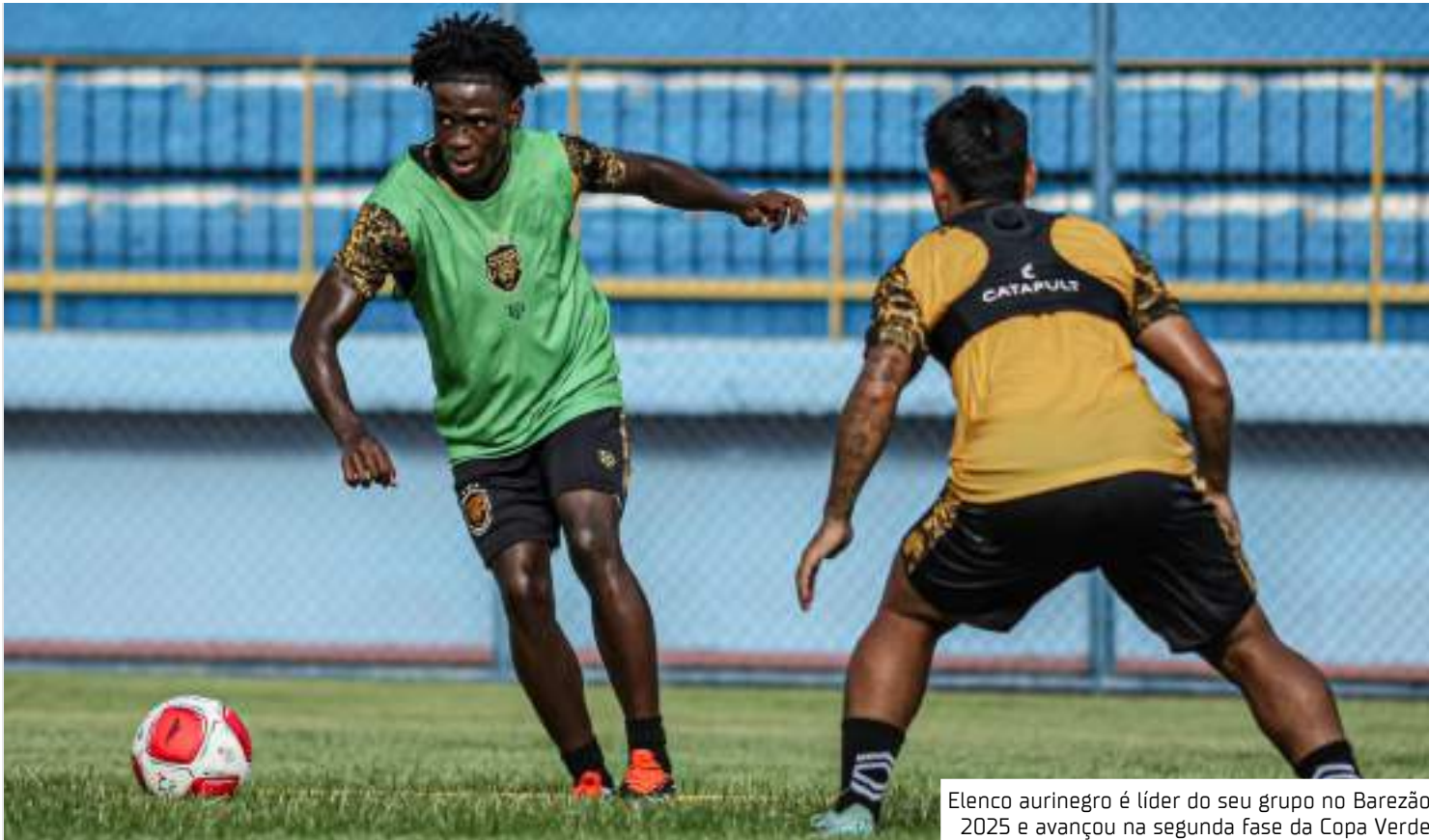
Elenco aurinegro é líder do seu grupo no Barezão 2025 e avançou na segunda fase da Copa Verde