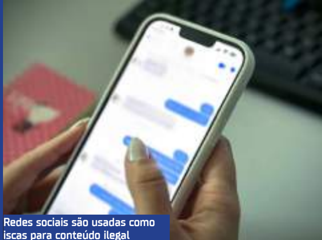
Redes sociais são usadas como iscas para conteúdo ilegal