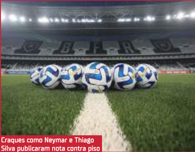
Craques como Neymar e Thiago Silva publicaram nota contra piso