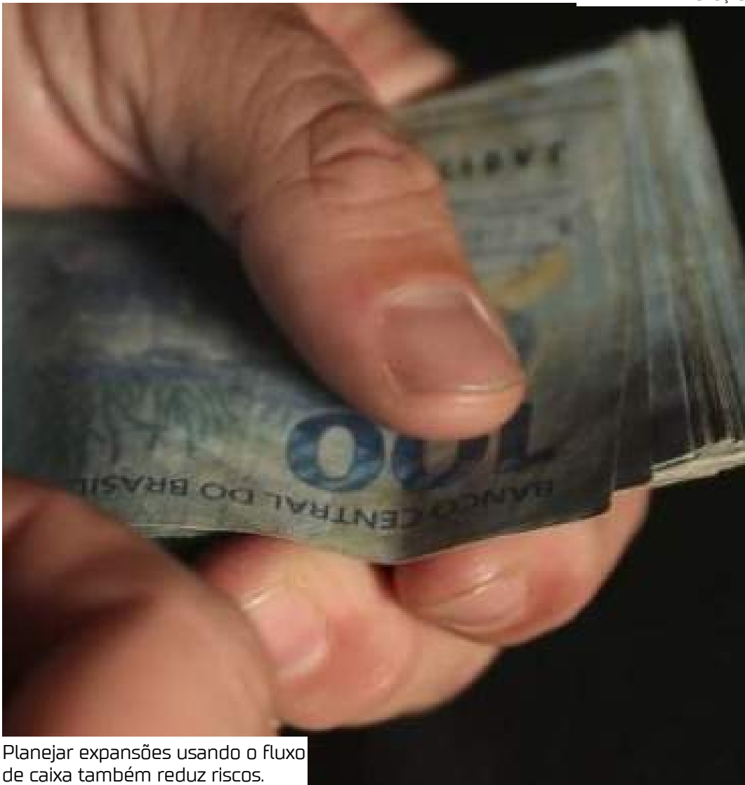
Planejar expansões usando o fluxo de caixa também reduz riscos.

"Ao perceber que determinados meses tinham mais procura por nossos produtos, passamos a investir mais em publicidade nesses períodos, e os resultados dobraram. Essa leitura do caixa foi essencial", relata.