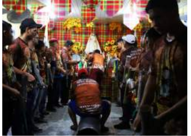
Narrativas valorizam cultura, folclore e histórias