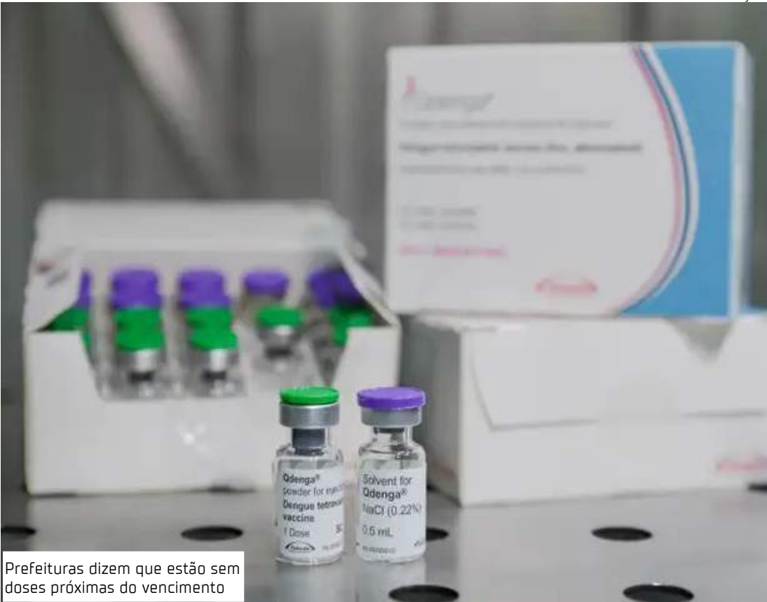
Prefeituras dizem que estão sem doses próximas do vencimento

Em Aracaju, no Sergipe, restam poucas vacinas. A cidade já aplicou 19.488