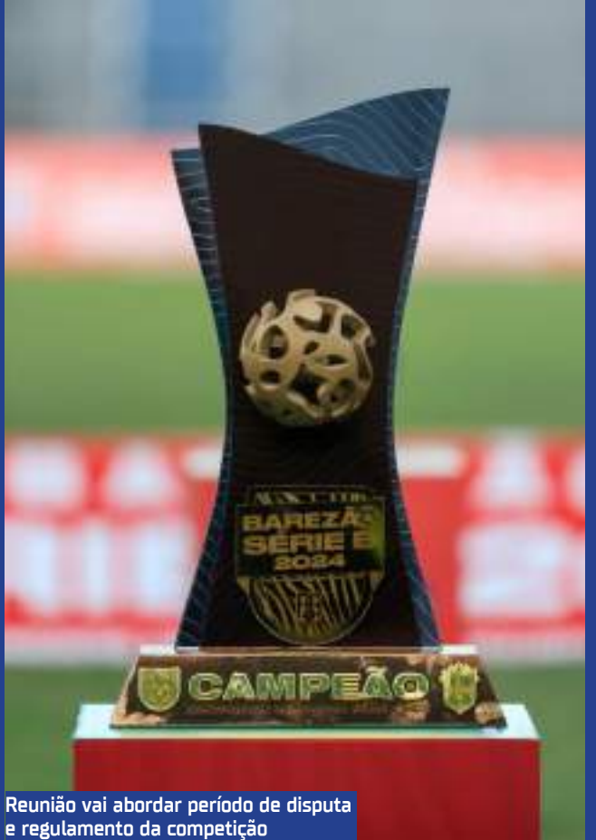
Reunião vai abordar período de disputa e regulamento da competição