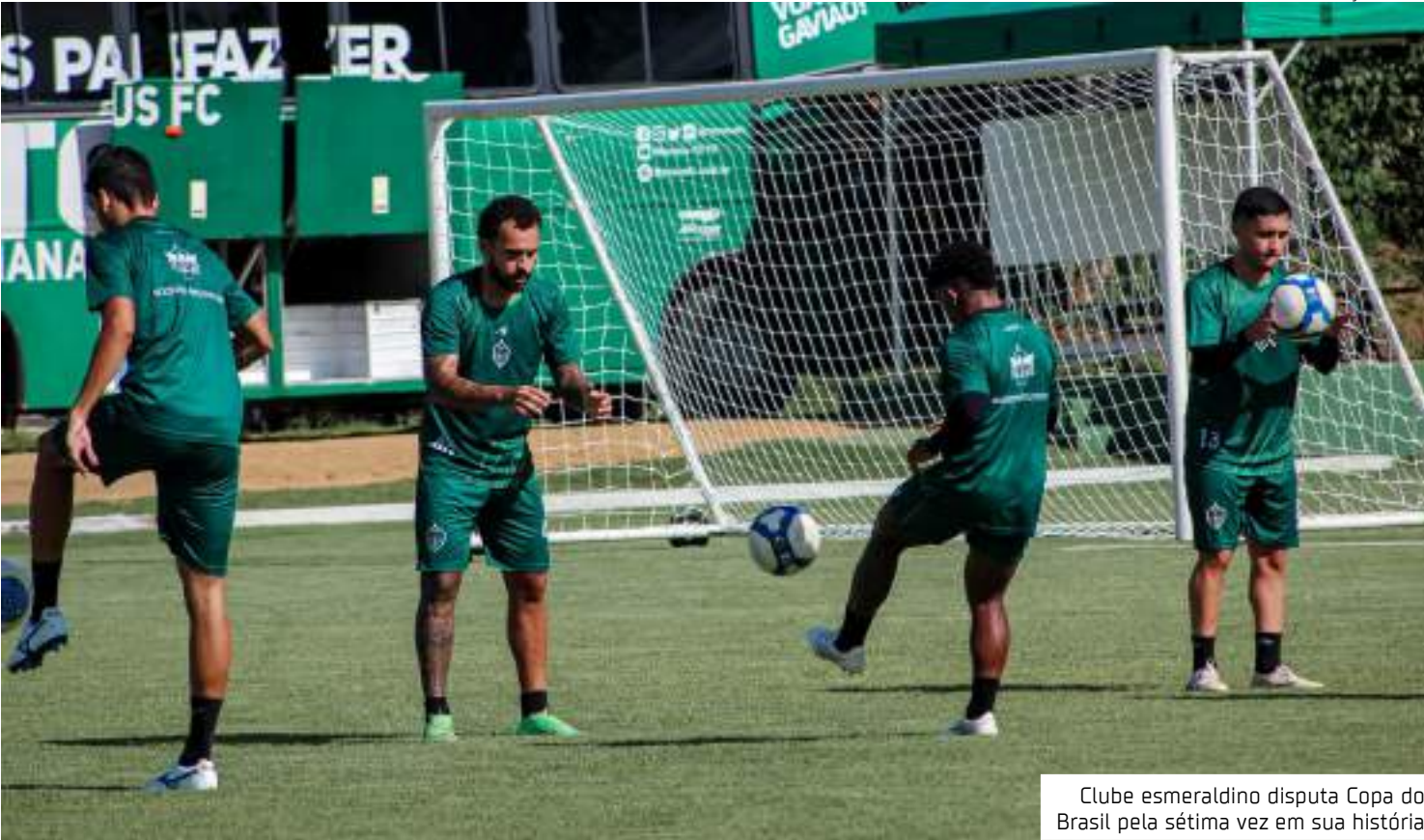
Clube esmeraldino disputa Copa do Brasil pela sétima vez em sua história

Manaus estreia no torneio enfrentando o Independência-AC