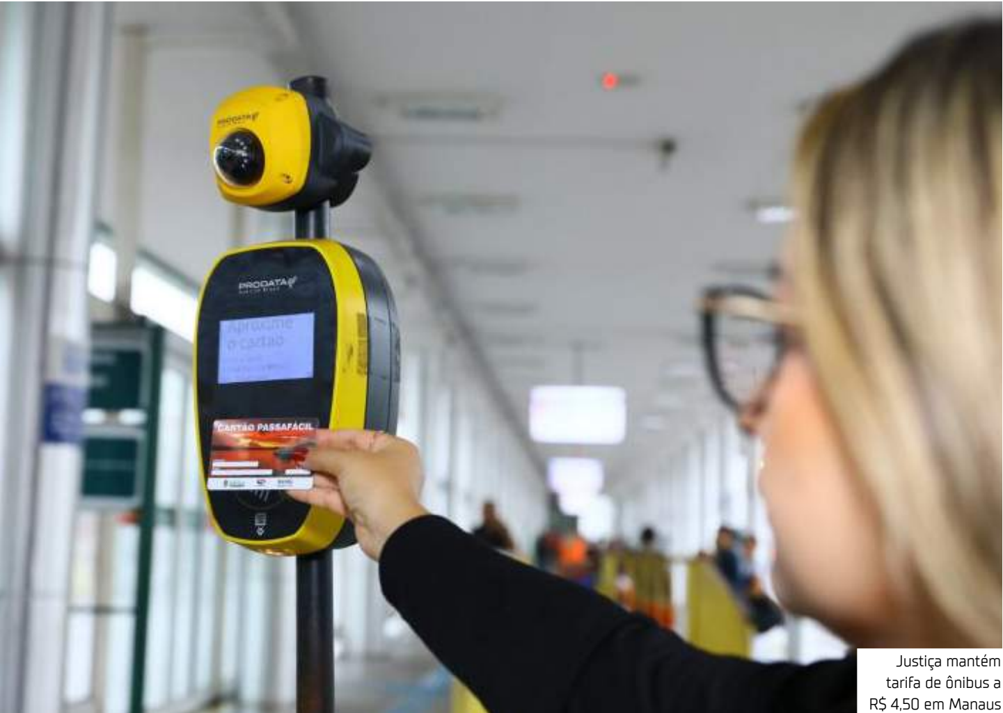
Justiça mantém tarifa de ônibus a R$ 4,50 em Manaus