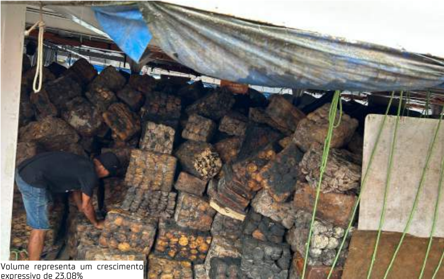
Volume representa um crescimento expressivo de 23,08%

A seca histórica que afetou o Amazonas entre 2023 e 2024 impactou direta-