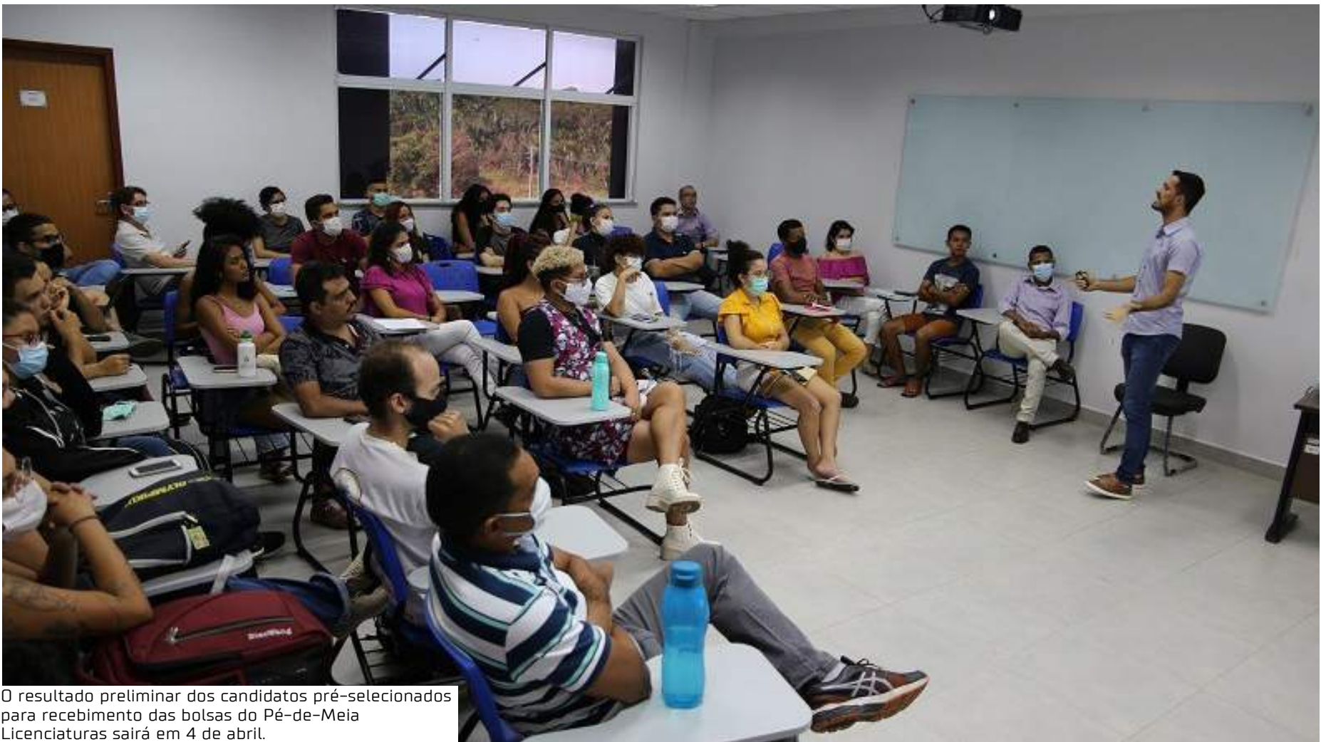
O resultado preliminar dos candidatos pré-selecionados para recebimento das bolsas do Pé-de-Meia Licenciaturas sairá em 4 de abril.

além de estar aprovado em um curso de licenciatura e cadastrado na Plataforma Freire, o candidato deve ter alcançado pelo menos 650 pontos no Exame Nacional do Ensino Médio (Enem) de 2024.