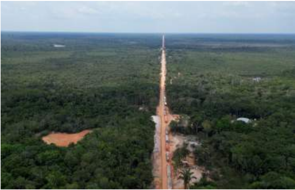
Senador do Amazonas ressaltou que a rodovia é essencial para o país

Em entrevista à emissora de TV, o político deu prazo até agosto e dezembro para que três pontes, ao longo da rodovia, estejam concluídas. Segundo ele, os estudos de impacto das obras já estão finalizados. O senador Eduardo Braga mostrou-se otimista de que até o mês de abril o governo federal autorize a abertura de licitação para asfaltar o trecho do meio da rodovia BR-319, que liga Manaus a Porto Velho. Em entrevista ao vivo para TV A Crítica diretamente de Brasília, nesta terça-feira (18/02), o político afirmou que as obras de reconstrução de três pontes nos trechos fluviais da rodovia – Curaçá, Autaz Mirim e Igapó-Açu – devem ser finalizadas em agosto e dezembro. “Nós esperamos que até abril seja liberada a licença para que a gente possa licitar em maio e até julho estarmos contratando