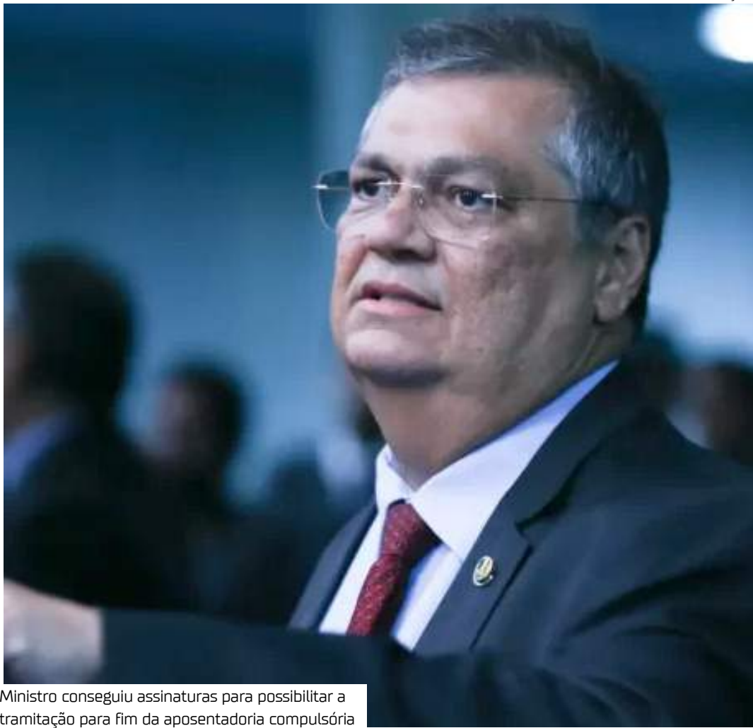
Ministro conseguiu assinaturas para possibilitar a tramitação para fim da aposentadoria compulsória

O texto veda também a transferência dos militares para a inatividade como sanção pelo cometimento de infração disciplinar, assim como a concessão de qualquer benefício por morte ficta ou presumida. No caso de faltas graves, prevê, como penalidade, demissão, licenciamento ou exclusão, ou equivalente, conforme o respectivo regime jurídico.