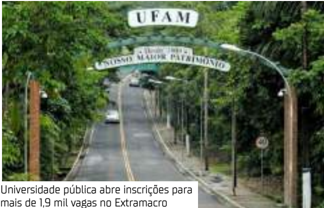
Universidade pública abre inscrições para mais de 1,9 mil vagas no Extramacro