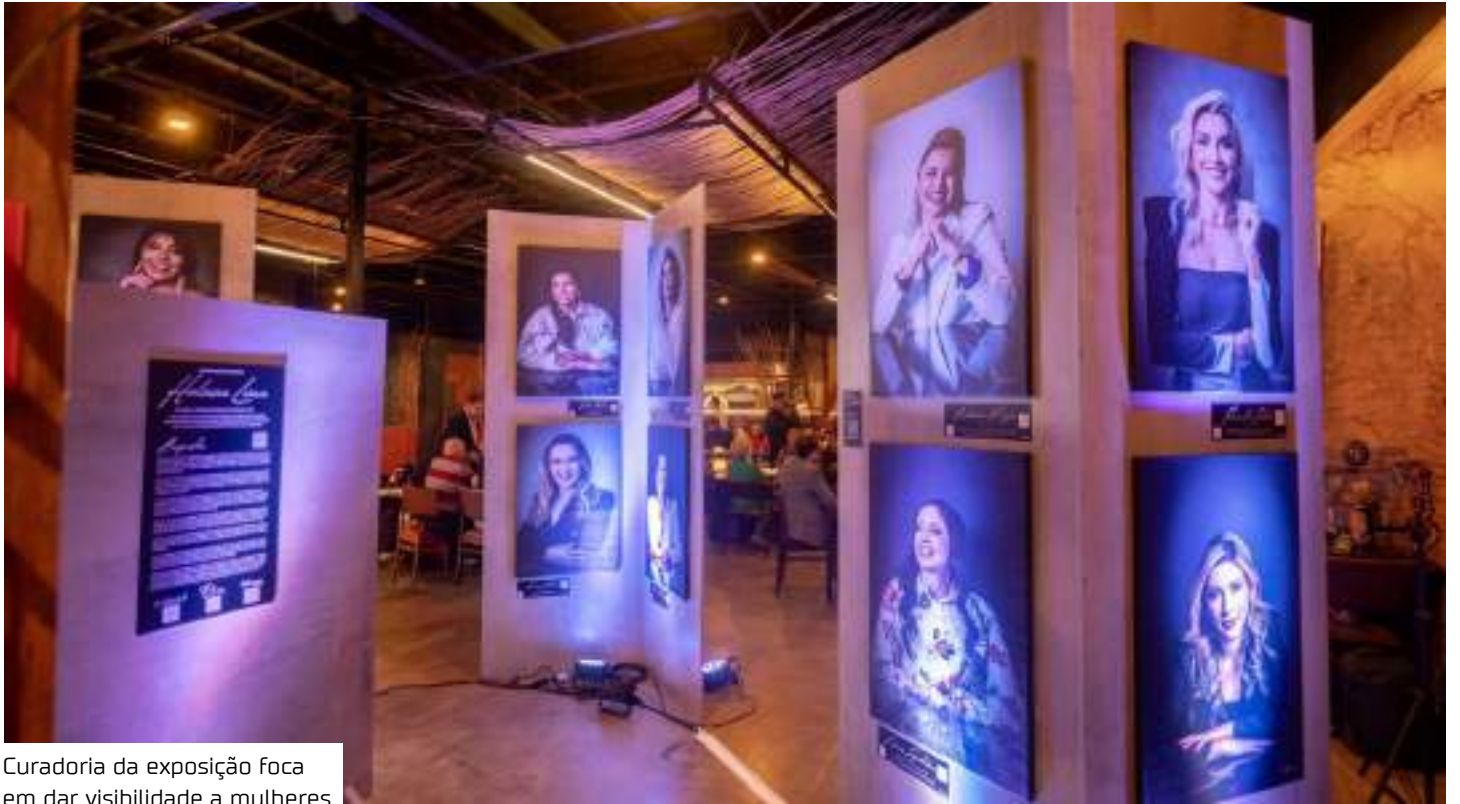
Curadoria da exposição foca em dar visibilidade a mulheres

O fotógrafo Wesley Andrade, conhecido por seu olhar sensível e único, assina esta exposição com a proposta de revelar, através da fotografia, as forças que moldam a sociedade amazonense. “A ideia é mostrar que cada mulher tem uma história poderosa e merece