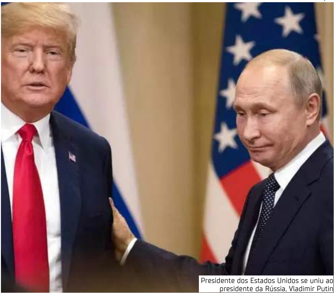
Presidente dos Estados Unidos se uniu ao presidente da Rússia, Vladimir Putin

"A realidade prática é que haverá alguma discussão sobre o território e sobre as garantias de segurança", declarou ele.