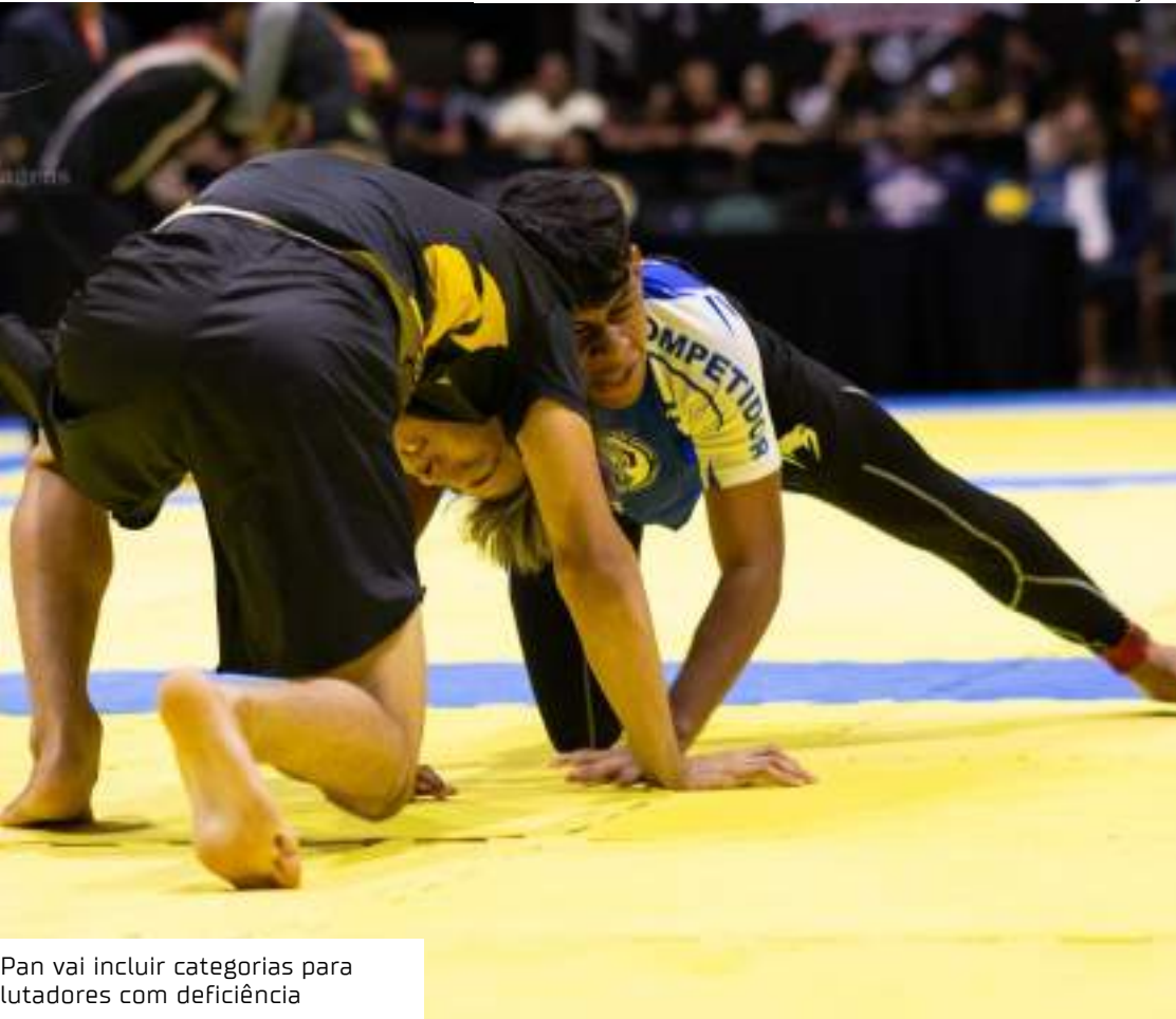
Pan vai incluir categorias para lutadores com deficiência

Mais um evento grandioso está marcado para a capital das artes marciais do Brasil, com previsão de reunir mais de 1.000 atletas nos tatames. É o Campeonato Pan-Americano de Luta Livre Profissional 2025, que acontece no dia 9 de março, a partir das 9h, no ginásio da Assembleia Legislativa do Amazonas (ALEAM). A organização é da Federação Internacional de Luta Livre Esportiva Profissional e Grappling (FillePro), em parceria com a Federação Amazonense de Luta Livre Esportiva e Submission (Fasub), que está realizando as inscrições de forma online por meio do site www.soucompetidor.com.br . O primeiro lote encerra nesta quarta-feira (19/02), com os seguintes valores promocionais: R$ 60 (atletas até 15 anos), R$ 90 (a partir de 16 anos) e R$150 (categoria + absoluto). O segundo lote de inscrições terá um pequeno acréscimo no valor e no prazo de confir-