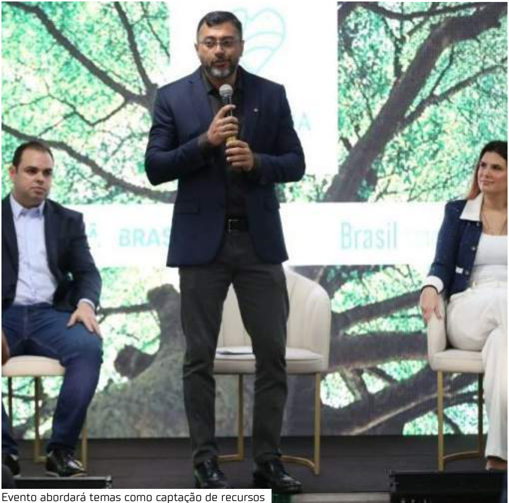
Evento abordará temas como captação de recursos